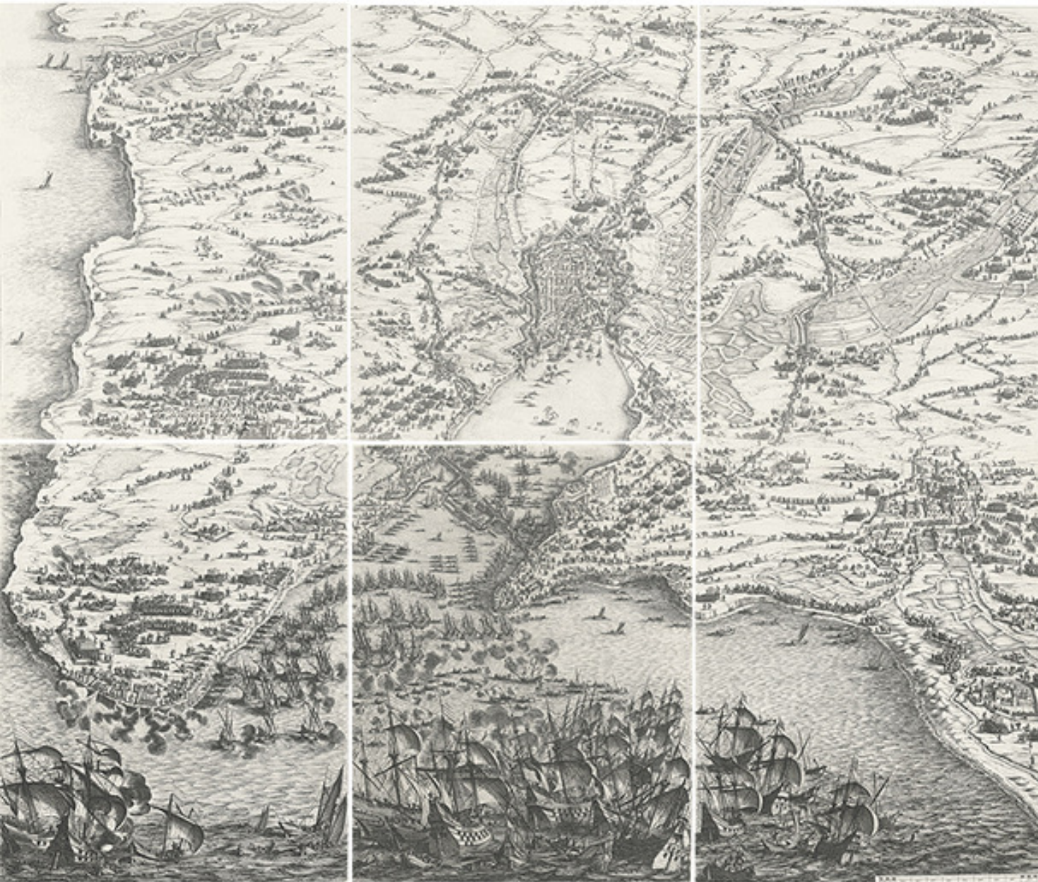
Jacques Callot (Nancy, 1592 – Nancy, 1635), Le Siège de La Rochelle , vers 1628, eau-forte.