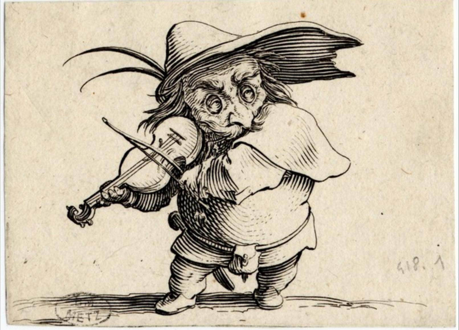
Jacques Callot (Nancy, 1592 – Nancy, 1635), Les Gobbi : Le Jouer de violon , 1616, eau-forte.