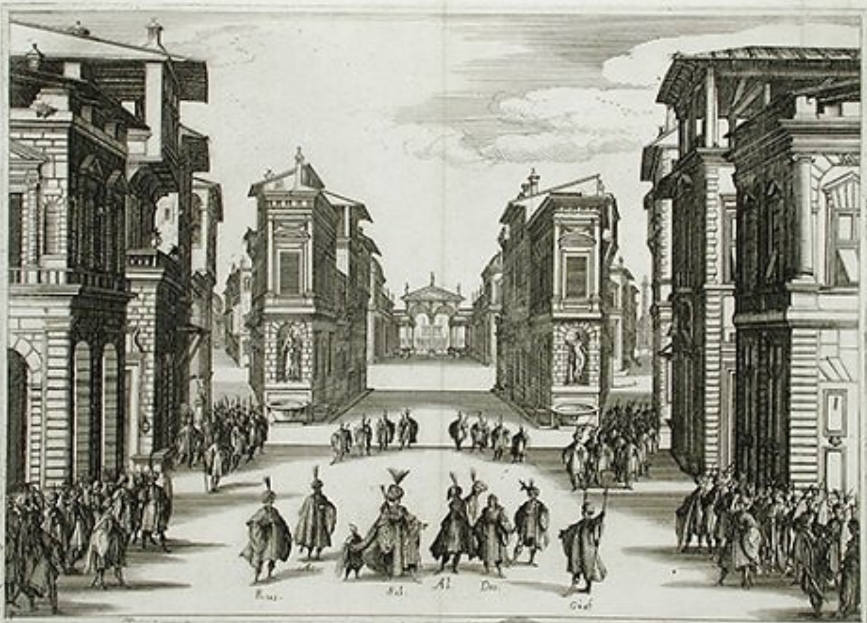
Jacques Callot (Nancy, 1592 – Nancy, 1635), Il Solimano, acte IV , 1619/20, eau-forte.