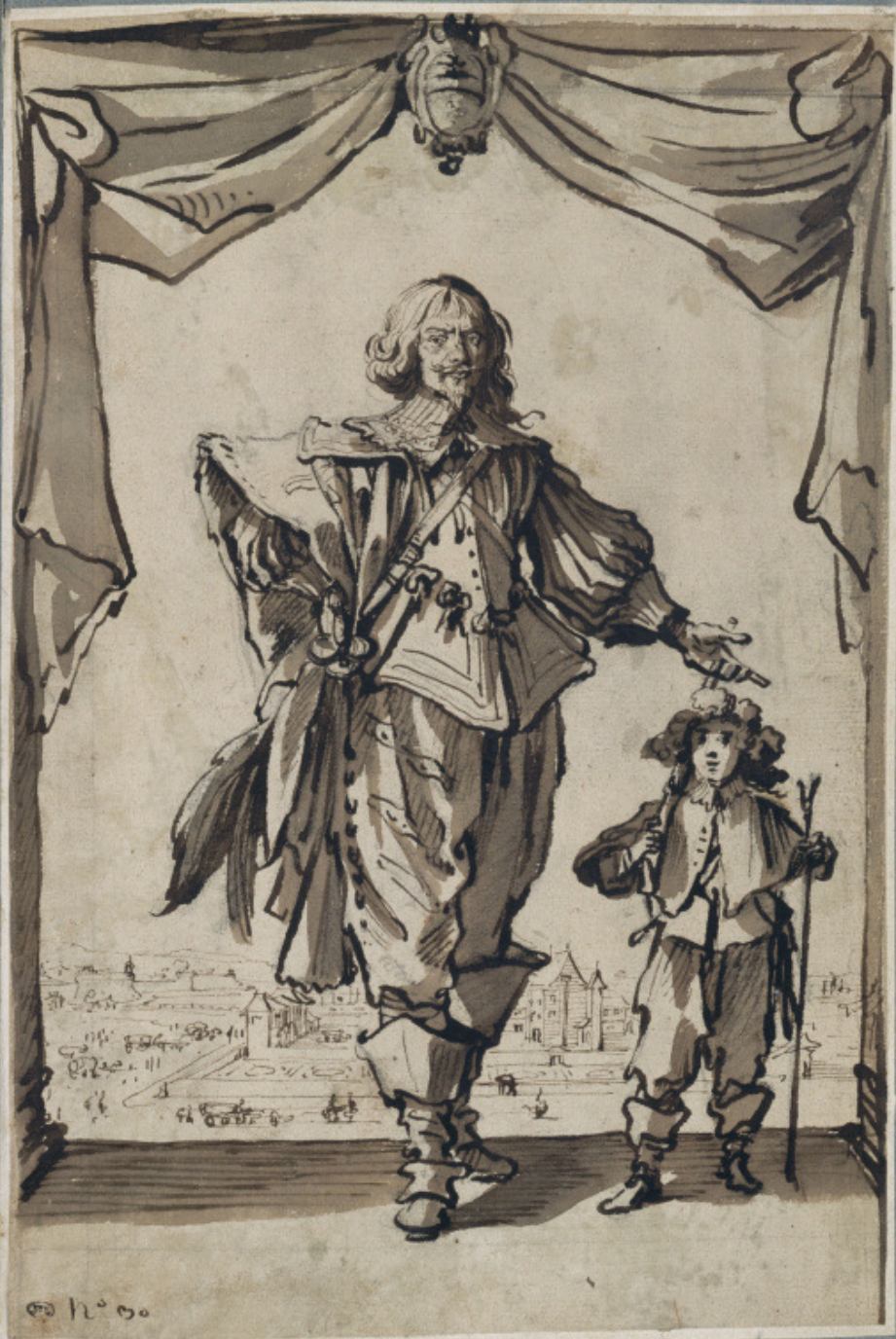
Jacques Callot (Nancy, 1592 – Nancy, 1635), Portrait de Claude Deruet et de son fils Henri , vers 1622/23, encre sur papier, Paris, musée du Louvre.