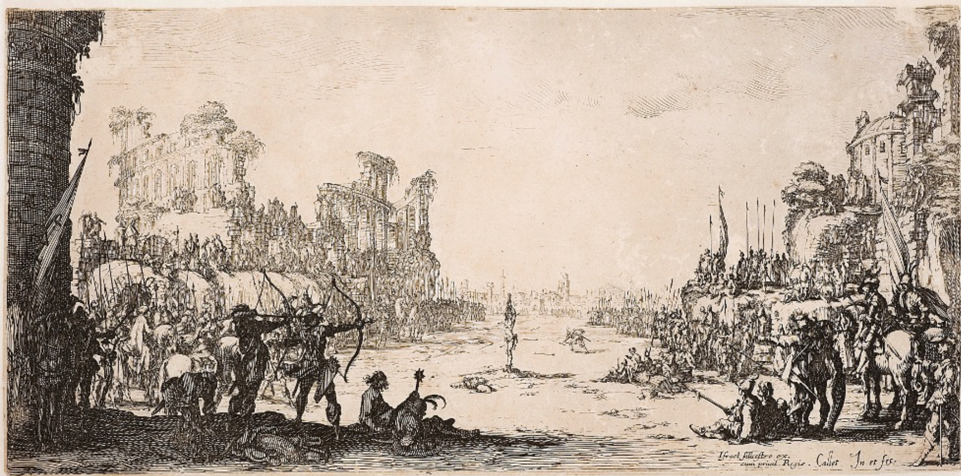
Jacques Callot (Nancy, 1592 – Nancy, 1635), La Martyre de saint Sébastien , vers 1631, eau-forte.