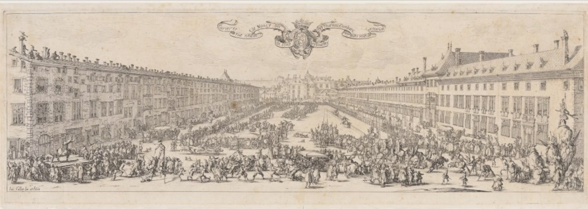
Jacques Callot (Nancy, 1592 – Nancy, 1635), Nancy : la Carrière , vers 1630, eau-forte.