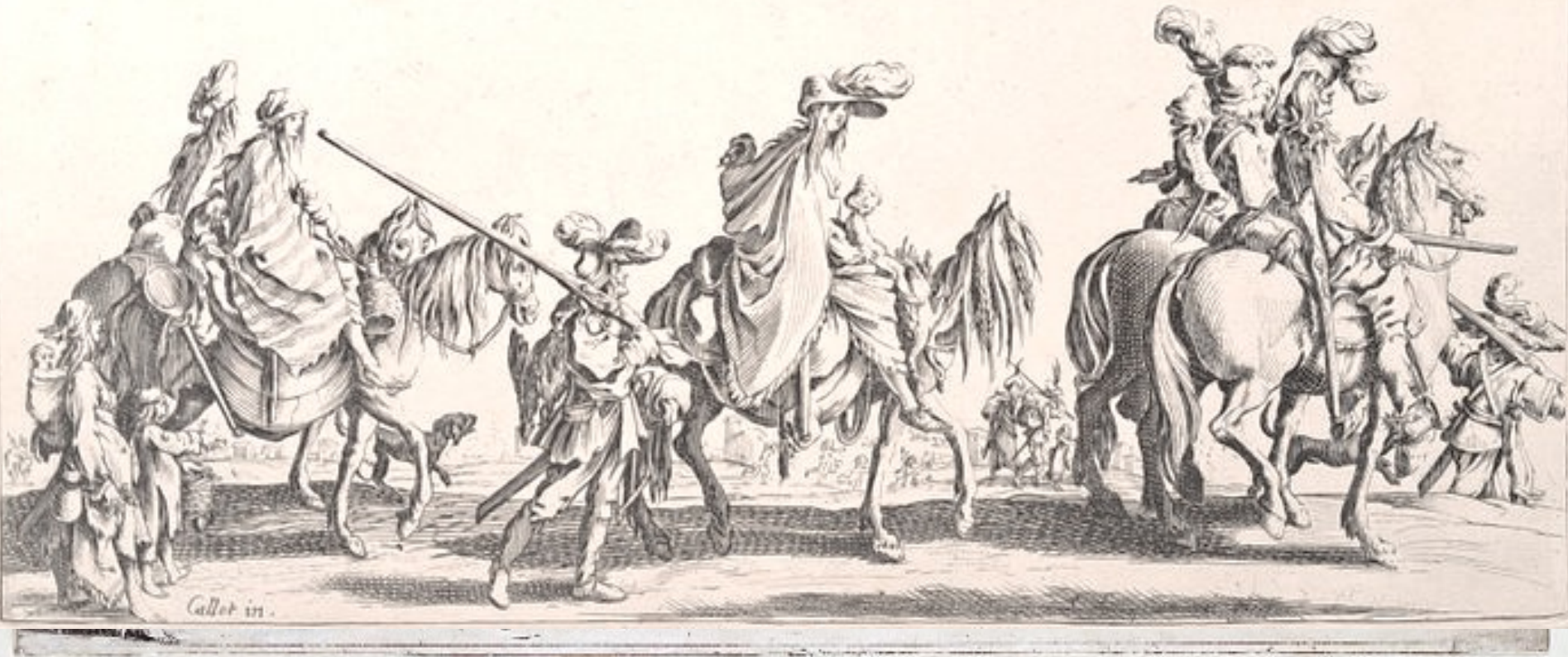
Jacques Callot (Nancy, 1592 – Nancy, 1635), Les Bohémiens en marche : l'avant-garde , vers 1625, eau-forte.

Ne uoila pas de braues messagers Qui, vont errant par pays estrangers