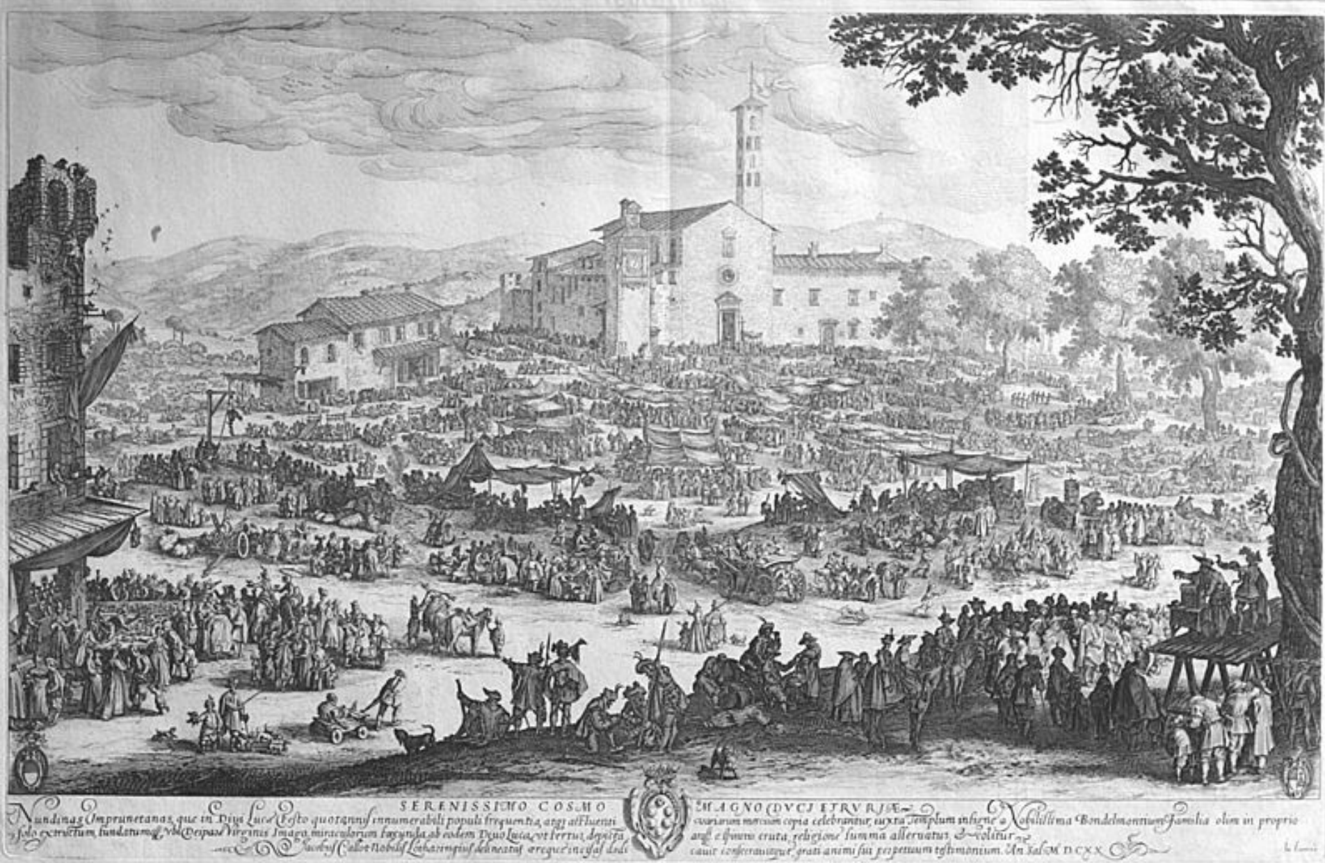
Jacques Callot (Nancy, 1592 – Nancy, 1635), La Foire d'Impruneta , 1620, eau-forte.