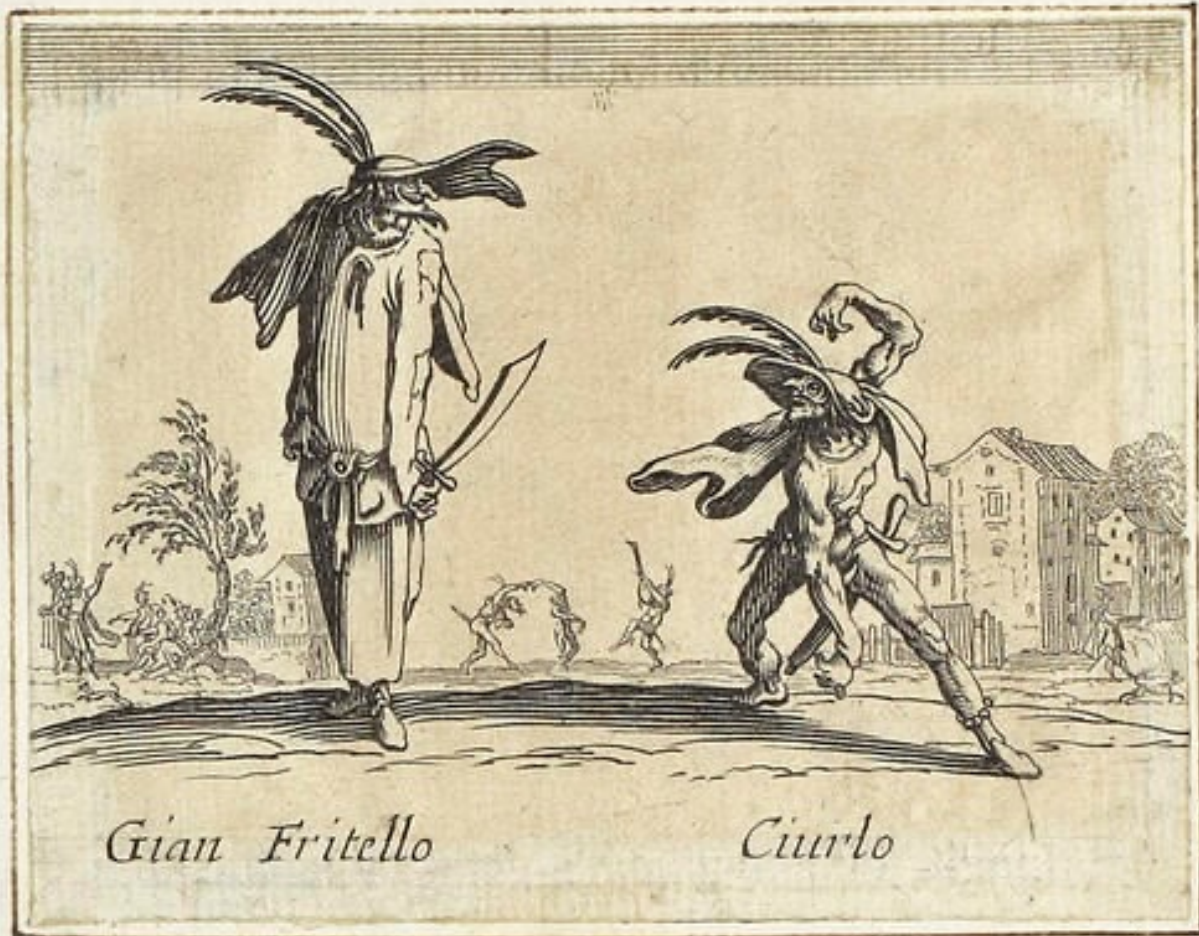
Jacques Callot (Nancy, 1592 – Nancy, 1635), Les Danseurs-acrobates : Gian Fritello et Ciurlo , vers 1622, eau-forte.