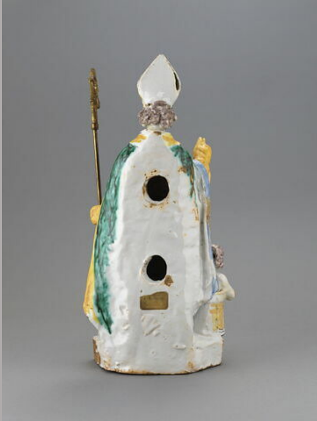
Nevers, XVIIe siècle, Statuette : Saint Nicolas, vers 1700, faïence à décor de grand feu polychrome, Paris, musée du Louvre.