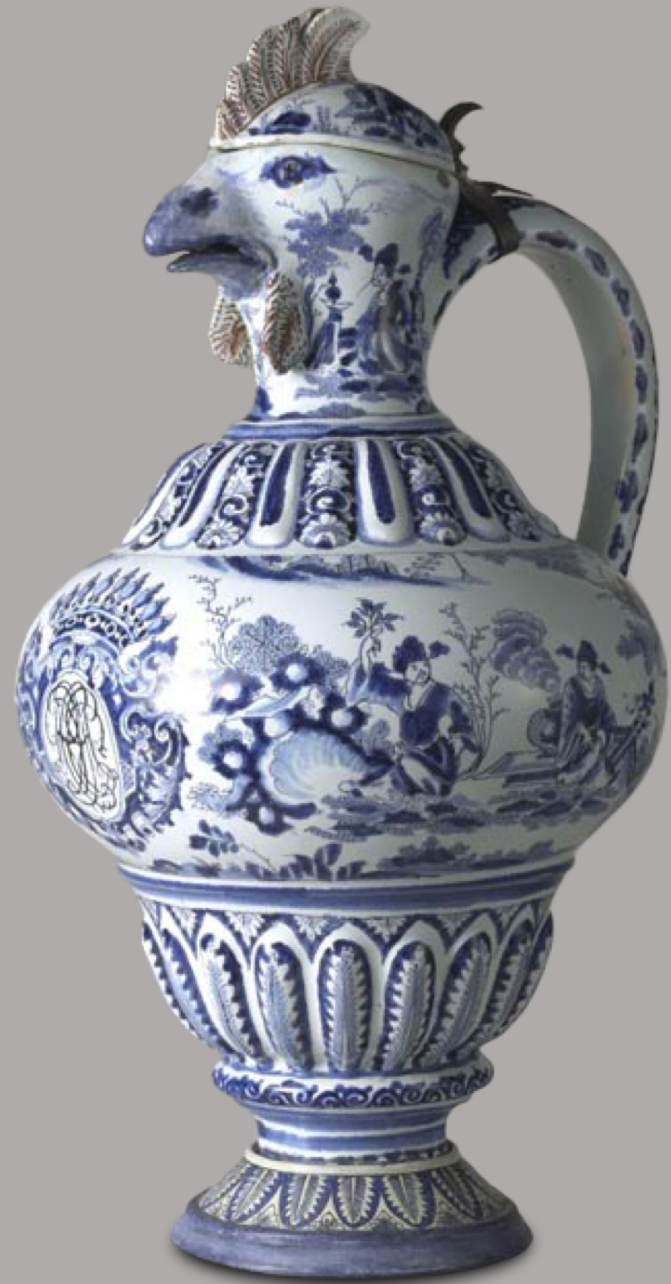
Rouen, XVIIIe siècle, Aiguière à tête de coq , vers 1730/40, faïence à décor de grand feu, Sèvres, musée national de Céramique.