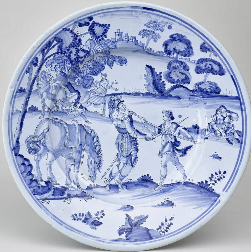
Nevers, XVIIe siècle, Plat : Combat de Filandre et du Maure , vers 1665, faïence à décor de grand feu, Paris, musée du Louvre.