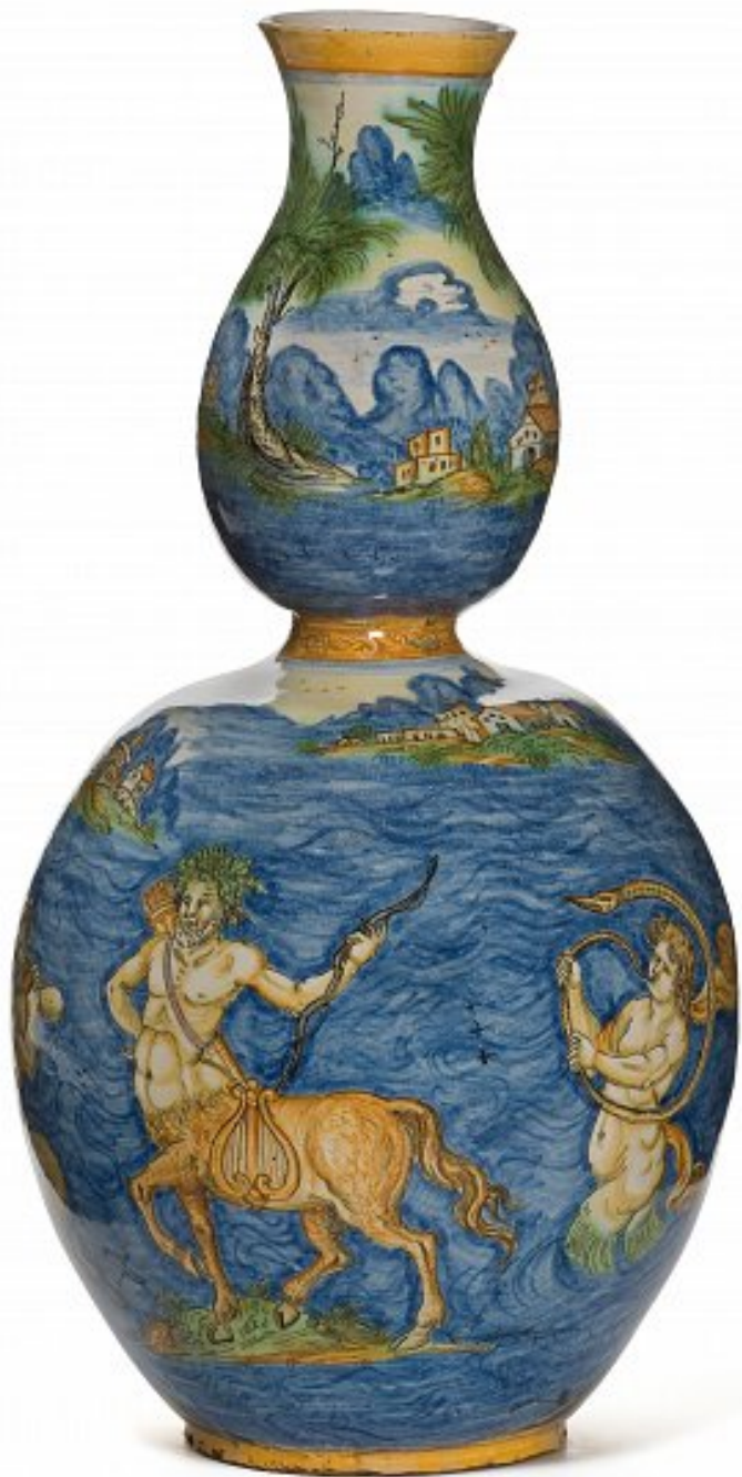
Nevers, XVIIe siècle, Vase calebasse , vers 1630/50, faïence à décor de grand feu polychrome, Paris, musée des Arts décoratifs.