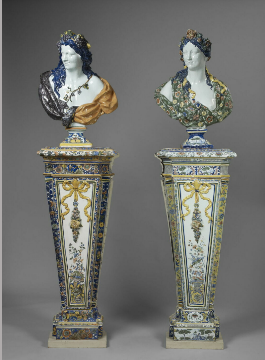
Rouen (Nicolas Fouquay ?), XVIII e siècle, Buste: Flore ou Le Printemps , vers 1730, faïence à décor de grand feu polychrome, Paris, musée du Louvre.