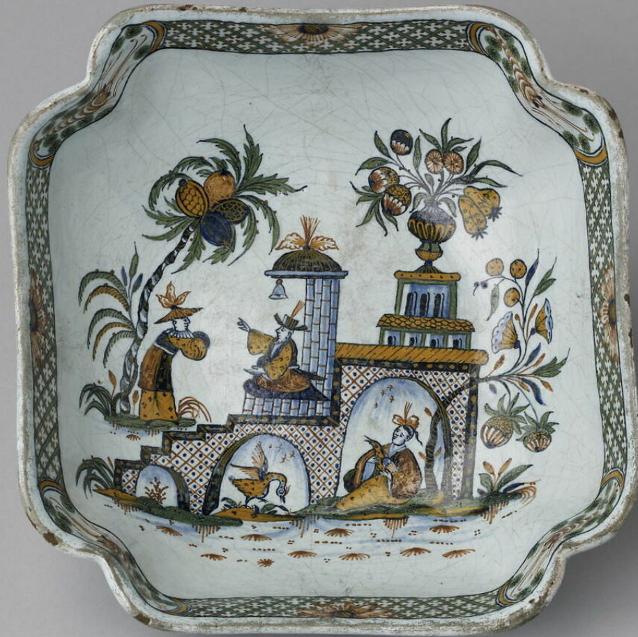
Rouen, XVIIIe siècle, Compotier : Personnages chinois , vers 1735, faïence à décor de grand feu polychrome, Paris, musée du Louvre.