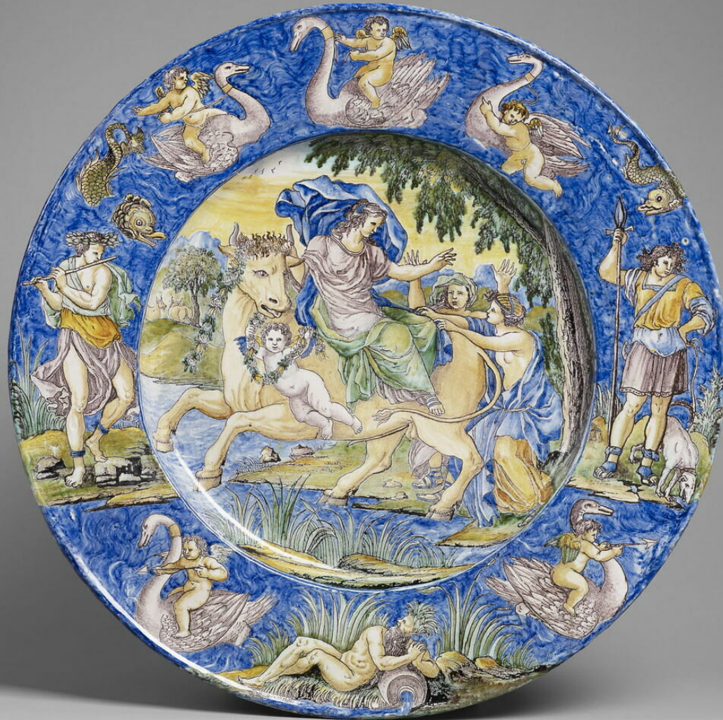
Nevers, XVIIe siècle, Plat : Enlèvement d'Europe , vers 1675/90, faïence à décor de grand feu polychrome, Paris, musée du Louvre.