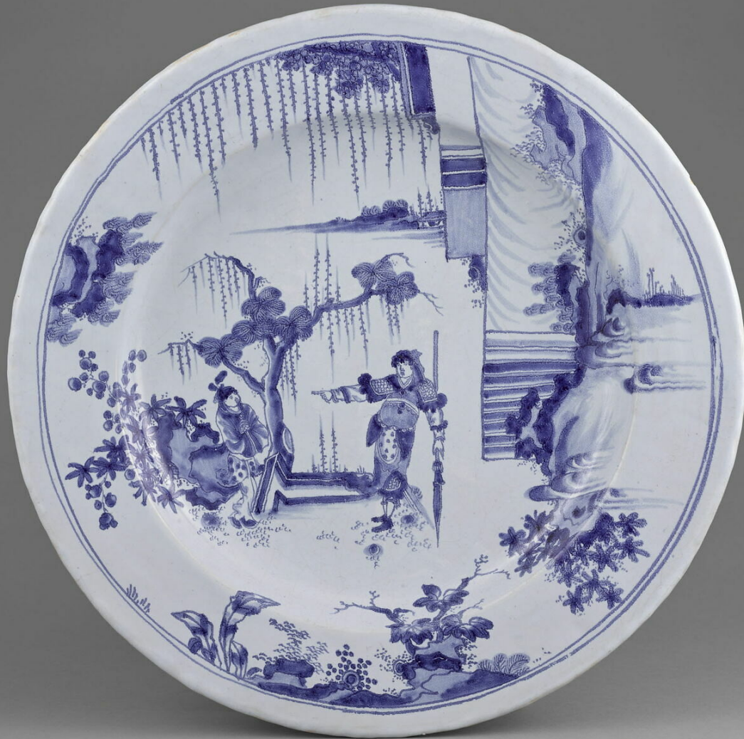
Nevers, XVIIe siècle, Plat : Lettrés chinois , vers 1660/80, faïence à décor de grand feu, Paris, musée du Louvre.