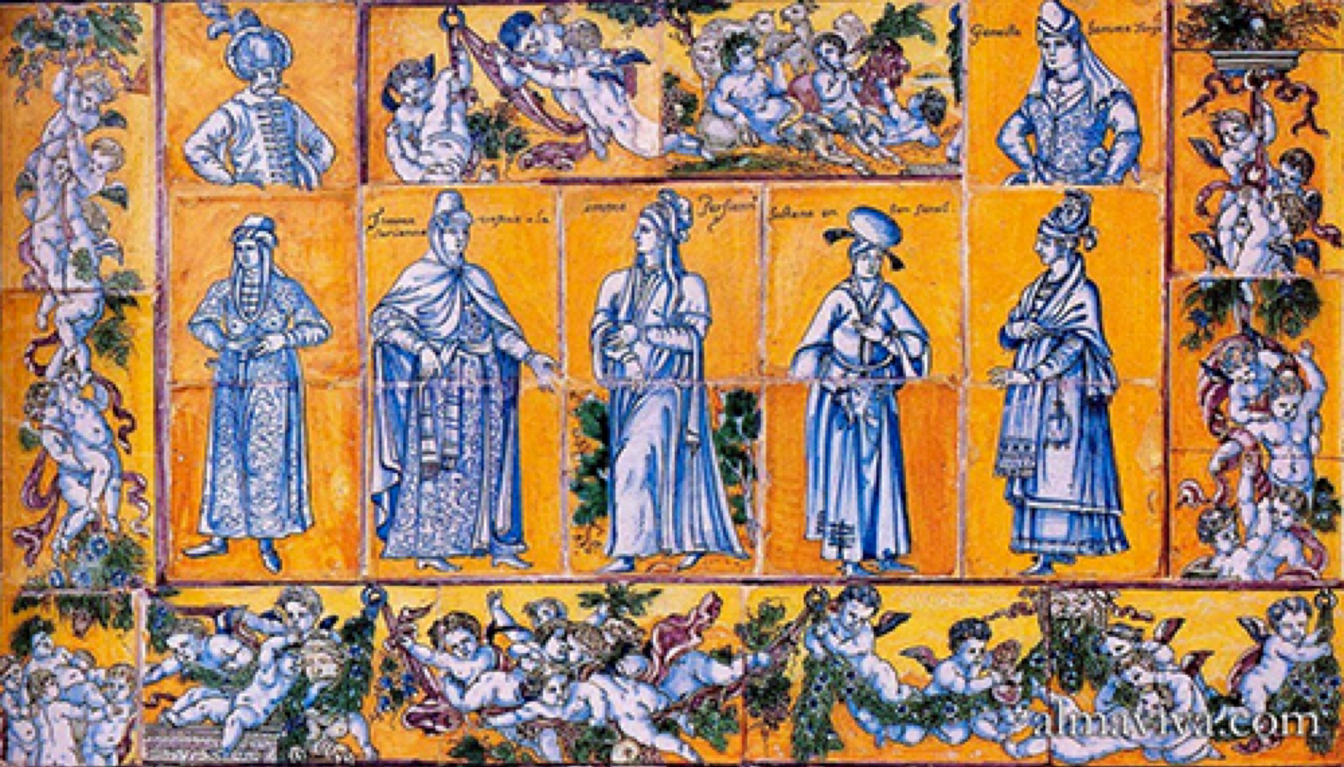
Nevers, XVIIe siècle, Carreaux : Personnages orientaux , vers 1640, faïence à décor de grand feu polychrome, Nevers, musée Blandin.