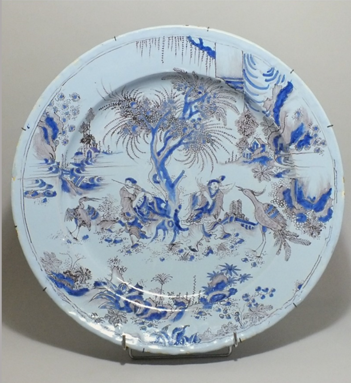
Nevers, XVIIe siècle, Plat : Chinois dans un paysage , vers 1680, faïence à décor de grand feu, Paris, musée du Louvre.