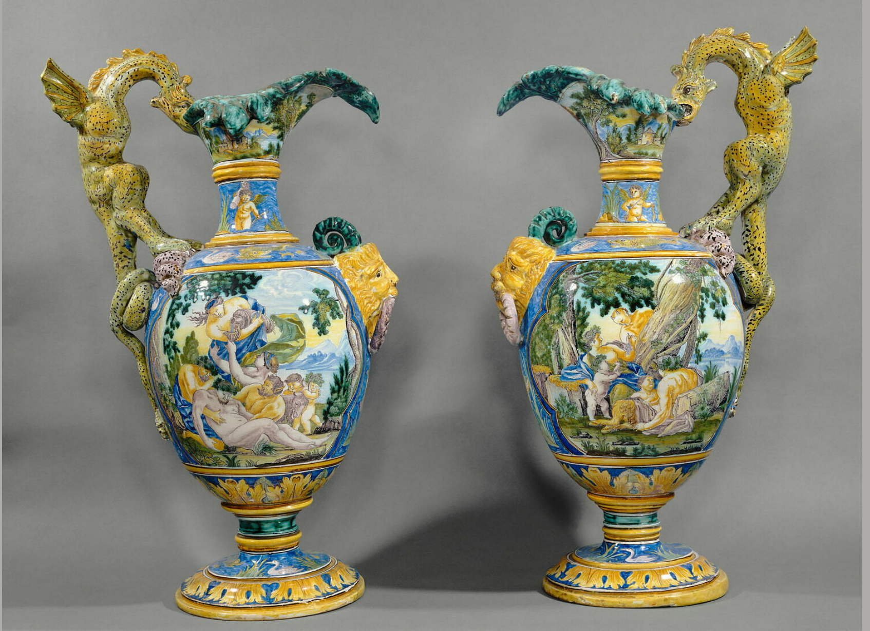
Nevers, XVIIe siècle, Deux aiguières , vers 1685, faïence à décor de grand feu polychrome, Paris, musée du Louvre.