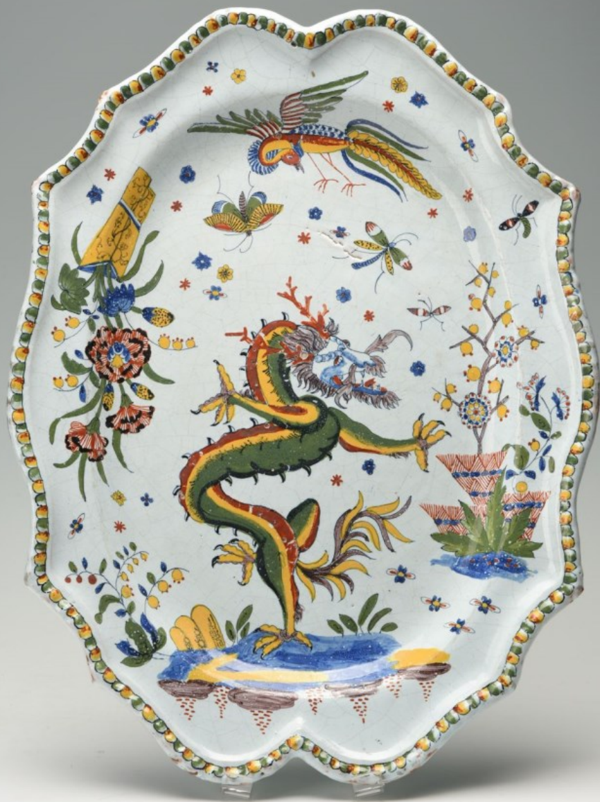
Rouen, XVIII e siècle, Plat : Décor au dragon, vers 1780, faïence à décor de grand feu polychrome, Reims, musée des Beaux-Arts.