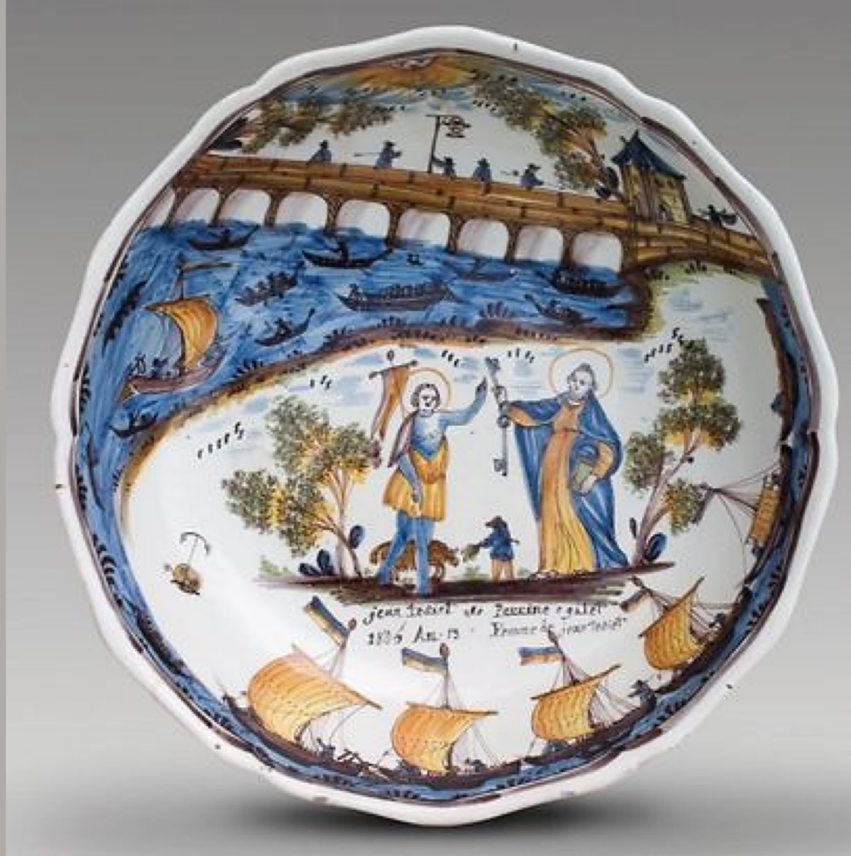
Nevers, XIXe siècle, Jatte : Pont sur la Loire , 1805, faïence à décor de grand feu polychrome, collection particulière.