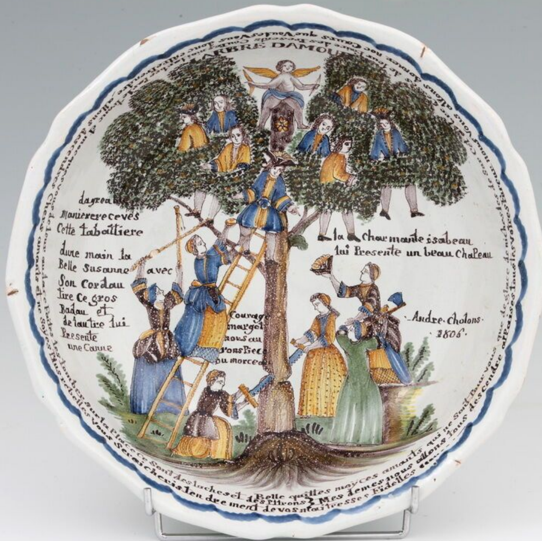
Nevers, XIXe siècle, Jatte : Arbre d'Amour , vers 1800, faïence à décor de grand feu polychrome, collection particulière.