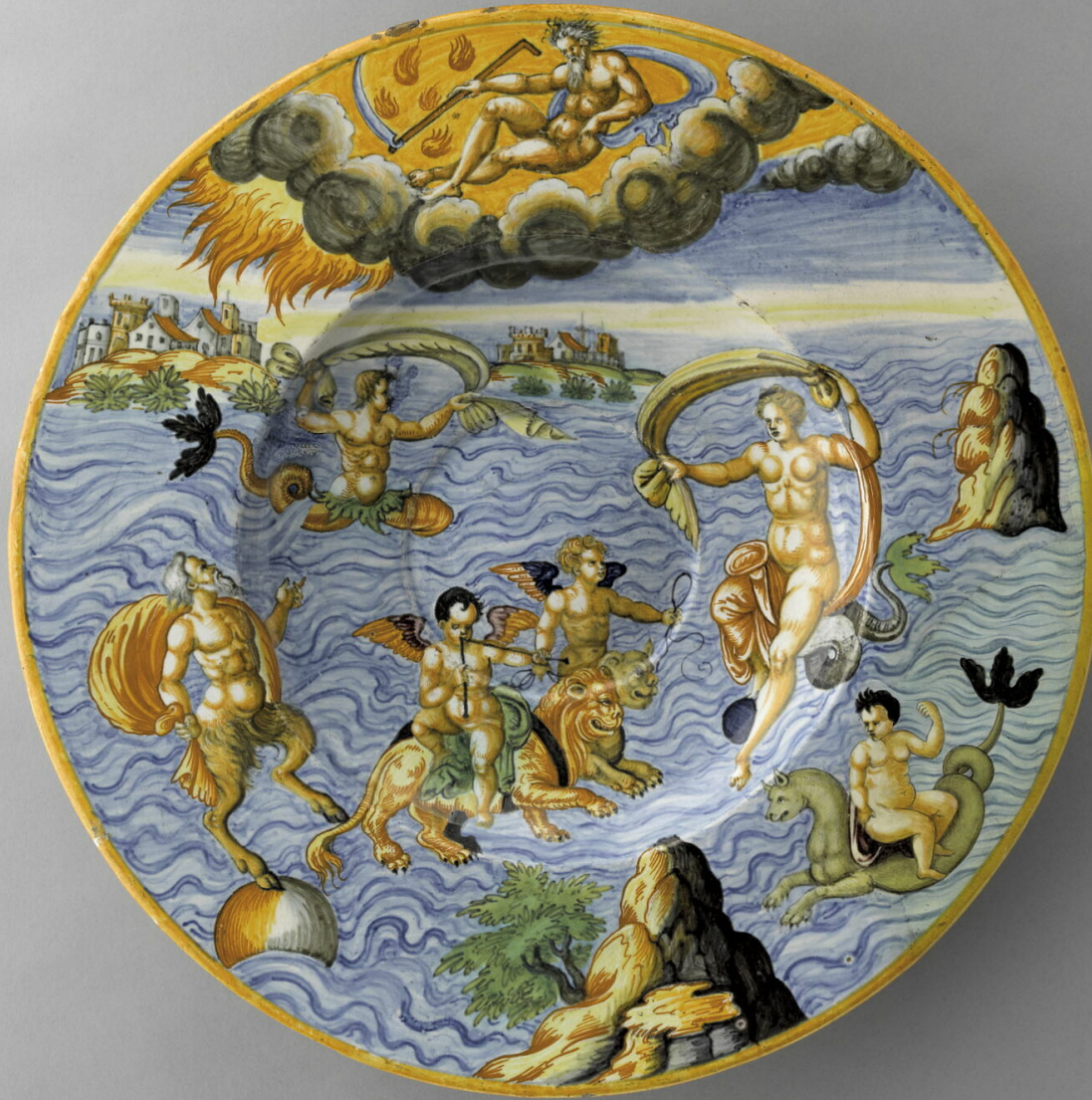
Nevers (Jules Gambin ?), XVIIe siècle, Plat : Triomphe de Galatée , vers 1640, faïence à décor de grand feu polychrome, Paris, musée du Louvre.