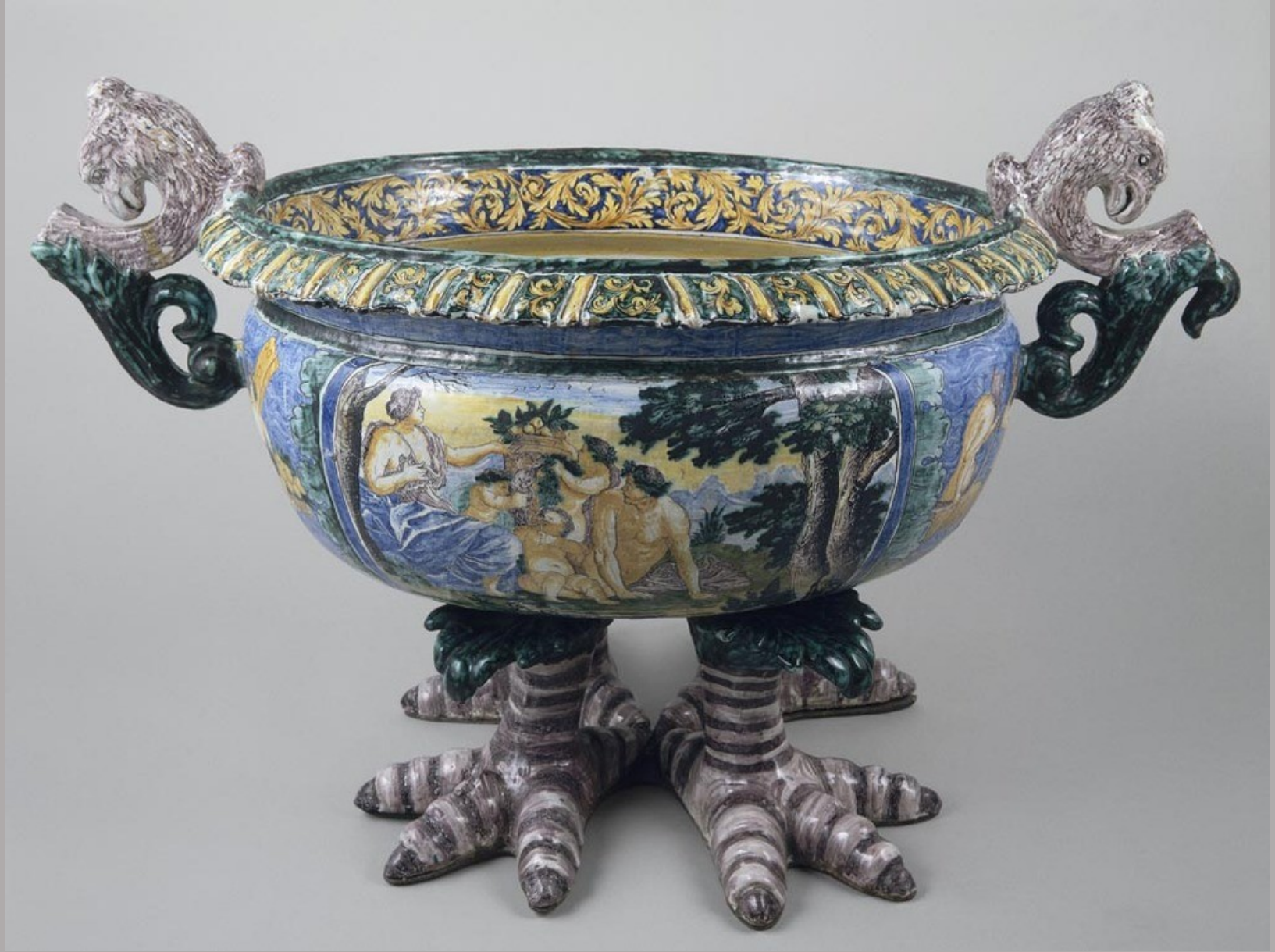
Nevers, XVIIe siècle, Vasque : Bacchanale , vers 1675/90, faïence à décor de grand feu polychrome, Paris, musée du Louvre.