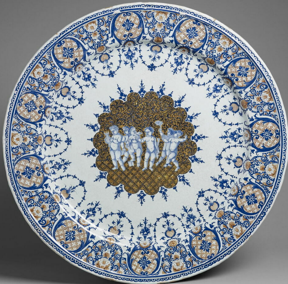
Rouen, XVIIIe siècle, Plat , vers 1720/30, faïence à décor de grand feu polychrome, Paris, musée du Louvre.