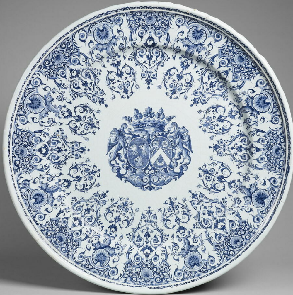
Rouen, XVIII e siècle, Plat , vers 1720, faïence à décor de grand feu, Paris, musée du Louvre.