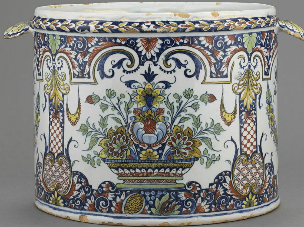
Rouen, XVIIIe siècle, Rafraichissoir , vers 1750, faïence à décor de grand feu polychrome, Paris, musée du Louvre.