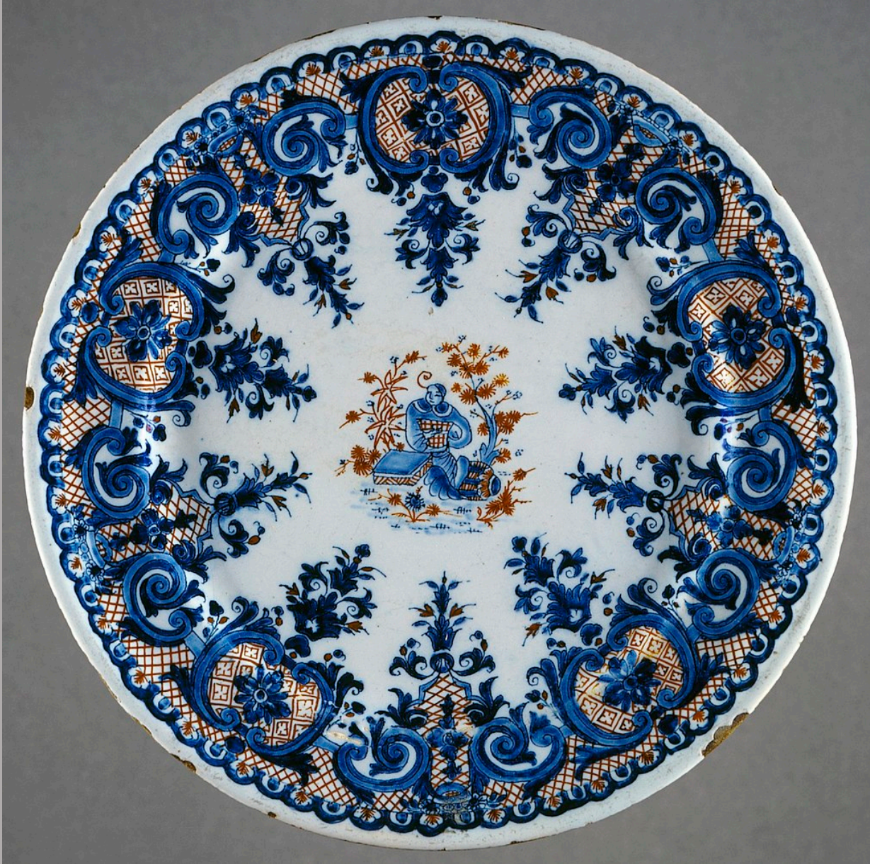
Rouen, XVIIIe siècle, Plat , vers 1710, faïence à décor de grand feu polychrome, Los Angeles, County Museum of Art.