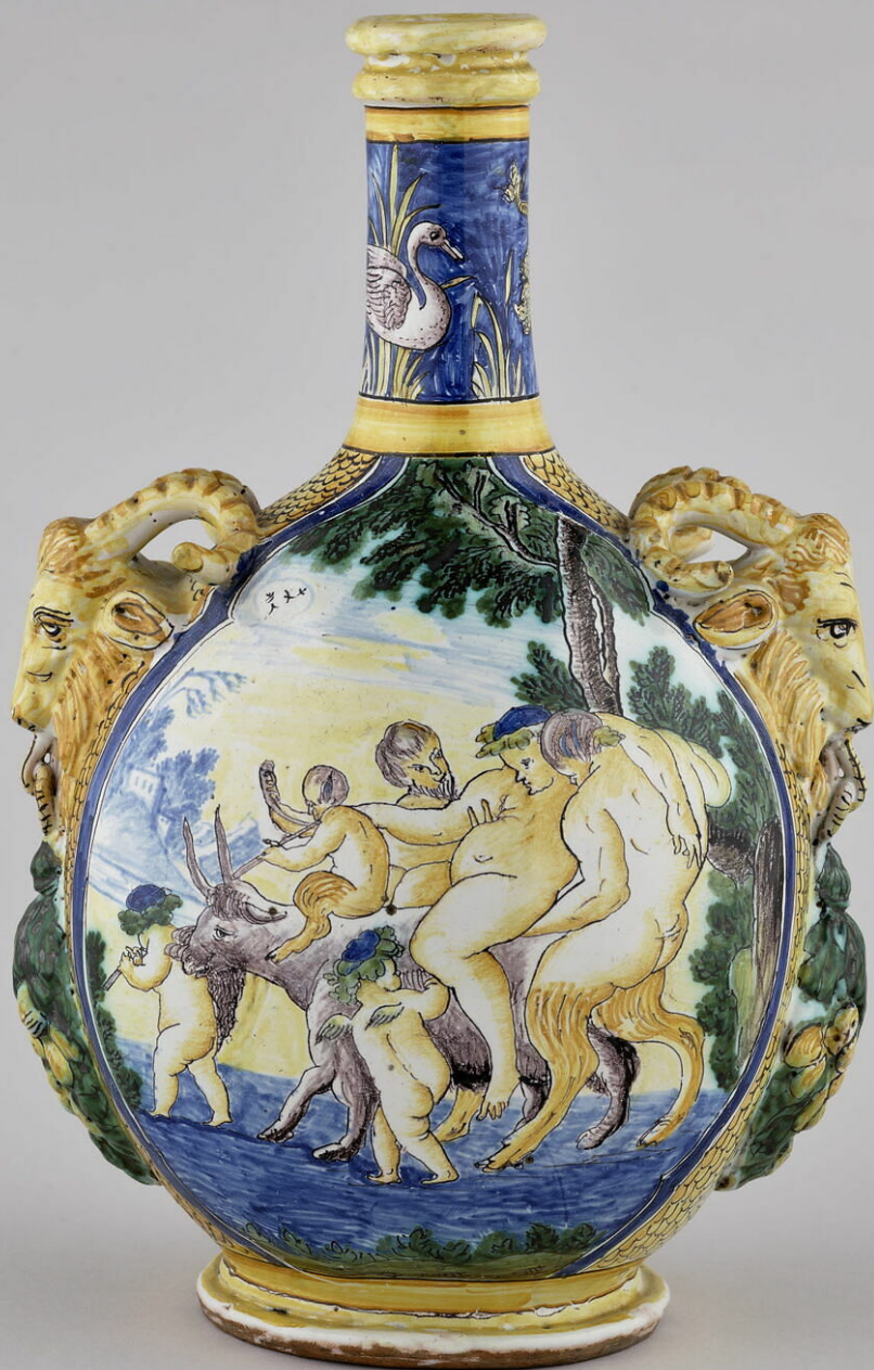
Nevers, XVIIe siècle, Gourde-bouteille : Silène ivre, vers 1680, faïence à décor de grand feu polychrome, Paris, musée du Louvre.