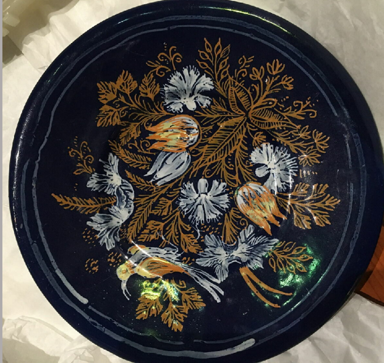
Nevers, XVIIe siècle, Coupe , vers 1660/1700, faïence à décor de grand feu polychrome, Paris, musée du Louvre.