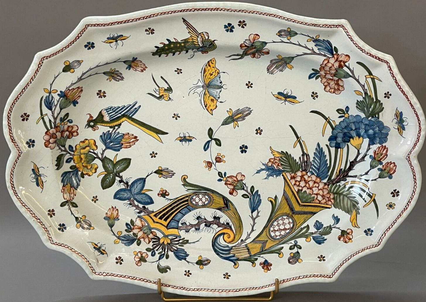
Rouen, XVIII e siècle, Plat : Décor à la corne , vers 1760, faïence à décor de grand feu polychrome, collection particulière.