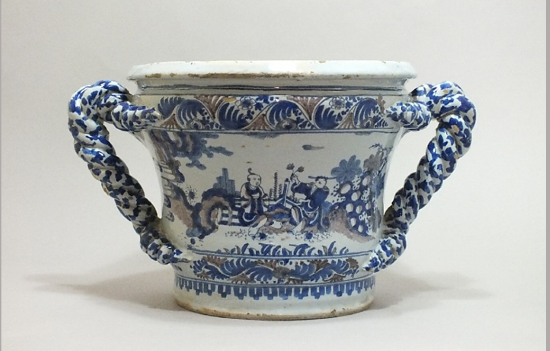
Nevers, XVIIe siècle, Vasque à deux anses : Chinois dans un paysage , vers 1680, faïence à décor de grand feu, Paris, musée du Louvre.