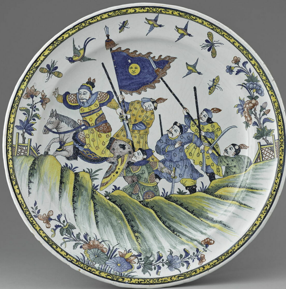
Rouen, XVIII e siècle, Plat: Cavalier tatar , vers 1735/45, faïence à décor de grand feu polychrome, Paris, musée du Louvre.