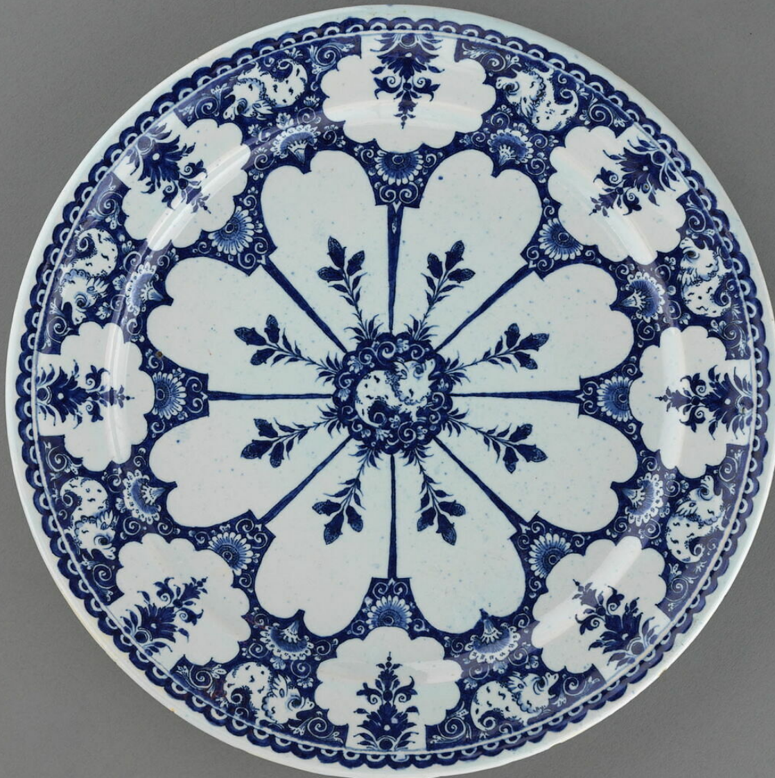
Rouen, XVIII e siècle, Assiette , vers 1700/35, faïence à décor de grand feu, Paris, musée du Louvre.