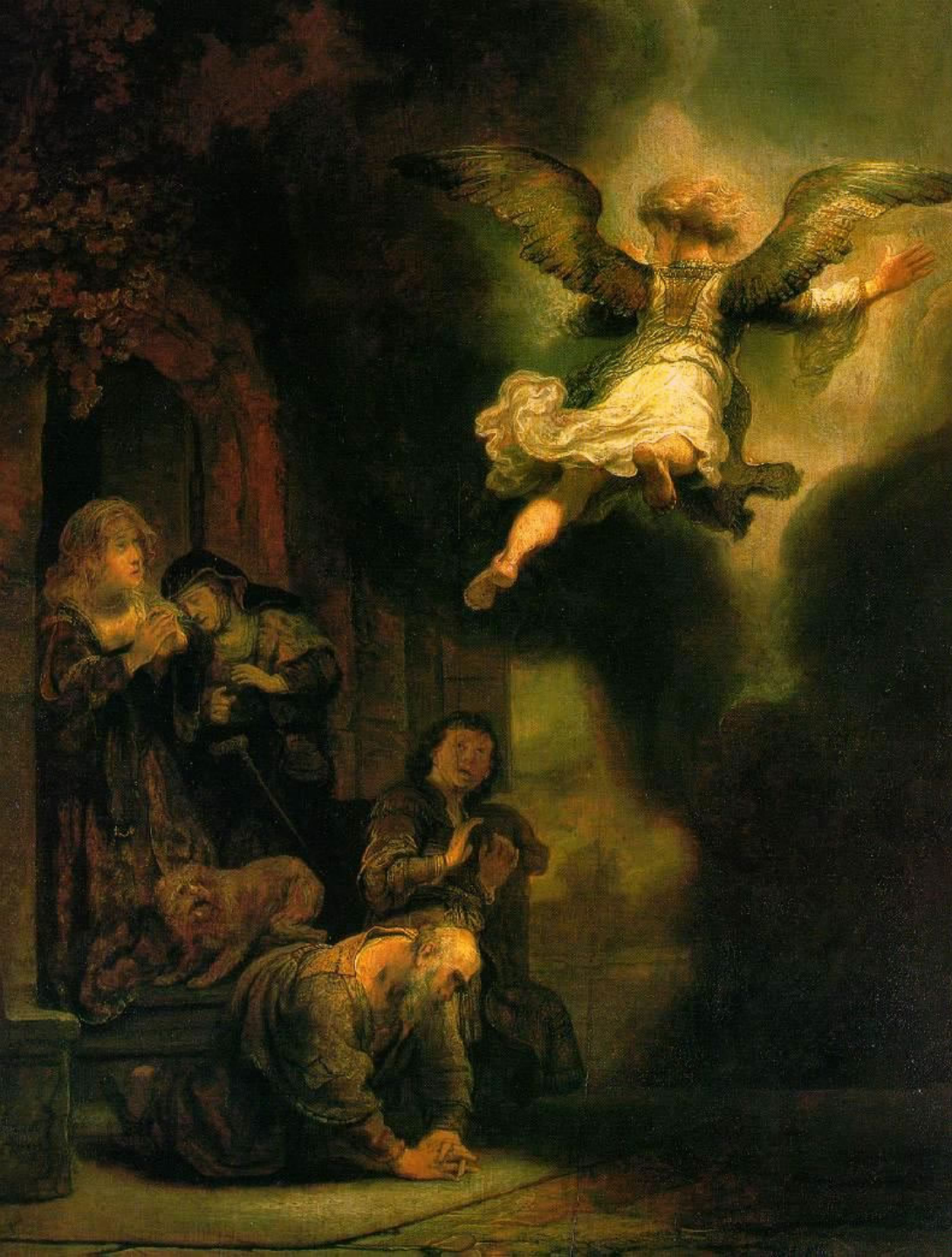
Rembrandt Harmensz. van Rijn (Leyde, 1606 – Amsterdam, 1669), L'Archange Raphaël quittant la famille de Tobie , 1637, peinture à l'huile sur bois, Paris, musée du Louvre.