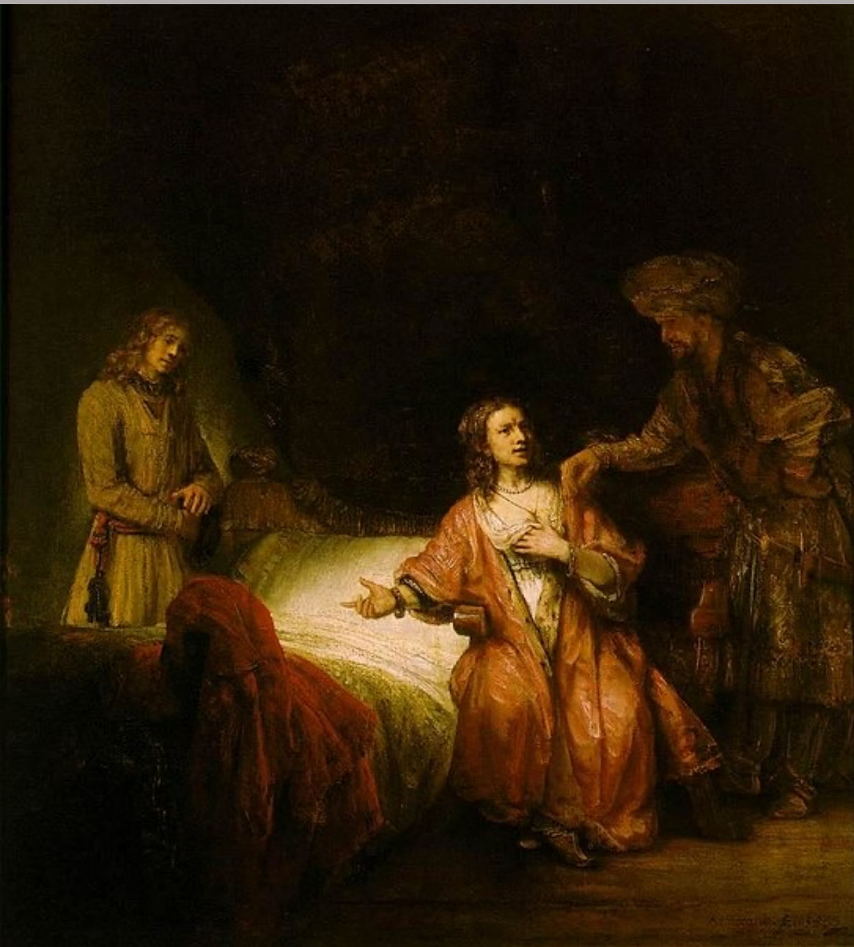
Rembrandt Harmensz. van Rijn (Leyde, 1606 – Amsterdam, 1669), Joseph accusé par la femme de Putiphar , 1655, peinture à l'huile sur toile, Washington, National Gallery.