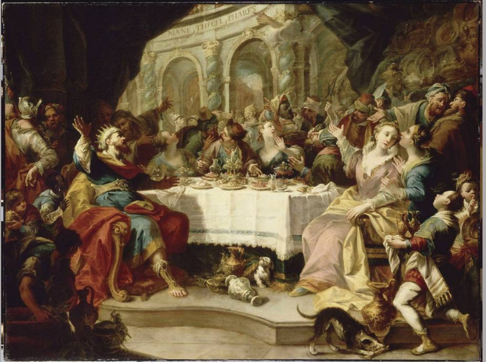
Nicola Bertuzzi (Ancône, vers 1710 – Bologne, 1777), Le Festin de Balthazar , vers 1760, peinture à l'huile sur toile, Paris, musée du Louvre.