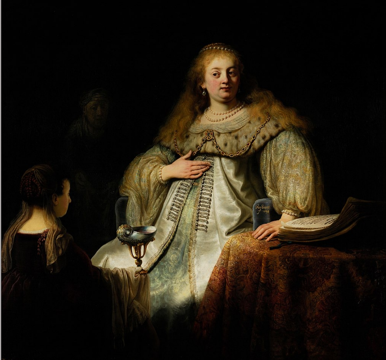
Rembrandt Harmensz. van Rijn (Leyde, 1606 – Amsterdam, 1669), Judith au banquet d'Holopherne , 1634, peinture à l'huile sur toile, Madrid, musée du Prado.