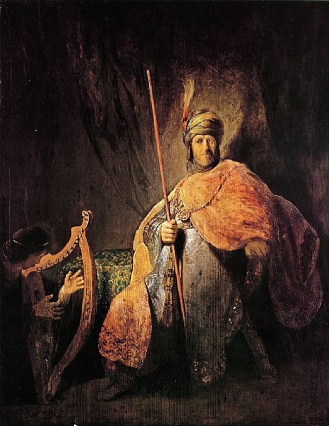
Rembrandt Harmensz. van Rijn (Leyde, 1606 – Amsterdam, 1669), David jouant de la harpe devant Saül , 1629/31, peinture à l'huile sur bois, Francfort-sur-le-Main, Städel Museum.