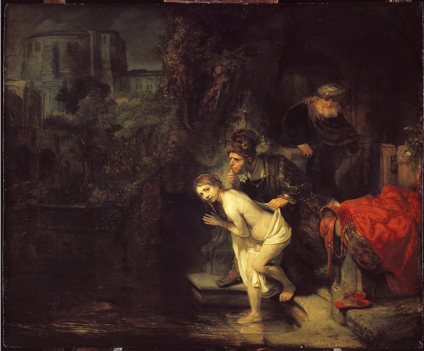
Rembrandt Harmensz. van Rijn (Leyde, 1606 – Amsterdam, 1669), Suzanne et les vieillards , 1647, peinture à l'huile sur bois, Berlin, Gemäldegalerie.