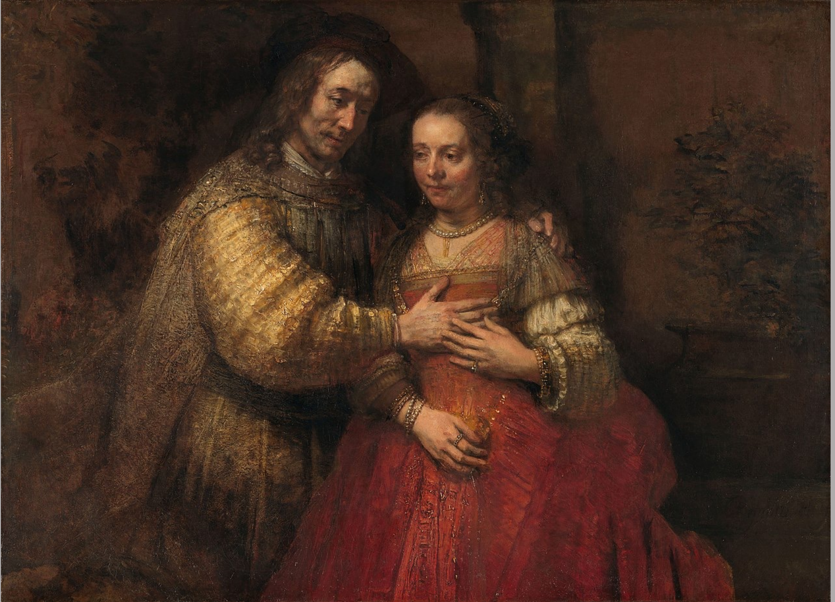
Rembrandt Harmensz. van Rijn (Leyde, 1606 – Amsterdam, 1669), Isaac et Rebecca (Miguel de Barrios et Abigaël de Pina) , 1667, peinture à l'huile sur toile, Amsterdam, Rijksmuseum Museum.