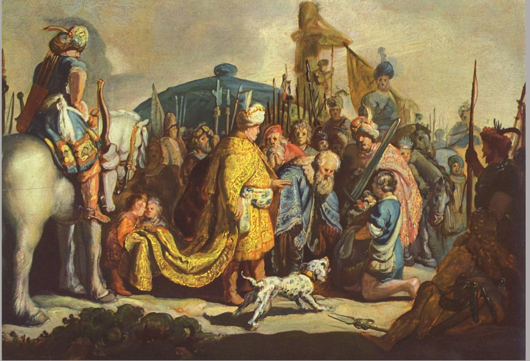
Rembrandt Harmensz. van Rijn (Leyde, 1606 – Amsterdam, 1669), David présente à Saül la tête de Goliath , 1627, peinture à l'huile sur toile, Bâle, Kunstmuseum.