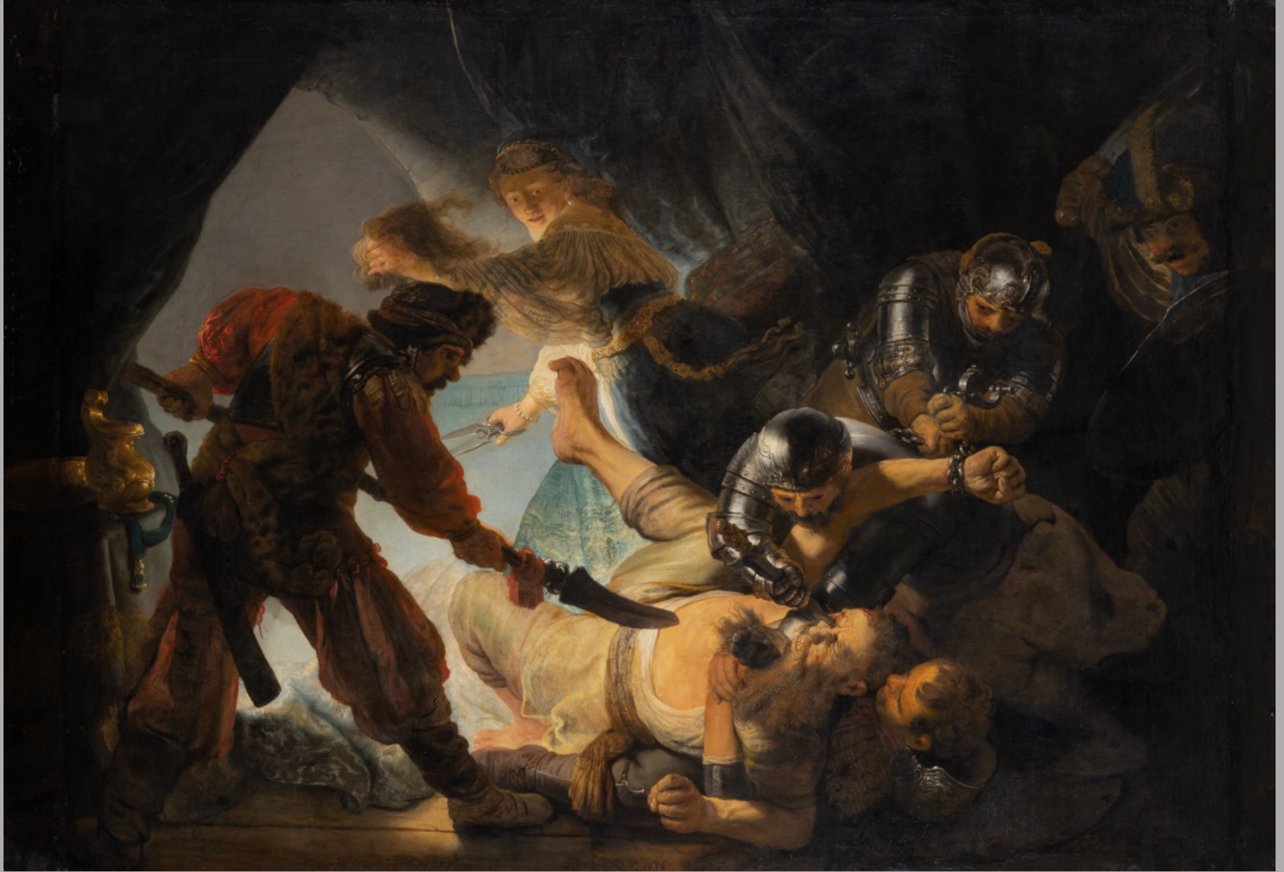
Rembrandt Harmensz. van Rijn (Leyde, 1606 – Amsterdam, 1669), L'Aveuglement de Samson , 1636, peinture à l'huile sur toile, Francfort-sur-le-Main, Städel Museum.