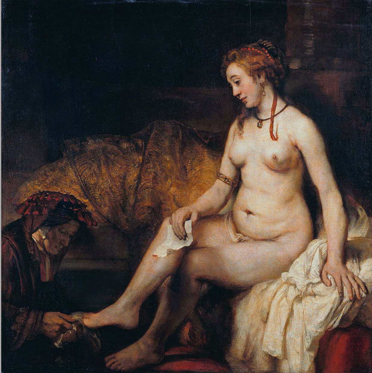
Rembrandt Harmensz. van Rijn (Leyde, 1606 – Amsterdam, 1669), Bethsabée au bain , 1654, peinture à l'huile sur toile, Paris, musée du Louvre.