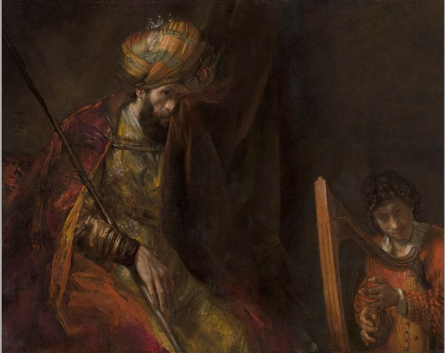
Rembrandt Harmensz. van Rijn (Leyde, 1606 – Amsterdam, 1669), David jouant de la harpe devant Saül , vers 1660, peinture à l'huile sur toile, La Haye, Mauritshuis.