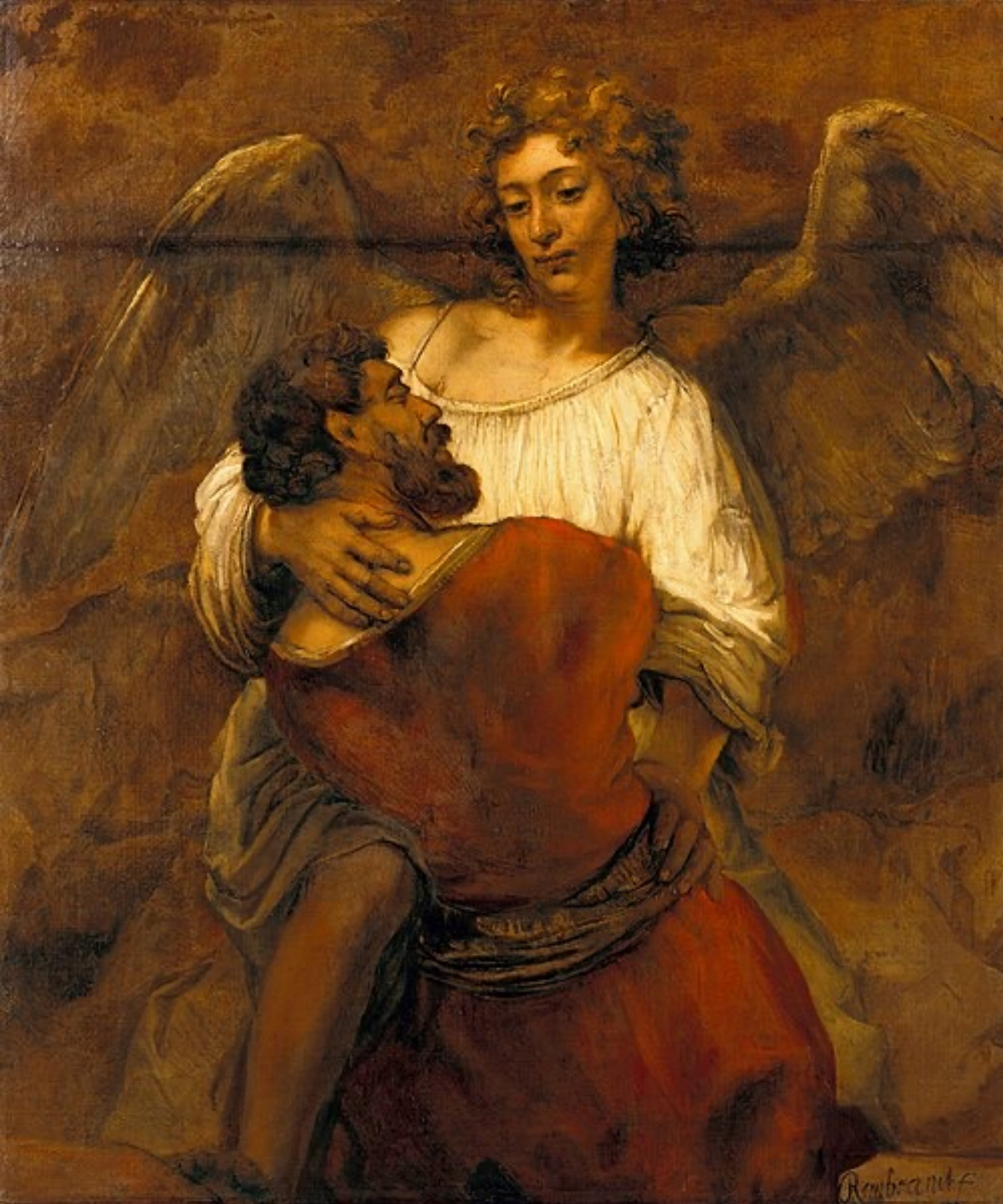
Rembrandt Harmensz. van Rijn (Leyde, 1606 – Amsterdam, 1669), La Lutte de Jacob avec l'Ange , vers 1659, peinture à l'huile sur toile, Berlin, Gemäldegalerie.