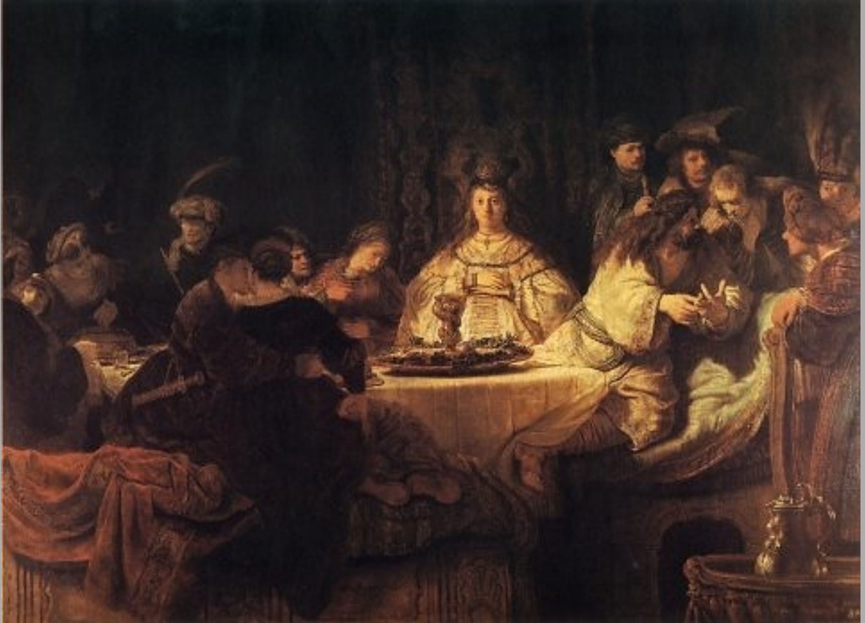
Rembrandt Harmensz. van Rijn (Leyde, 1606 – Amsterdam, 1669), Le Festin de Samson , 1638, peinture à l'huile sur toile, Dresde, Staatliche Kunstsammlungen.