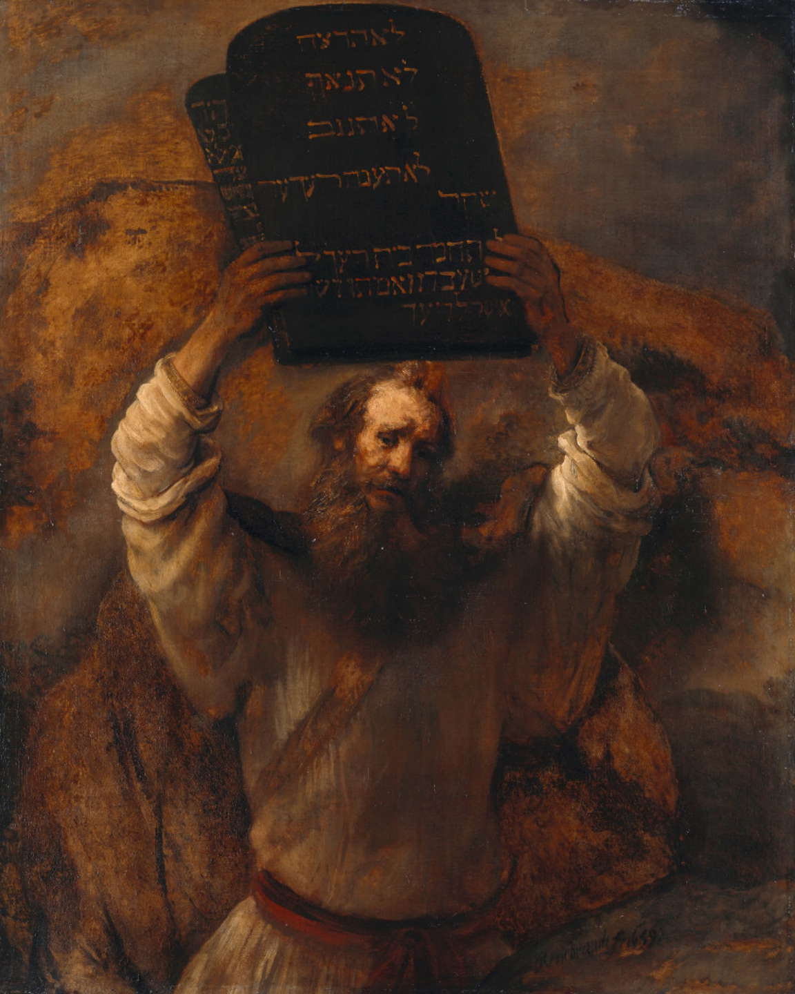
Rembrandt Harmensz. van Rijn (Leyde, 1606 – Amsterdam, 1669), Moïse brisant les tables de la Loi , 1659, peinture à l'huile sur toile, Berlin, Gemäldegalerie.