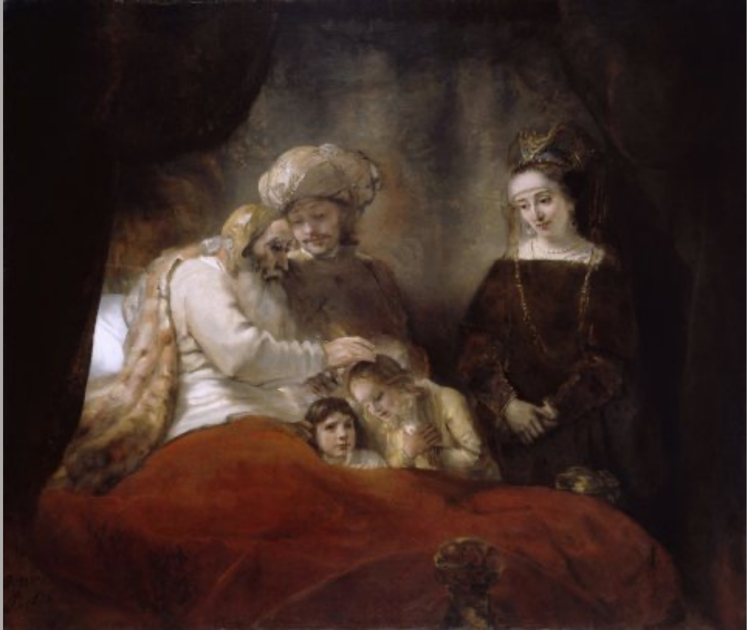
Rembrandt Harmensz. van Rijn (Leyde, 1606 – Amsterdam, 1669), Jacob bénit les fils de Joseph , 1656, peinture à l'huile sur toile, Kassel, Staatliche Museen.