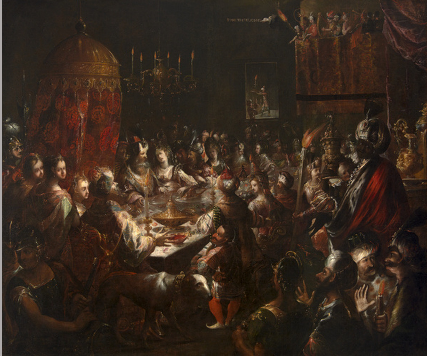
Bartholomeus Strobel (Breslau, 1591 – Torun, vers 1655), Le Festin de Balthazar , vers 1630, peinture à l'huile sur toile, Grenoble, musée.