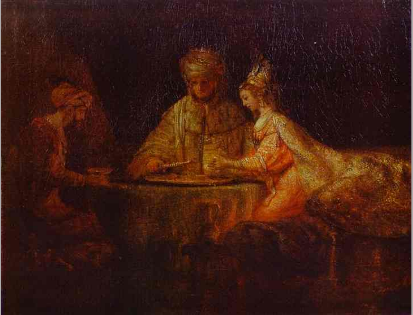
Rembrandt Harmensz. van Rijn (Leyde, 1606 – Amsterdam, 1669), Le Repas d'Esther , 1660, peinture à l'huile sur toile, Moscou, musée Pouchkine.