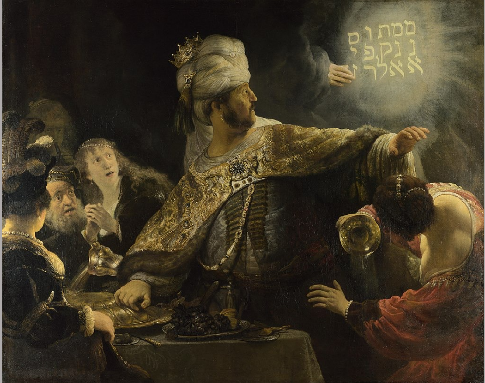
Rembrandt Harmensz. van Rijn (Leyde, 1606 – Amsterdam, 1669), Le Festin de Balthazar (Mane Thecel Phares) , 1635, peinture à l'huile sur toile, Londres, National Gallery.