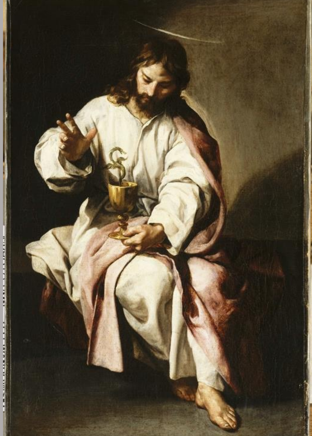
Alonso Cano (Grenade, 1601 – Grenade, 1667), Saint Jean l'Évangéliste , vers 1635/7, peinture à l'huile sur toile, Paris, musée du Louvre.