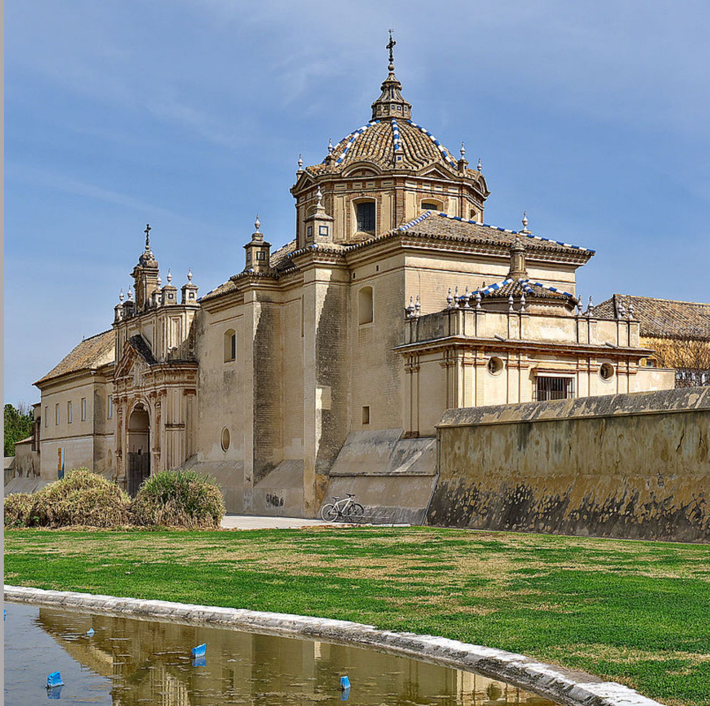
Séville, vue de la chartreuse Santa Maria de las Cuevas.