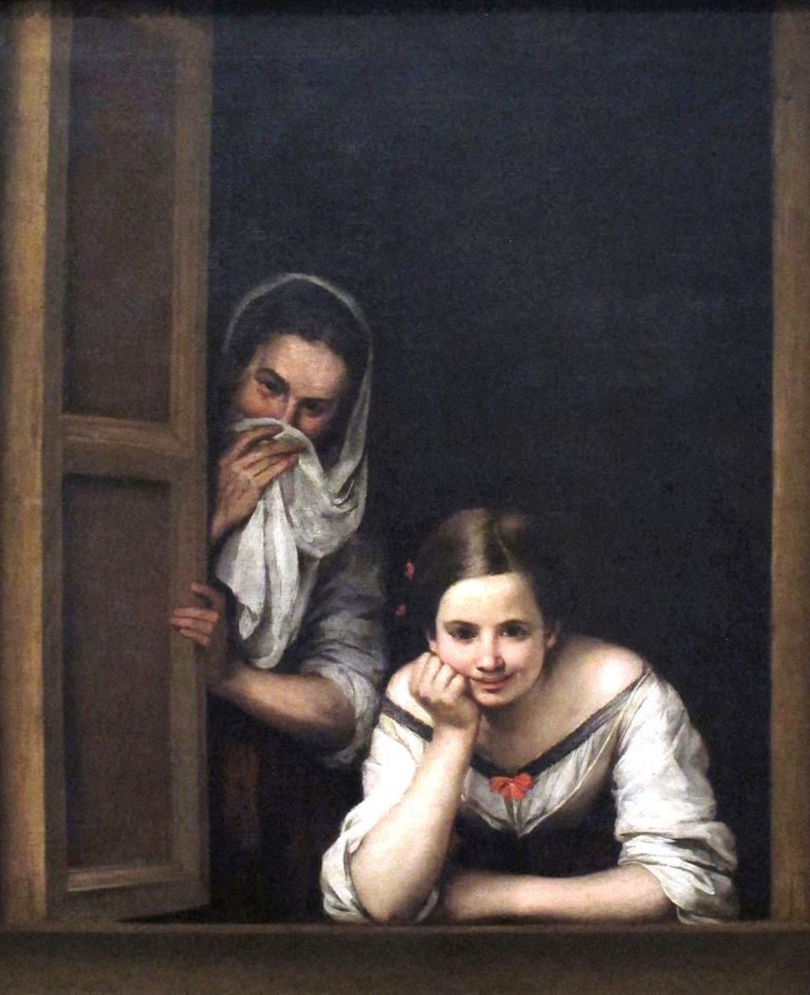
Bartolomé Esteban Murillo (Séville, 1618 – Séville, 1682), Deux femmes à la fenêtre , vers 1655, peinture à l'huile sur toile, Washington, National Gallery of Art.