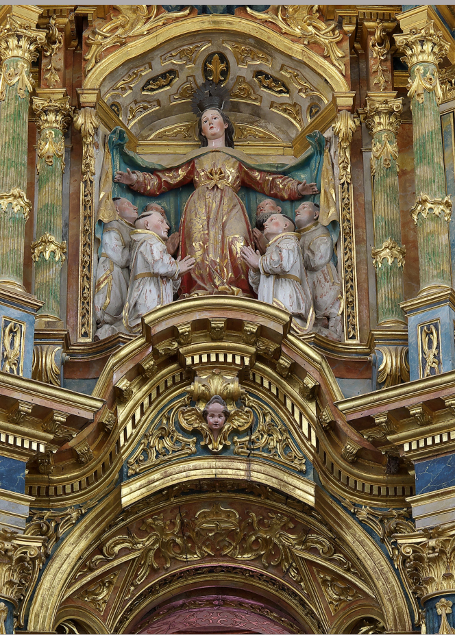
Séville, vue de la chapelle de Afuera de la chartreuse Santa Maria de las Cuevas.