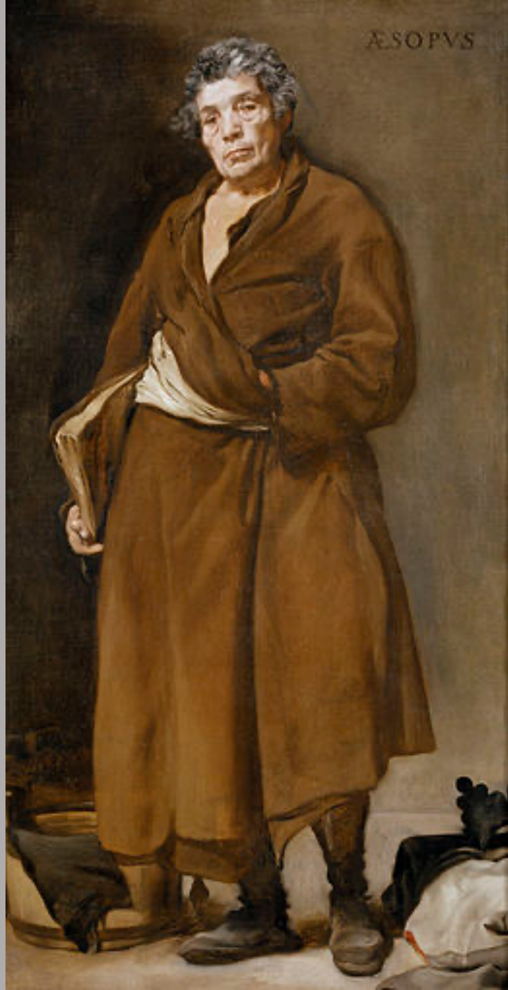
Diego Velazquez (Séville, 1599 – Madrid, 1660), Esope , vers 1639/40, peinture à l'huile sur toile, Madrid, musée du Prado.