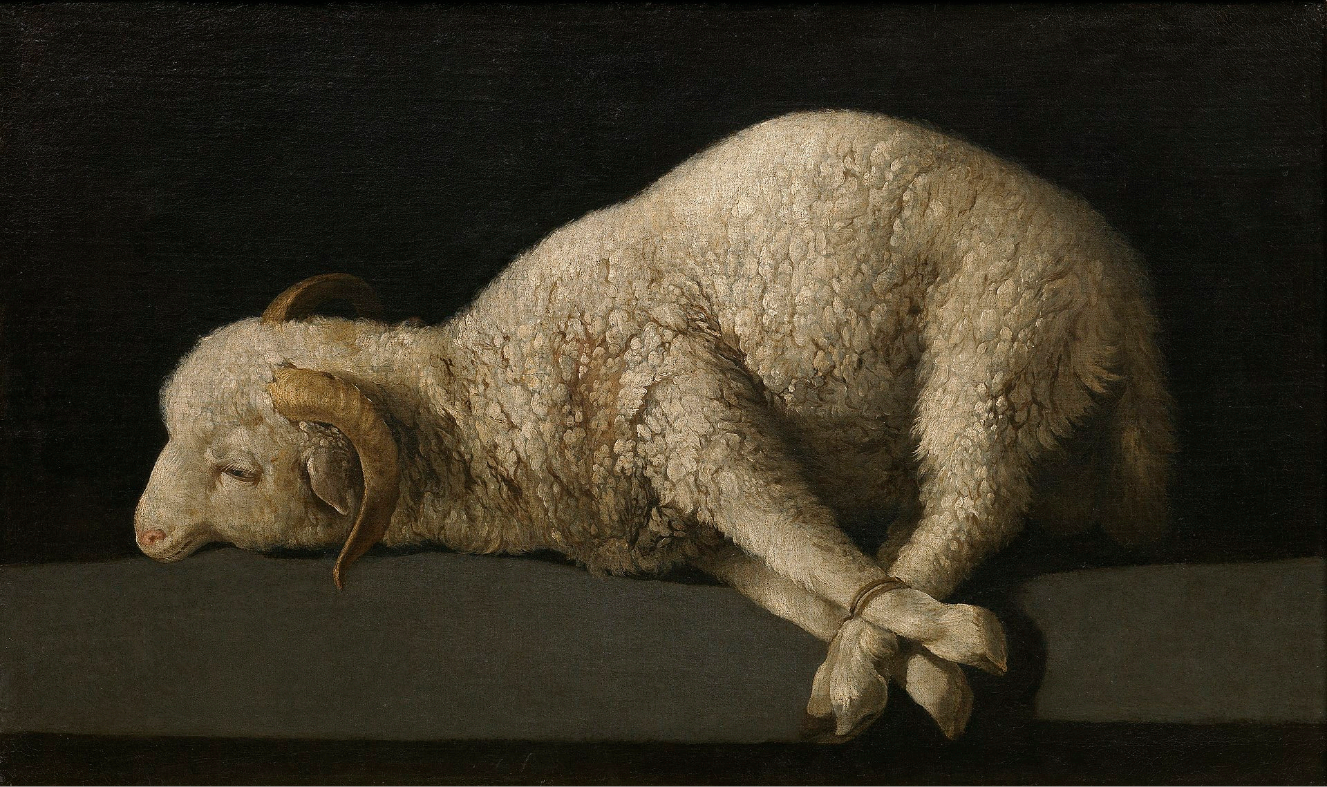
Francisco de Zurbaràn (Fuente de Cantos, 1598 – Madrid, 1664), Agnus Dei , vers 1635/40, peinture à l'huile sur toile, Madrid, musée du Prado.