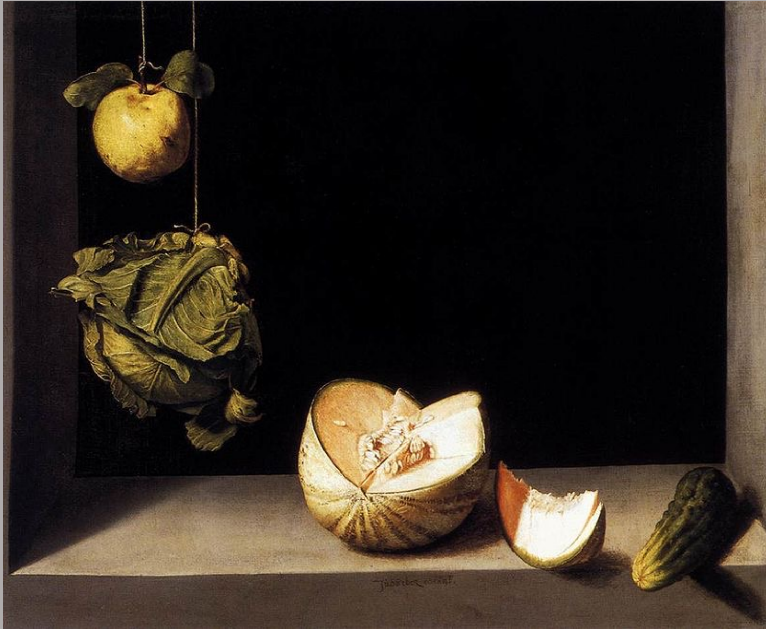
Juan Sanchez Cotan (Orgaz, 1560 – Grenade, 1627), Nature morte , 1602, peinture à l'huile sur toile, San Diego, Museum of Art.