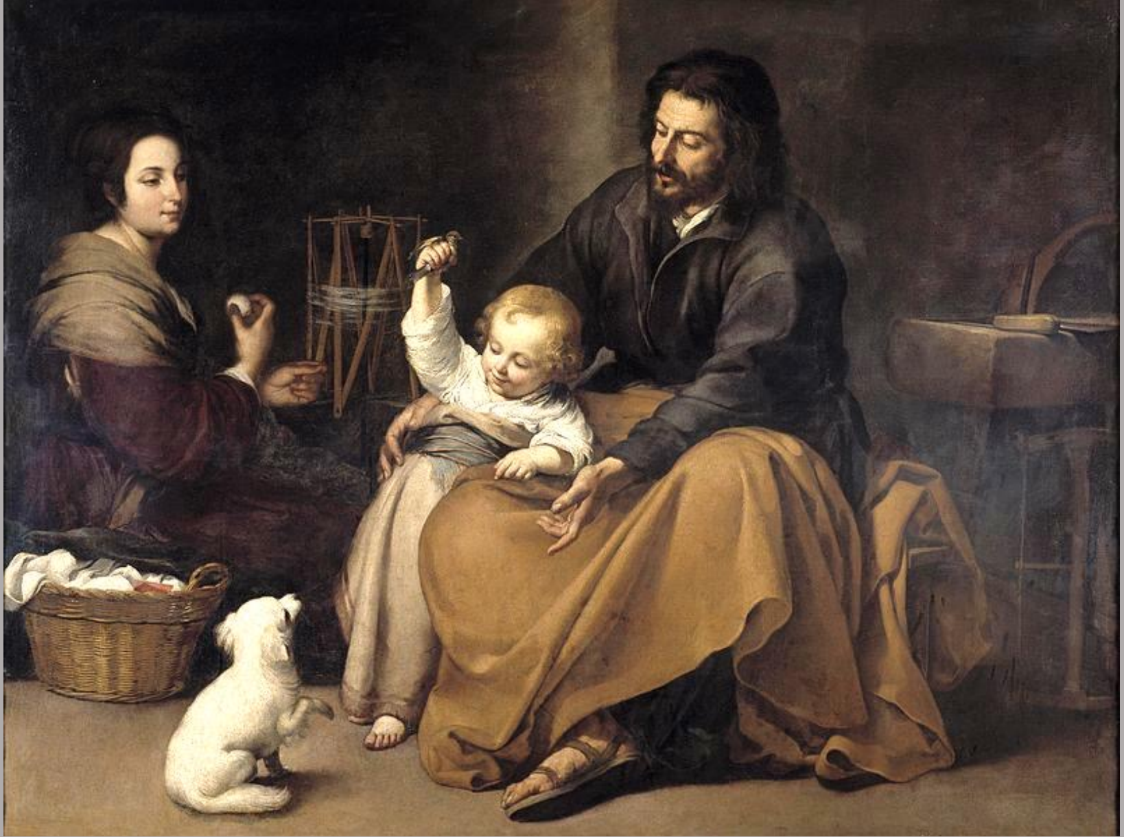
Bartolomé Esteban Murillo (Séville, 1618 – Séville, 1682), La Sainte famille , vers 1645/50, peinture à l'huile sur toile, Madrid, musée du Prado.