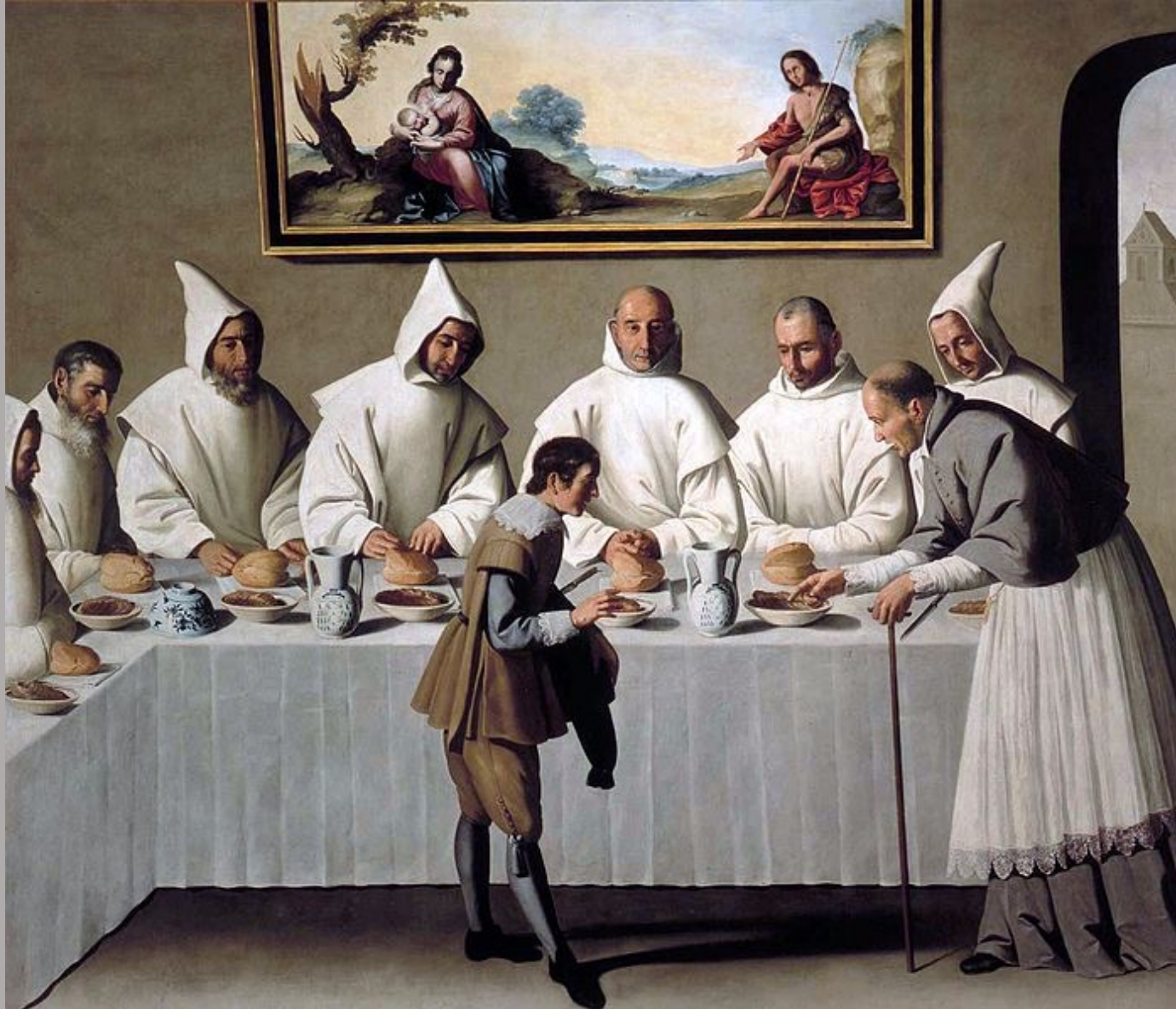
Francisco de Zurbarán (Fuente de Cantos, 1598 – Madrid, 1664), Saint Hugues au réfectoire des chartreux , vers 1655, peinture à l'huile sur toile, Séville, musée des Beaux-Arts (prov. sacristie de la chartreuse Santa Maria de las Cuevas, Séville).