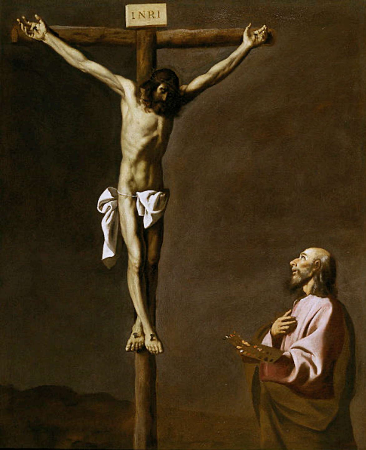
Francisco de Zurbarán (Fuente de Cantos, 1598 – Madrid, 1664), Saint Luc devant le Christ en croix , vers 1635, peinture à l'huile sur toile, Madrid, musée du Prado.