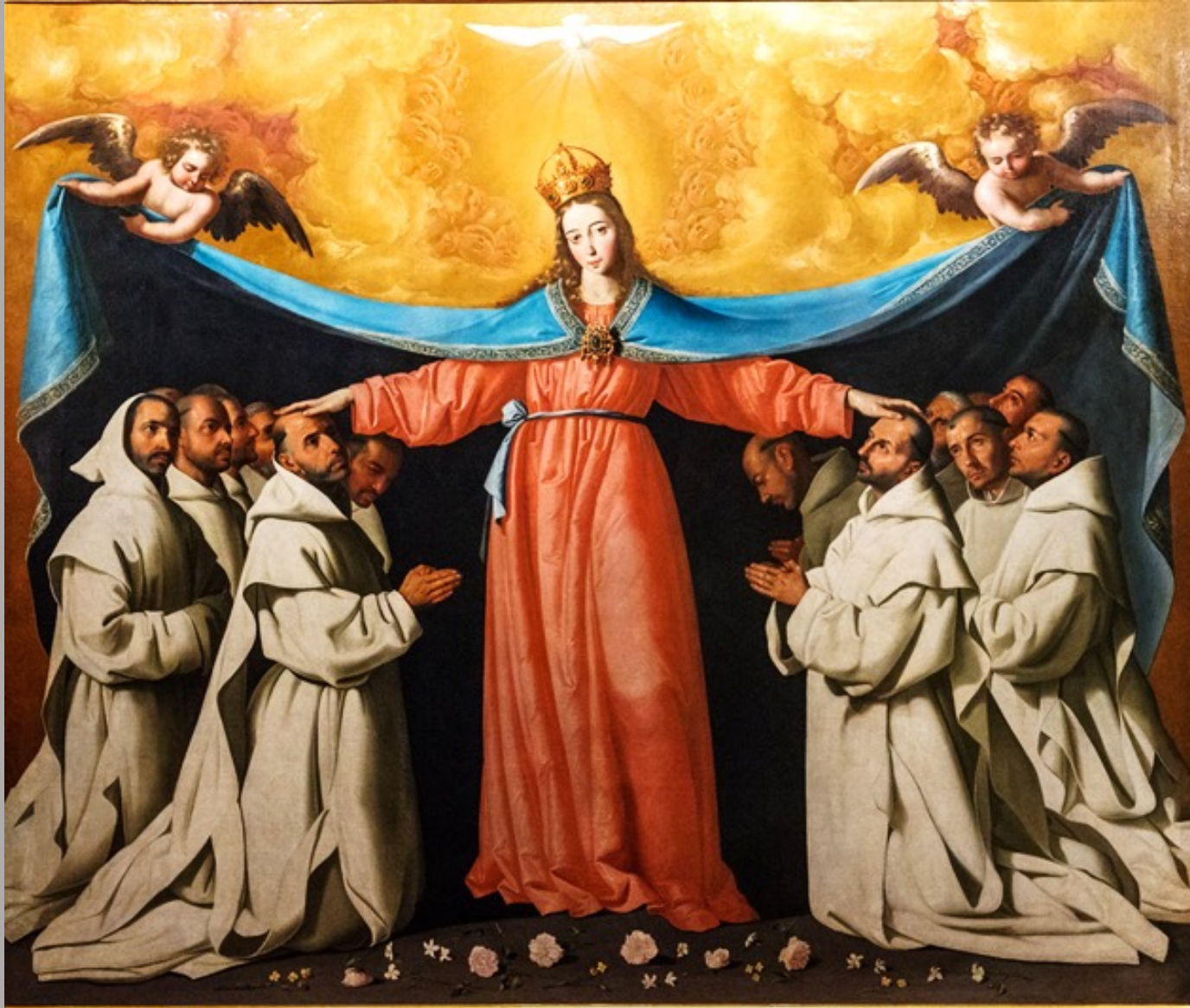
Francisco de Zurbarán (Fuente de Cantos, 1598 – Madrid, 1664), La Vierge de las Cuevas , vers 1655, peinture à l'huile sur toile, Séville, musée des Beaux-Arts (prov. sacristie de la chartreuse Santa Maria de las Cuevas, Séville).