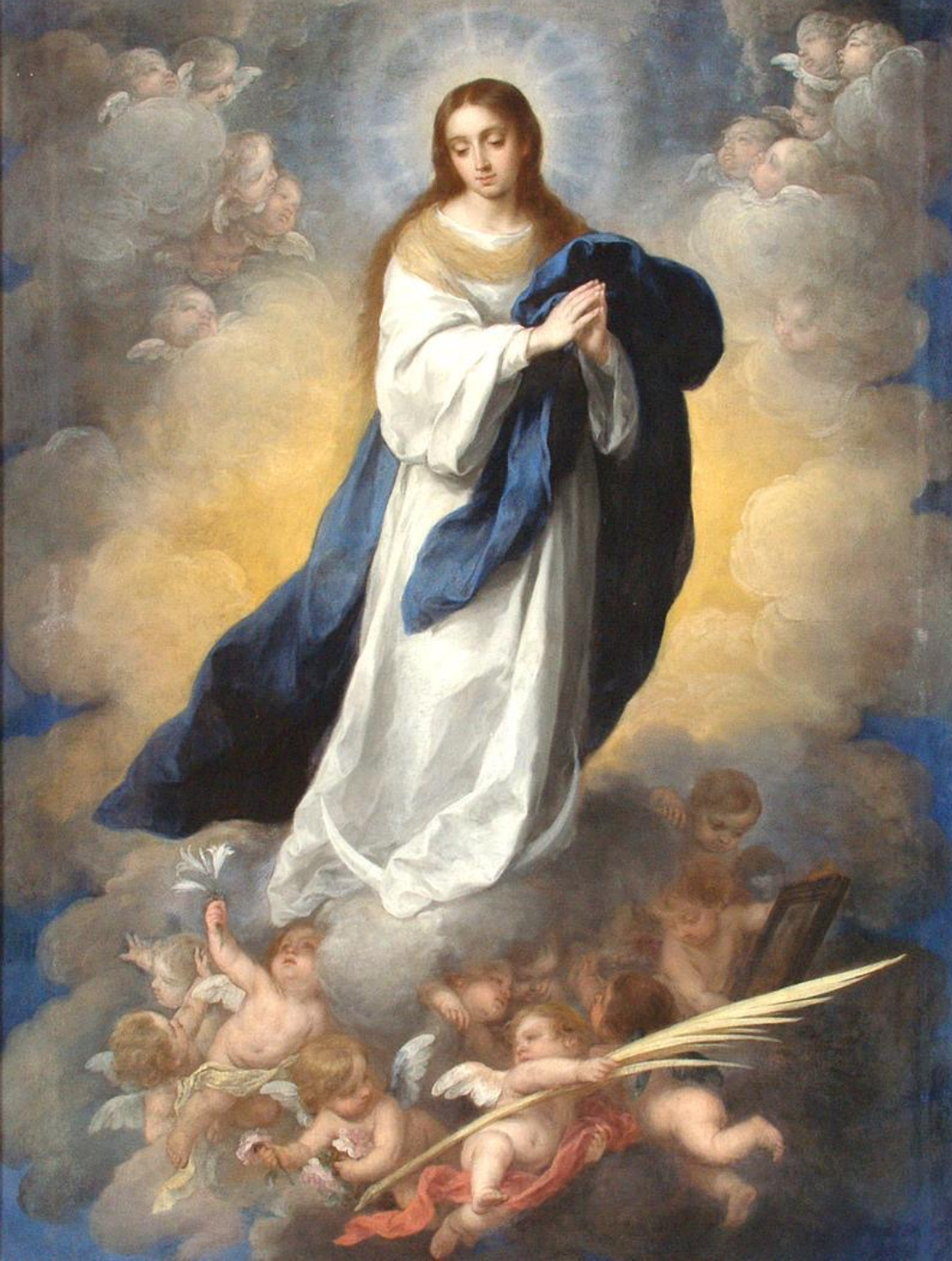
Bartolomé Esteban Murillo (Séville, 1618 – Séville, 1682), L'Immaculée Conception , vers 1670, peinture à l'huile sur toile, Puerto Rico, Museo de Arte de Ponce.