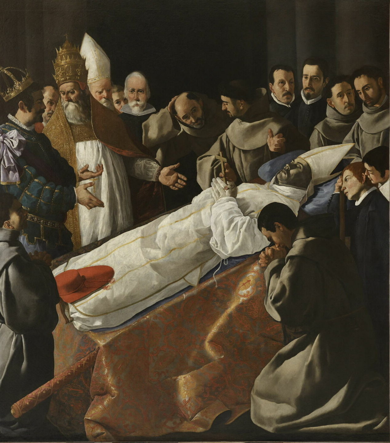
Francisco de Zurbarán (Fuente de Cantos, 1598 – Madrid, 1664), L'Exposition du corps de saint Bonaventure , vers 1629, peinture à l'huile sur toile, Paris, musée du Louvre.