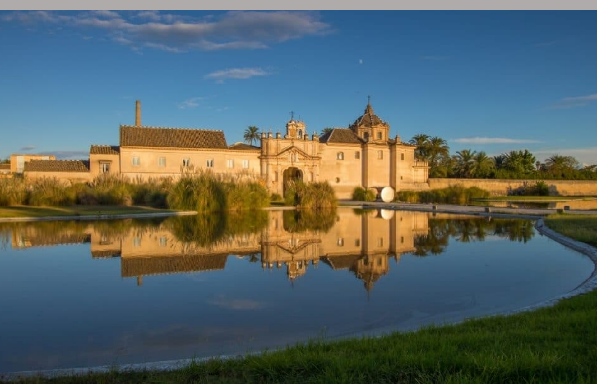
Séville, vue de la chartreuse Santa Maria de las Cuevas.