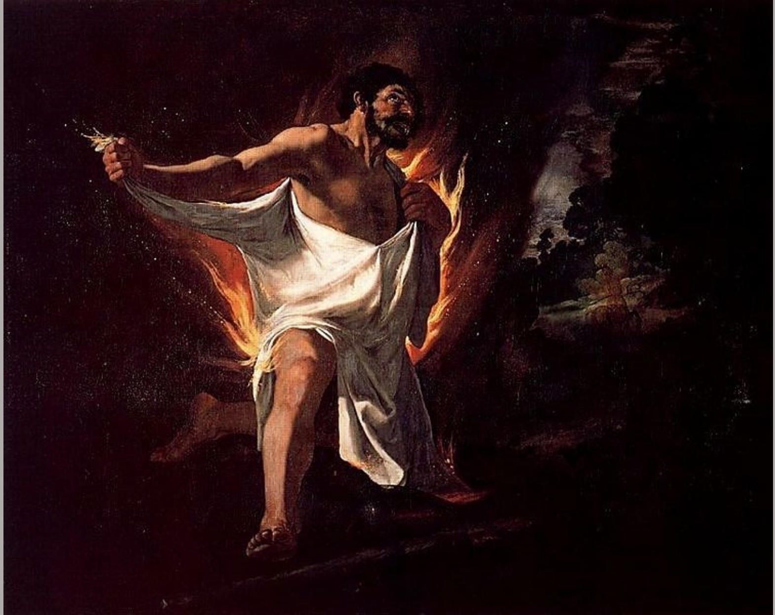
Francisco de Zurbarán (Fuente de Cantos, 1598 – Madrid, 1664), La Mort d'Hercule , 1634, peinture à l'huile sur toile, Madrid, musée du Prado.