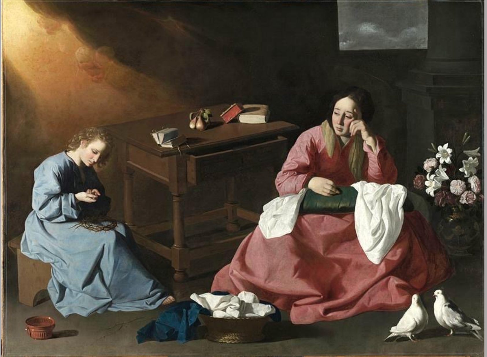
Francisco de Zurbarán (Fuente de Cantos, 1598 – Madrid, 1664), Le Christ et la Vierge à Nazareth , 1631/40, peinture à l'huile sur toile, Cleveland, Museum of Art.