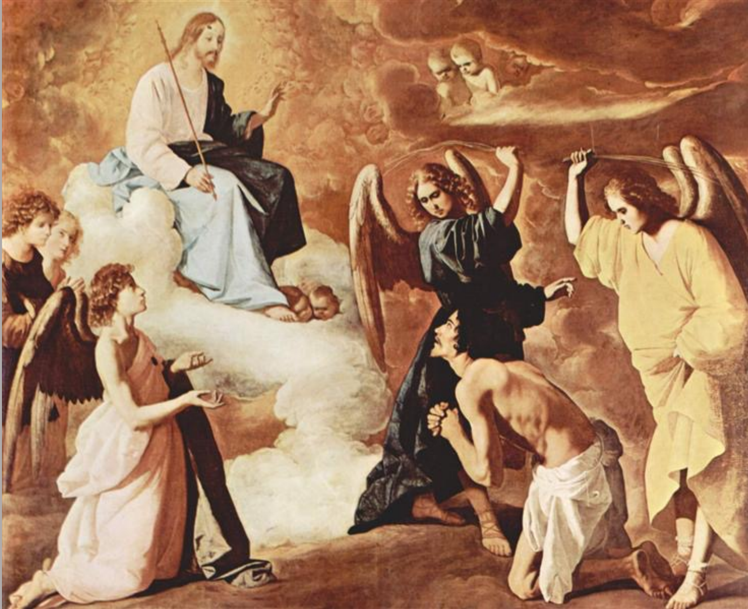
Francisco de Zurbarán (Fuente de Cantos, 1598 – Madrid, 1664), Saint Jérôme frotté par les anges , 1639, peinture à l'huile sur toile, Guadalupe, monastère royal de Santa Maria.