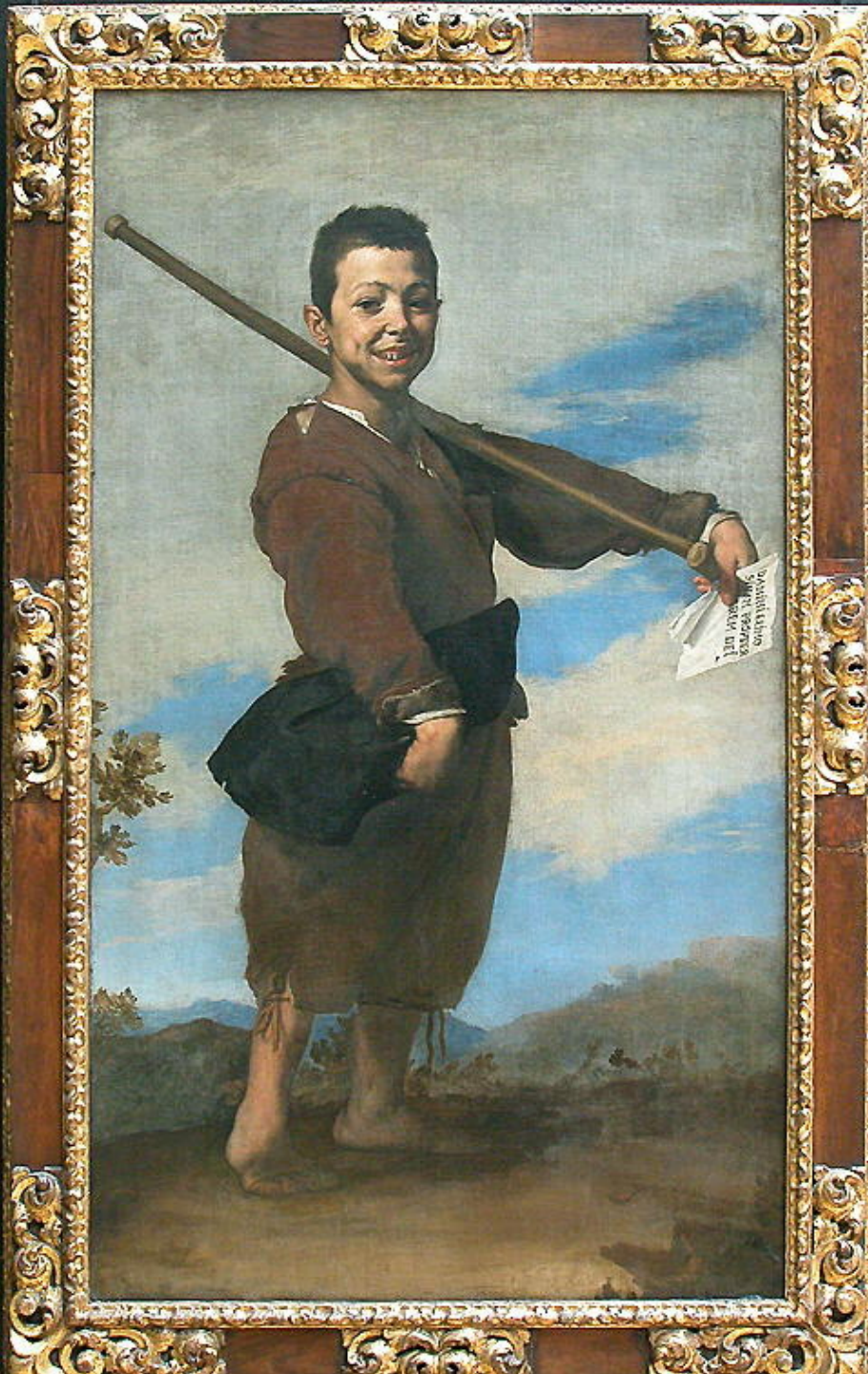
Jusepe de Ribera (Jativa, 1591 – Valence, 1652), Le Pied-bot , 1642, peinture à l'huile sur toile, Paris, musée du Louvre.