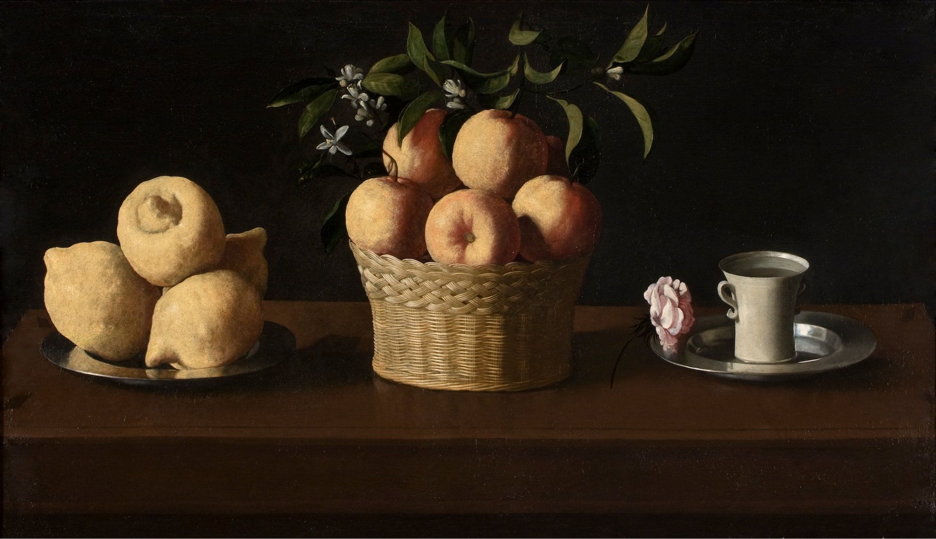
Francisco de Zurbarán (Fuente de Cantos, 1598 – Madrid, 1664), Nature morte avec citrons et oranges , vers 1633, peinture à l'huile sur toile, Los Angeles, Norton Simon Foundation.