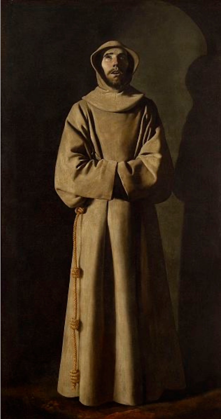
Francisco de Zurbarán (Fuente de Cantos, 1598 – Madrid, 1664), Saint François d'Assise. La Vision de Nicolas V, vers 1655, peinture à l'huile sur toile, Lyon, musée des Beaux-Arts.