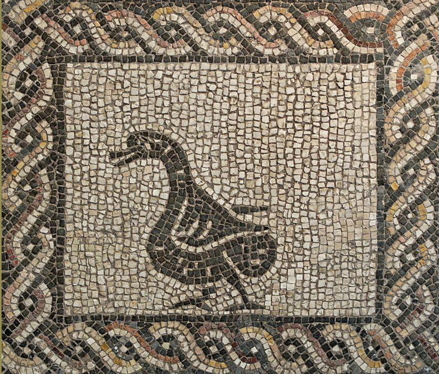
Italie romaine (Rome), IIIe s., Opus tessellatum : Canard , vers 230, marbres, Rome, Palazzo Massimo alle Terme.