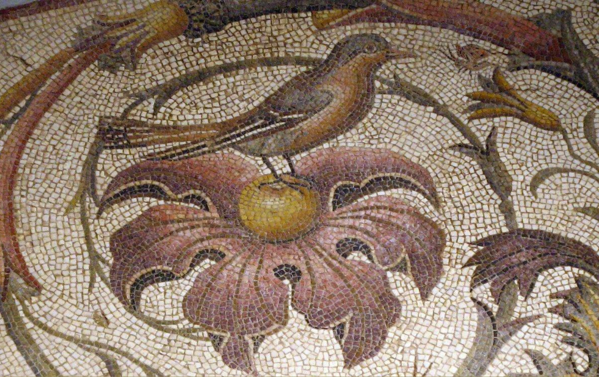
Afrique romaine, IIIe s., Opus vermiculatum : oiseau, vers 200, marbres, Tripoli, musée national d'archéologie.