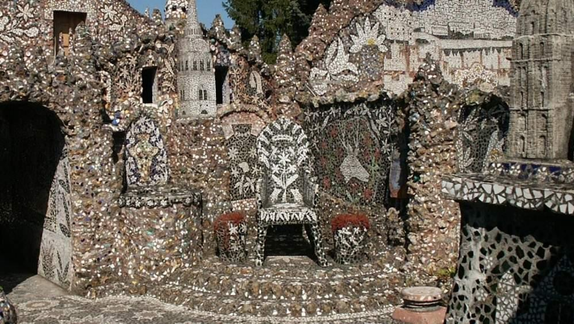
Raymond Isidore (Chartres, 1900 - Chartres, 1964), La Cour , 1938/60, céramique et mortier, Chartres, maison Picassiette.