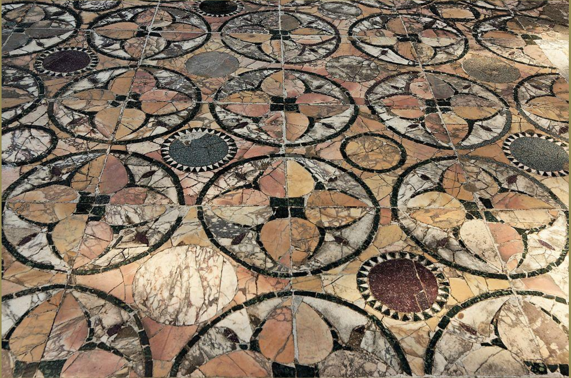
Italie romaine, Ier s., Opus sectile , vers 50/100, marbres, Ostie, maison de Cupidon et Psyché.