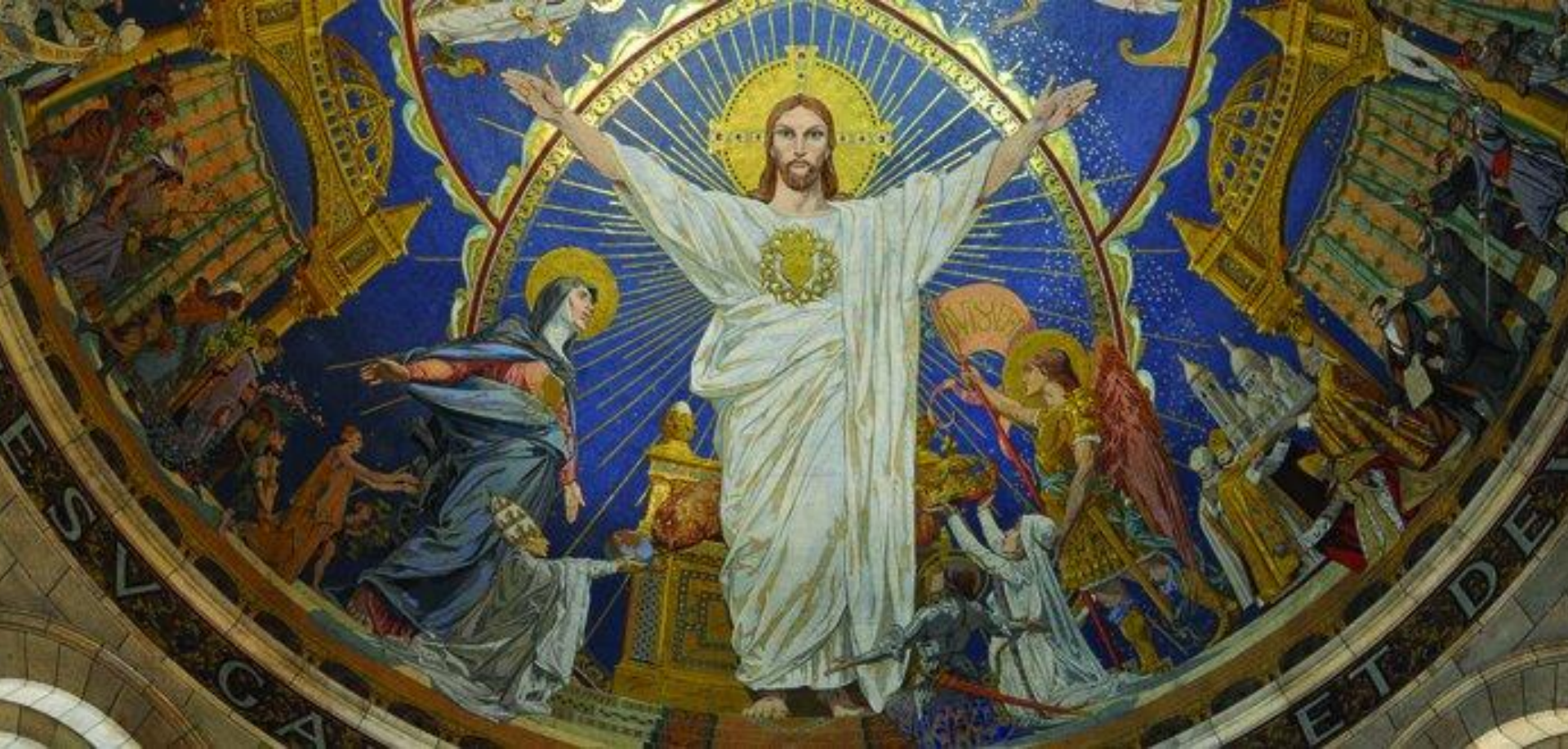
Luc-Olivier Merson (Paris, 1846 – Paris, 1920), Le Christ en gloire , 1923, marbres et verre, Paris, basilique du Sacré-Cœur de Montmartre.