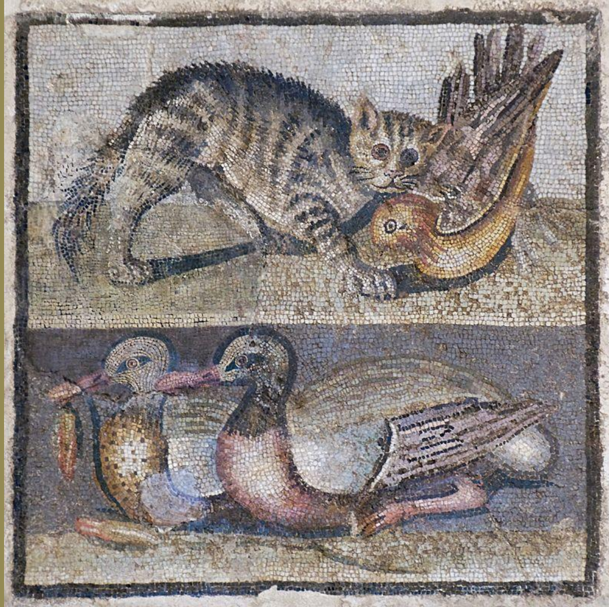
Italie romaine (Rome), I er s. av. J.-C., Opus vermiculatum : Chat attrapant un oiseau/deux canards, vers 30 av. J.-C., marbres, Rome, Palazzo Massimo alle Terme.