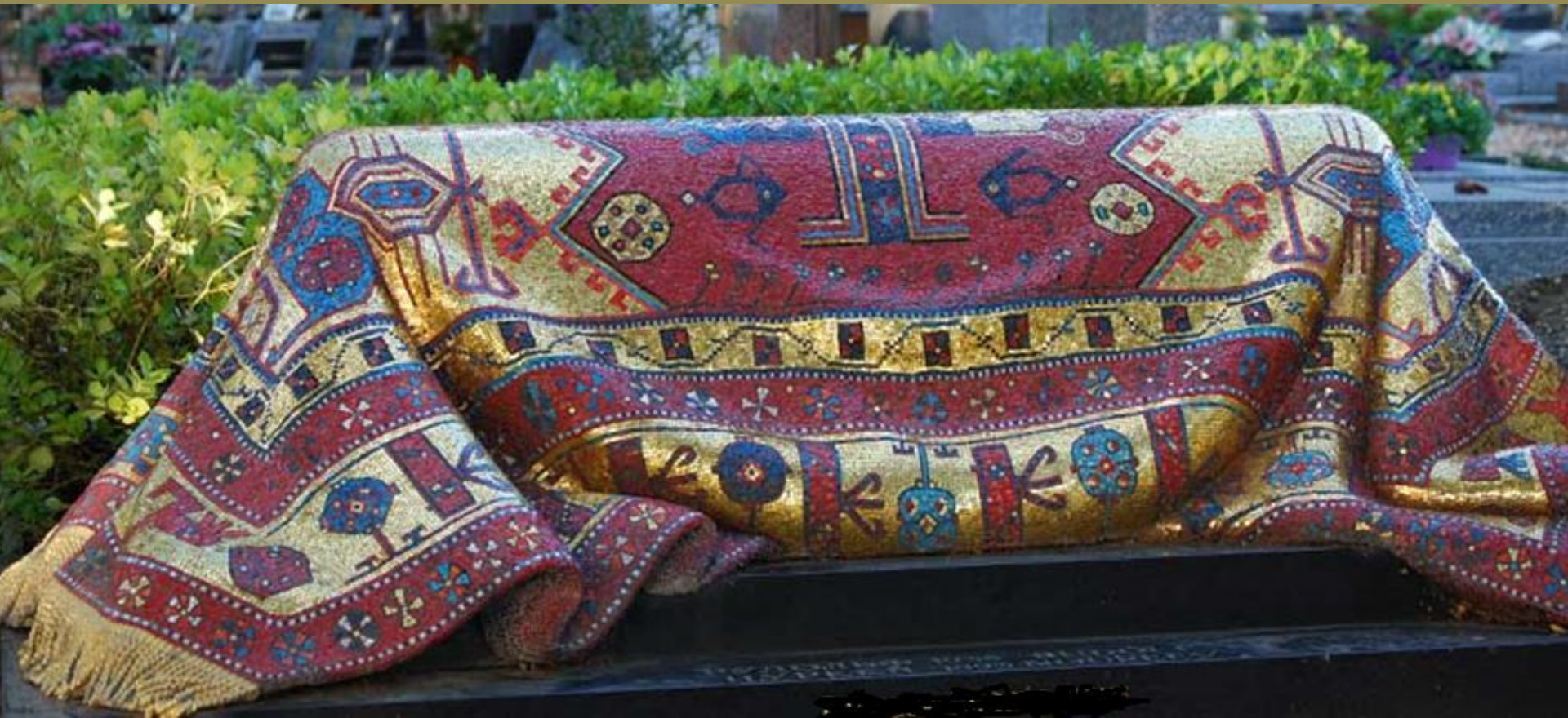
Ezio Frigerio (Erba, 1930), Tombe de Rudolf Noureev , 1996, marbre, céramique, verre, Sainte-Geneviève-des-Bois, Cimetière russe.