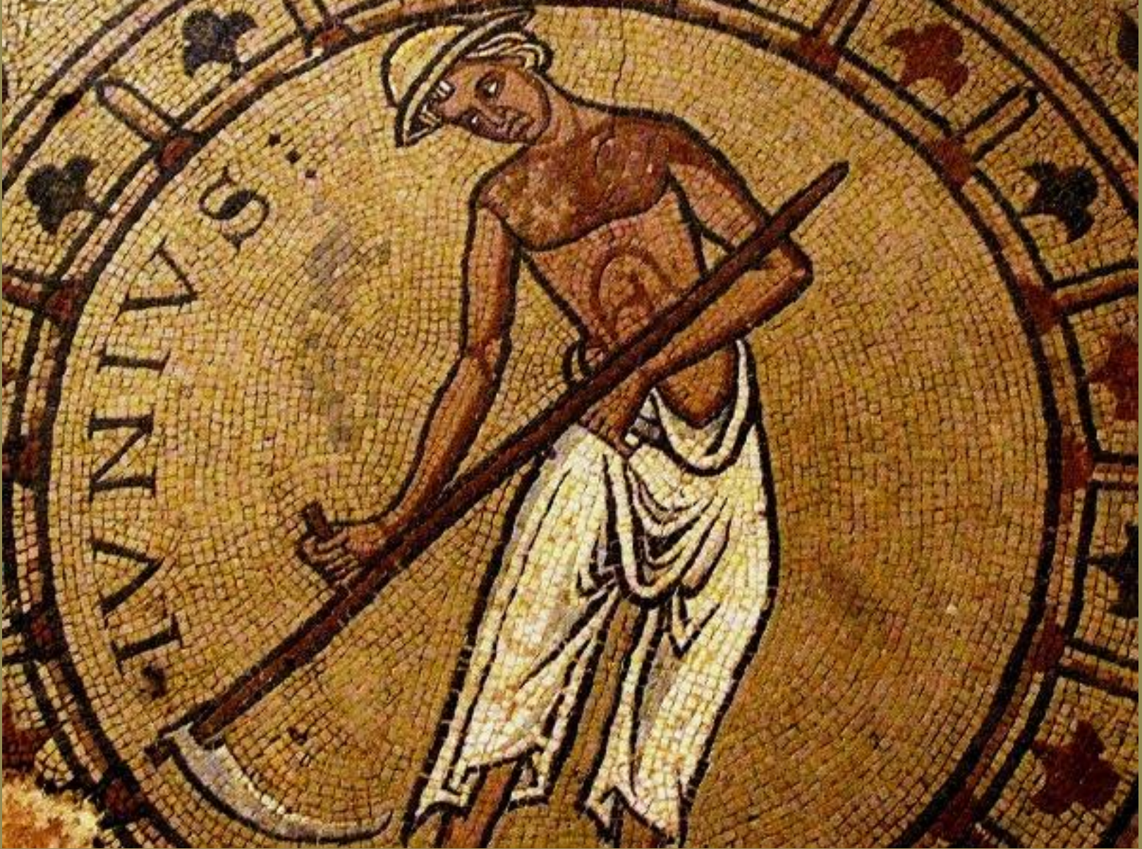
France, XIIe s., Mosaïque : Faucheur (le mois de juin) , vers 1150/80, marbres, Tournus, abbatale Saint-Philibert.