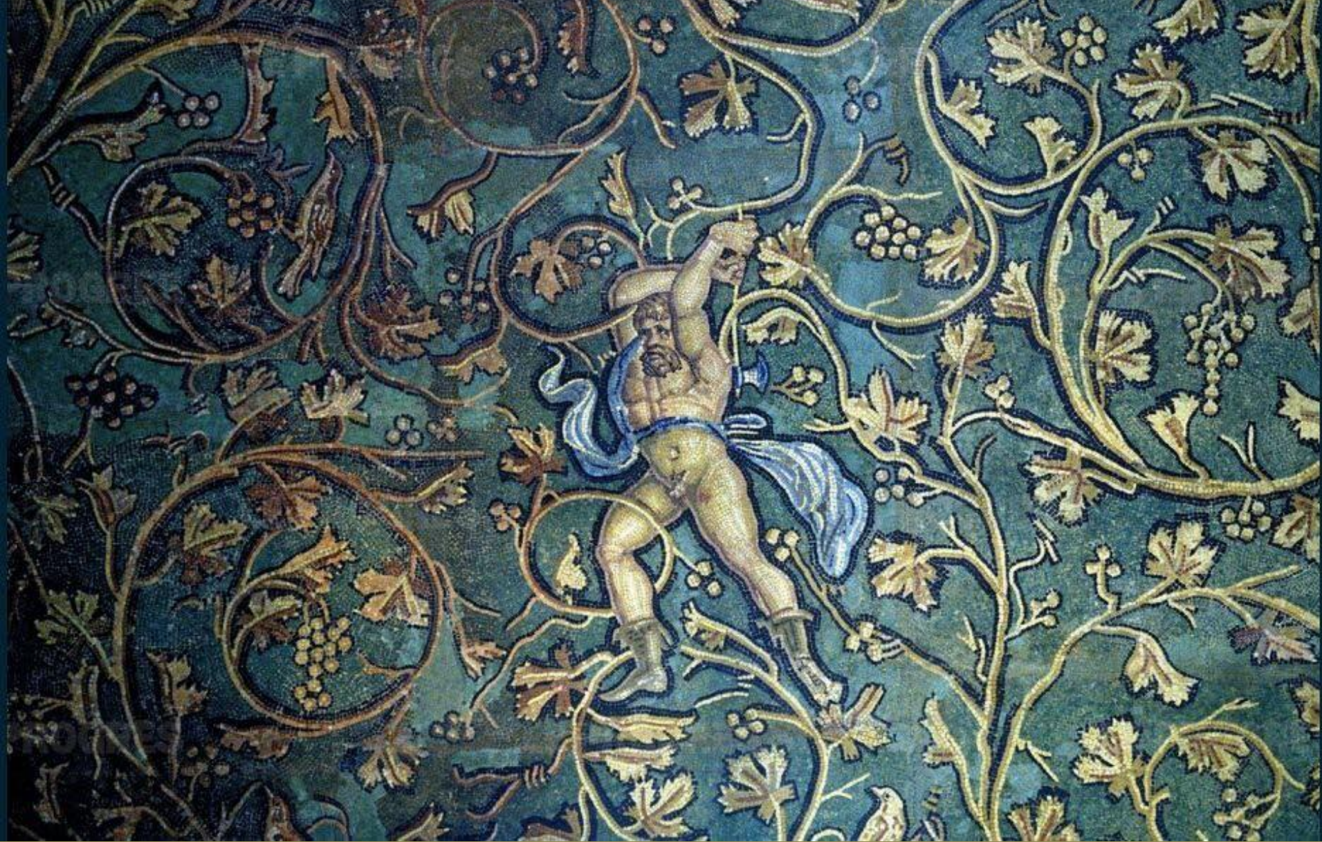
Gaule romaine, II e s., Mosaïque : le châtiment de Lycurgue , vers 130, marbres, Saint-Romain-en-Gal, musée archéologique.