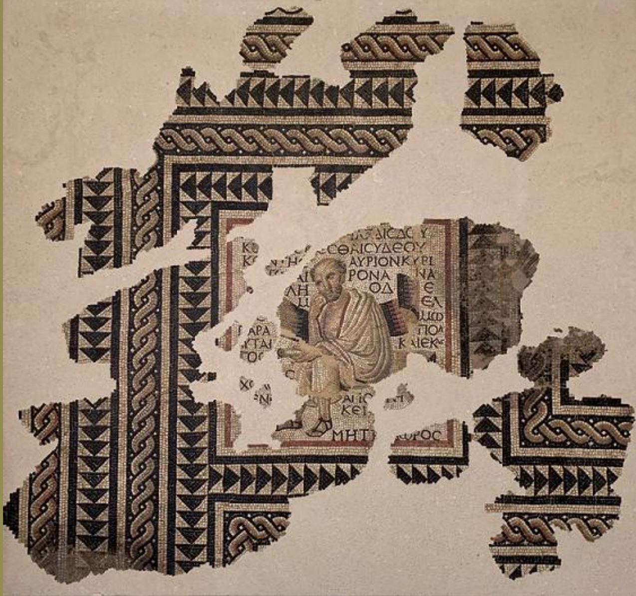
Gaule romaine, fin du IIe s., Mosaïque : Métrodore , vers 280, marbres, Autun, musée Rolin.