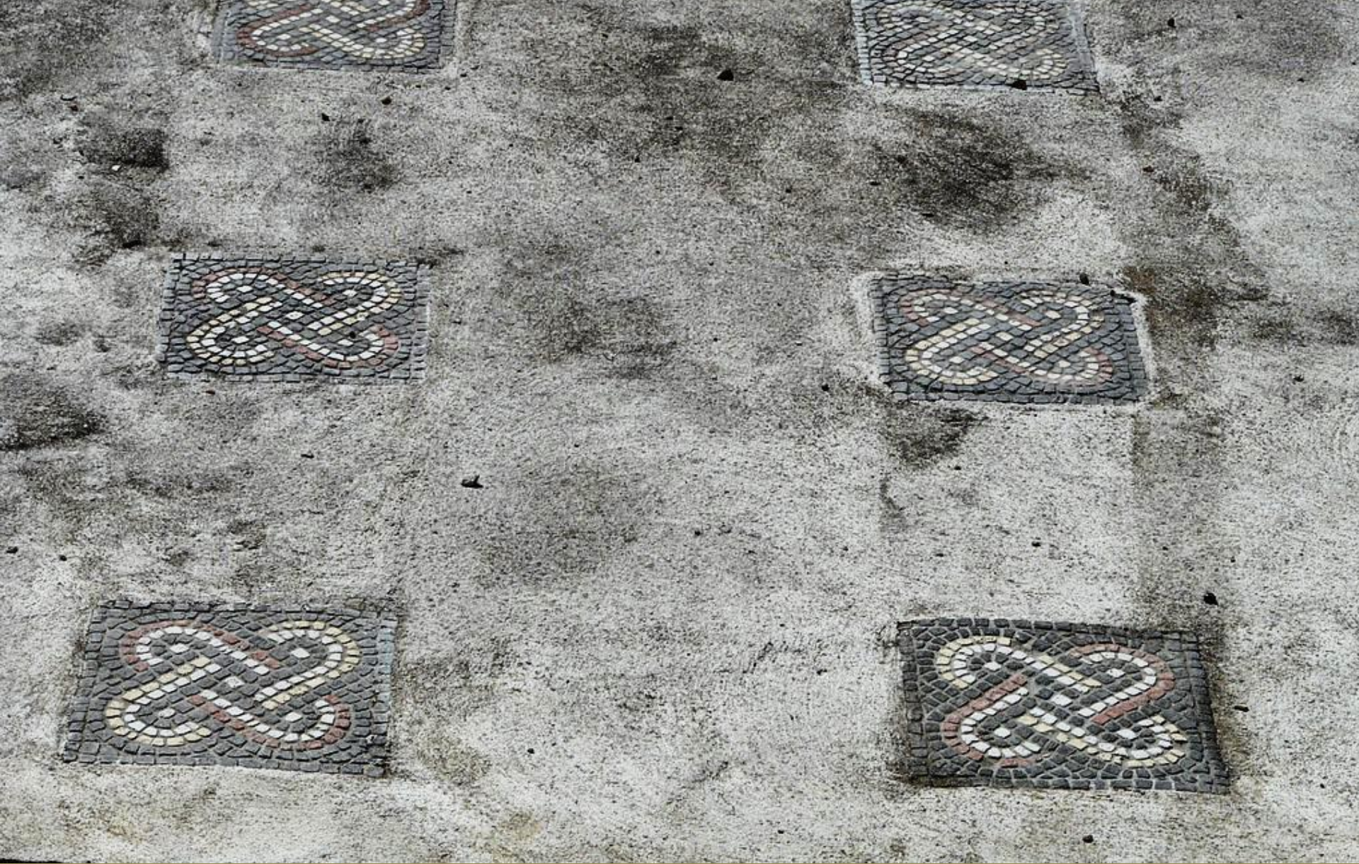
Gaule romaine, III e s., Opus tessellatum et opus incertum , vers 250, marbres et ciment, Montcaret, villa gallo-romaine.