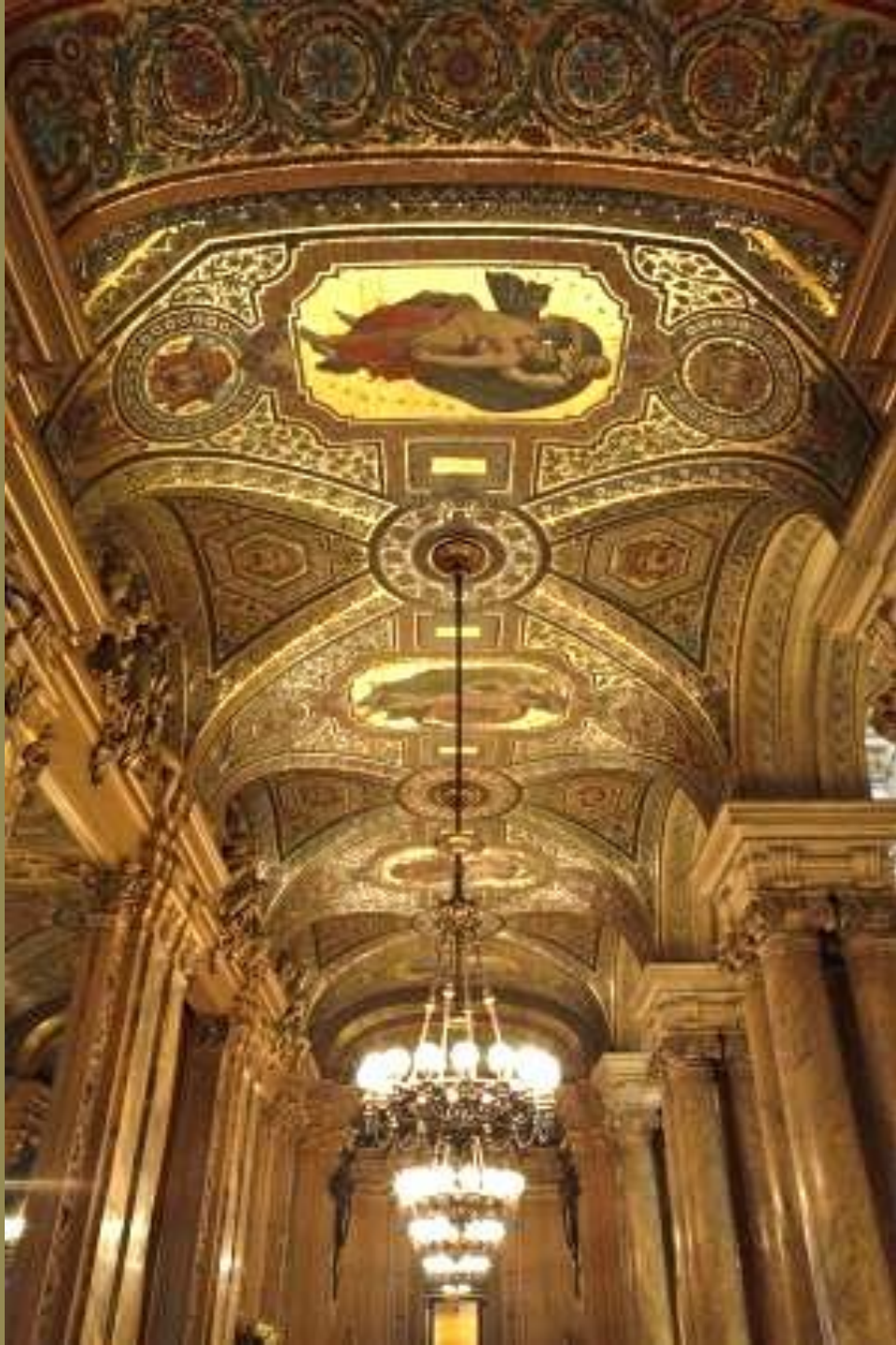
France, XIXe siècle, L'Avant-foyer des mosaïques , 1875, Paris, Opéra Garnier.