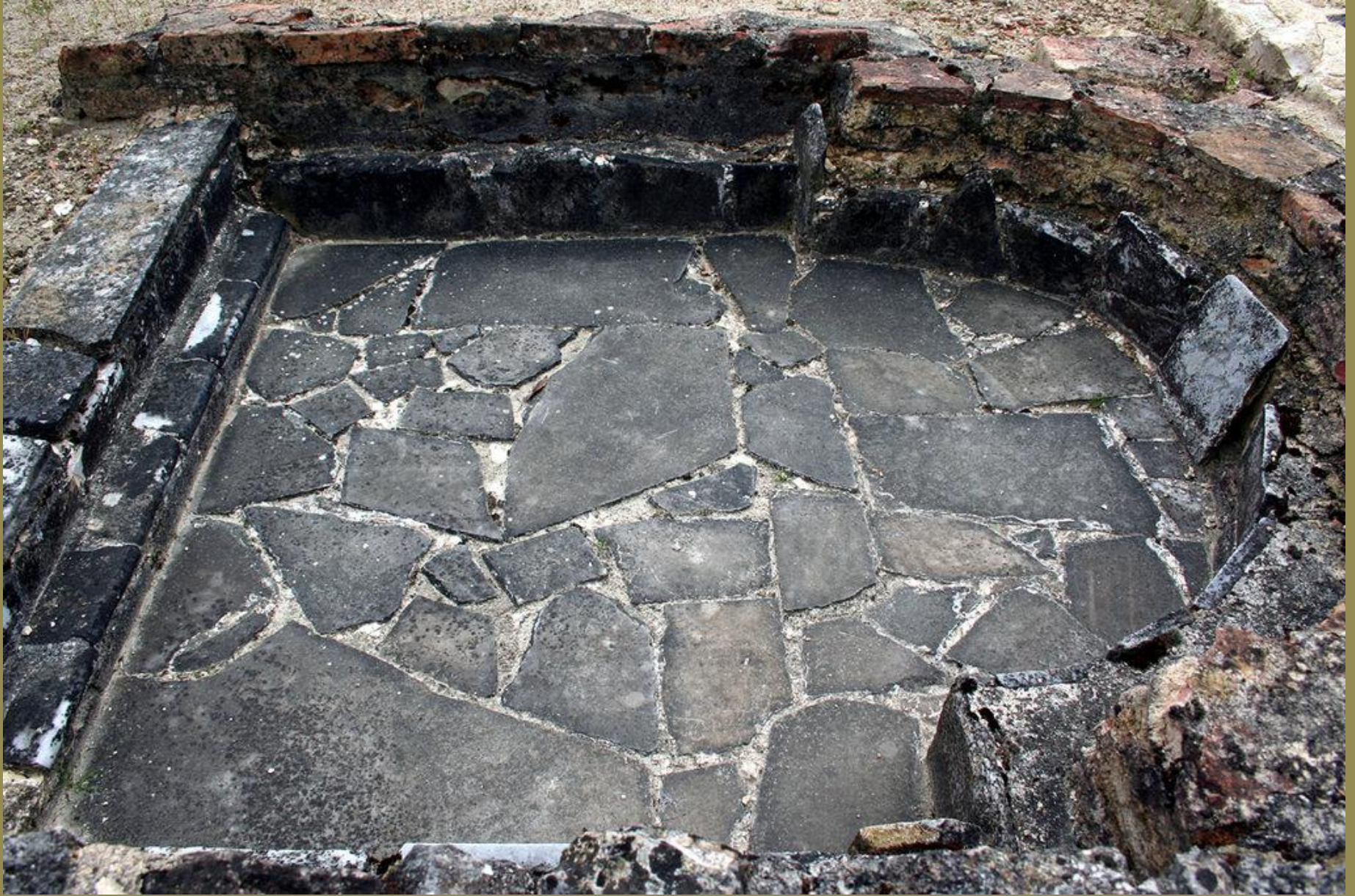
Gaule romaine, IV e s., Opus incertum , vers 380, grès, Montréal-sur-Gers, villa de Séviac.