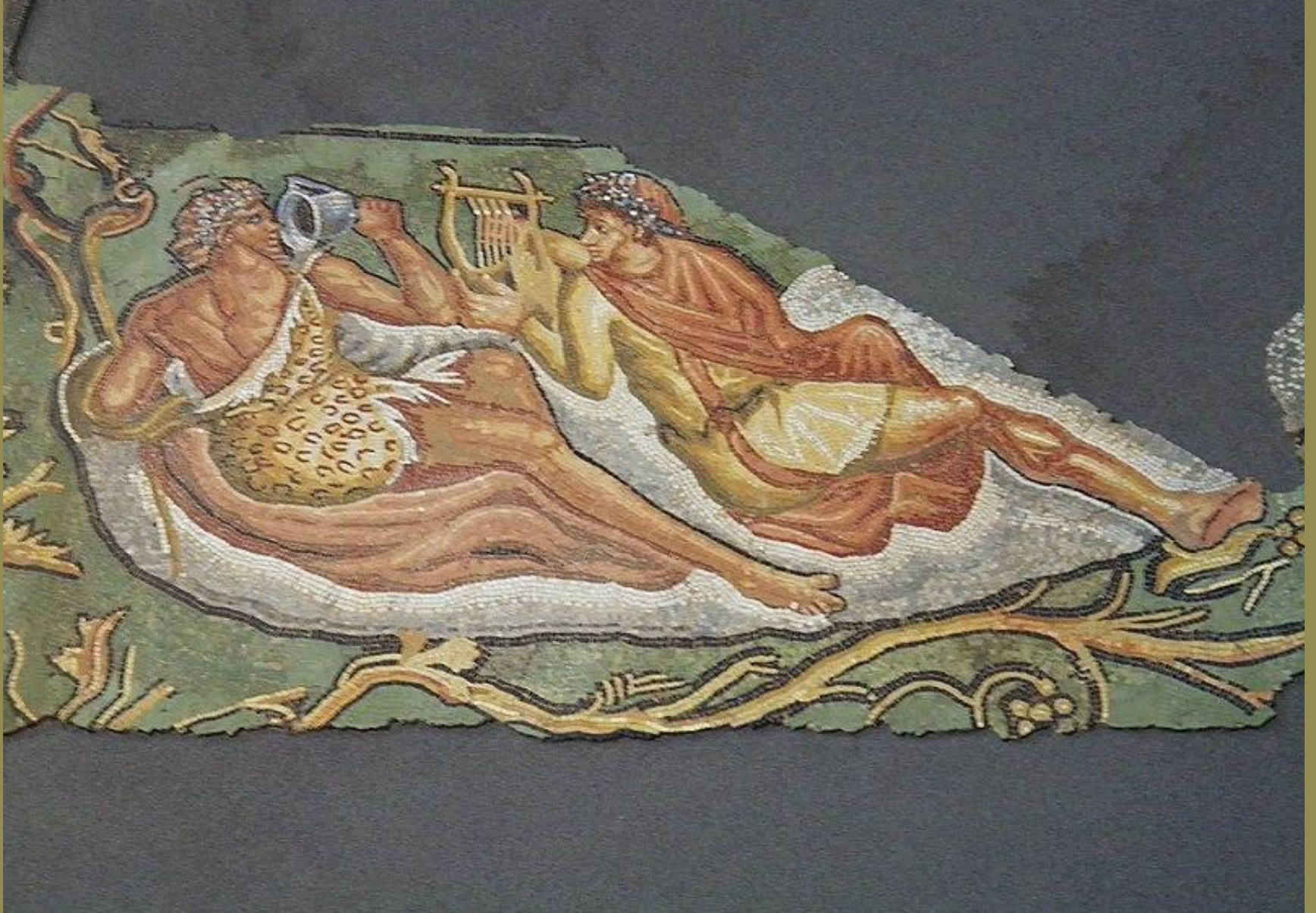
Gaule romaine, II e s., Mosaïque : le châtiement de Lycurgue , vers 130, marbres, Saint-Romain-en-Gal, musée archéologique.