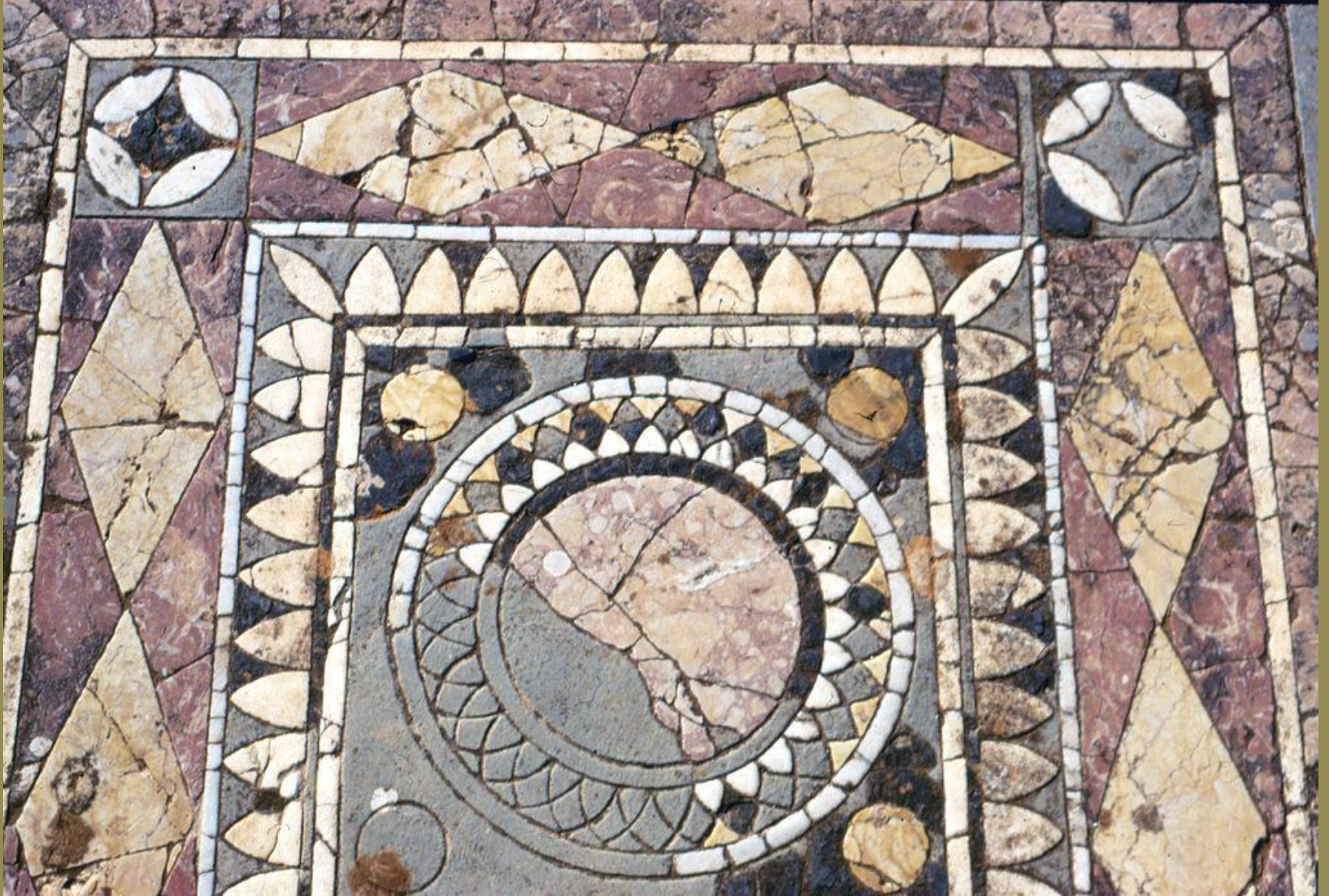
Afrique romaine, IIIe s., Opus sectile , vers 200, marbres, Cyrène (Lybie), insula de Jason.