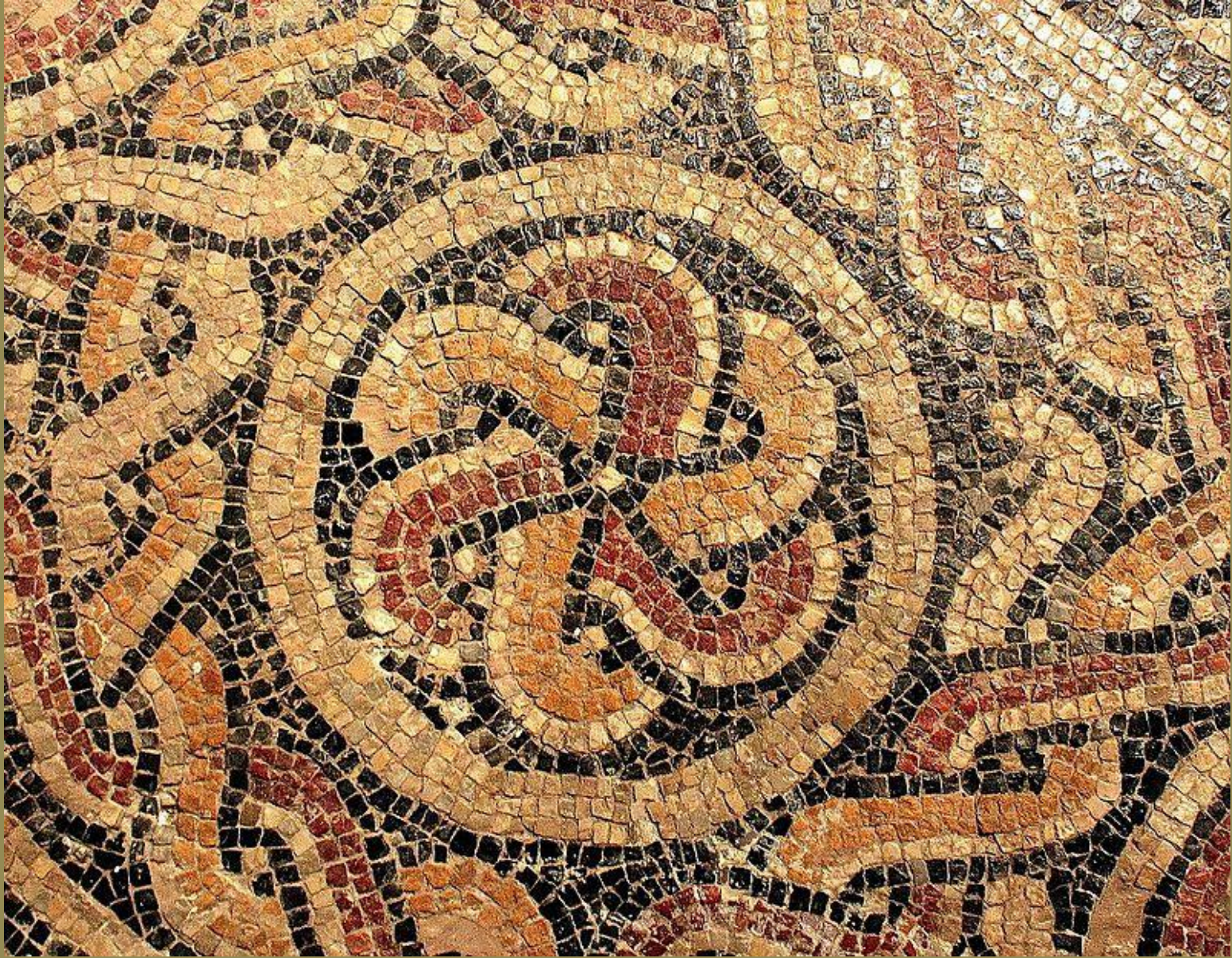
Espagne romaine, IIIe s., Opus tessellatum : Rosace , vers 200, marbres, Teruel-Calanda, Camino de Albalate.