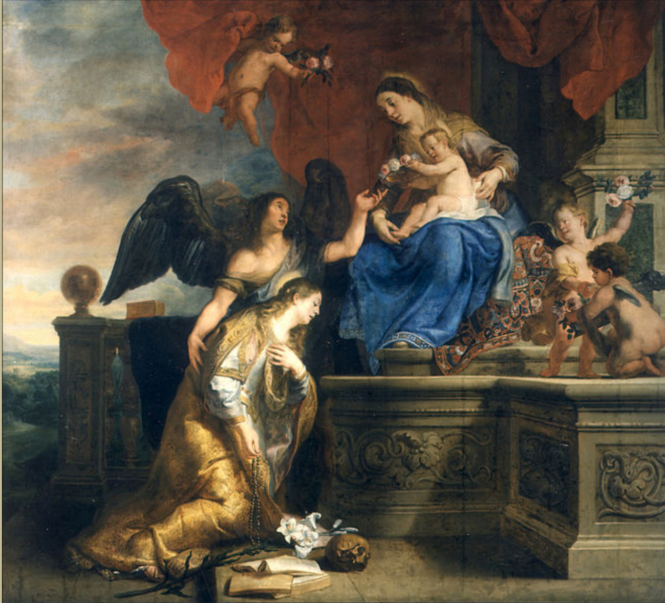
Gaspar de Crayer (Anvers, 1584 – Gand, 1669), Le Couronnement de sainte Rosalie , vers 16, peinture à l'huile sur toile, Gand, église Saint-Pierre.