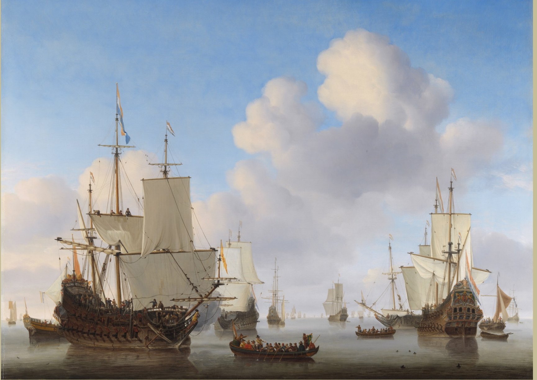
Willem van de Velde, dit le Jeune (Leyde, 1633 – Londres, 1707), Marine par temps calme , vers 1665, peinture à l'huile sur toile, Amsterdam, Rijksmuseum.