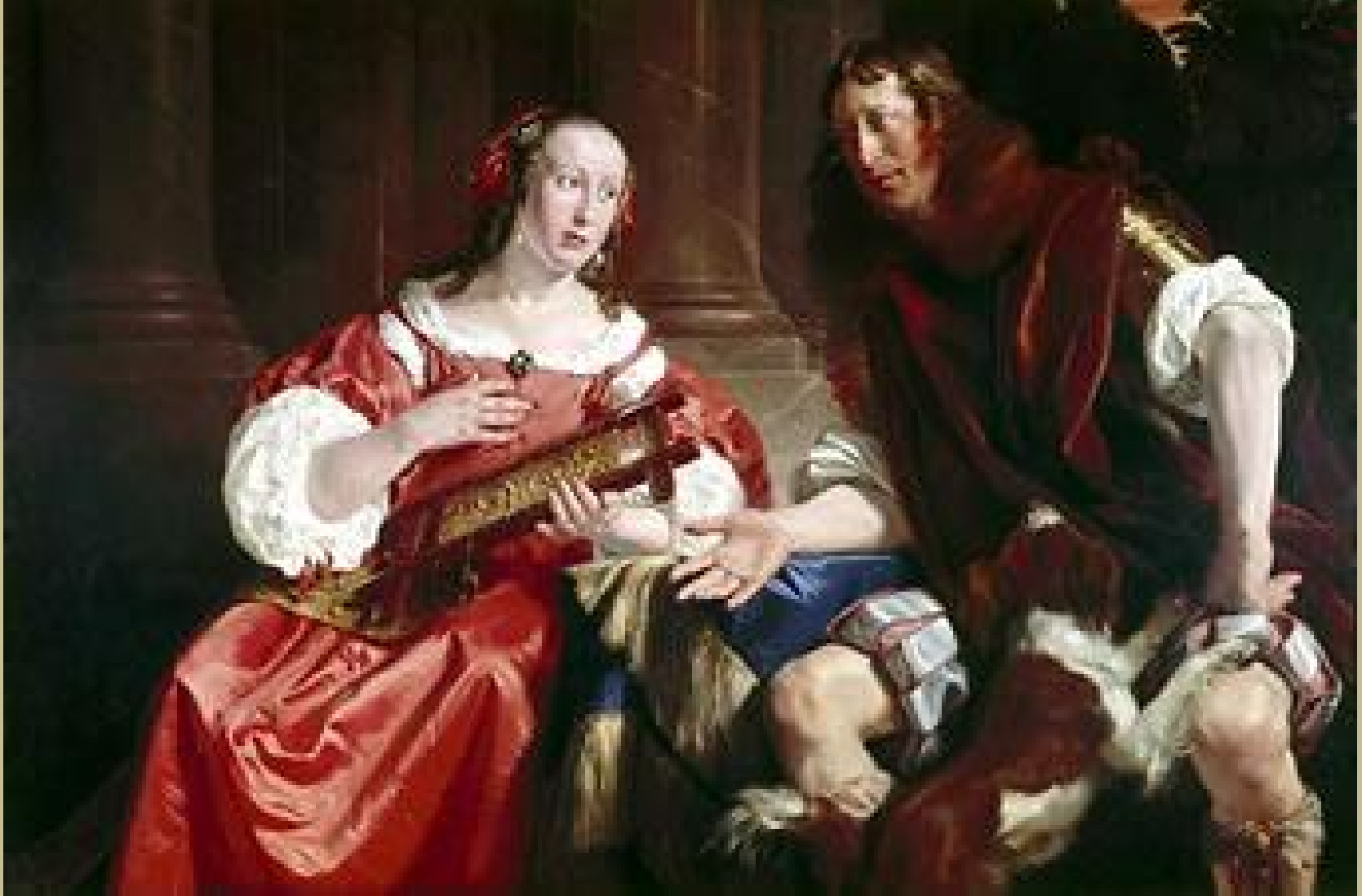
Jan de Bray (Haarlem, vers 1627 – Amsterdam, 1697), Couple en Ulysse et Pénélope , 1668, peinture à l'huile sur toile, Louisville, Speed Art Museum.