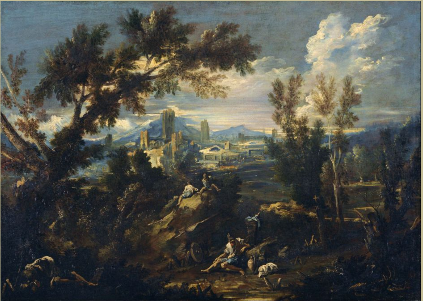
Alessandro Magnasco (Gênes, 1667 – Gênes, 1749), Paysage avec des bergers , 1718/25, peinture à l'huile sur toile, Tokyo, Musée national d'Art occidental.