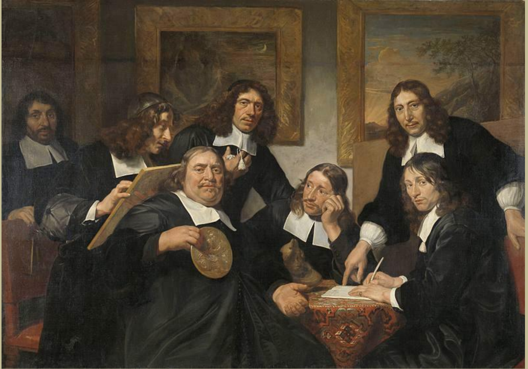
Jan de Bray (Haarlem, vers 1627 – Amsterdam, 1697), Les Gouverneurs de la Guilde de Saint-Luc à Haarlem , 1675, peinture à l'huile sur toile, Amsterdam, Rijksmuseum.