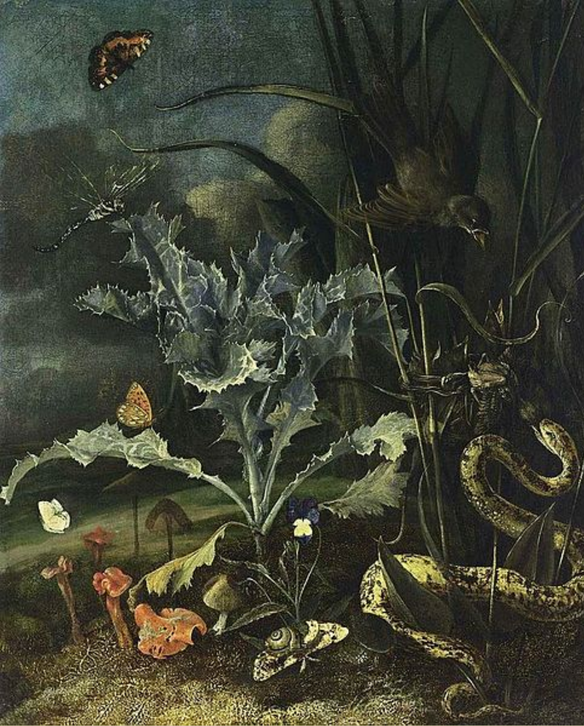
Otto Marseus van Schrieck (Nimègue, 1614/20 – Amsterdam, 1678), Flowers, plants et crapaud , 1660, peinture à l'huile sur toile, collection particulière.