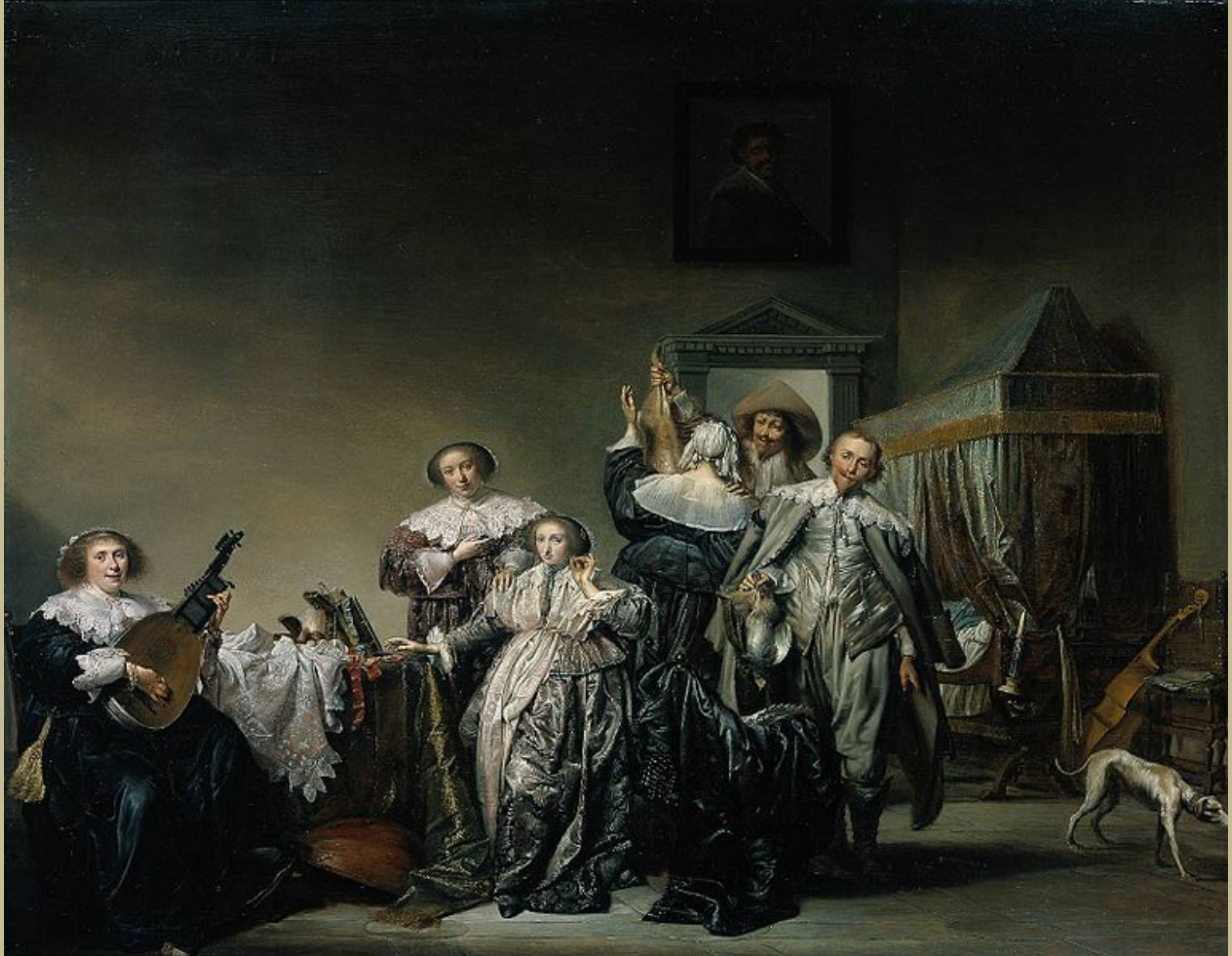
Pieter Codde (Amsterdam, 1599 – Amsterdam, 1678), Cavaliers et dames , 1633, peinture à l'huile sur bois, Amsterdam, Rijksmuseum.