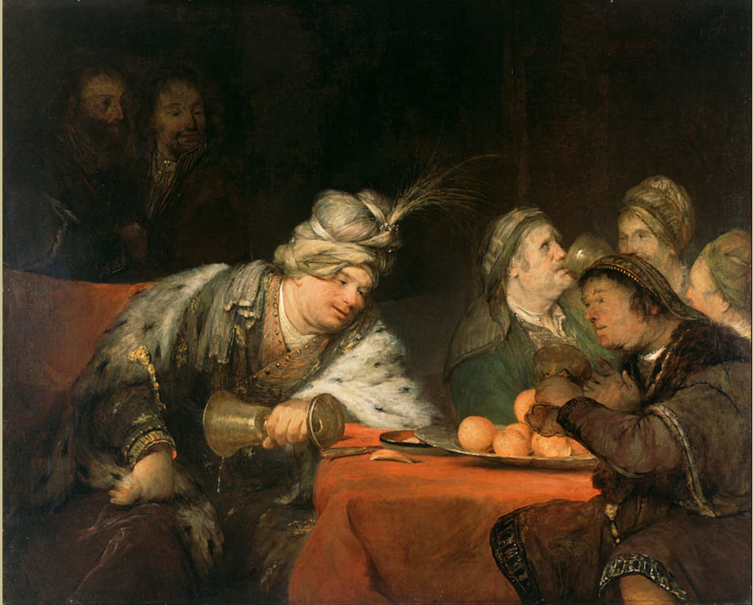
Aert de Gelder (Dordrecht, 1645 – Dordrecht, 1727), Le Banquet d'Assuérus , vers 1685, peinture à l'huile sur toile, Los Angeles, J. Paul Getty Museum.