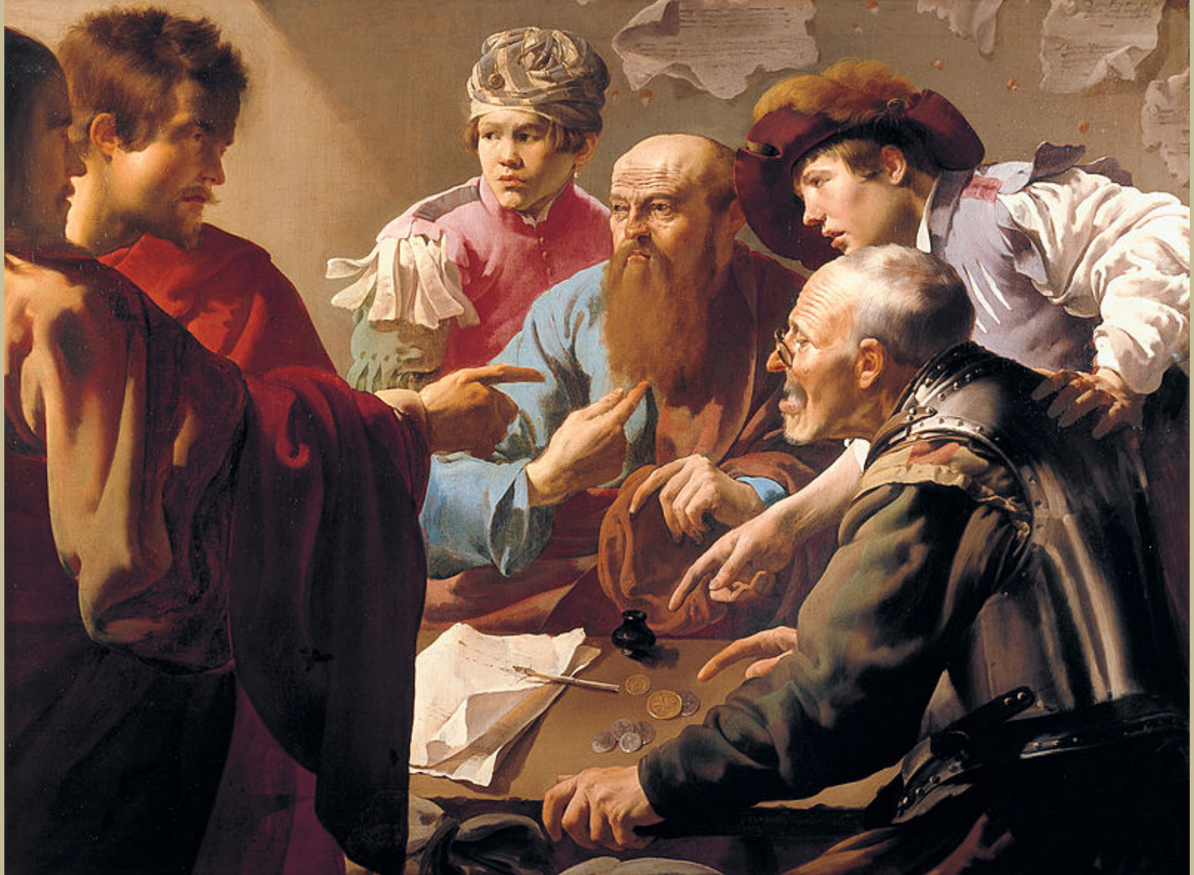
Hendrick Ter Brugghen (La Haye, 1588 – Utrecht, 1629), La Vocation de saint Matthieu , 1621, peinture à l'huile sur toile, Utrecht, Centraal Museum.