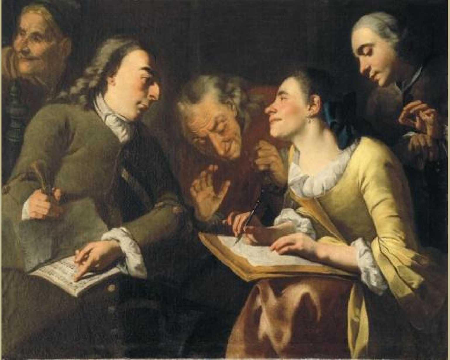
Gaspare Traversi (Naples, 1722 – Rome, 1770), La Séance de portrait , vers 1750, peinture à l'huile sur toile, Dijon, musée Magnin.