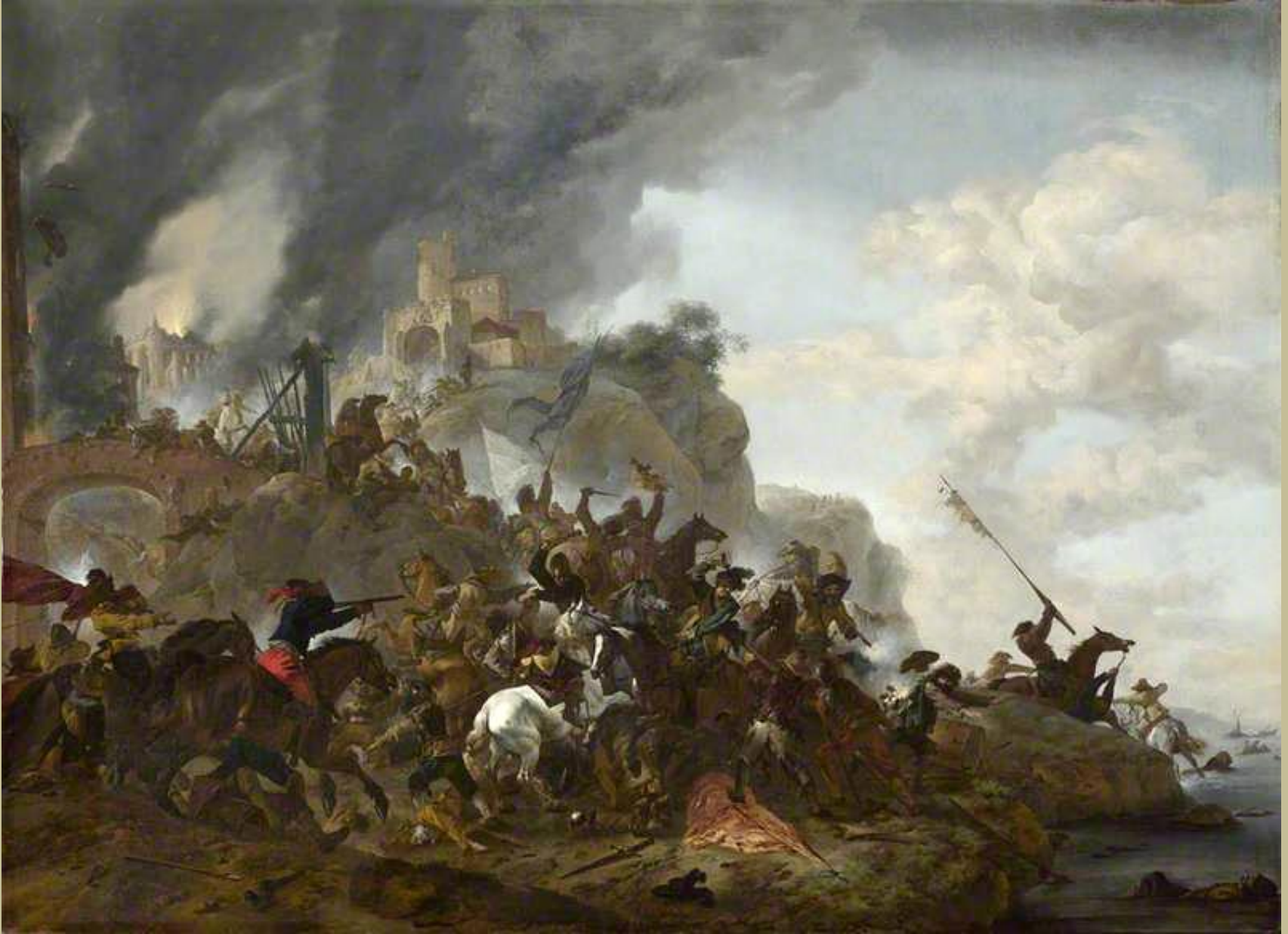
Philips Wouwermans (Haarlem, 1619 – Haarlem, 1668), Cavaliers tentant une sortie d'un fort , 1646, peinture à l'huile sur toile, Londres, National Gallery.