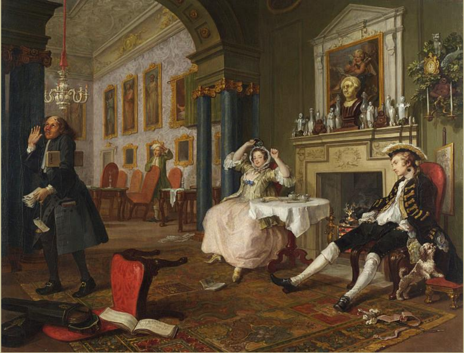
William Hogarth (Londres, 1697 – Londres, 1764), Le Mariage à la mode / 2 : Le Tête à tête , vers 1743, peinture à l'huile sur toile, Londres, National Gallery.