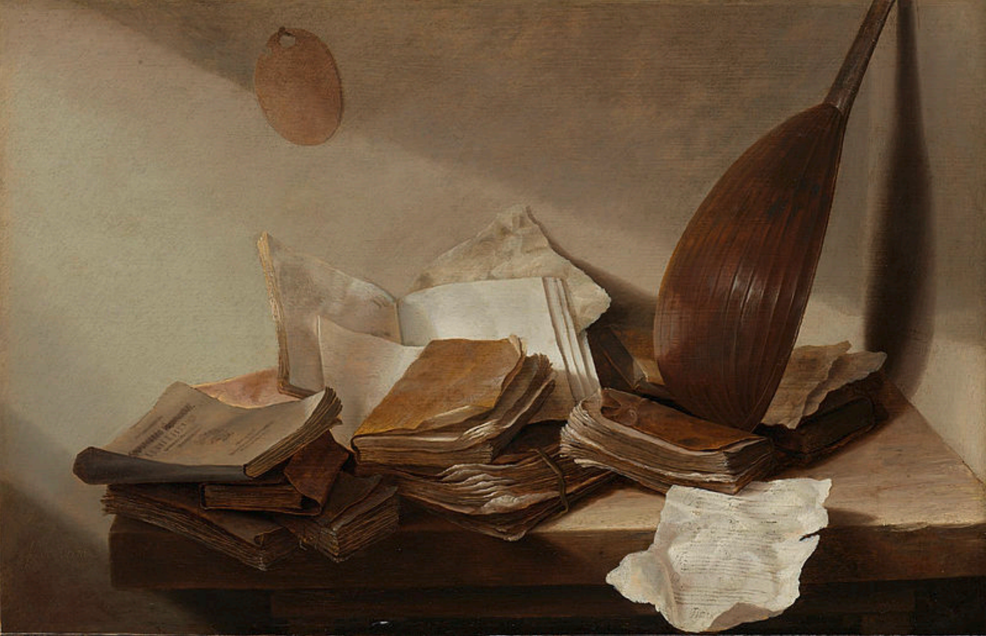
Jan Davidsz. de Heem (Utrecht, 1606 – Anvers, 1683/4), Nature morte au luth , vers 1625/30, peinture à l'huile sur bois, Amsterdam, Rijksmuseum.