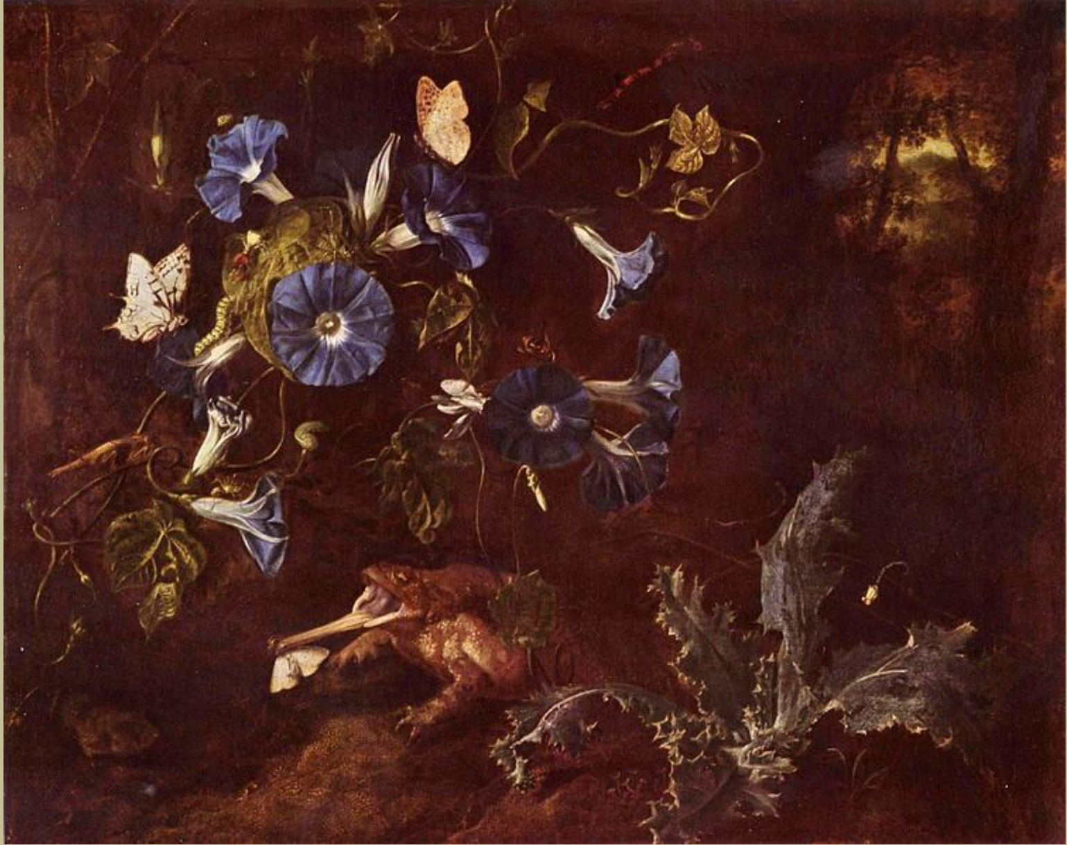
Otto Marseus van Schrieck (Nimègue, 1614/20 – Amsterdam, 1678), Fleurs, plantes, papillons et crapaud , 1660, peinture à l'huile sur toile, Schwerin, Staatliches Museum.