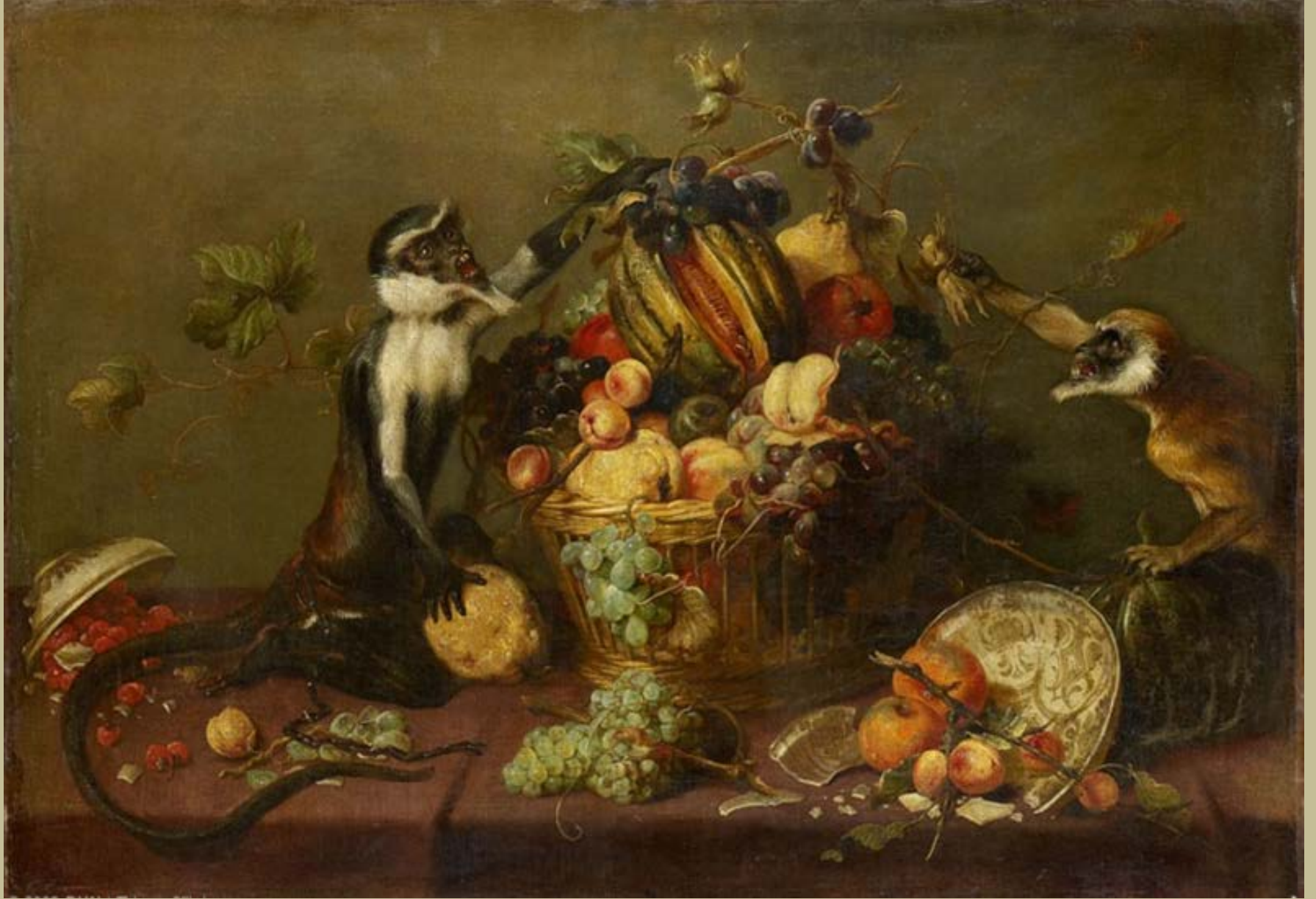
Frans Snyder (Anvers, 1579 – Anvers, 1657), Deux singes pillant une corbeille de fruits , vers 1640, peinture à l'huile sur toile, Paris, musée du Louvre.