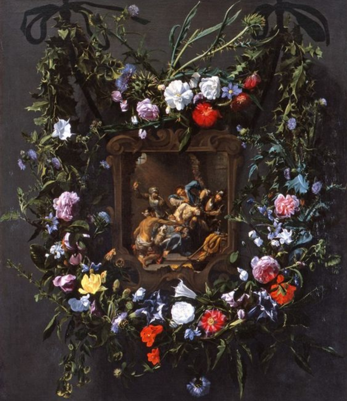
Daniel Seghers (Anvers, 1590 – Anvers, 1661), & Simon de Vos (Anvers, 1603 – Anvers, 1676), Guirlande de fleurs entourant un médaillon avec le Christ aux outrages, vers 1643, peinture à l'huile sur toile, Durham, Nasher Museum of Art.