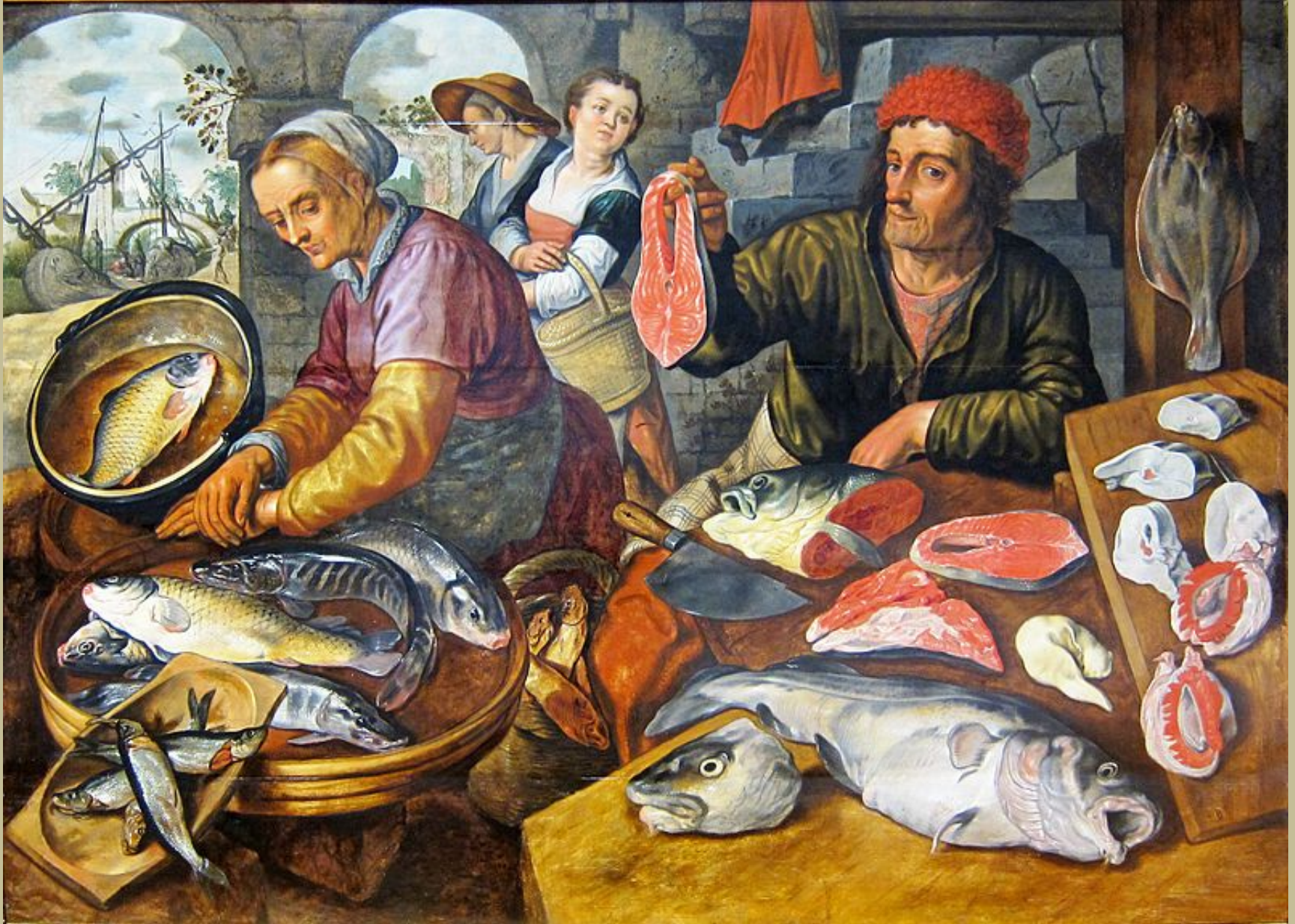
Joachim Beuckelaer (Anvers, vers 1533 – Anvers, 1575), Marché aux poissons, 1568, peinture à l'huile sur bois, Strasbourg, musée des Beaux-Arts.