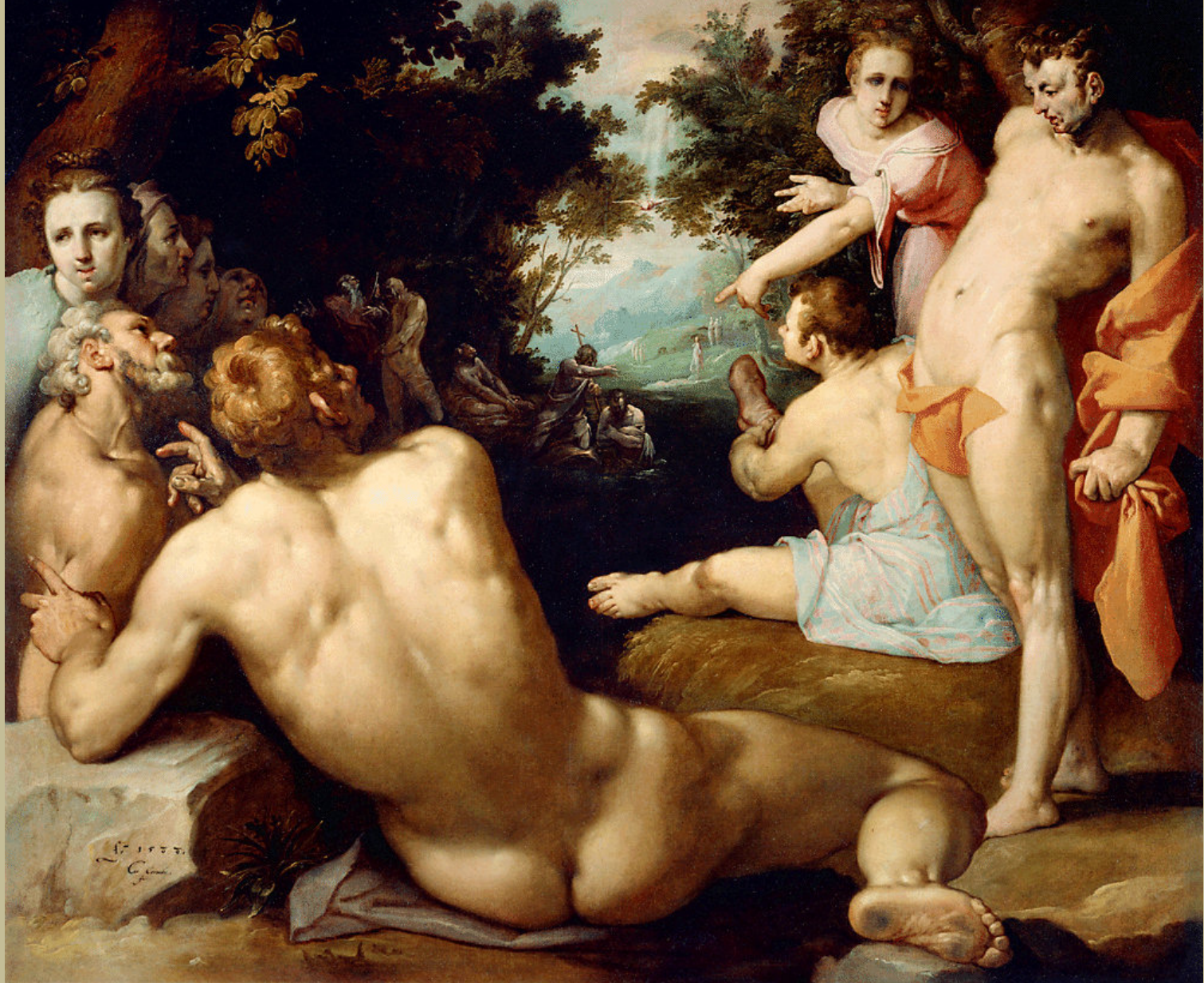
Cornelis van Haarlem ((Haarlem, 1562 – Haarlem, 1638), Le Baptême du Christ , 1588, peinture à l'huile sur toile, Paris, musée du Louvre.