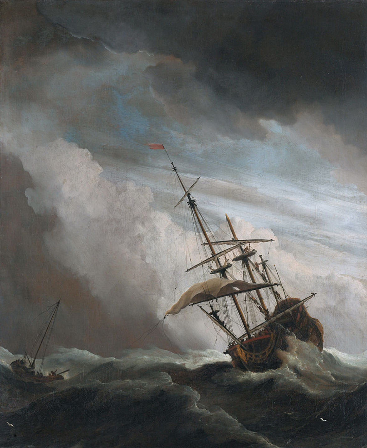
Willem van de Velde, dit le Jeune (Leyde, 1633 – Londres, 1707), La Tempête , vers 1680, peinture à l'huile sur toile, Amsterdam, Rijksmuseum.