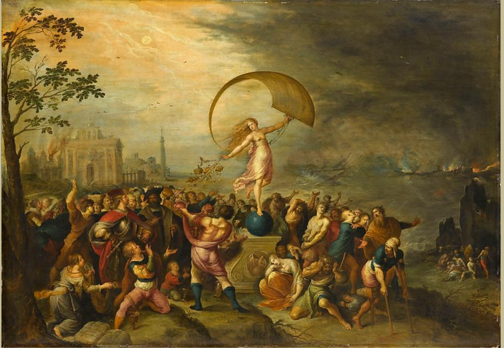
Frans Francken le Jeune (Anvers, 1581 – Anvers, 1642), Allégorie de la Fortune , 1615/20, peinture à l'huile sur cuivre, Paris, musée du Louvre.