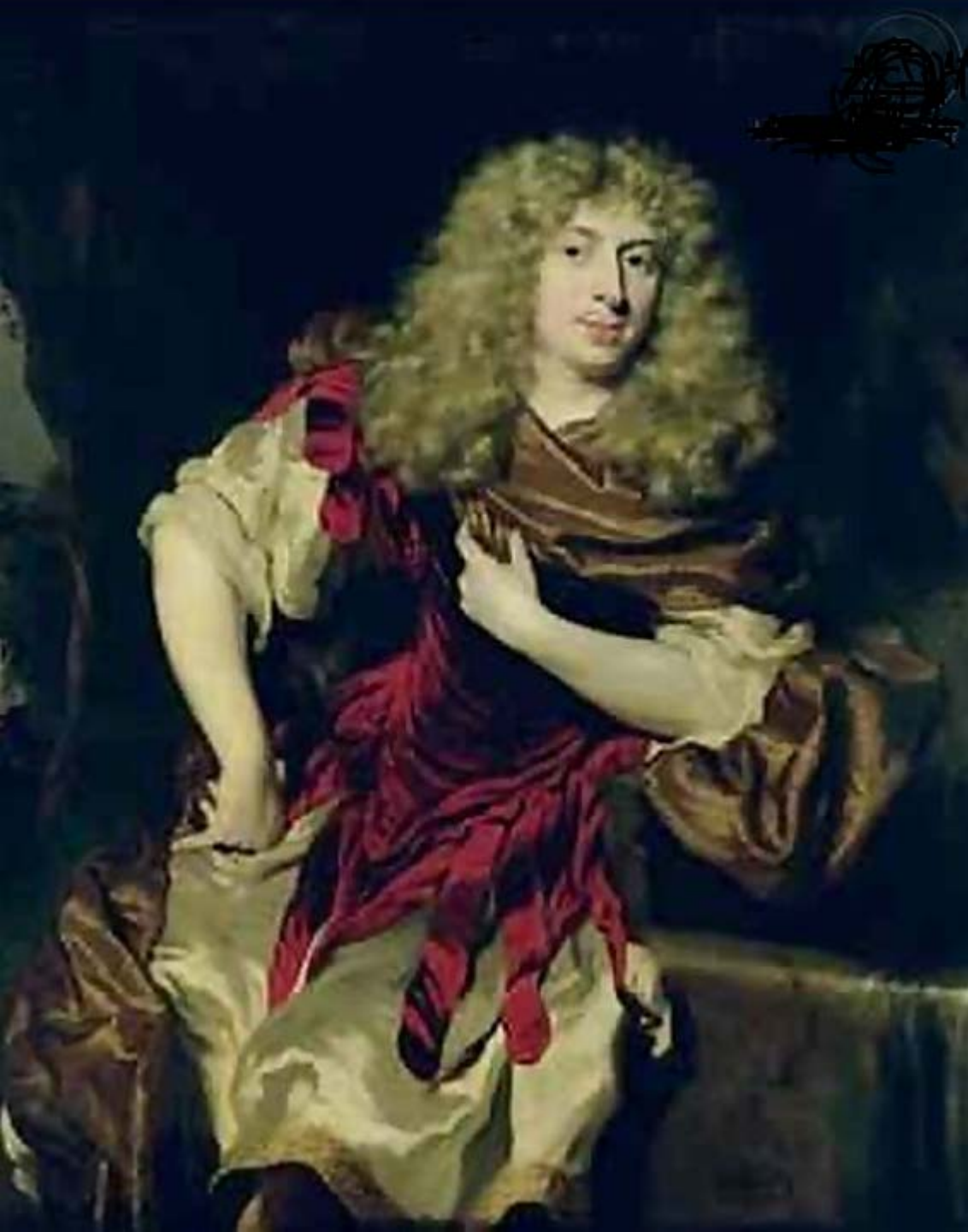
Nicolas Maes (Dordrecht, 1634 – Amsterdam, 1693), Portrait d'homme , 1676, peinture à l'huile sur toile, Hambourg, Kunsthalle.