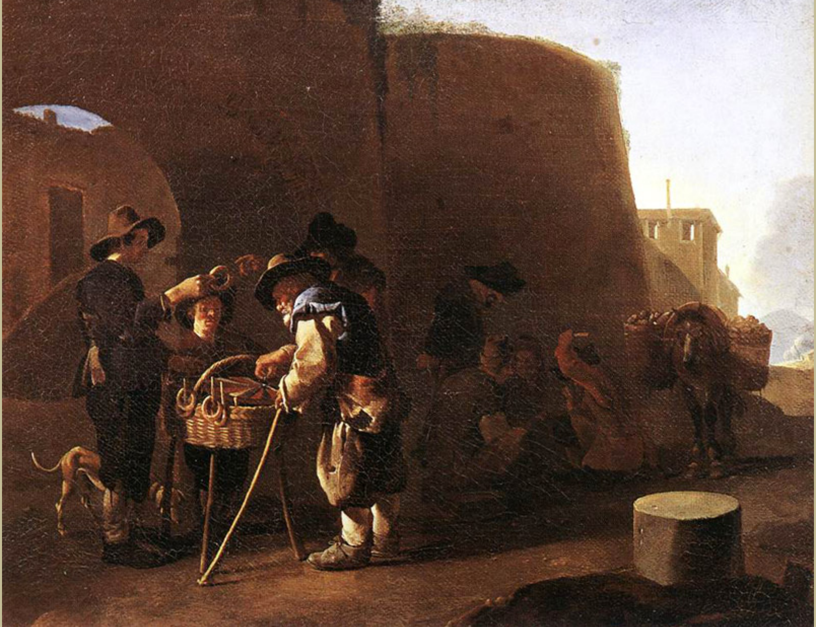
Pieter van Laer, dit Le Bamboche (Haarlem, 1599 – Haarlem ?, 1642 ?), Vendeur de gâteaux , vers 1630/40, peinture à l'huile sur toile, Rome, Galerie nationale d'Art ancien.