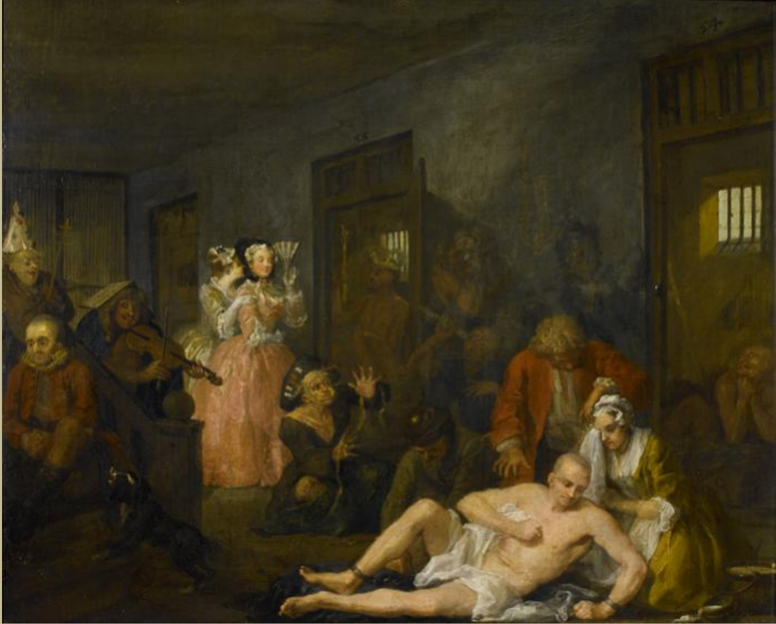
William Hogarth (Londres, 1697 – Londres, 1764), Le « Rake's Progress » / 8 : L'Asile des fous , vers 1743, peinture à l'huile sur toile, Londres, Sir John Soane's Museum.