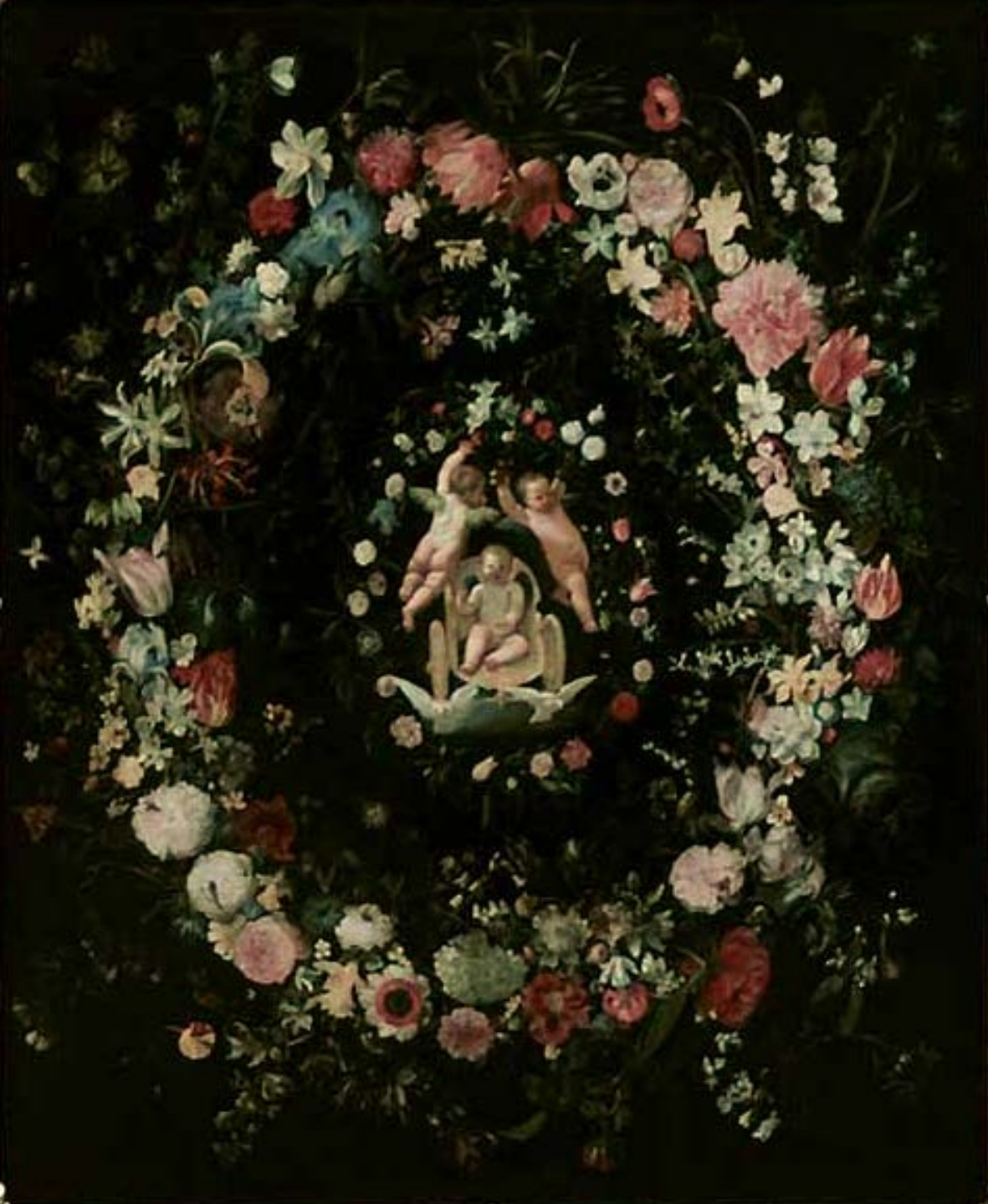
Daniel Seghers (Anvers, 1590 – Anvers, 1661), & Domenico Zampieri, dit Le Dominiquin (Bologne, 1581 – Naples, 1641), Guirlande de fleurs entourant un médaillon avec le triomphe de l'Amour , vers 1625/7 & vers 1630, peinture à l'huile sur toile, Paris, musée du Louvre.