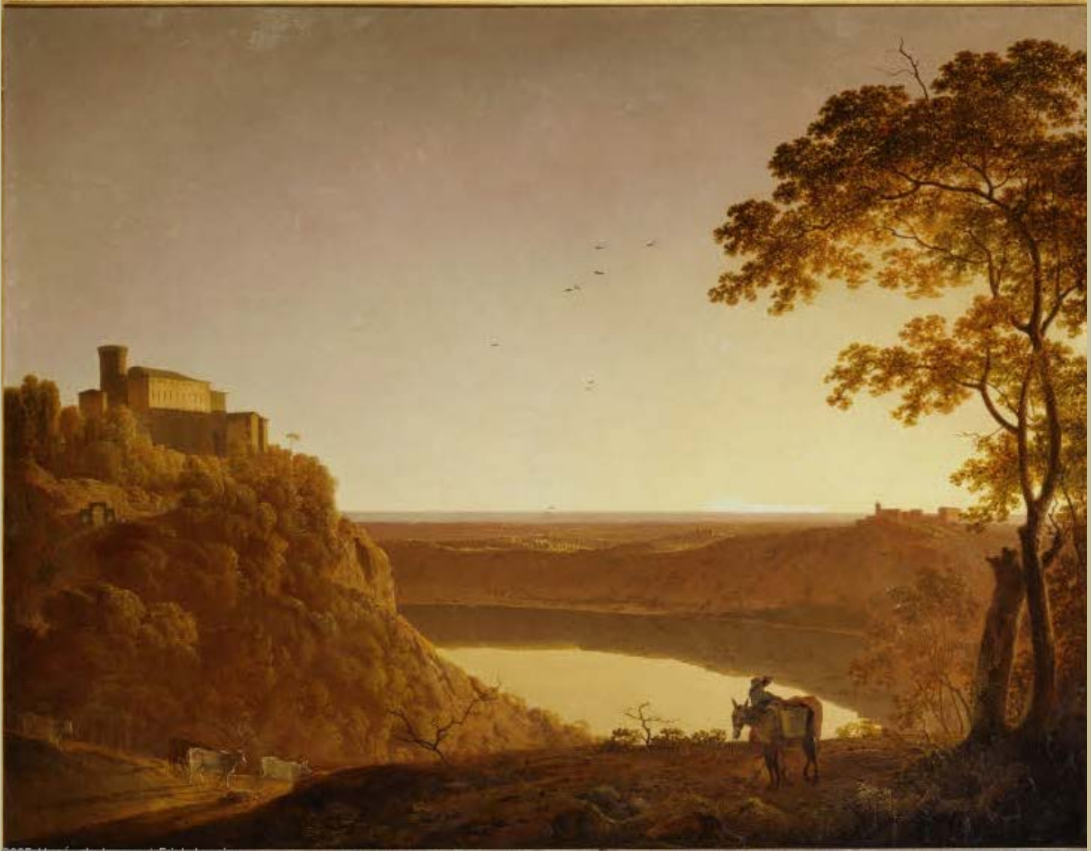
Joseph Wright of Derby (Derby, 1734 – Derby, 1797), Vue du lac de Nemi au soleil couchant , vers 1790, peinture à l'huile sur toile, Paris, musée du Louvre.