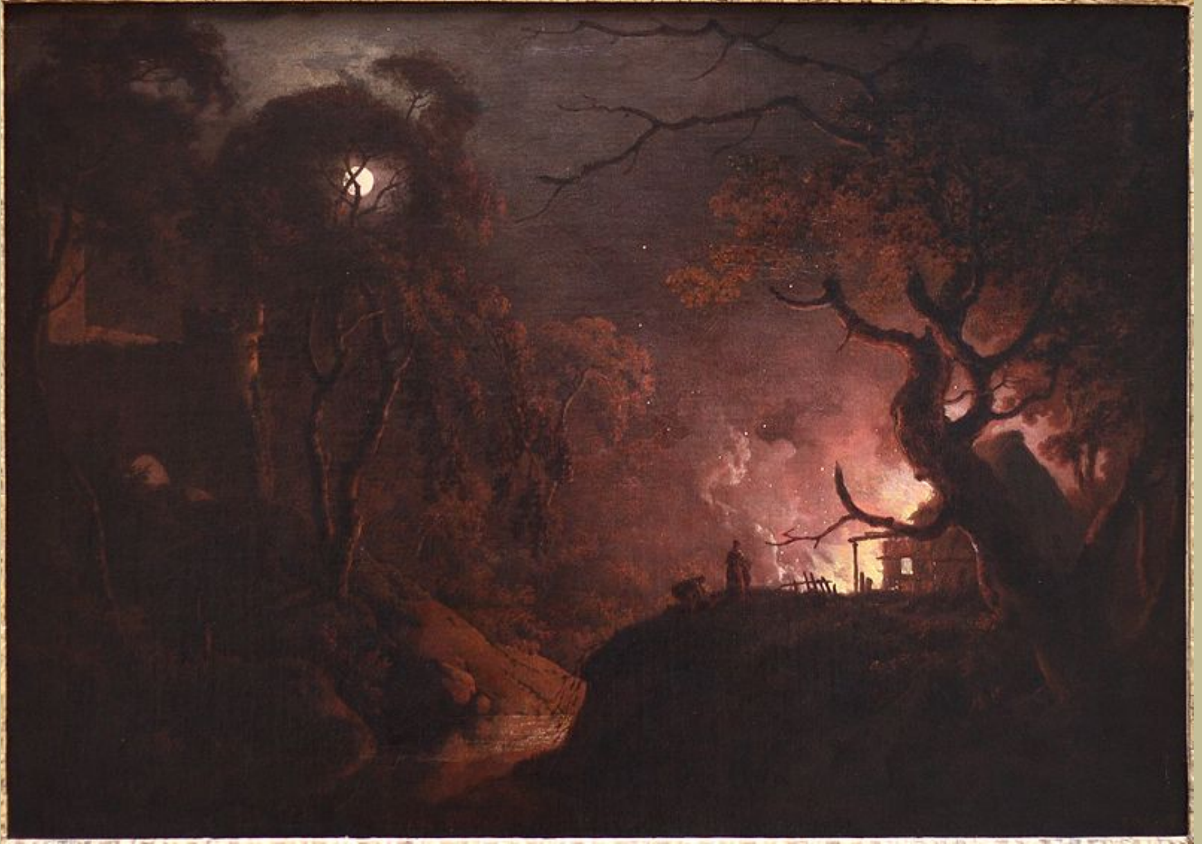
Joseph Wright of Derby (Derby, 1734 – Derby, 1797), Ferme en feu la nuit , 1785/93, peinture à l'huile sur toile, New Haven, The Yale Center for British Art.