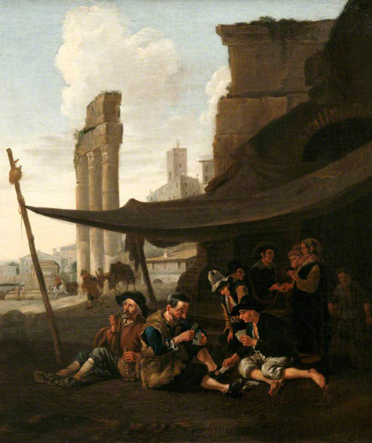
Pieter van Laer, dit Le Bamboche (Haarlem, 1599 – Haarlem ?, 1642 ?), Vendeur de gâteaux , vers 1630/40, peinture à l'huile sur toile, Rome, Galerie nationale d'Art ancien.