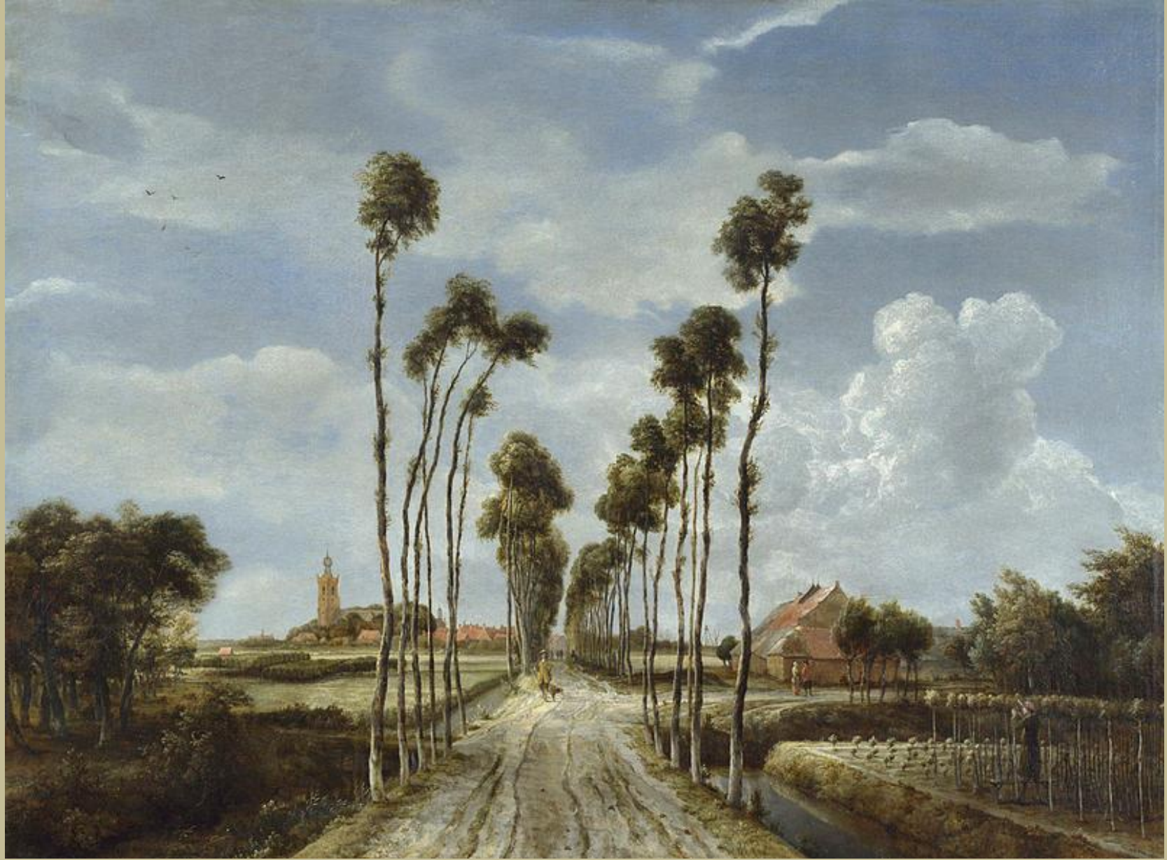
Meindert Hobbema (Amsterdam, 1638 – Amsterdam, 1709), L'Allée de Middelhamis , 1689, peinture à l'huile sur toile, Londres, National Gallery.