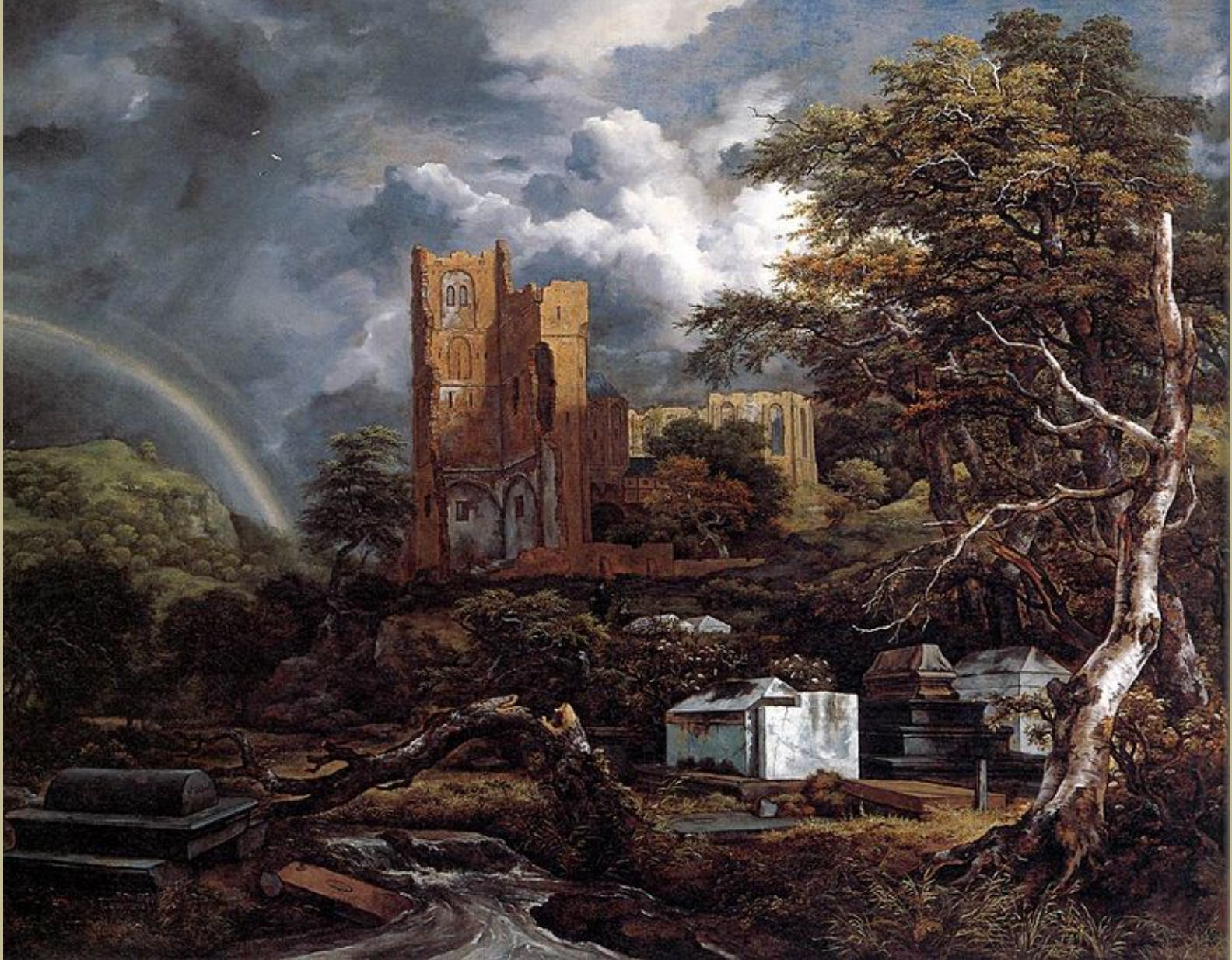
Jacob Isaaksz. van Ruisdael (Haarlem ?, 1628/9 – Amsterdam, 1682), Le Cimetière juif , vers 1654/5, peinture à l'huile sur toile, Detroit, Institute of Arts.