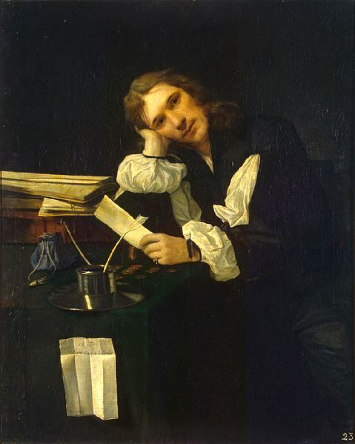
Michael Sweerts (Bruxelles, 1618 – Goa, 1664), Portrait de jeune homme, 1656, peinture à l'huile sur toile, Saint-Pétersbourg, musée de l'Ermitage.