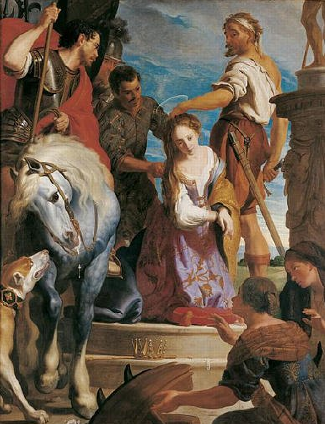
Gaspar de Crayer (Anvers, 1584 – Gand, 1669), Le Martyre de sainte Catherine, vers 1640, peinture à l'huile sur toile, Grenoble, musée.