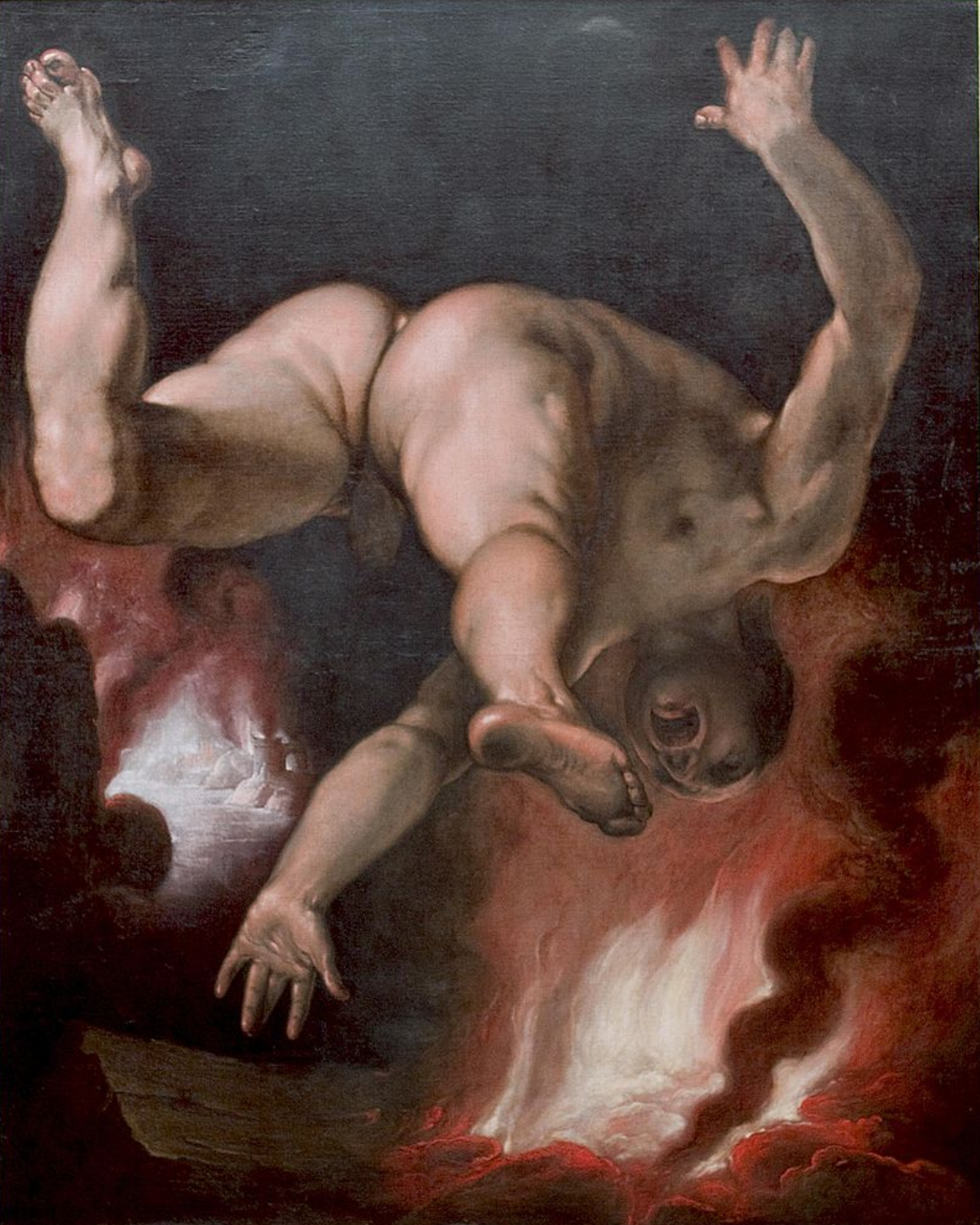
Cornelis van Haarlem (Haarlem, 1562 – Haarlem, 1638), La Chute d'Ixion , 1582/8, peinture à l'huile sur toile, Rotterdam, musée Boymans-Van Beuningen.