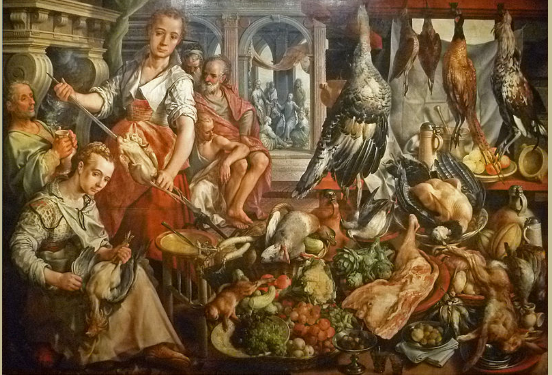
Joachim Beuckelaer (Anvers, vers 1533 – Anvers, 1575), Vue d'une cuisine, avec Jésus chez Marthe et Marie, 1566, peinture à l'huile sur bois, Amsterdam, Rijksmuseum.