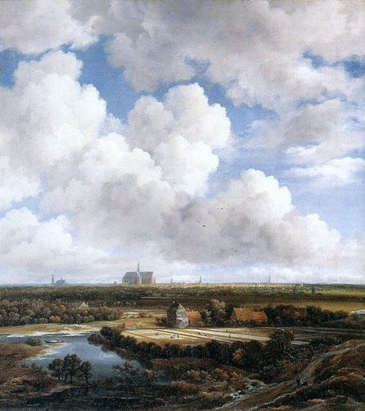
Jacob Isaaksz. van Ruisdael (Haarlem, 1628/9 – Amsterdam, 1682), Vue de Haarlem , vers 1665, peinture à l'huile sur toile, Zurich, Kunsthauus.