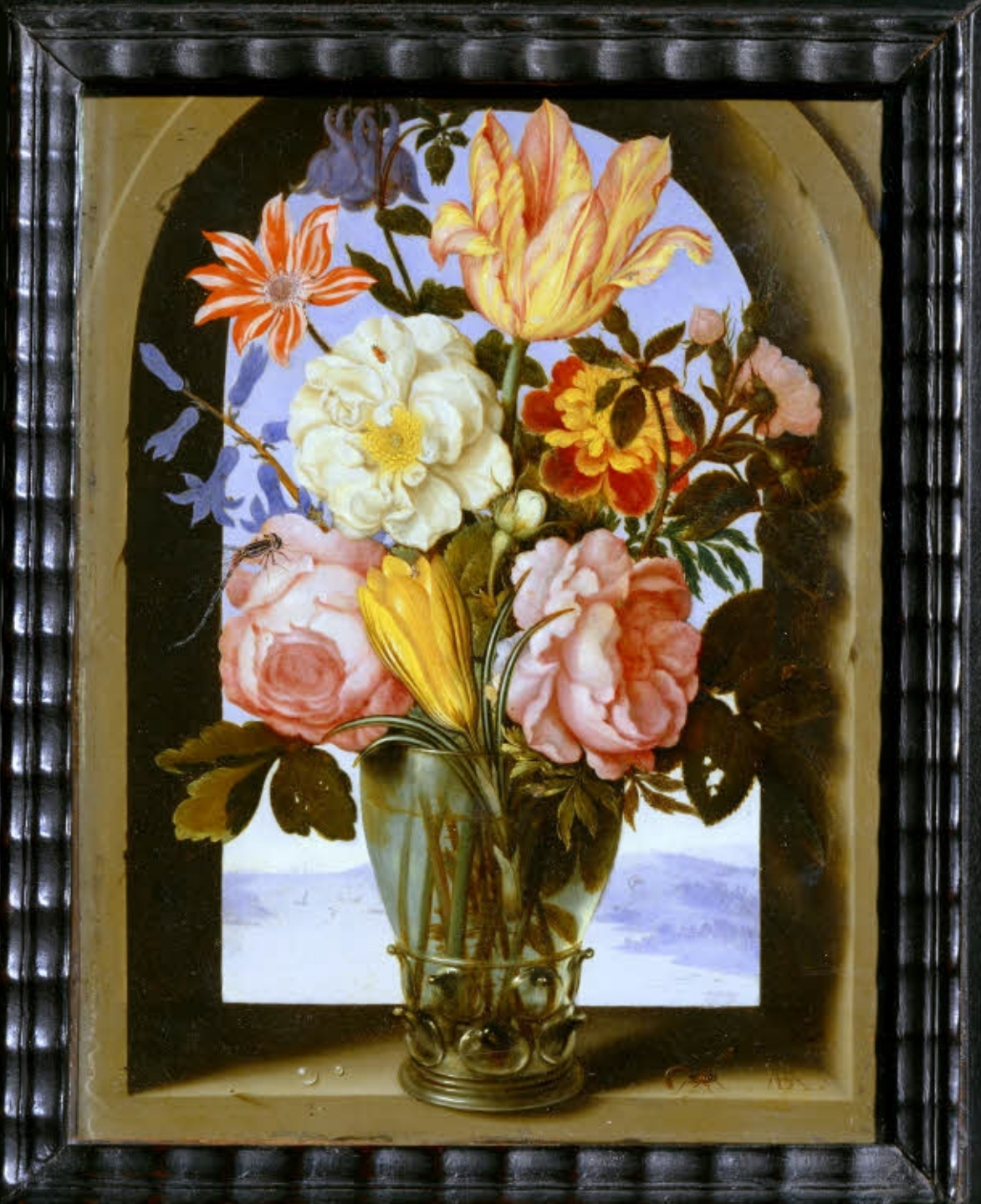
Ambrosius Bosschaert l'Ancien (Anvers, 1573 – La Haye, 1621), Bouquet de fleurs , vers 1619/21, peinture à l'huile sur cuivre, Paris, musée du Louvre.