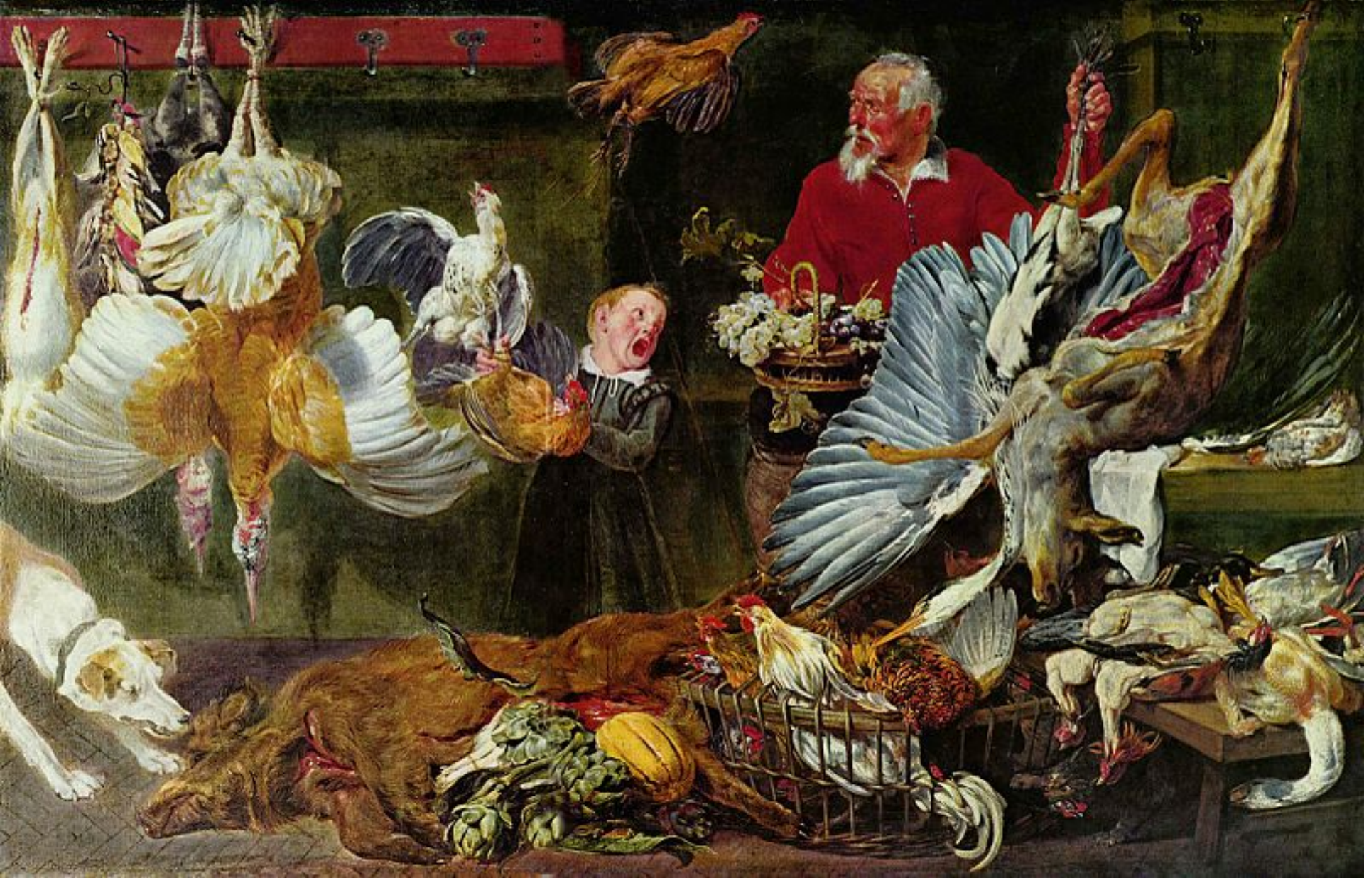
Frans Snyders (Anvers, 1579 – Anvers, 1657), Vendeur de gibier , vers 1640, peinture à l'huile sur toile, Oslo, Galerie nationale.