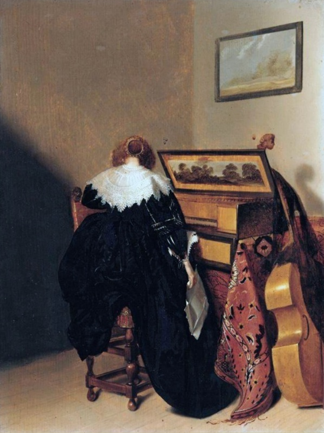
Pieter Codde (Amsterdam, 1599 – Amsterdam, 1678), Femme au virginal , vers 1650, peinture à l'huile sur bois, collection particulière.