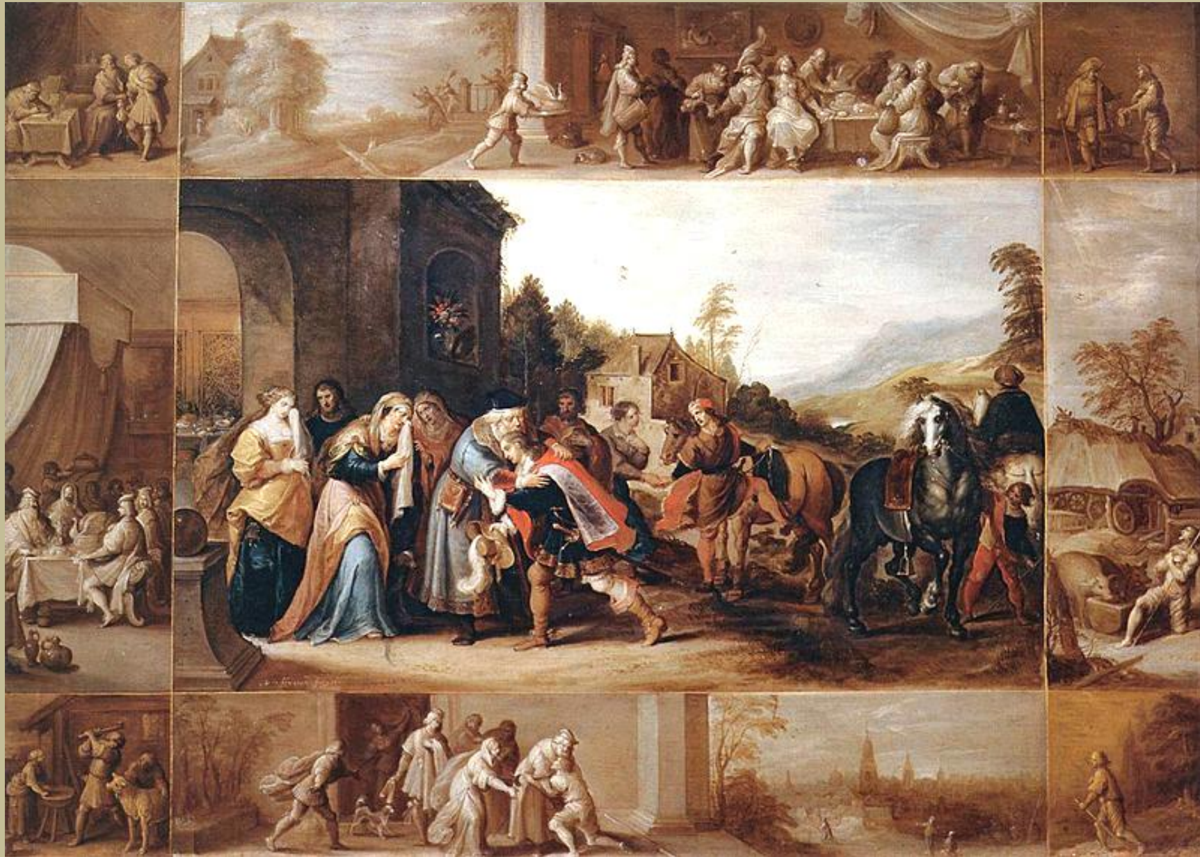
Frans Francken le Jeune (Anvers, 1581 – Anvers, 1642), La Parole du fils prodigue , 1633, peinture à l'huile sur bois, Paris, musée du Louvre.