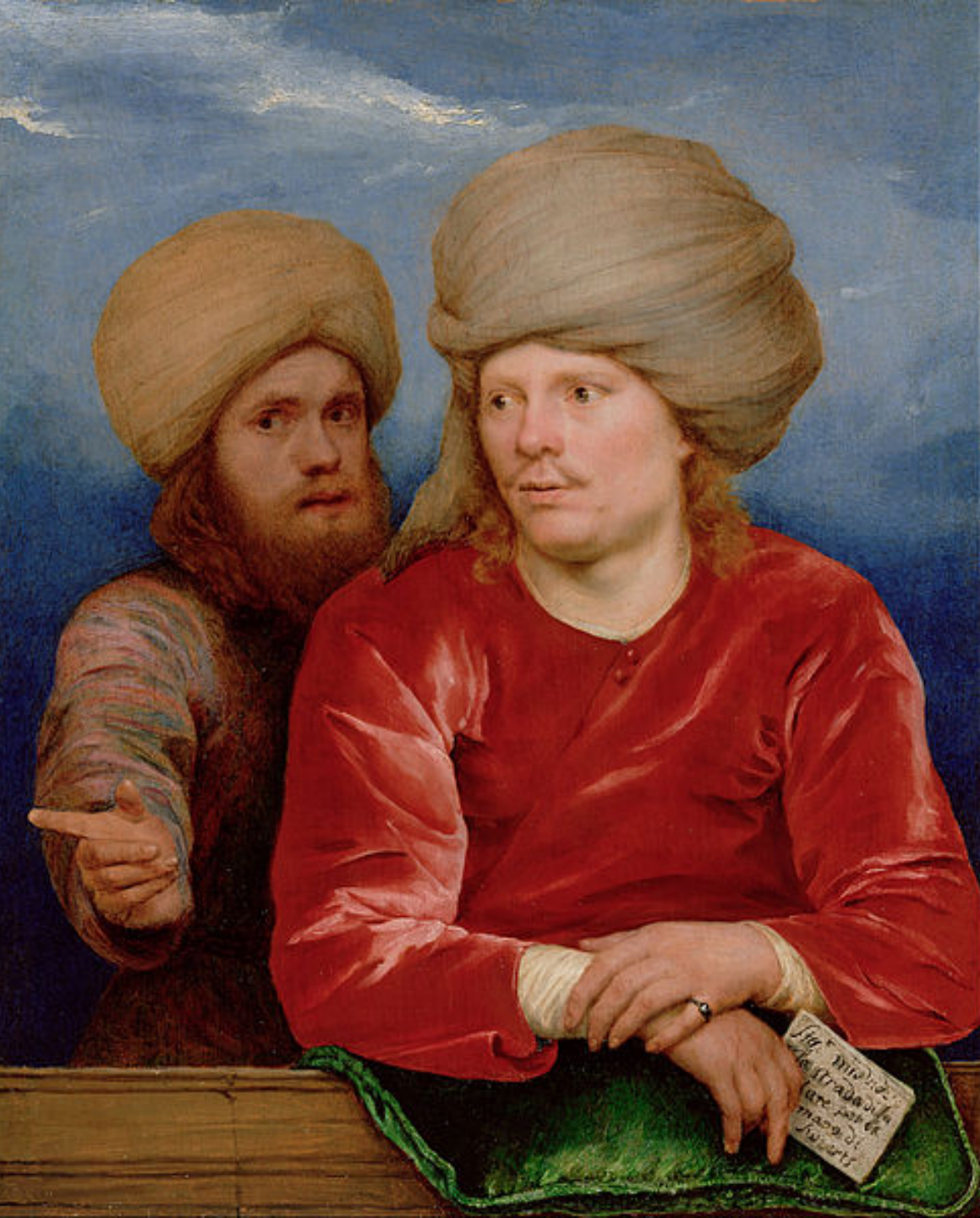
Michael Sweerts (Bruxelles, 1618 – Goa, 1664), Double portrait , 1660/2, peinture à l'huile sur bois, Los Angeles, J. Paul Getty Museum.