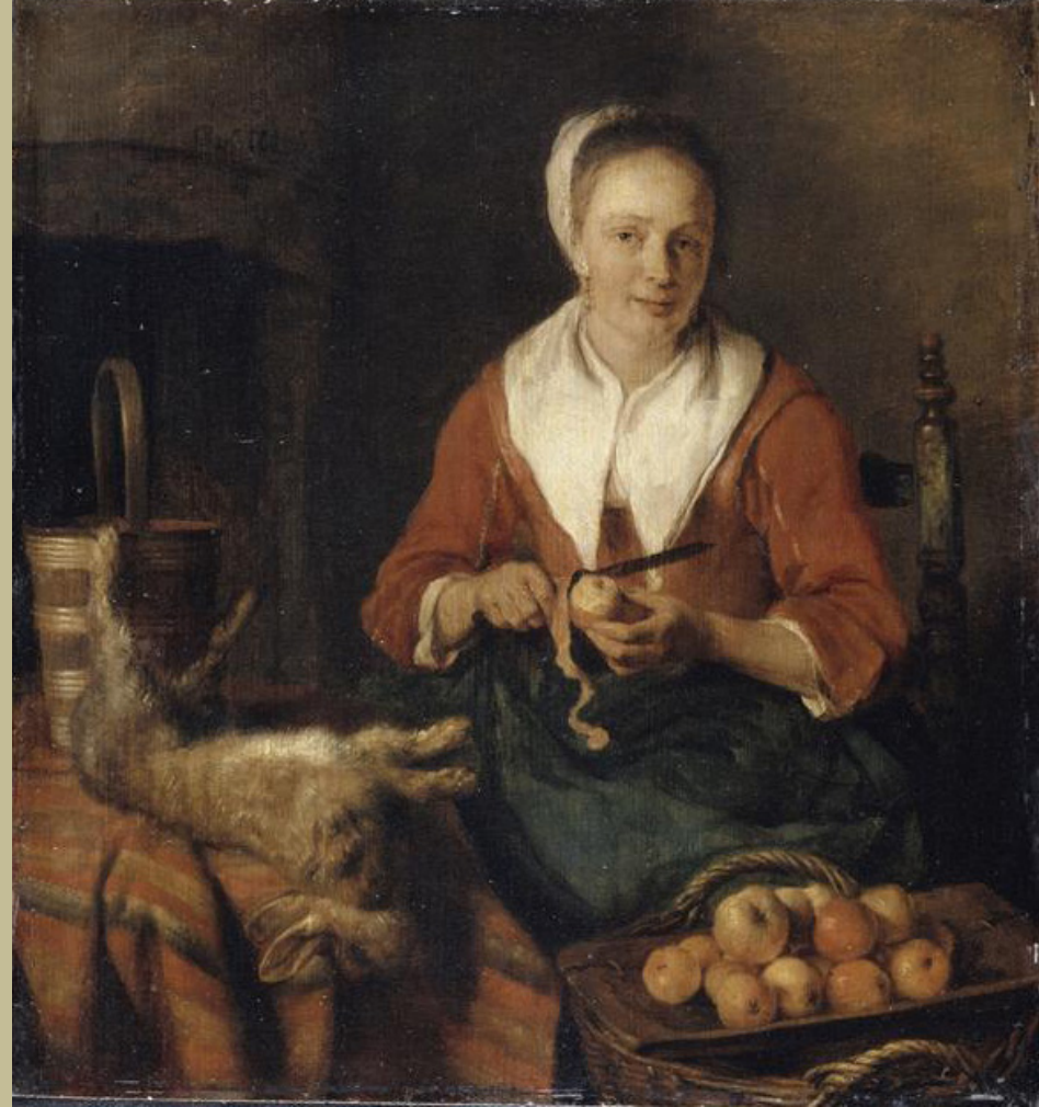
Gabriel Metsu (Leyde, 1629 – Amsterdam, 1667), La Buveuse de vin et La Peleuse de pommes , 1655/7, peinture à l'huile sur toile, Paris, musée du Louvre.