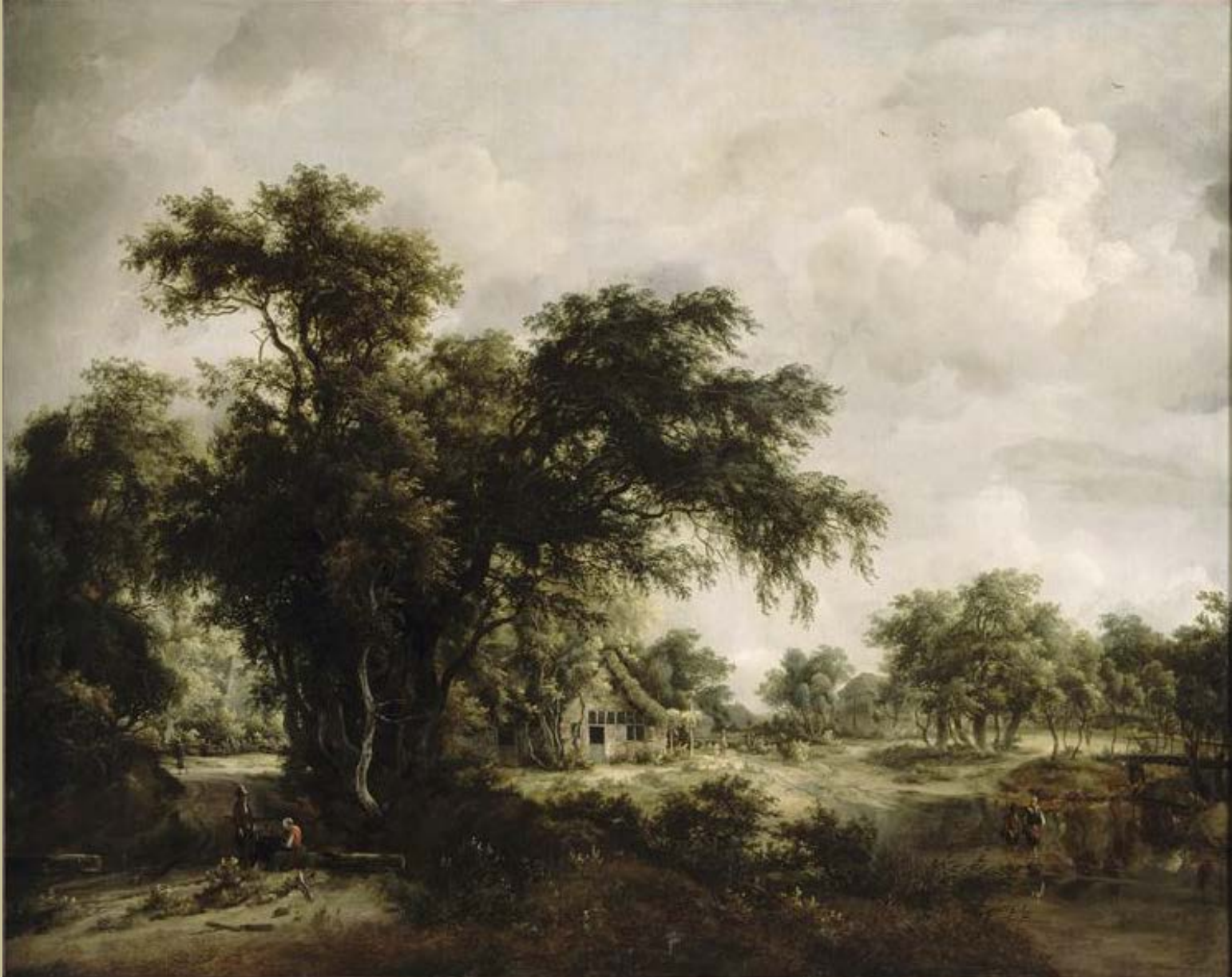
Meindert Hobbema (Amsterdam, 1638 – Amsterdam, 1709), La Ferme dans les bois , 1662, peinture à l'huile sur toile, Paris, musée du Louvre.