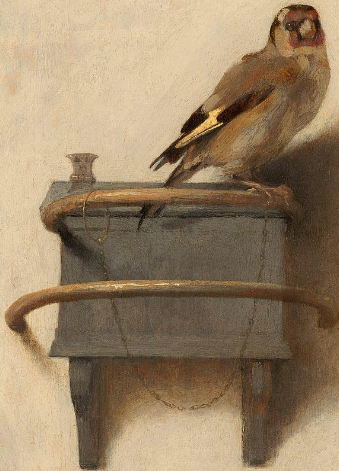
Carel Fabritius (Middenbeemster, 1622 – Delft, 1654), Le Chardonneret, 1654, La Haye, Mauritshuis.