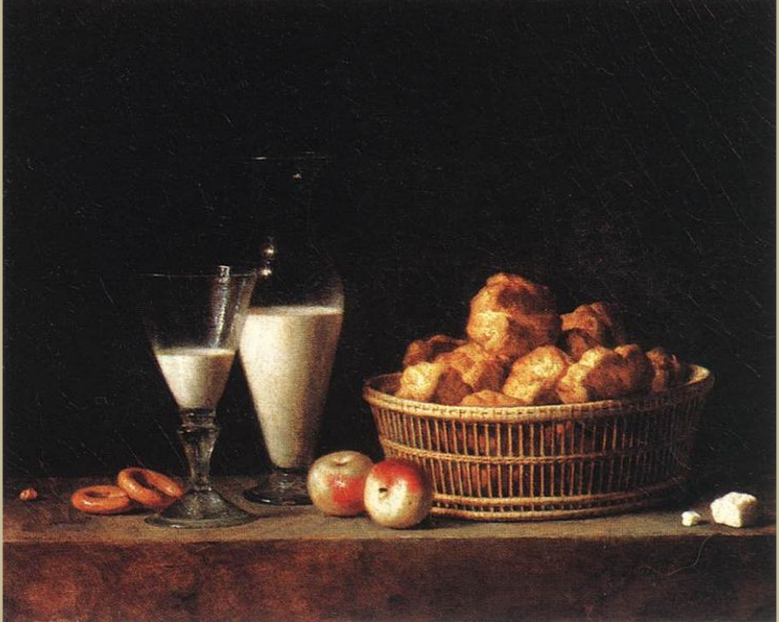
Roland Delaporte (Paris, 1724/5 – Paris, 1793), La Petite collation , 1787, peinture à l'huile sur toile, Paris, musée du Louvre.