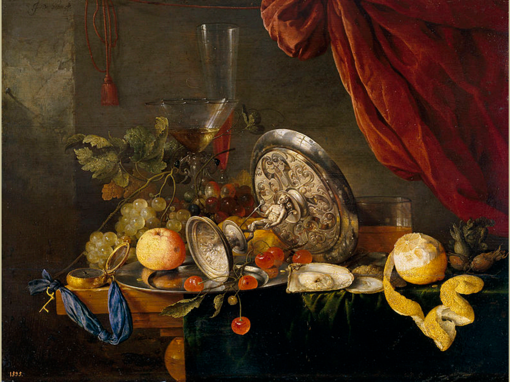
Jan Davidsz. de Heem (Utrecht, 1606 – Anvers, 1683/4), Nature morte , vers 1650, peinture à l'huile sur bois, Madrid, musée du Prado.