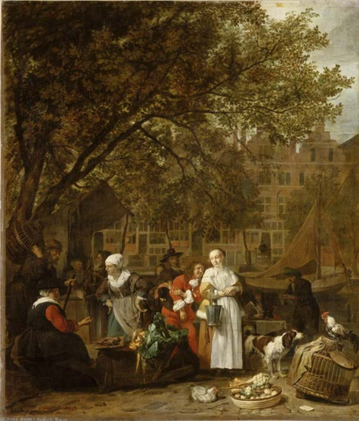
Gabriel Metsu (Leyde, 1629 – Amsterdam, 1667), Le Marché aux herbes d'Amsterdam, 1660/1, peinture à l'huile sur toile, Paris, musée du Louvre.