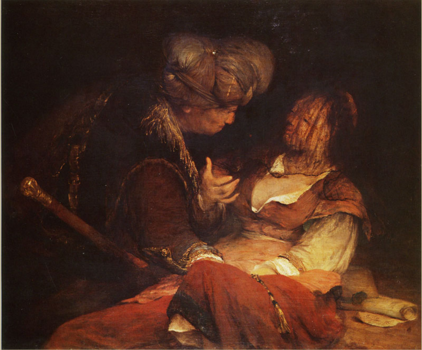
Aert de Gelder (Dordrecht, 1645 – Dordrecht, 1727), Judah et Tamar , vers 1700, peinture à l'huile sur toile, La Haye, Mauritshuis.