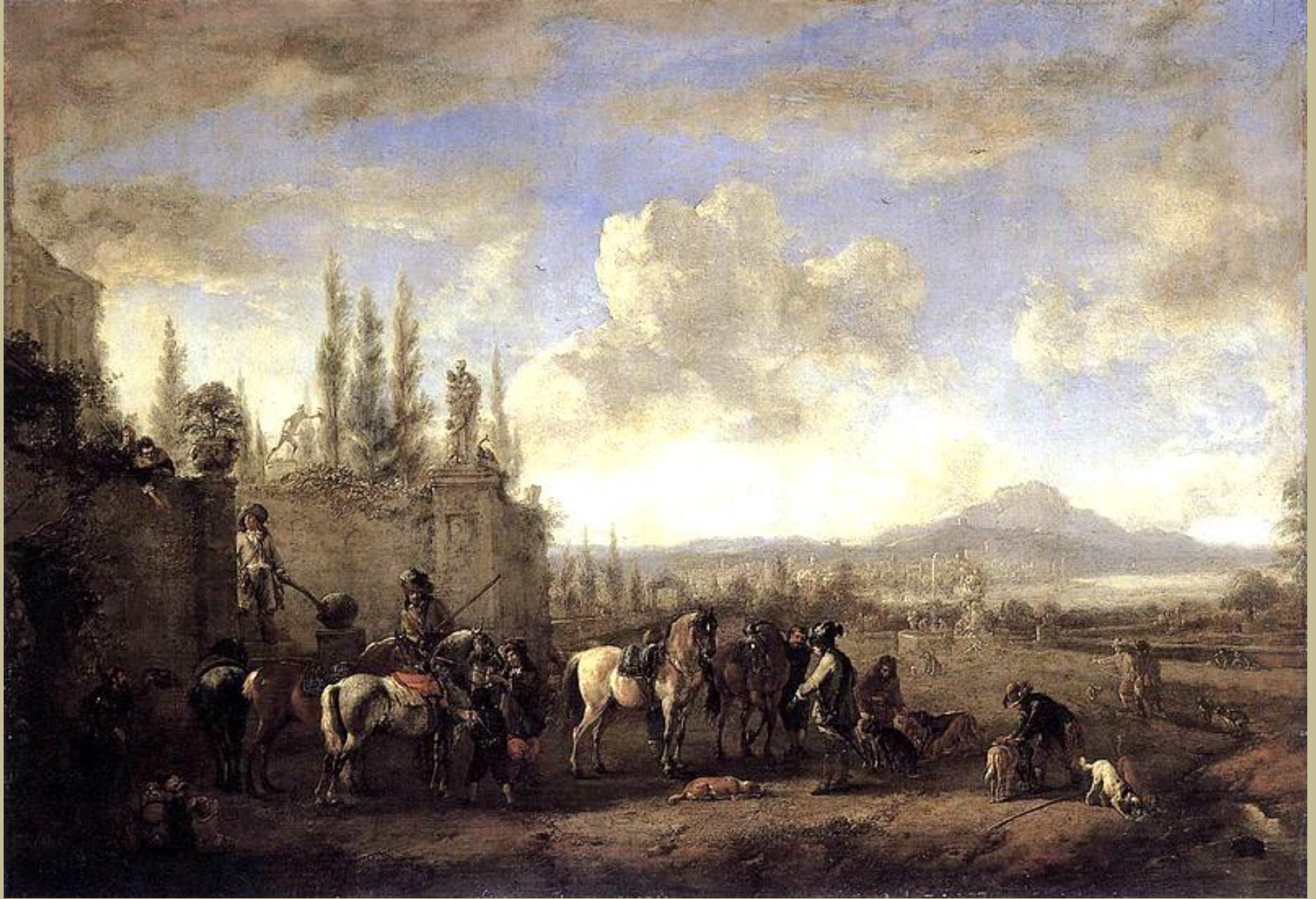
Philips Wouwermans (Haarlem, 1619 – Haarlem, 1668), Le Départ pour la chasse , vers 1660/5, peinture à l'huile sur toile, Dresde, Gemäldegalerie Alte Meister.