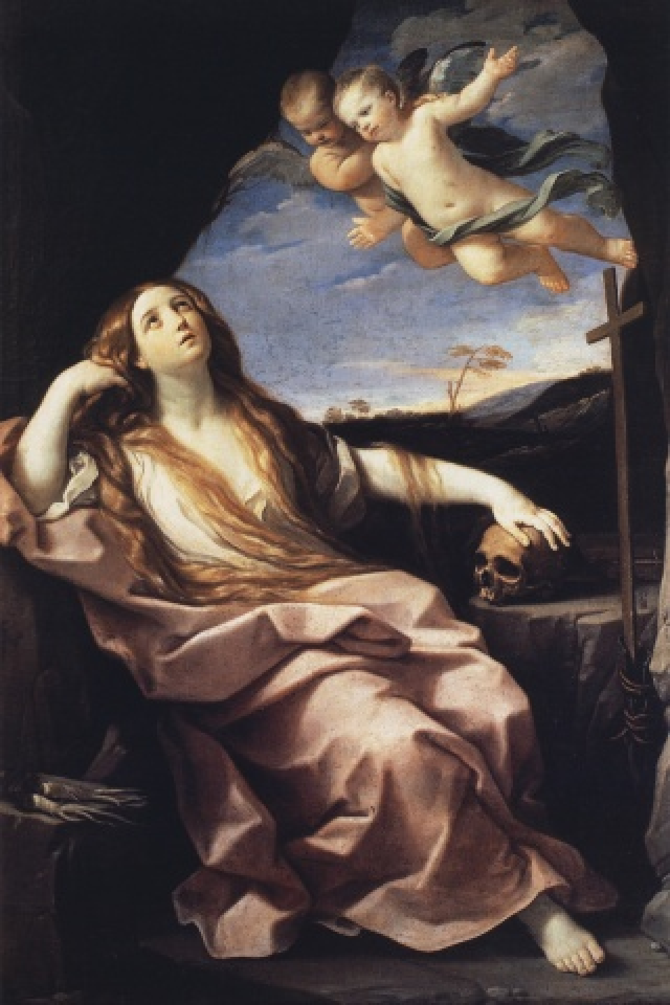
Guido Reni (Bologne, 1575 – Bologne, 1642), Sainte Marie Madeleine, 1632, peinture à l'huile sur toile, Rome, Galerie nationale d'Art Ancien.