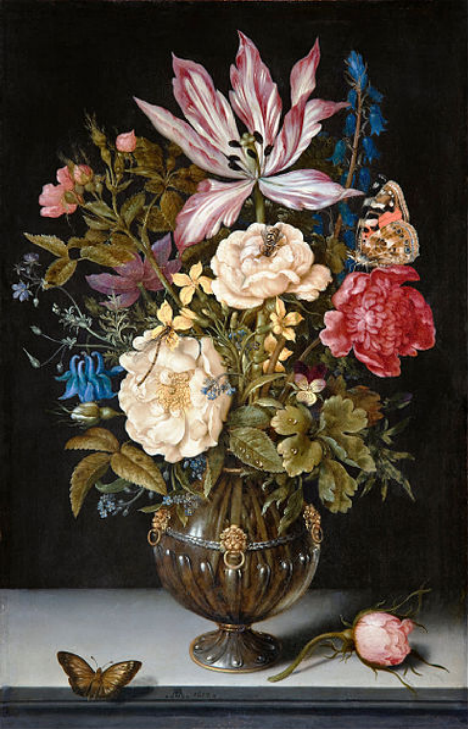
Ambrosius Bosschaert, dit l'Ancien (Anvers, 1573 – La Haye, 1621), Bouquet de fleurs , 1617, peinture à l'huile sur cuivre, Hallwyl, Museum.