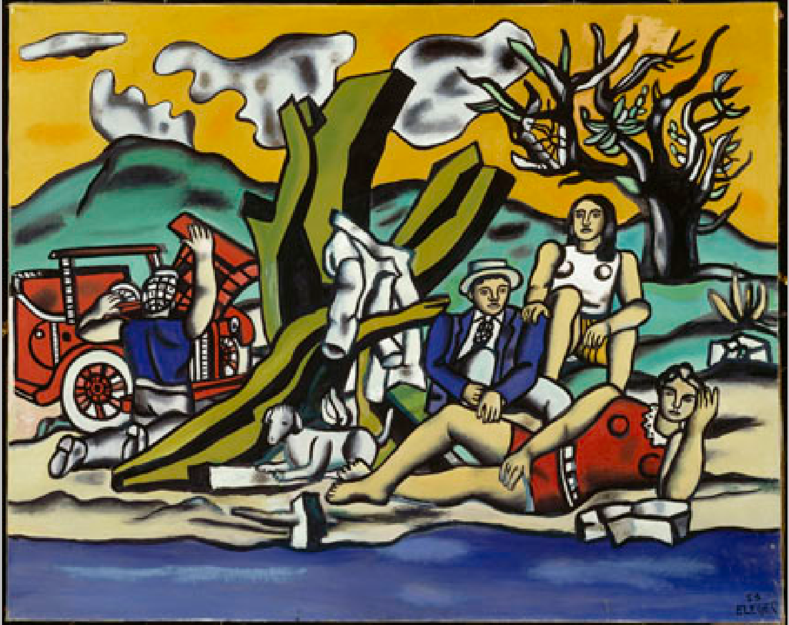
Fernand Léger (Argentan, 1881 – Gyf-sur-Yvette, 1955), La Partie de campagne , 1953, peinture à l'huile sur toile, Saint-Etienne, musée d'Art moderne.