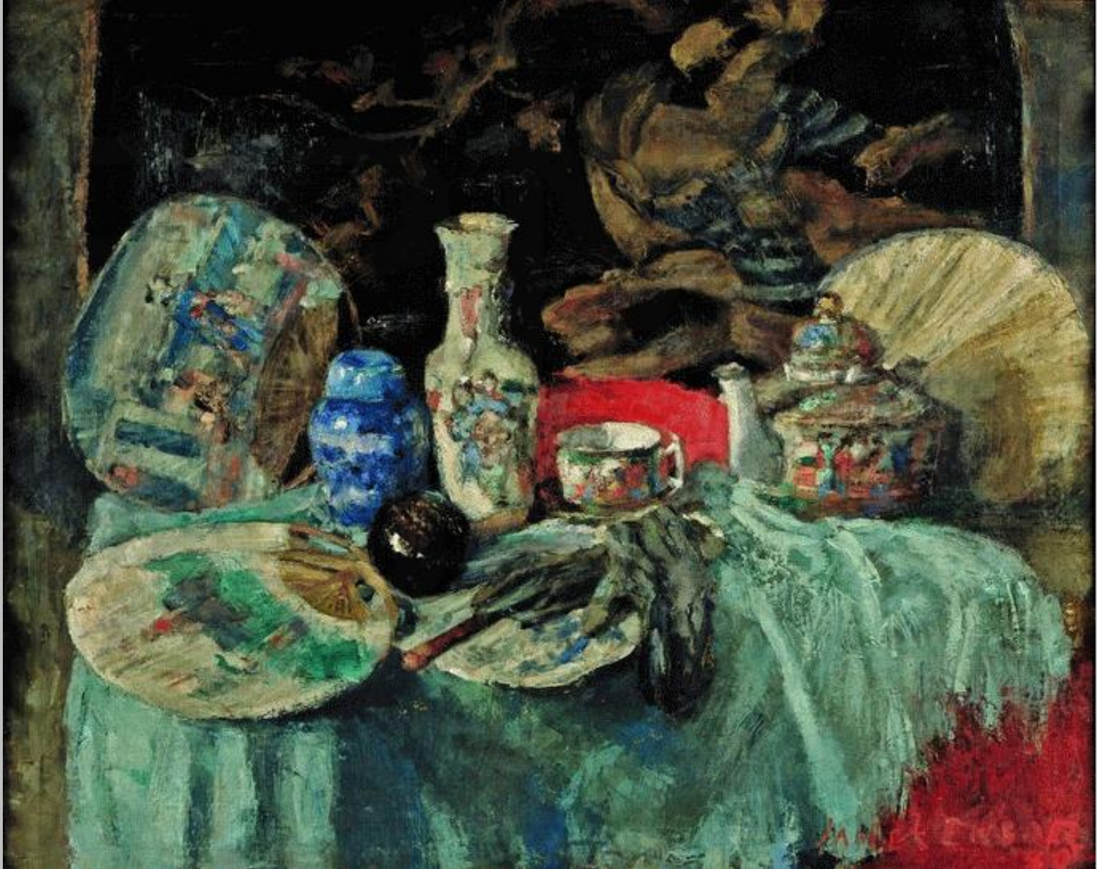
James Ensor (Ostende, 1860 – Ostende, 1949), Porcelaines chinoises et éventails , 1880, peinture à l'huile sur toile, Bruxelles, Musées royaux des Beaux-Arts de Belgique.