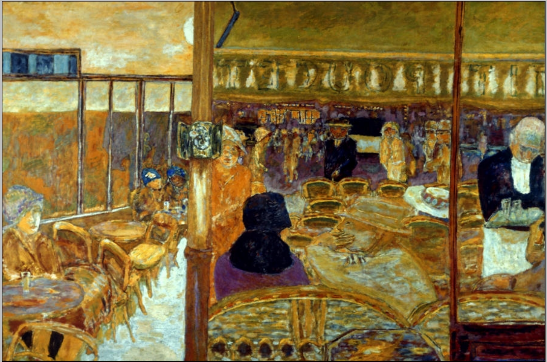
Pierre Bonnard (Fontenay-aux-Roses, 1867 – Le Cannet, 1947), Le Café du Petit Poucet , 1928, peinture à l'huile sur toile, Besançon, musée des Beaux-Arts et d'Archéologie.