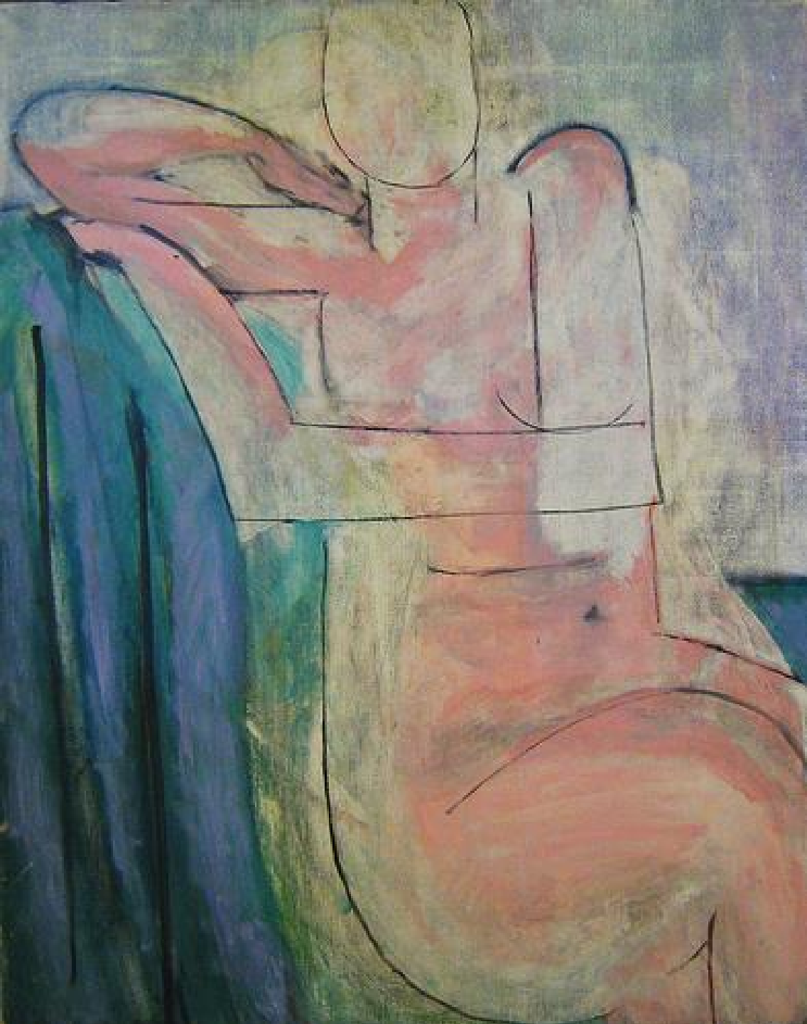
Henri Matisse (Le Cateau-Cambresis, 1869 – Nice, 1954), Nu rose assis , 1935, peinture à l'huile sur toile, Paris, Musée national d'Art moderne, Centre Georges-Pompidou.