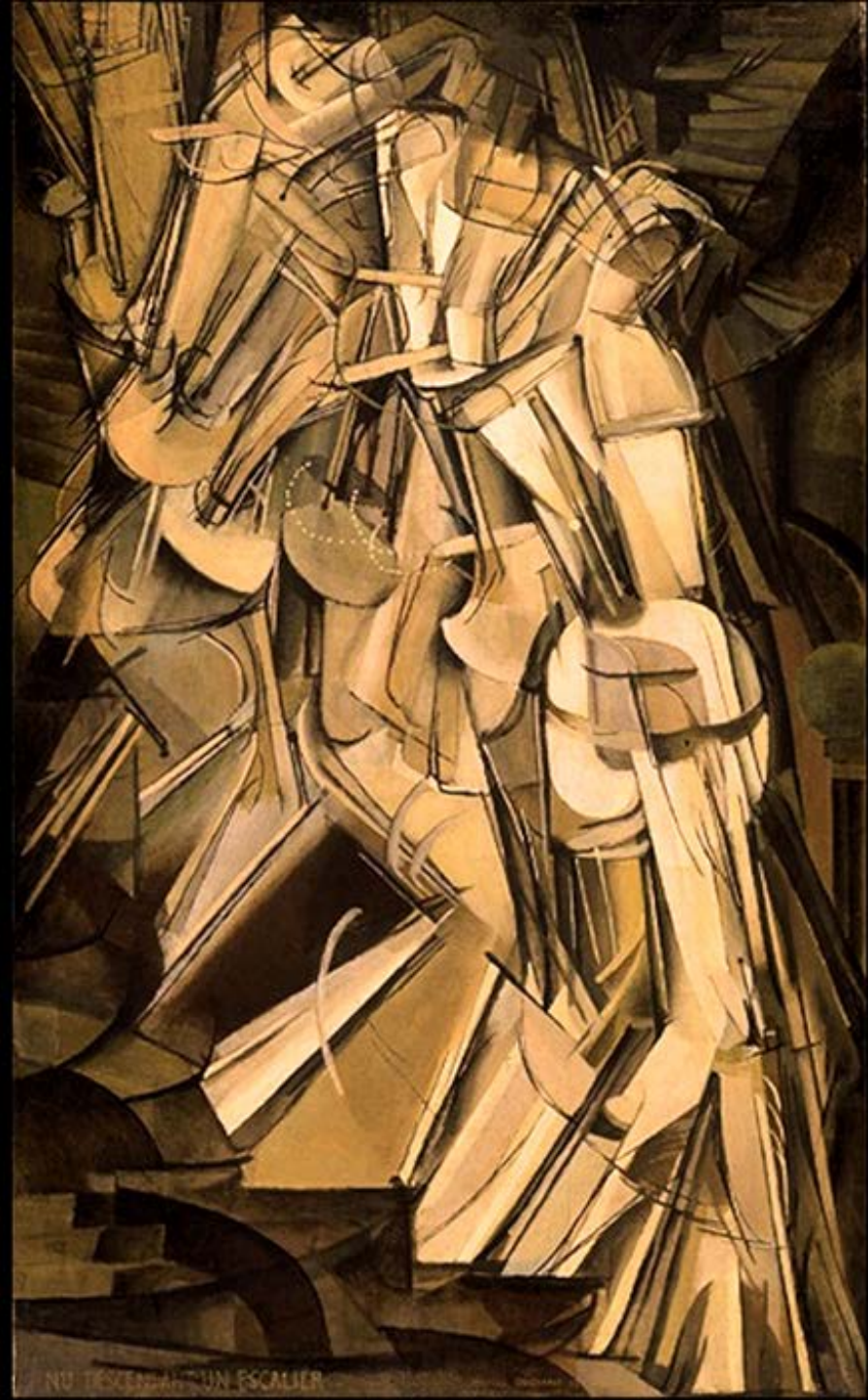
Marcel Duchamp (Blainville-Crevon, 1887 – Neuilly-sur-Seine, 1968), Nu descendant un escalier , 1912, peinture à l'huile sur toile Philadelphie, Philadelphia Museum of Art.