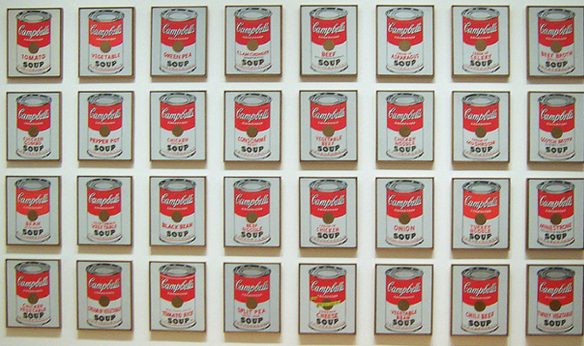
Andy Warhol (Pittsburgh, 1928 – New York, 1987), Trente deux boîtes de soupe Campbell , 1962, peinture à l'huile sur toile, New York, MoMA.