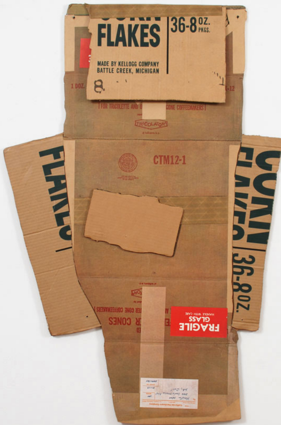
Robert Rauschenberg (Port Arthur, 1925 – Captiva Island, 2008), Cardbird 1 , 1971, technique mixte , New York, Rauschenberg Foundation.