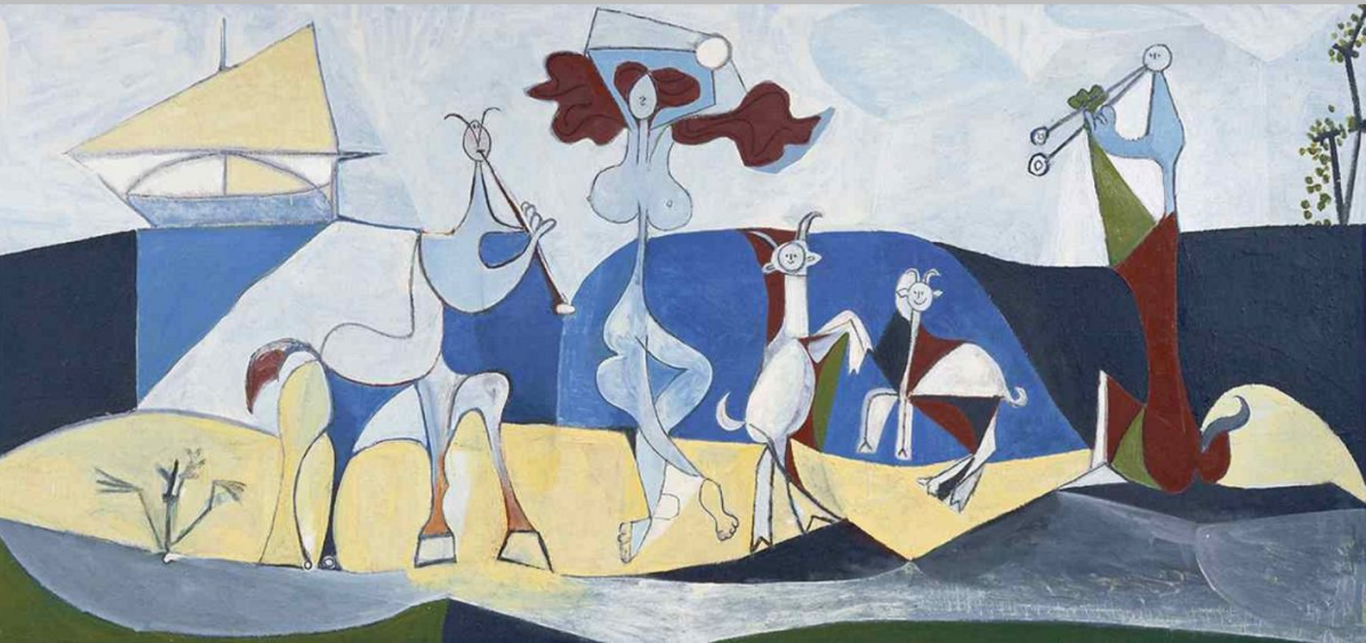
Pablo Picasso (Malaga, 1881 – Mougins, 1973), La Joie de vivre , 1946, peinture sur fibrociment, Antibes, musée Picasso.