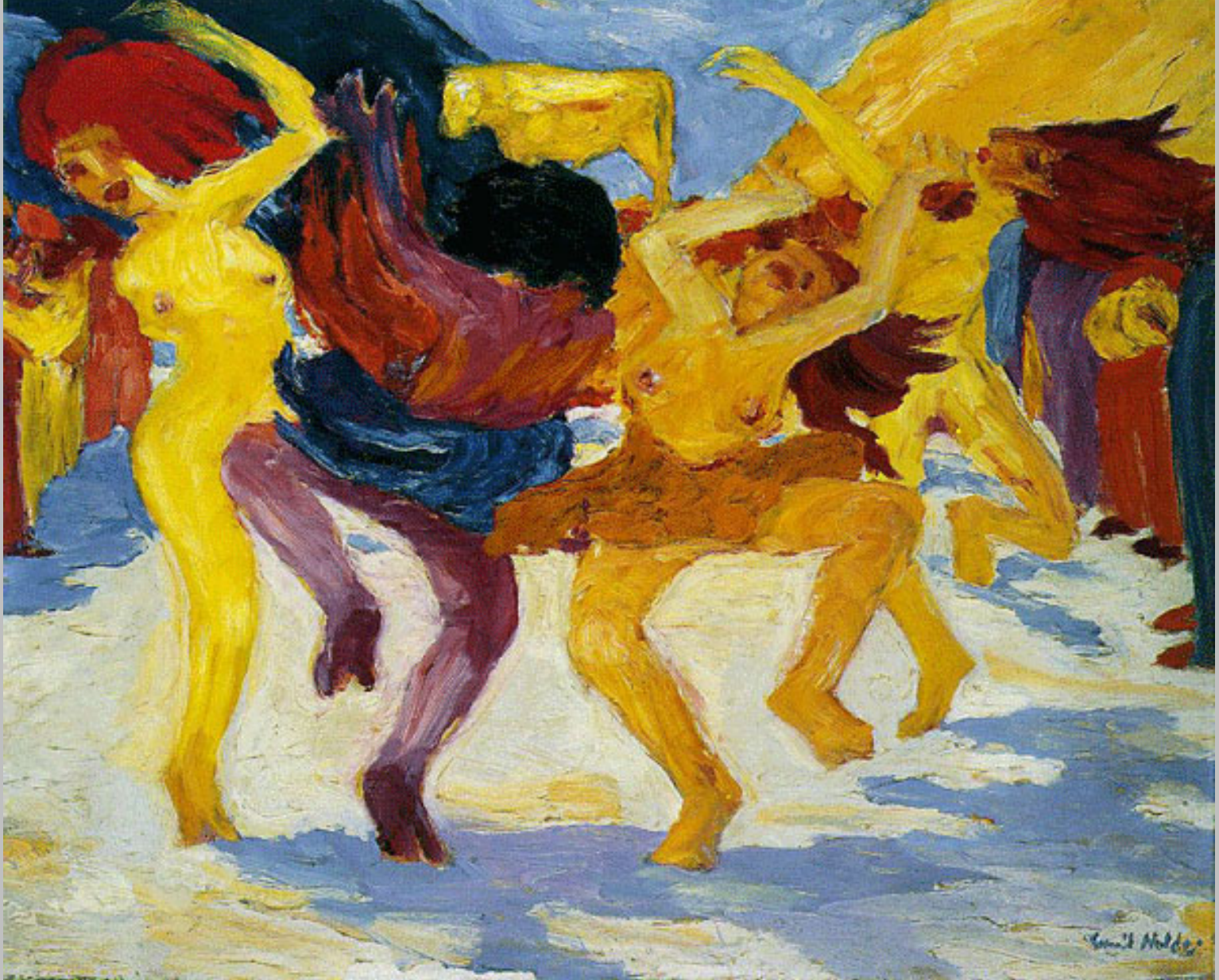
Emil Hansen, dit Emil Nolde (Nolde, 1867 – Seebüll, 1956), La Danse devant le veau d'or , 1910, peinture à l'huile sur toile, Munich, Staatsgalerie moderner Kunst.