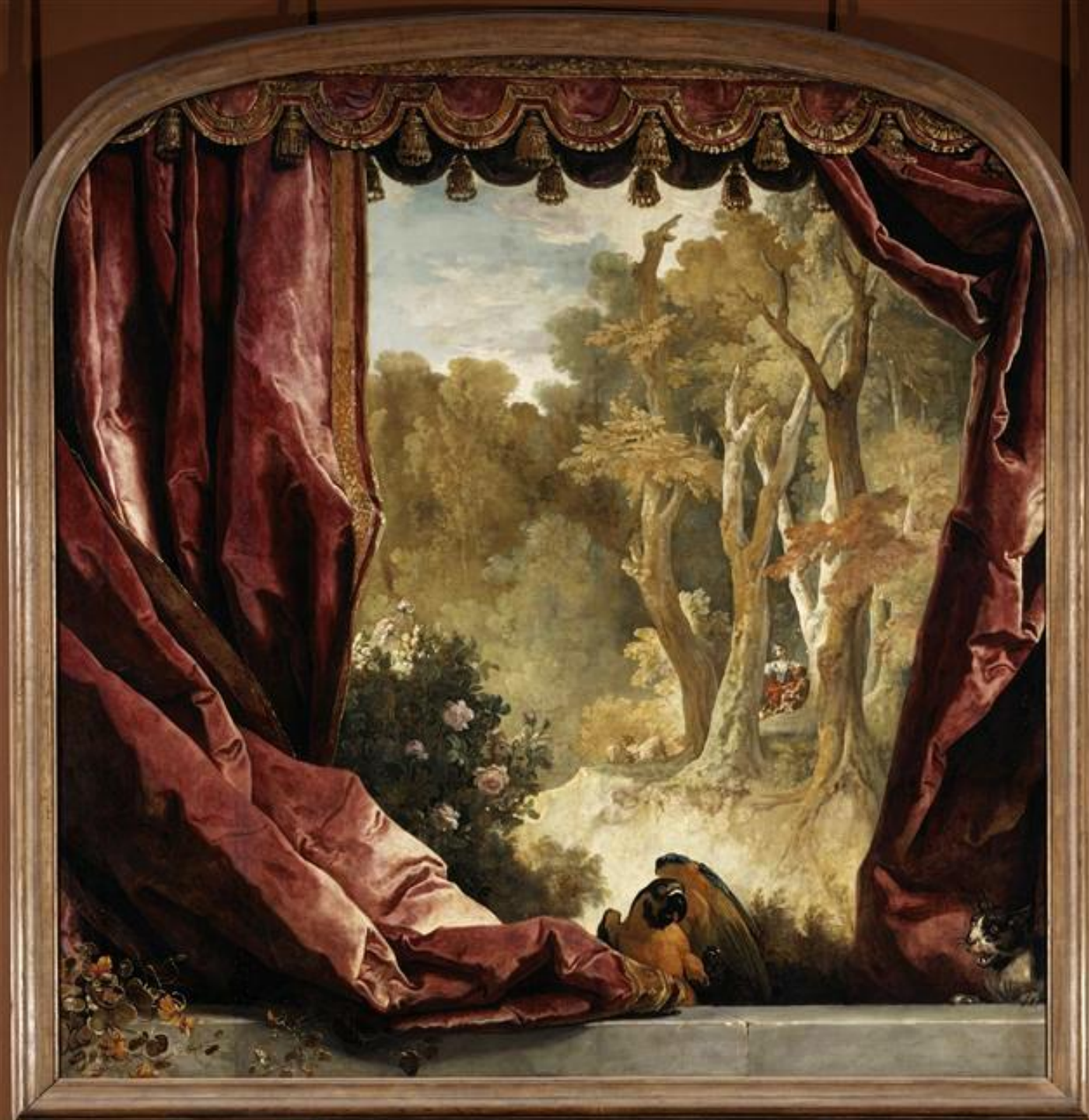
Nicolas de Largillière (Paris, 1656 – Paris, 1746), Composition décorative avec rideau, paysage et animaux , 1725/30, peinture à l'huile sur toile, Paris, musée du Louvre.