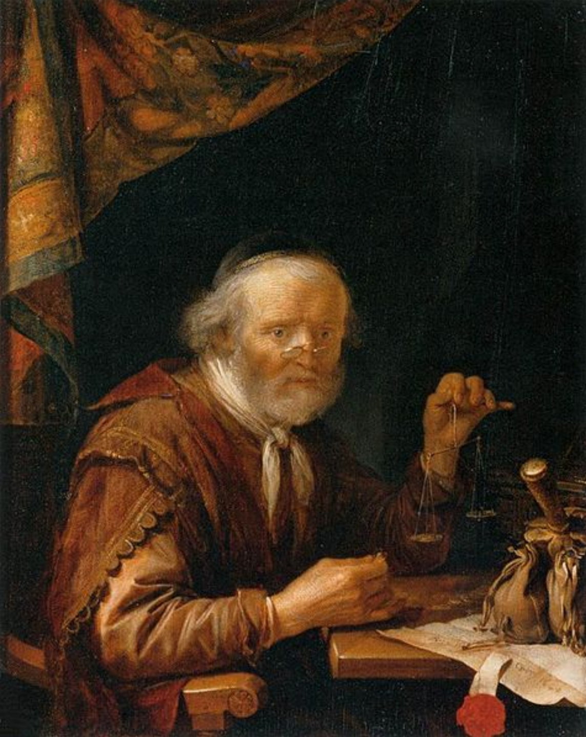
Gerrit Dou (Leyde, 1613 – Leyde, 1675), Le Peseur d'or, vers 1664, peinture à l'huile sur bois, Paris, musée du Louvre.