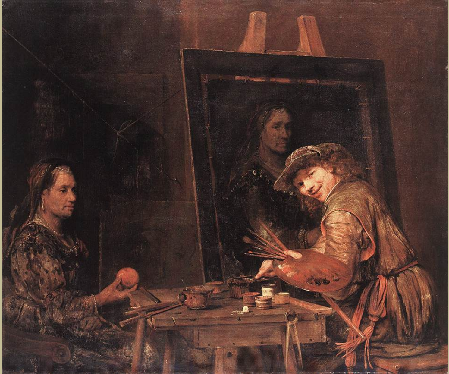
Aert de Gelder (Dordrecht, 1645 – Dordrecht, 1727), Autoportrait en Zeuxis , 1685, peinture à l'huile sur toile, Francfort, Städelches Kunstinstitut.