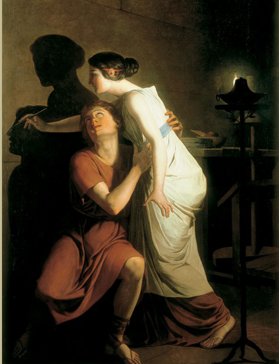
Joseph Benoît Suvée (Bruges, 1743 – Rome, 1807), La Découverte du dessin , 1791, peinture à l'huile sur toile, Bruges, Groeningemuseum.