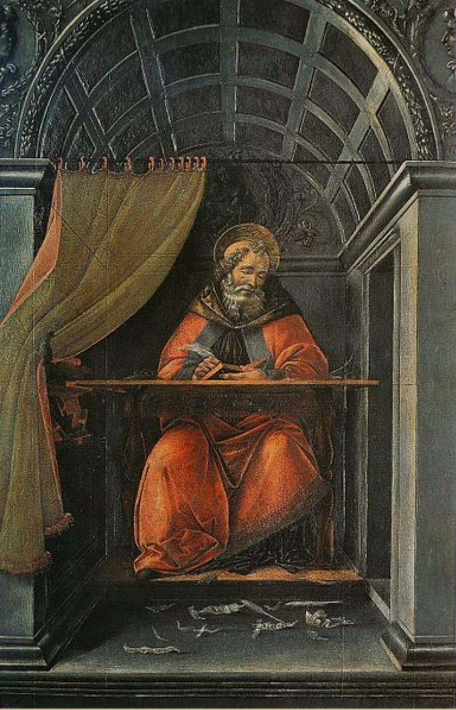
Sandro Botticelli (Florence, vers 1445 – Florence, 1515), Saint Augustin dans son cabinet de travail, 1490/4, tempera sur bois, Florence, musée des Offices.