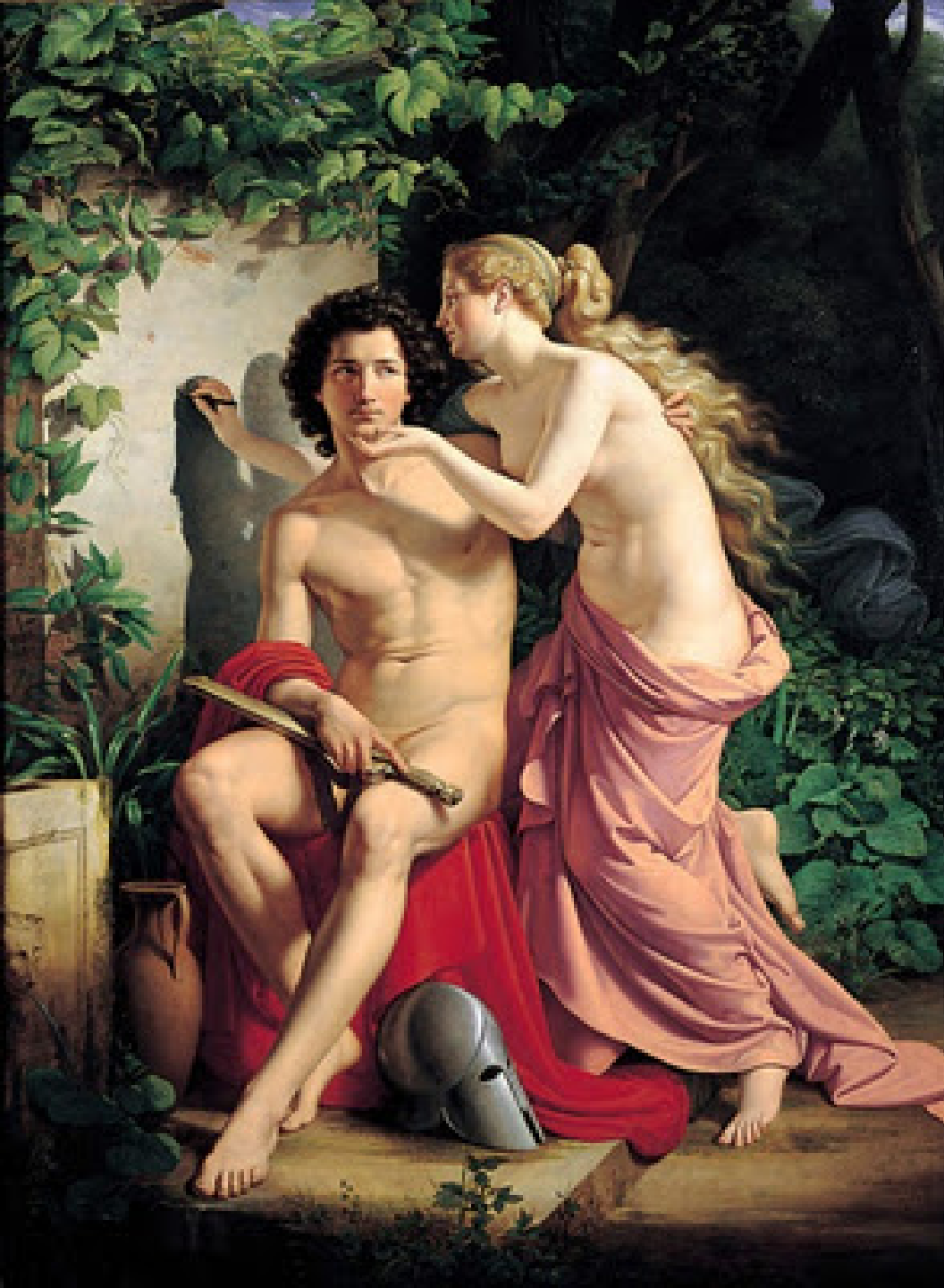
Eduard Wilhelm Daege (Berlin, 1805 – Berlin, 1883), L'Invention du dessin , 1832, peinture à l'huile sur toile, Berlin, Nationalgalerie.