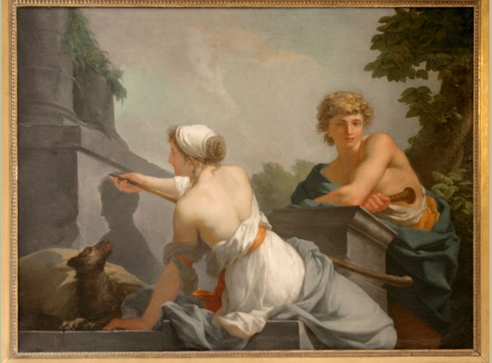
Jean-Baptiste Regnault (Paris, 1754 – Paris, 1829), Dibutade, ou l'origine de la peinture, 1786, peinture à l'huile sur toile, Versailles, musée des château de Versailles et ed Trianon.