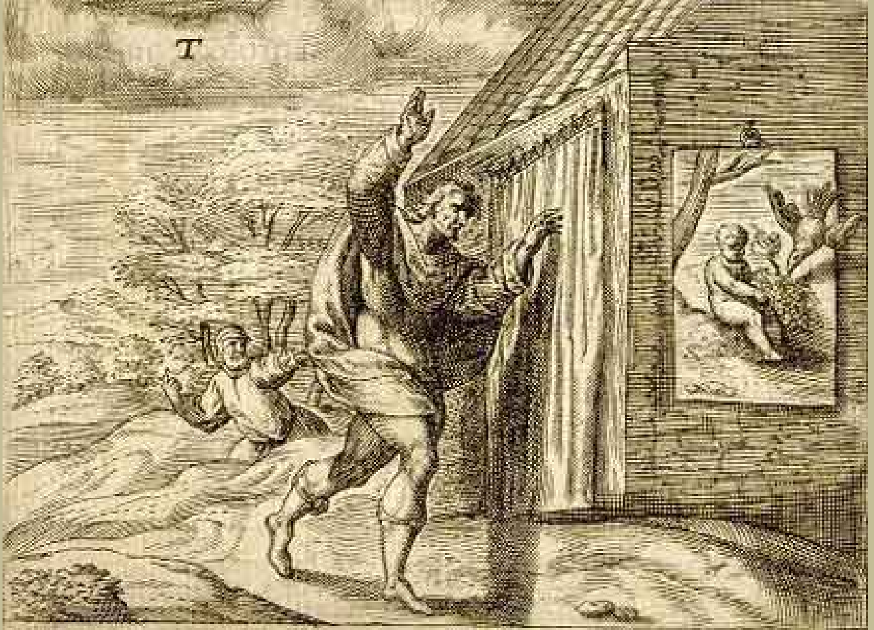
Pays-Bas, XVIIe siècle, Zeuxis et Parrhasius , 1613, eau-forte, Amsterdam, bibliothèque universitaire.