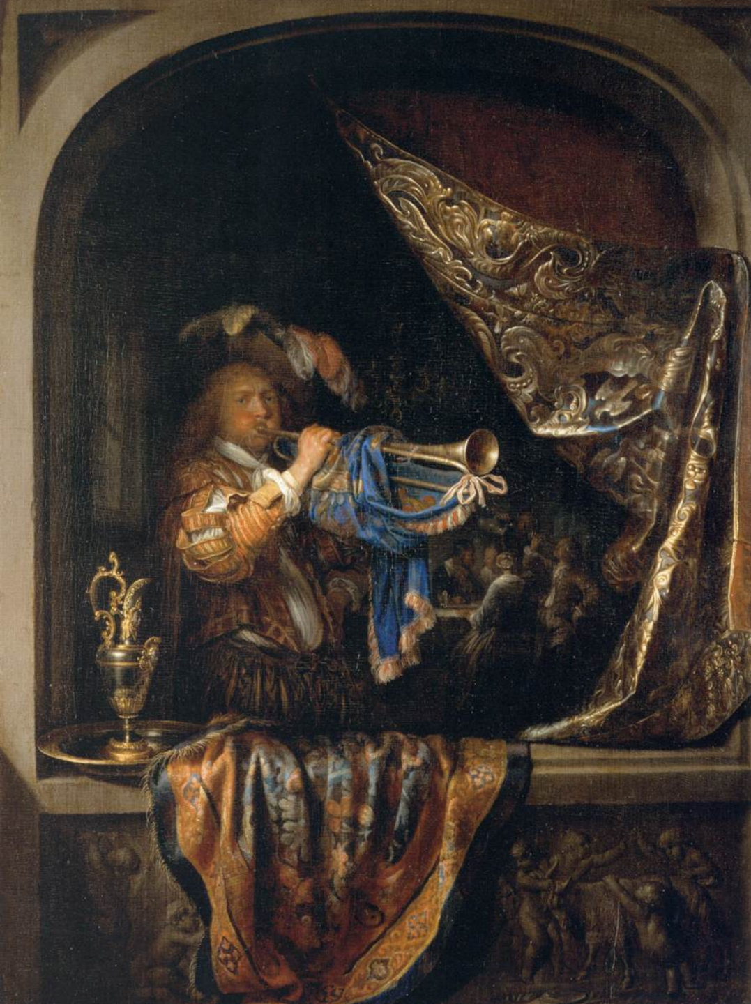
Gerrit Dou (Leyde, 1613 – Leyde, 1675), Trompettiste, vers 1660/5, peinture à l'huile sur toile, Paris, musée du Louvre.