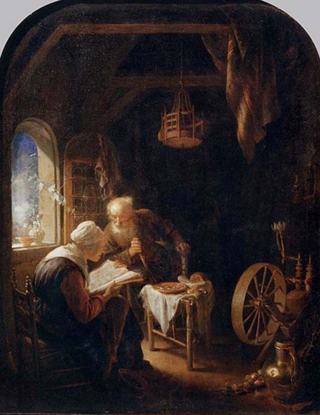
Gerrit Dou (Leyde, 1613 – Leyde, 1675), La Lecture de la Bible, vers 1645, peinture à l'huile sur bois, Paris, musée du Louvre.