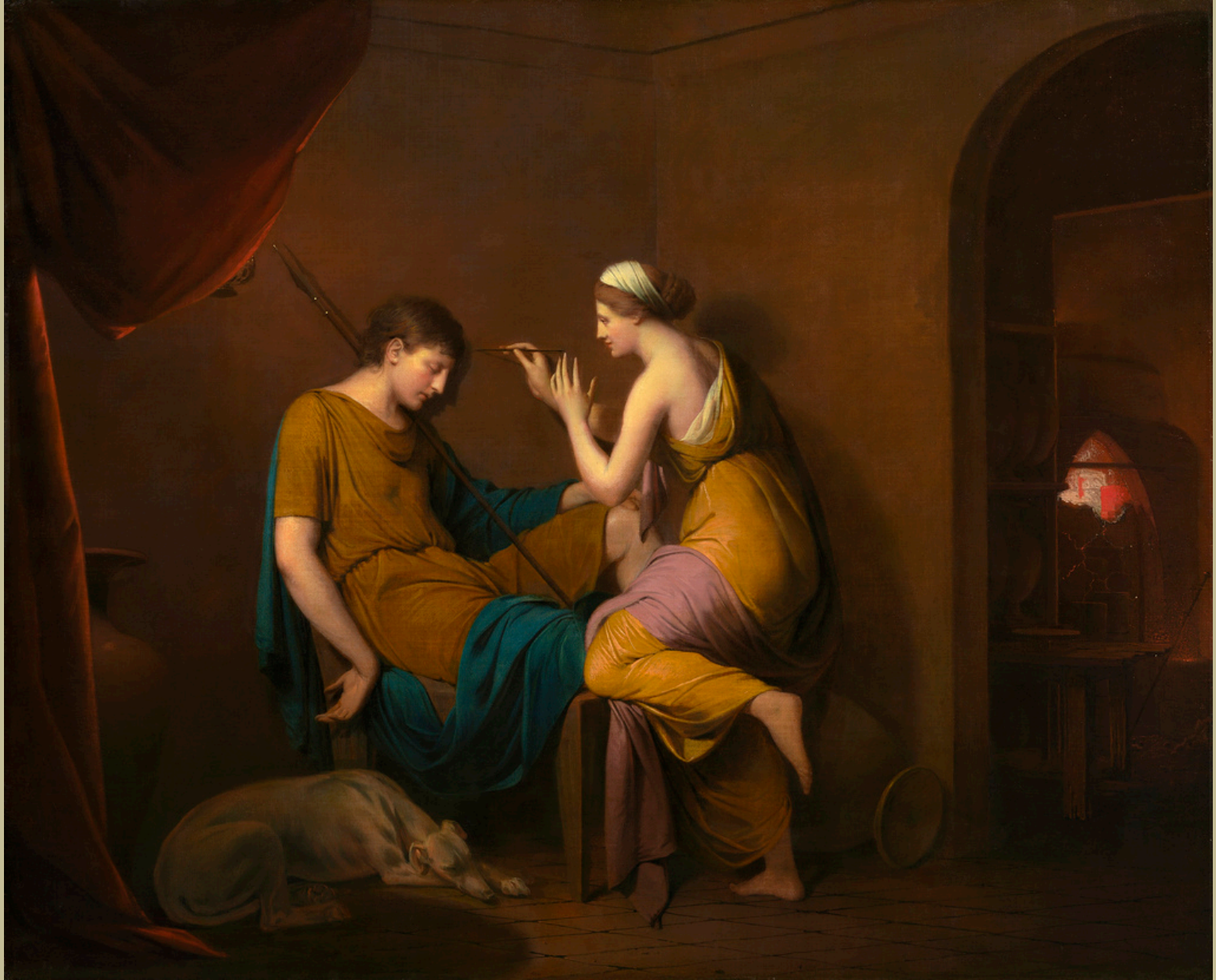
Joseph Wright of Derby (Derby, 1734 – Derby, 1797), Dibutade ou l'invention du dessin , vers 1782/4, peinture à l'huile sur toile, Washington National Gallery of Art.