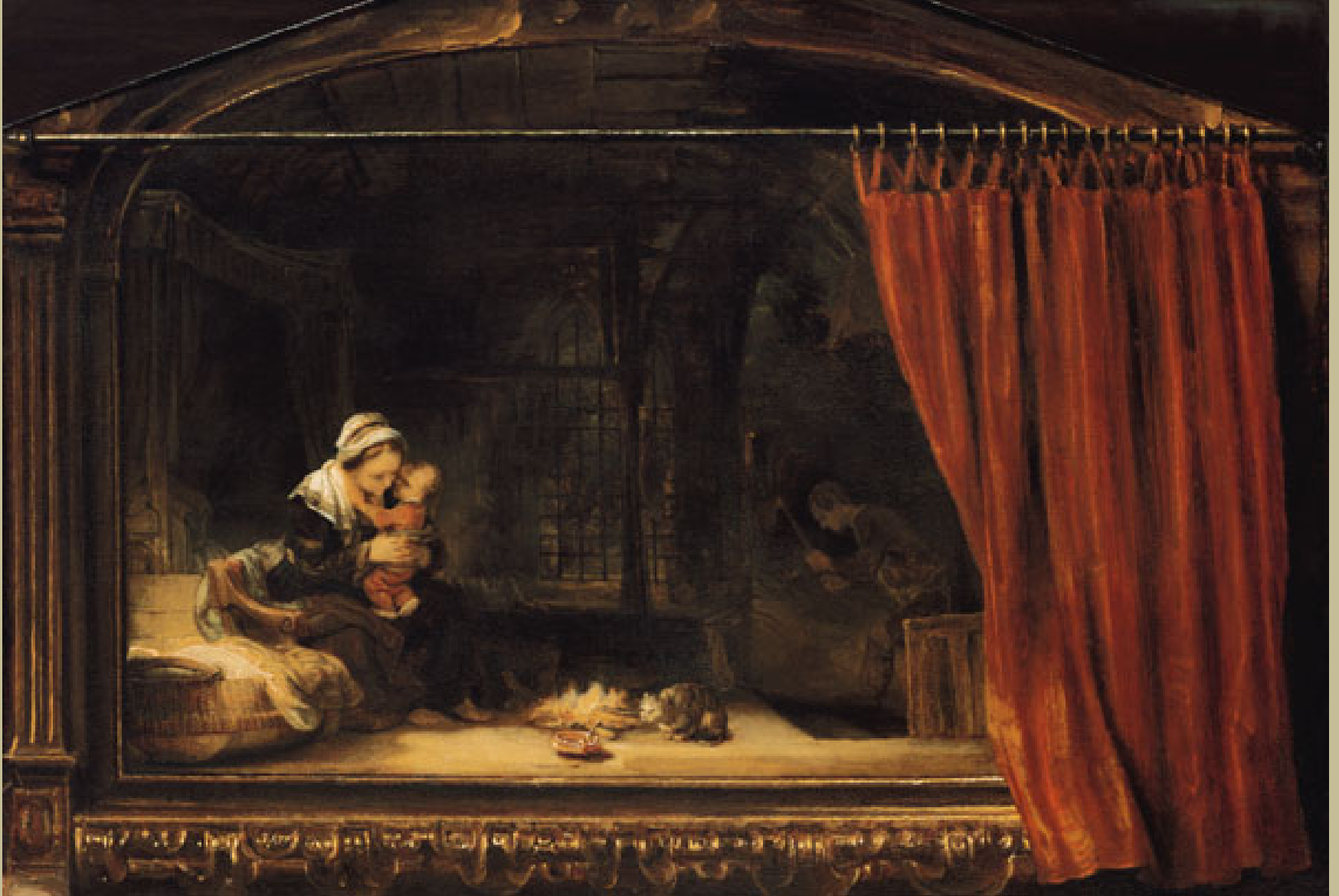
Rembrandt Harmenszoon van Rijn, dit Rembrandt (Leyde, 1606 – Amsterdam, 1669), La Sainte Famille , 1648, peinture à l'huile sur toile, Kassel, Staatliche Gemäldegalerie.