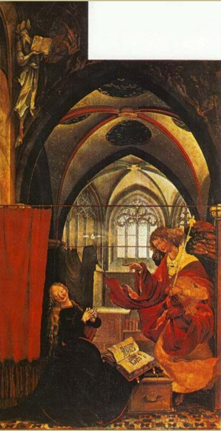
Matthias Grünewald (Würzburg, vers 1475 – Halle, 1528), Retable d'Issenheim : L'Annonciation , vers 1512/6, peinture à l'huile sur bois, Colmar, musée Unterlinden.