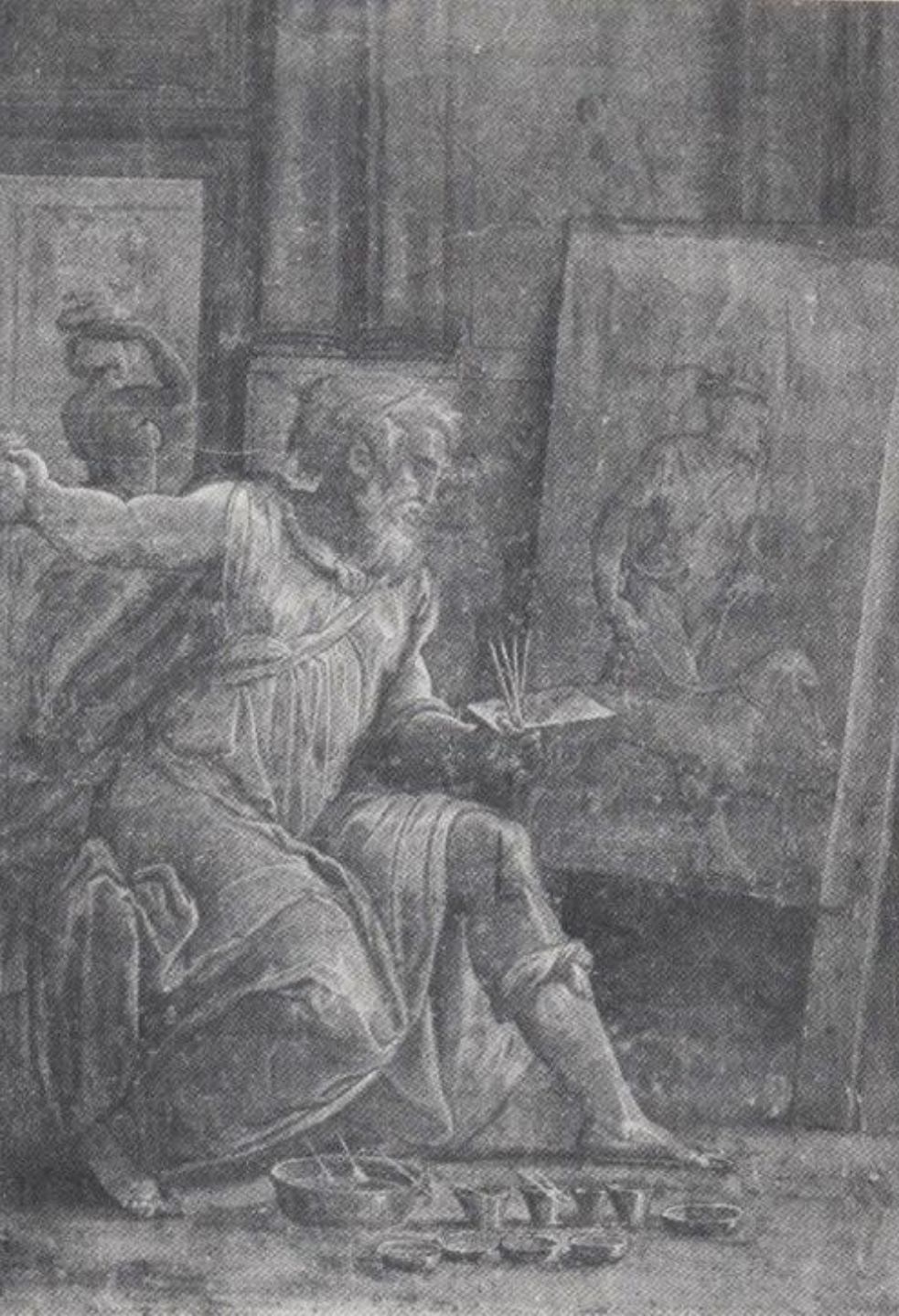
Giorgio Vasari (Arezzo, 1511 – Florence, 1574), Protogène jetant l'éponge, vers 1548, fresque, Arezzo, Casa Vasari.