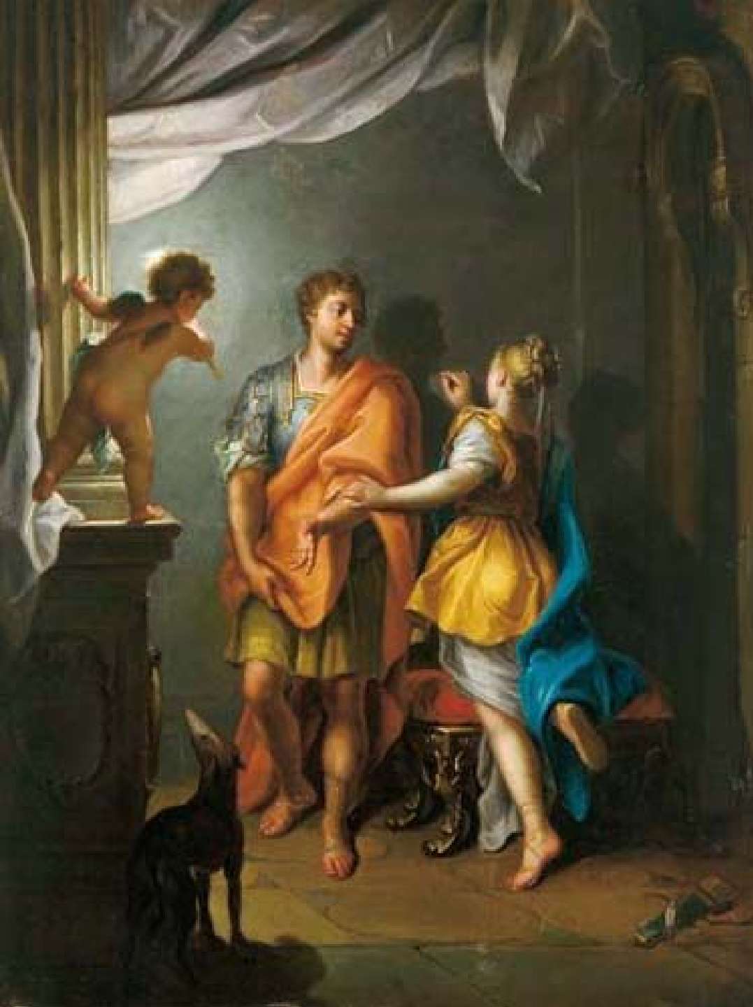
Jean Raoux (Montpellier, 1677 – Paris, 1734), L'Invention de la peinture, 1714/17, peinture à l'huile sur toile, collection particulière.