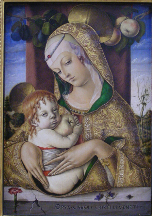
Carlo Crivelli (Venise, 1435 – Ascoli Piceno, 1495), La Vierge et l'Enfant, vers 1480, tempera sur bois, Londres, Victoria & Albert Museum.