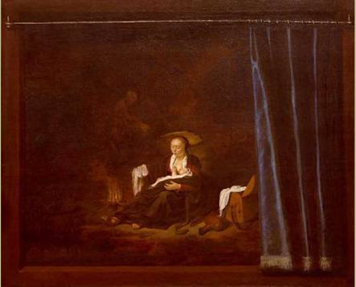
Adriaen van Gaesbeeck (Leyde, 1621 – Leyde, 1650), La Fuite en Egypte , 1647, peinture à l'huile sur bois, Leyde, Stedelijkmuseum 'de Lakenhal'.