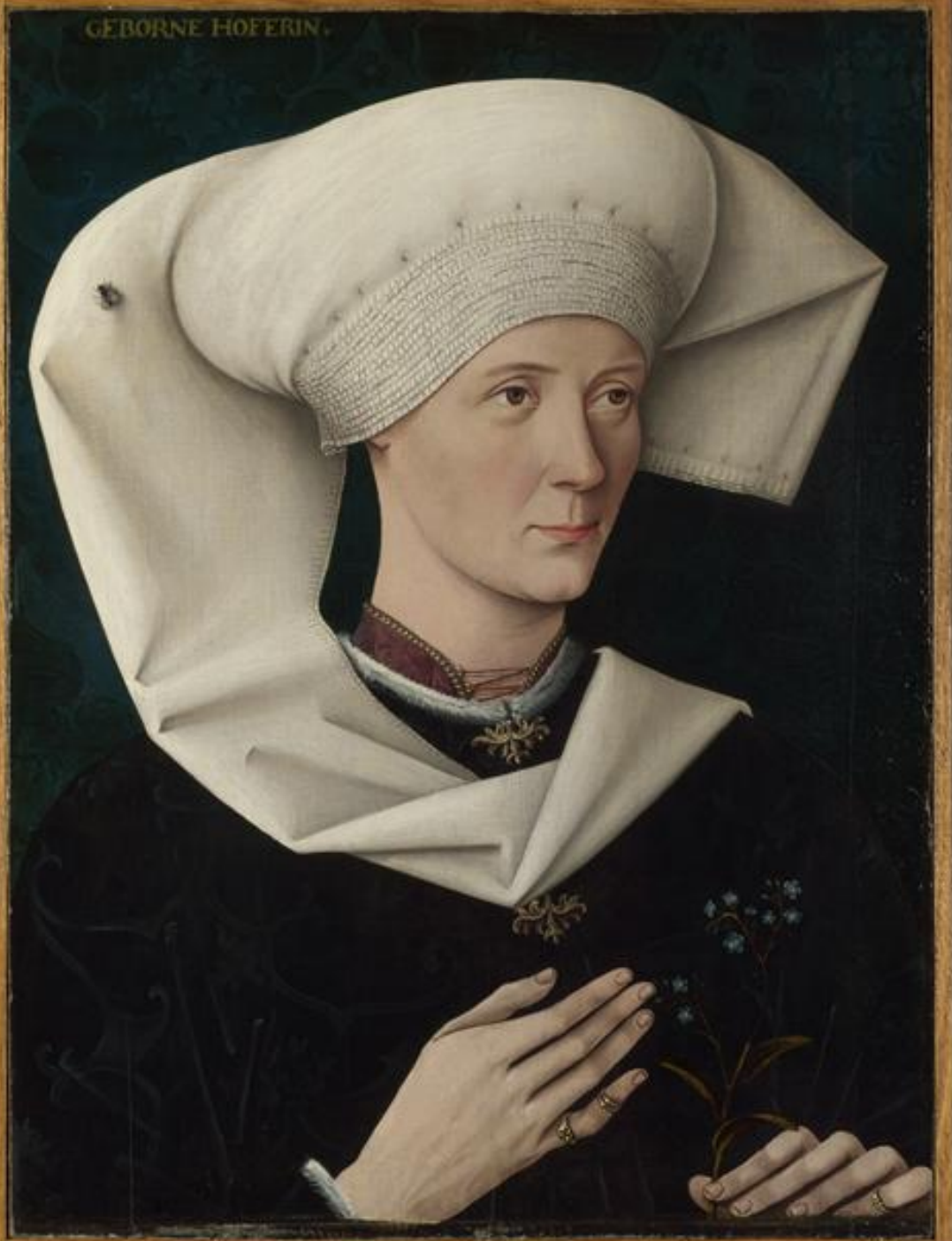
Souabe, XVe siècle, Portrait d'une femme de la famille Hofer, vers 1480, peinture à l'huile sur bois, Londres, National Gallery.