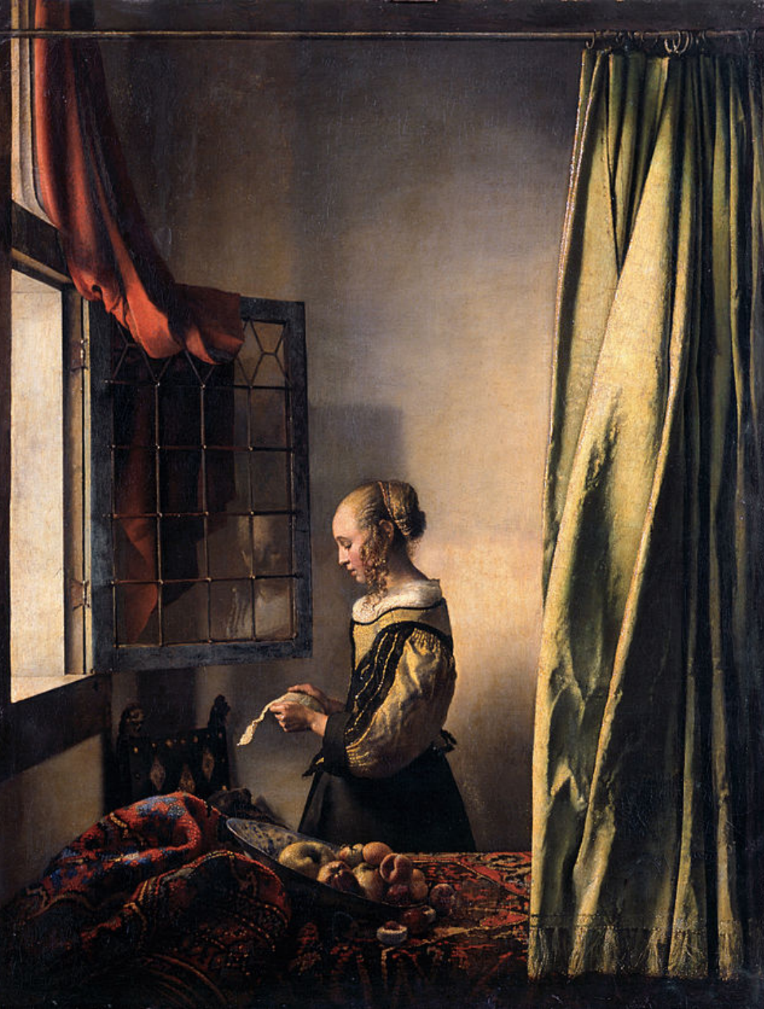
Johannes Vermeer (Delft, 1632 – Delft, 1675), La Liseuse à la fenêtre, vers 1657/9, peinture à l'huile sur toile, Dresde, Gemäldegalerie Alte Meister.