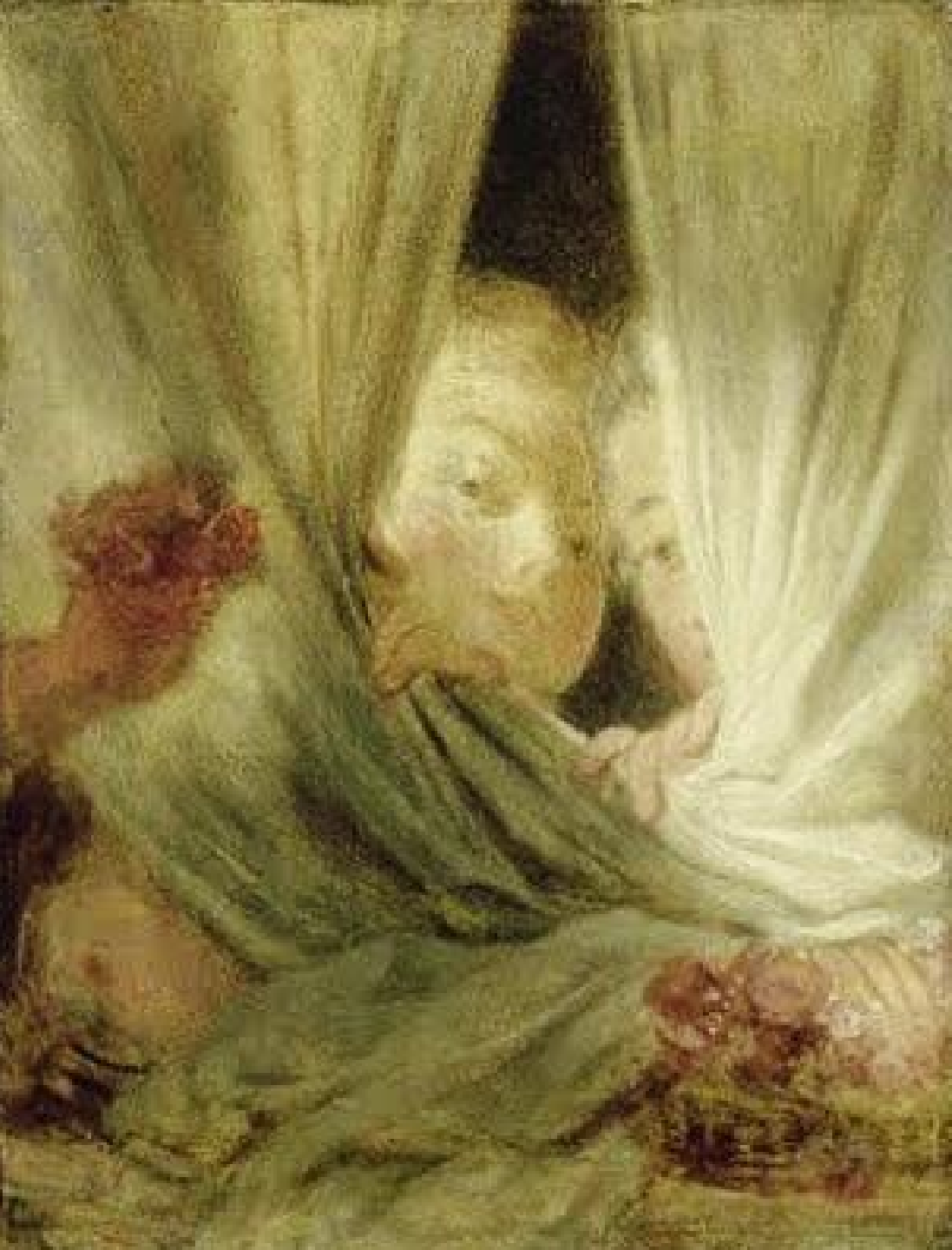
Jean-Honoré Fragonard (Grasse, 1732 – Paris, 1806), Les Curieuses, vers 1775/80, peinture à l'huile sur toile, Paris, musée du Louvre.