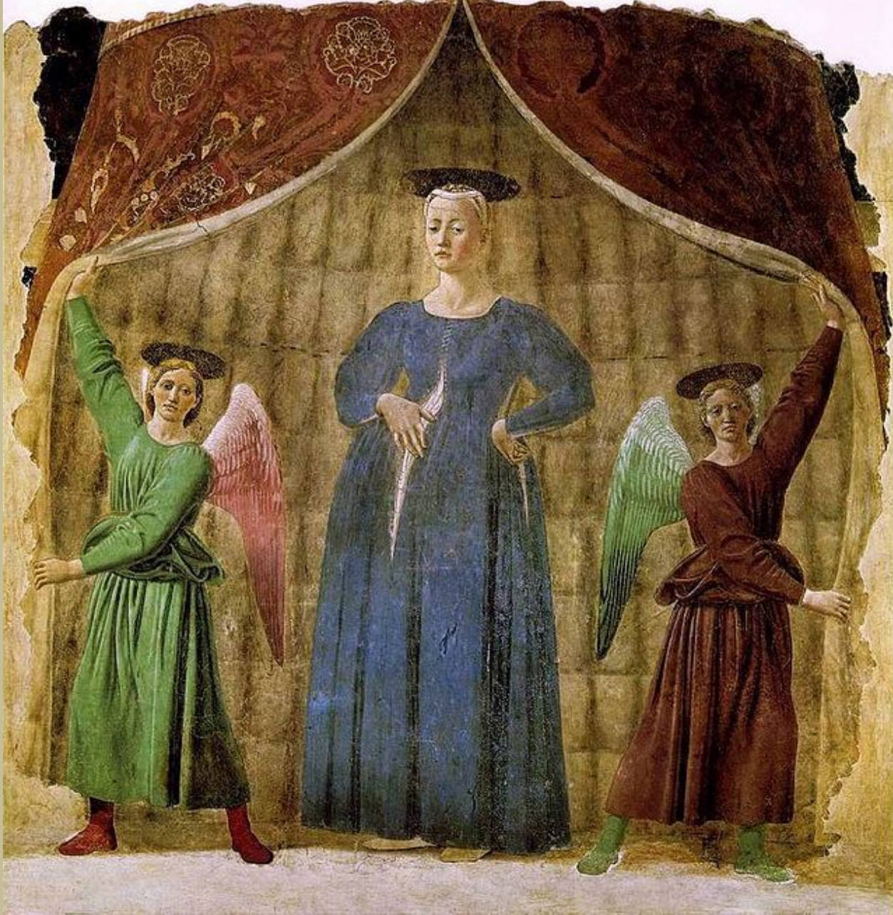
Piero della Francesca (Borgo San Sepolcro, 1412/20 – Borgo San Sepolcro, 1492), La Madonna del Parto , 1467, fresque déposée, Monterchi, musée.