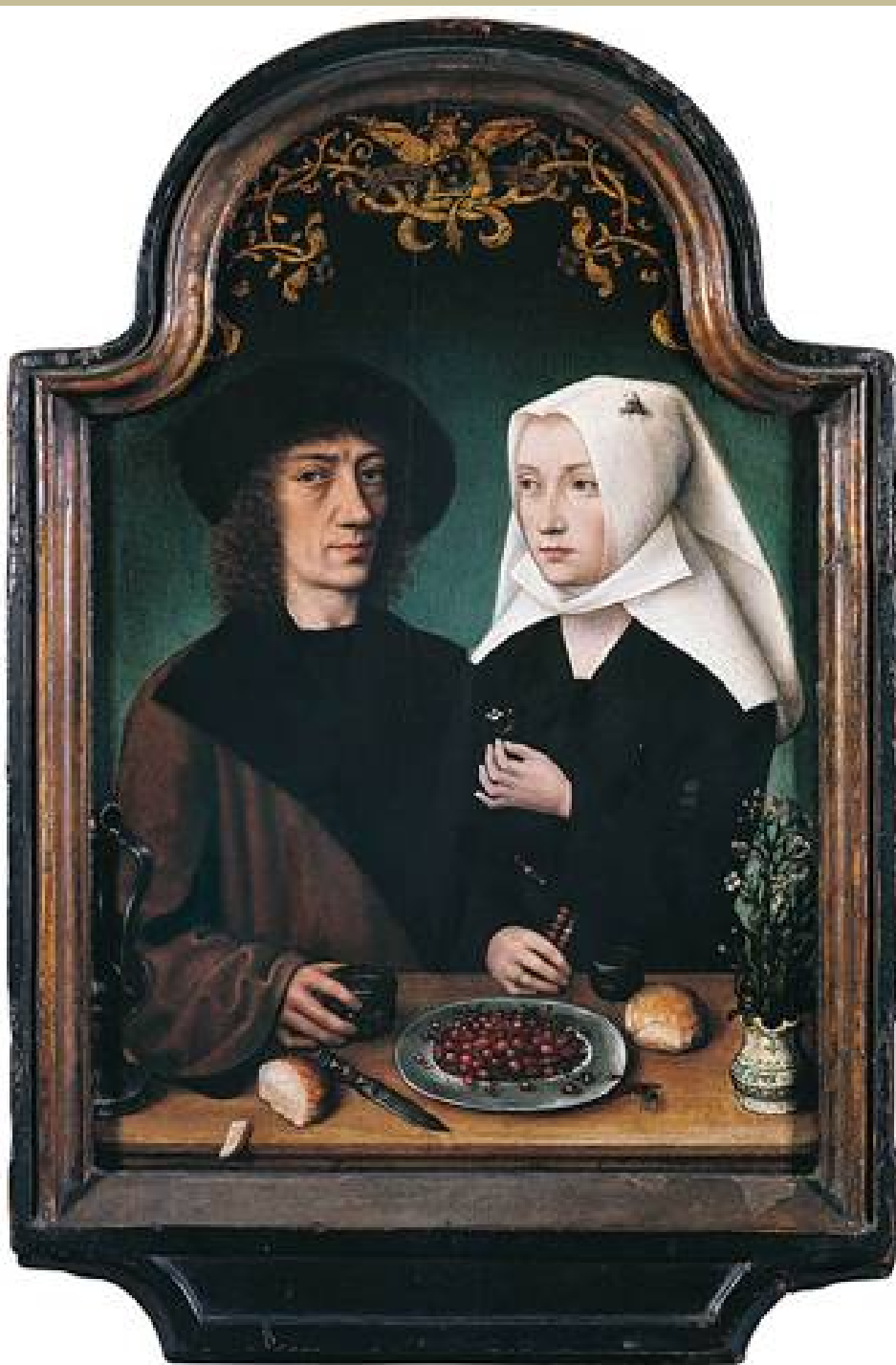
Maître de Francfort (Anvers, vers 1460 – Anvers, 1533), Portrait de l'artiste et de son épouse , 1496, peinture à l'huile sur bois, Anvers, musée royal des Beaux-Arts.