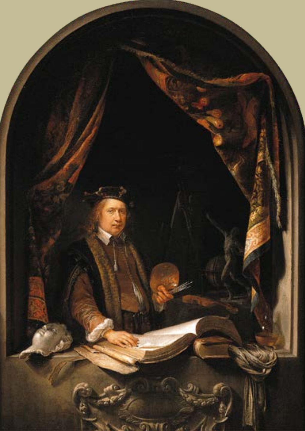
Gerrit Dou (Leyde, 1613 – Leyde, 1675), Autoportrait, vers 1665, peinture à l'huile sur bois, collection particulière.