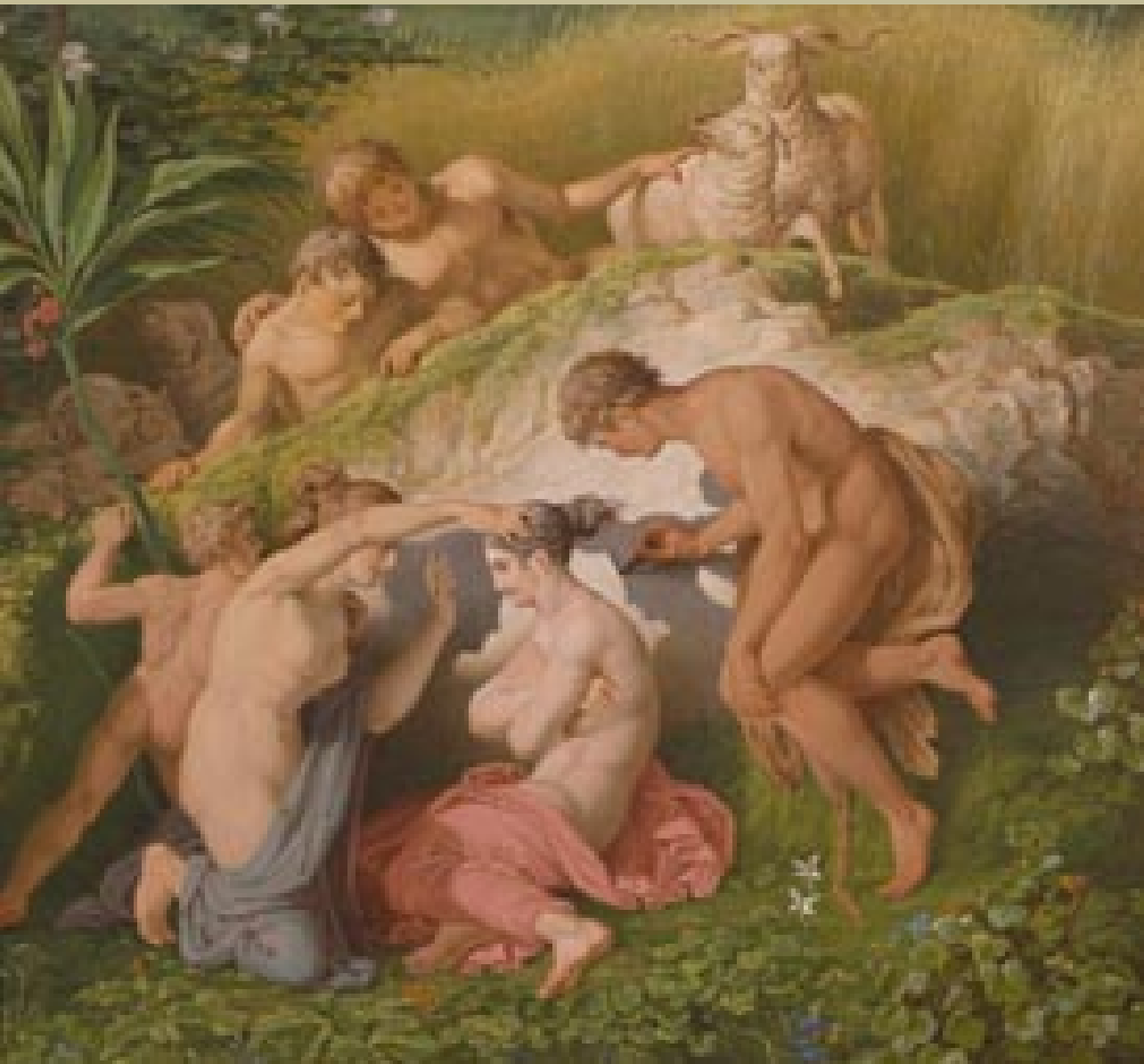
Karl Friedrich Schinkel (Neuruppin, 1781 – Berlin, 1841), L'Invention de la peinture, 1830, peinture à l'huile sur toile, Berlin, Nationalgalerie.