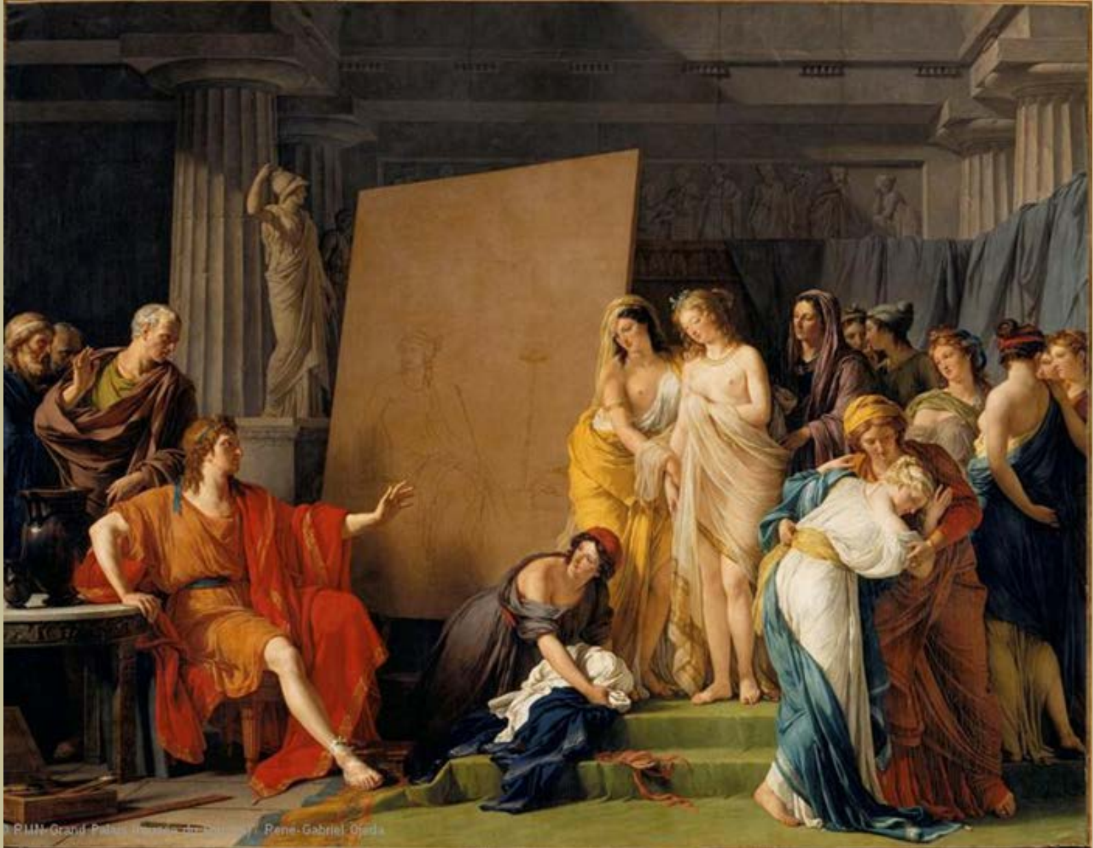
François André Vincent (Paris, 1746 – Paris, 1816), Zeuxis choisissant pour modèle les plus belles filles de Crotone , 1789, peinture à l'huile sur toile, Paris, musée du Louvre.