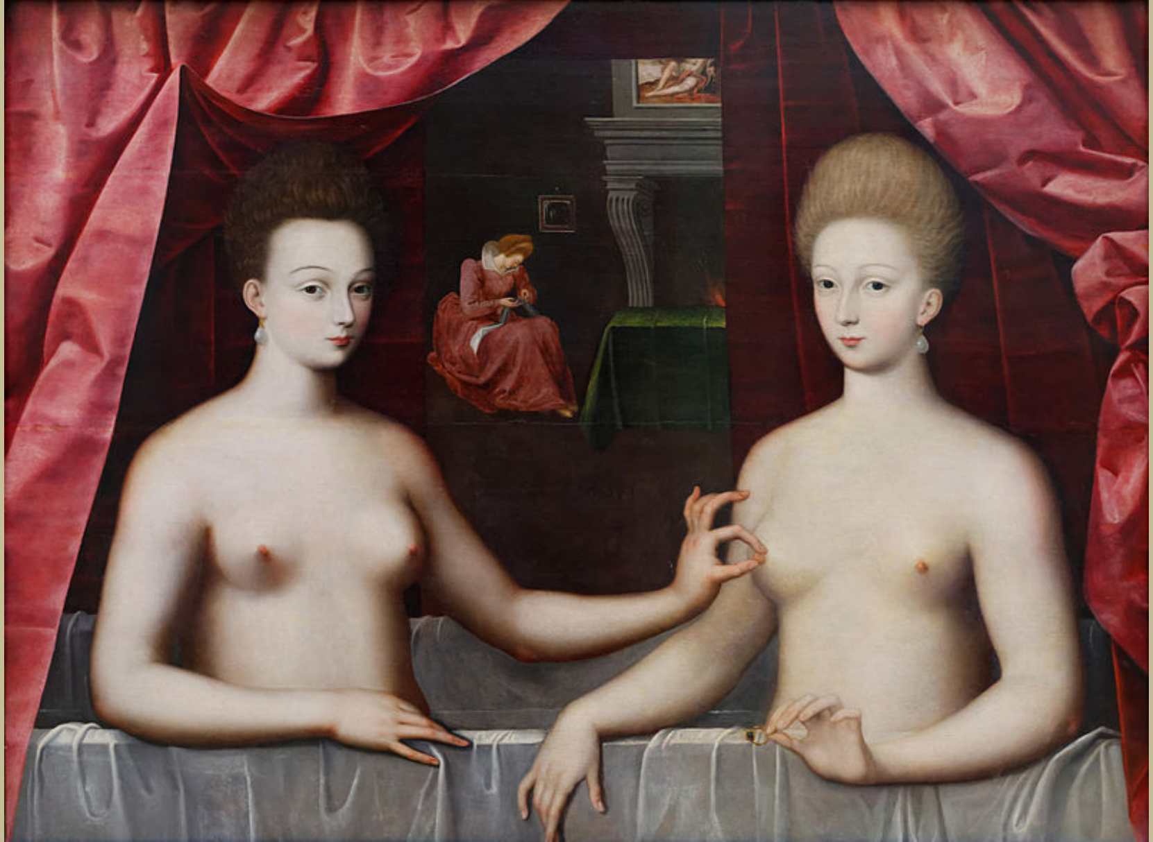
Ecole de Fontainebleau, XVI e siècle, Portrait présumé de Gabrielle d'Estrées et de sa sœur, la duchesse de Villars, vers 1594, peinture à l'huile sur toile, Paris, musée du Louvre.