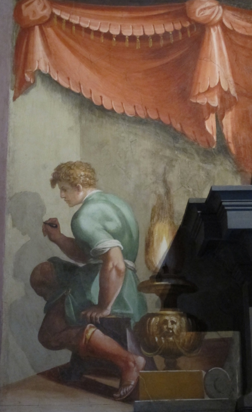
Giorgio Vasari (Arezzo, 1511 – Florence, 1574), L'Origine de la Peinture, vers 1572, fresque, Florence, Casa Vasari.