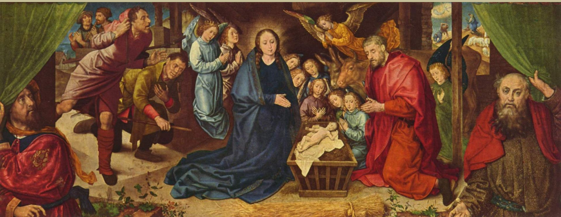
Hugo van der Goes (Gand, vers 1440 – Oudergem, 1482/3), Adoration des bergers , vers 1480, peinture à l'huile sur bois, Berlin, Gemäldegalerie.