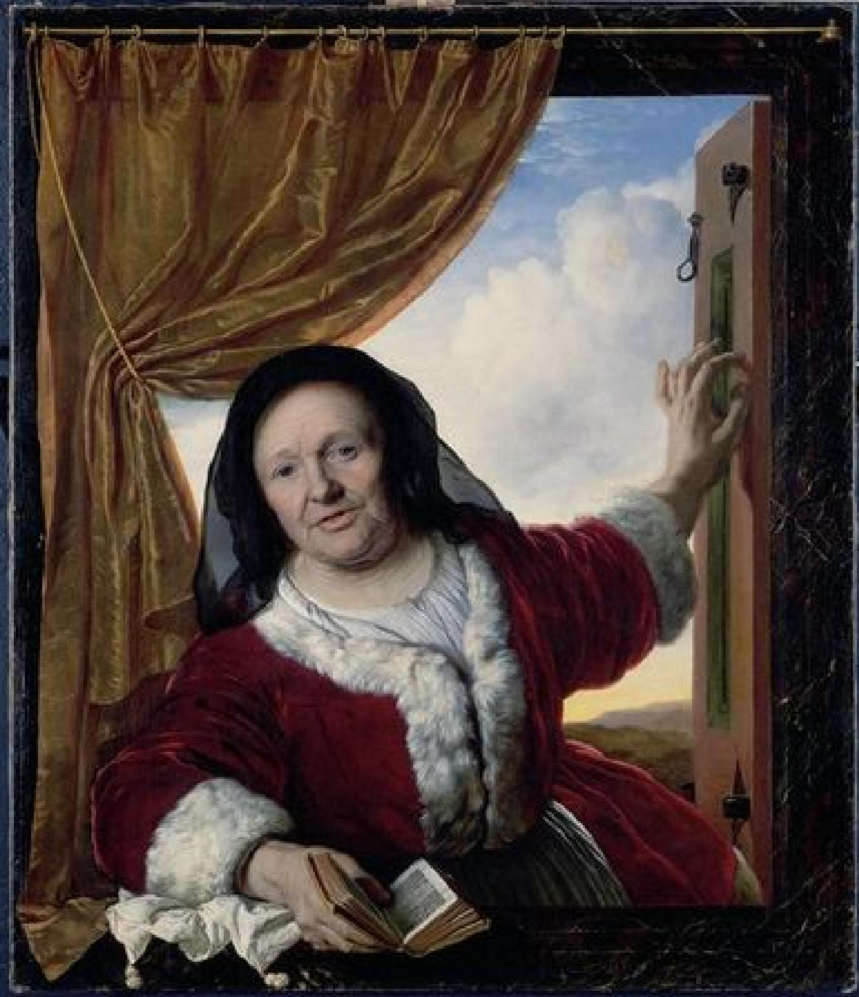
Bartholomeus van der Helst (Haarlem, 1613 – Amsterdam, 1670), Vieille femme à la fenêtre , vers 1660, peinture à l'huile sur toile, Leipzig, Museum der bildenden Künste.