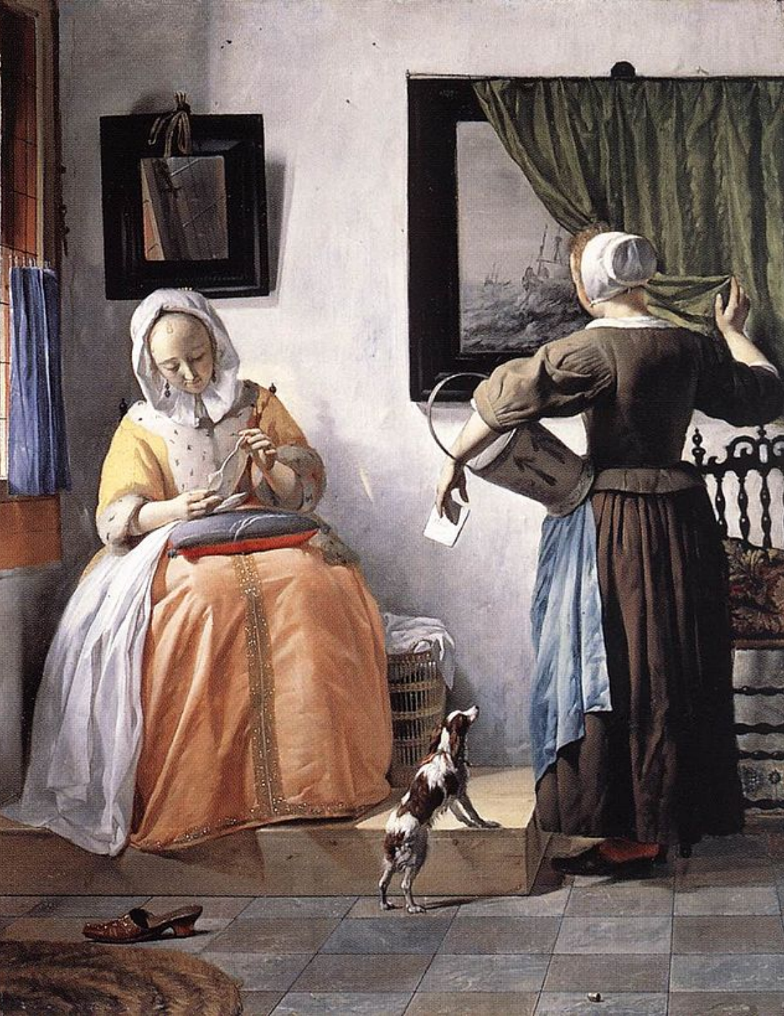
Gabriel Metsu (Leyde, 1629 – Amsterdam, 1667), Femme lisant une lettre, vers 1662/5, peinture à l'huile sur bois, Dublin, National Gallery of Ireland.