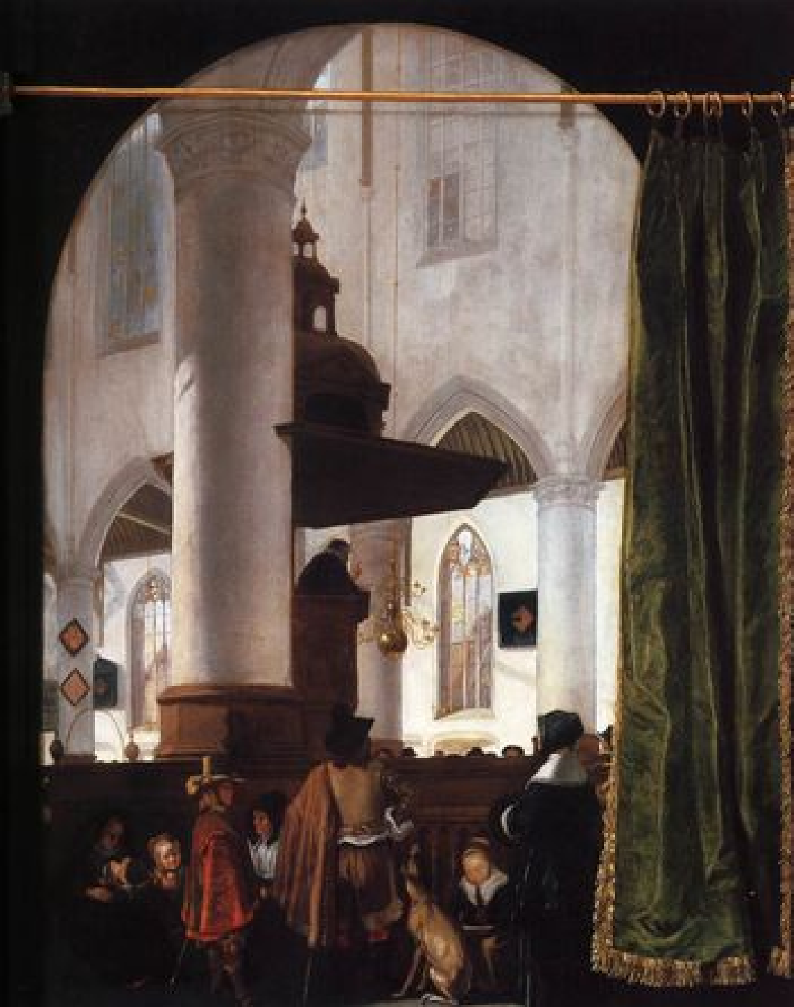
Emmanuel de Witte (Alkmaar, 1617 – Amsterdam, 1692), Un Sermon dans une église de Delft, 1651, peinture à l'huile sur bois, Ottawa, National Gallery of Canada.