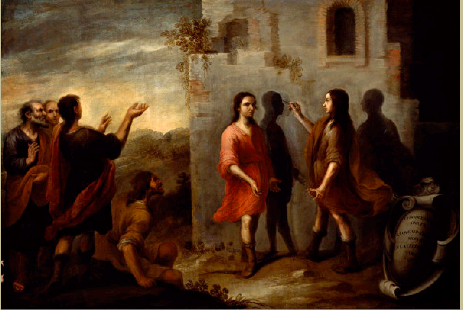
Bartolomé Esteban Murillo (Séville, 1617/8 – Séville, 1682), L'invention du dessin , 1665, peinture à l'huile sur toile, Bucarest, musée des Beaux-Arts.