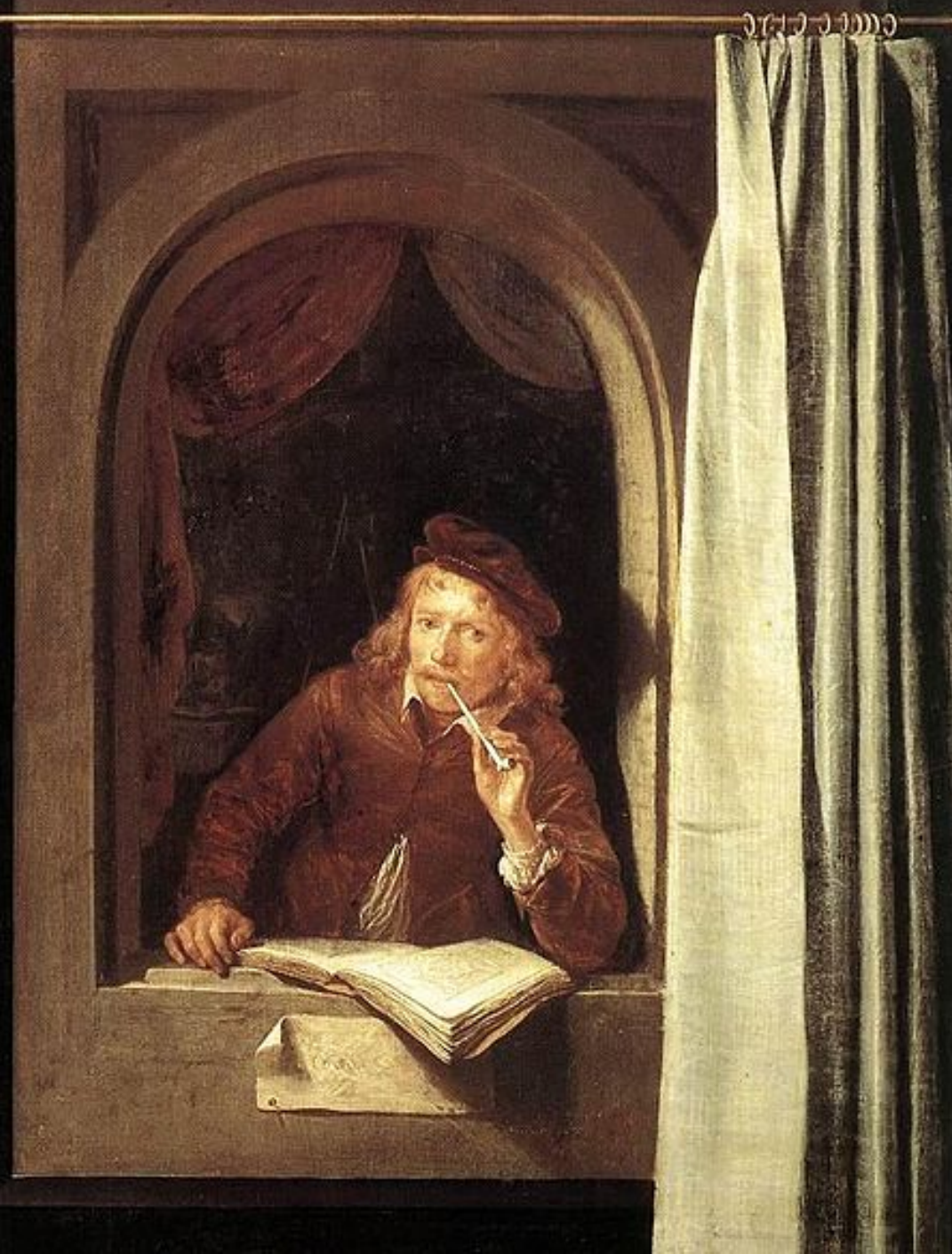
Gerrit Dou (Leyde, 1613 – Leyde, 1675), Autoportrait, 1640/50, peinture à l'huile sur bois, Amsterdam, Rijksmuseum.