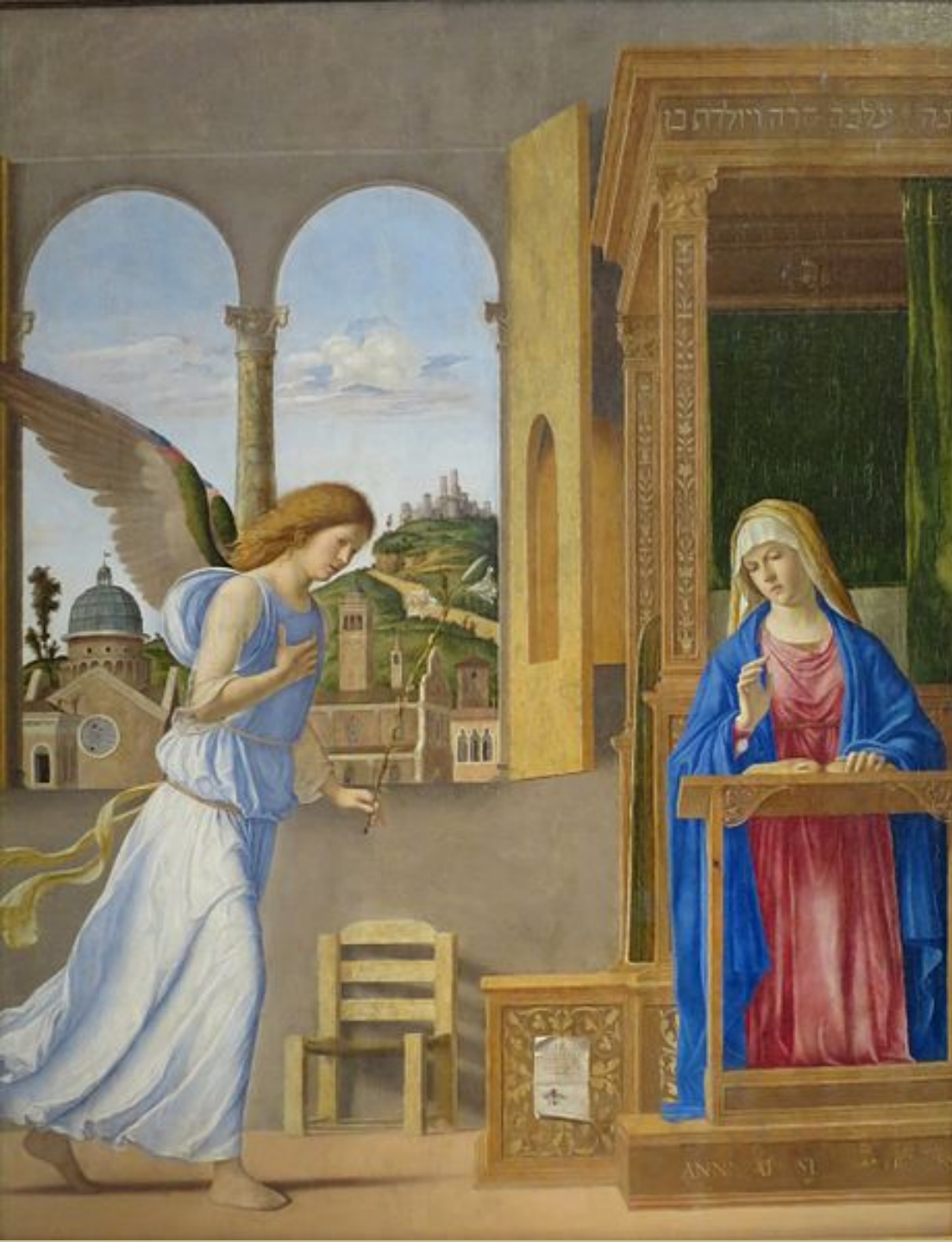
Cima da Conegliano (Conegliano, vers 1459 – Conegliano, vers 1517), L'Annonciation, 1495, peinture à l'huile sur bois, Saint-Pétersbourg, musée de l'Ermitage.