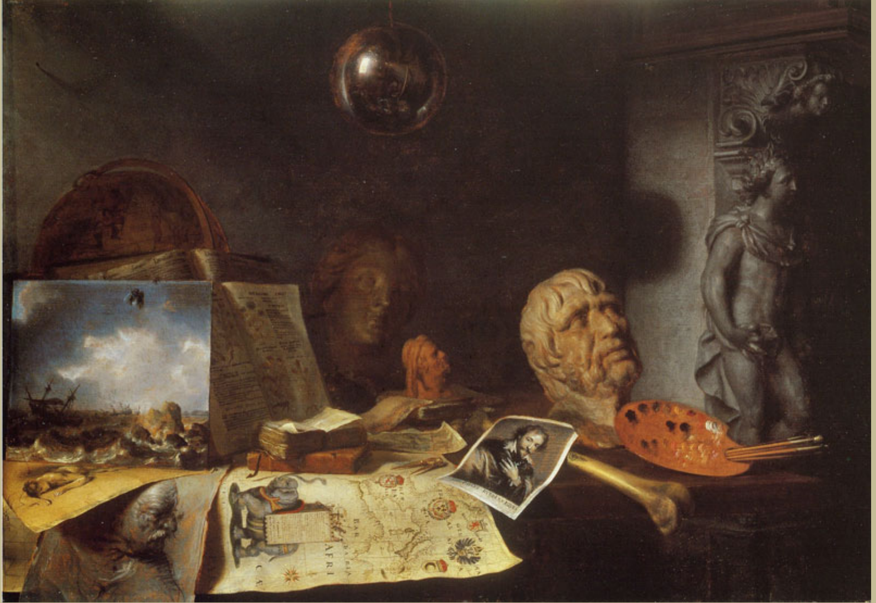
Simon Luttichuys (Londres, 1610 – Amsterdam, 1661), Vanité. Allégorie des Arts , 1646, peinture à l'huile sur bois, collection particulière.