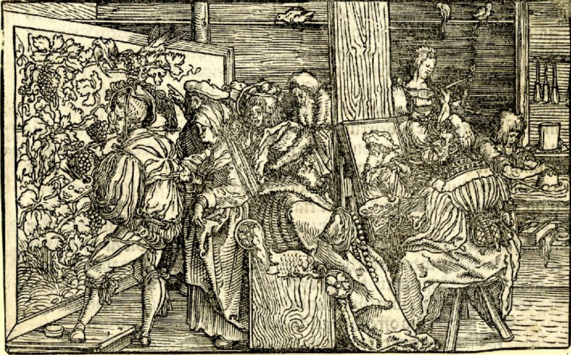
Hans Weiditz (Fribourg-en-Brisgau, 1495 – Berne, vers 1537), L'Atelier de Zeuxis , vers 1520, xylographie, Londres, British Museum.