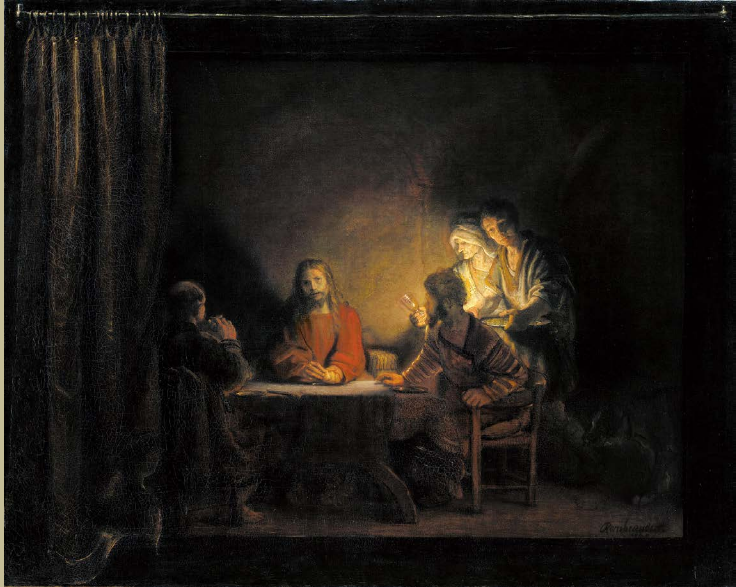
Atelier de Rembrandt Harmenszoon van Rijn, dit Rembrandt (Leyde, 1606 – Amsterdam, 1669), Le Souper à Emmaüs , 1648, peinture à l'huile sur toile, Copenhague, Statens Museum for Kunst.