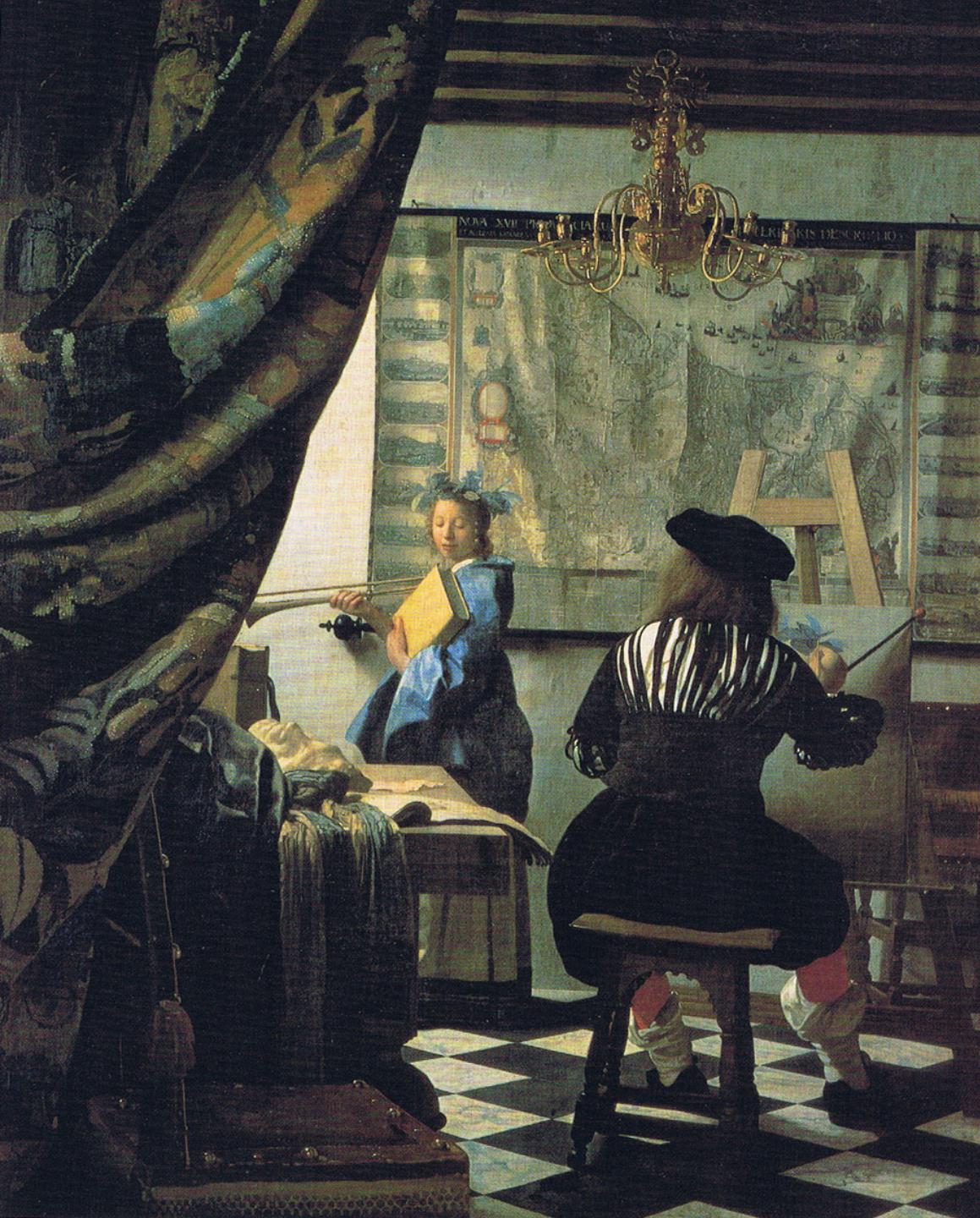
Johannes Vermeer (Delft, 1632 – Delft, 1675), L'Atelier, vers 1666, peinture à l'huile sur toile, Vienne, Kunsthistorisches Museum.