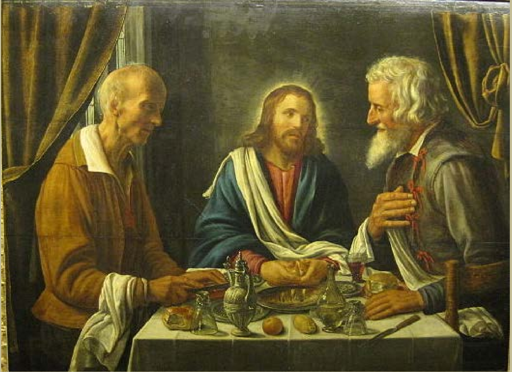
Hermann van Vollenhoven (Utrecht ?, vers 1580 – ?, 1628), Les Pèlerins d'Emmaüs , vers 1615, peinture à l'huile sur bois, Besançon, musée des Beaux-Arts et d'Archéologie.