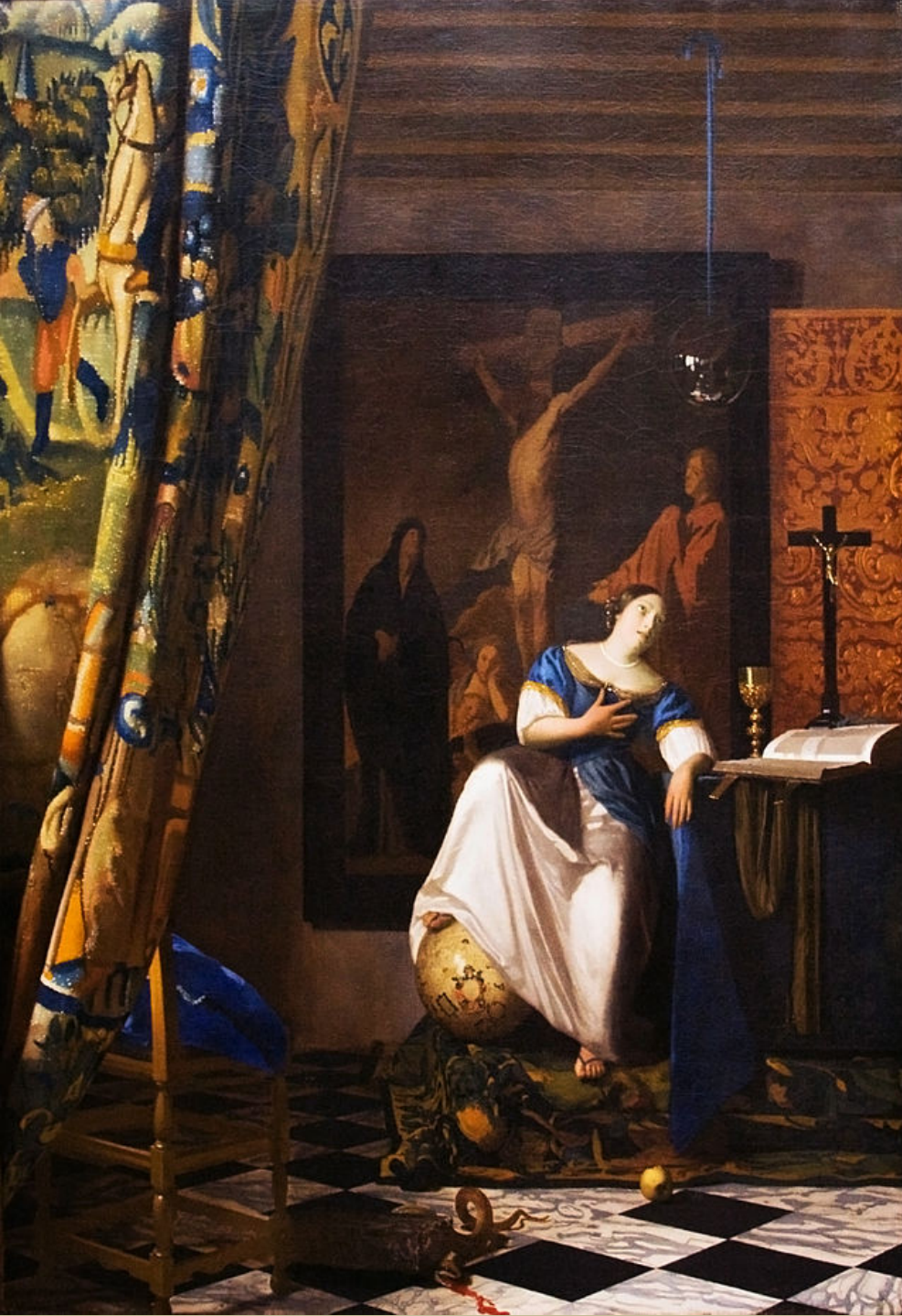
Johannes Vermeer (Delft, 1632 – Delft, 1675), Allégorie de la Foi, vers 1670/4, peinture à l'huile sur toile, New York, The Metropolitan Museum of Art.