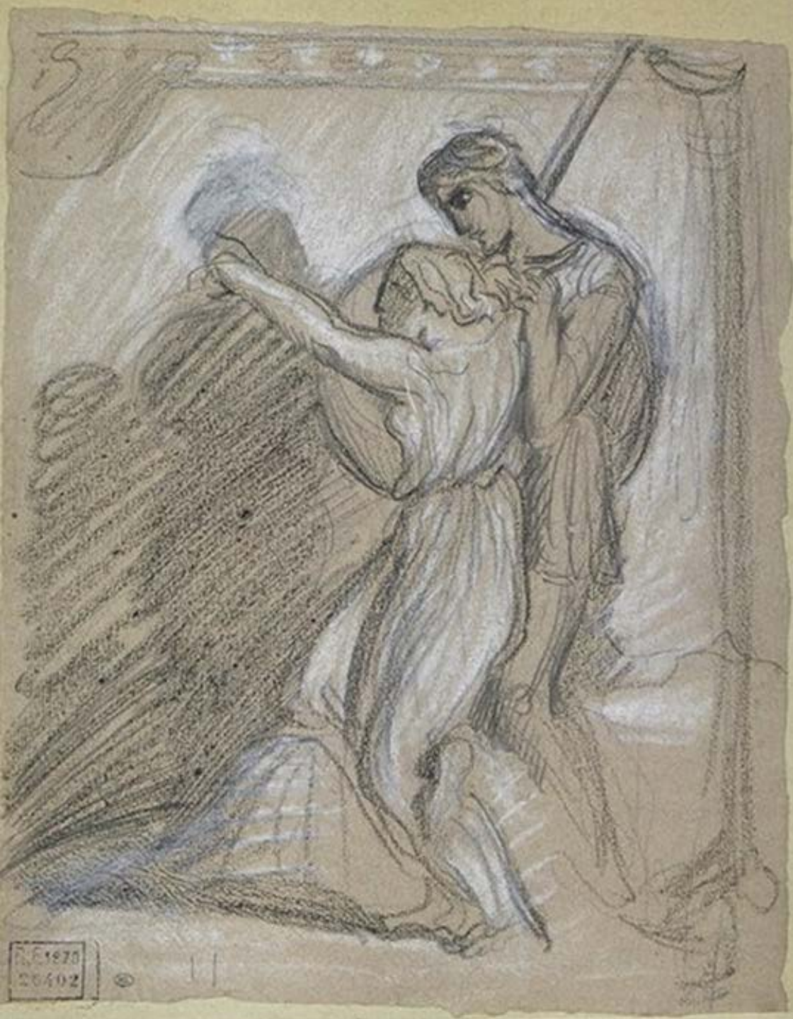
Théodore Chassériau (Santa Bárbara de Samaná, République Dominicaine, 1819 – Paris, 1856), La Fille de Dibutade dessinant le portrait de son amant, vers 1840, pierre noire et rehauts de craie blanche, Paris, musée du Louvre.