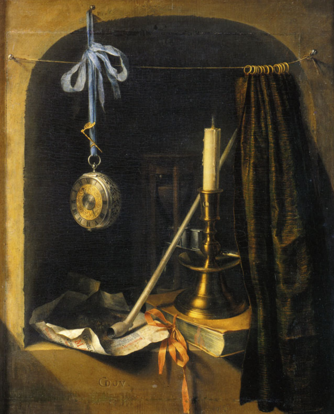
Gerrit Dou (Leyde, 1613 – Leyde, 1675), Nature morte au bougeoir et à la montre, vers 1660, peinture à l'huile sur bois, Dresde, Gemäldegalerie Alte Meister.