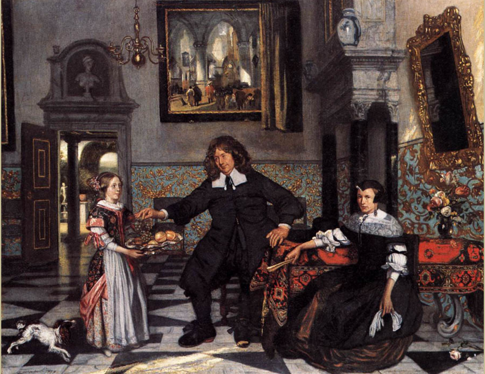
Emmanuel de Witte (Alkmaar, 1617 – Amsterdam, 1692), Portrait d'une famille dans un intérieur , 1678, peinture à l'huile sur toile, Munich, Alte Pinakothek.