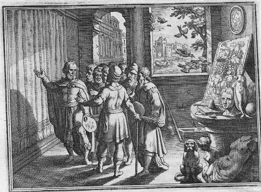
Italie, XVIIe siècle, Zeuxis et Parrhasius , vers 1630, eau-forte, Paris, Bibliothèque nationale de France.