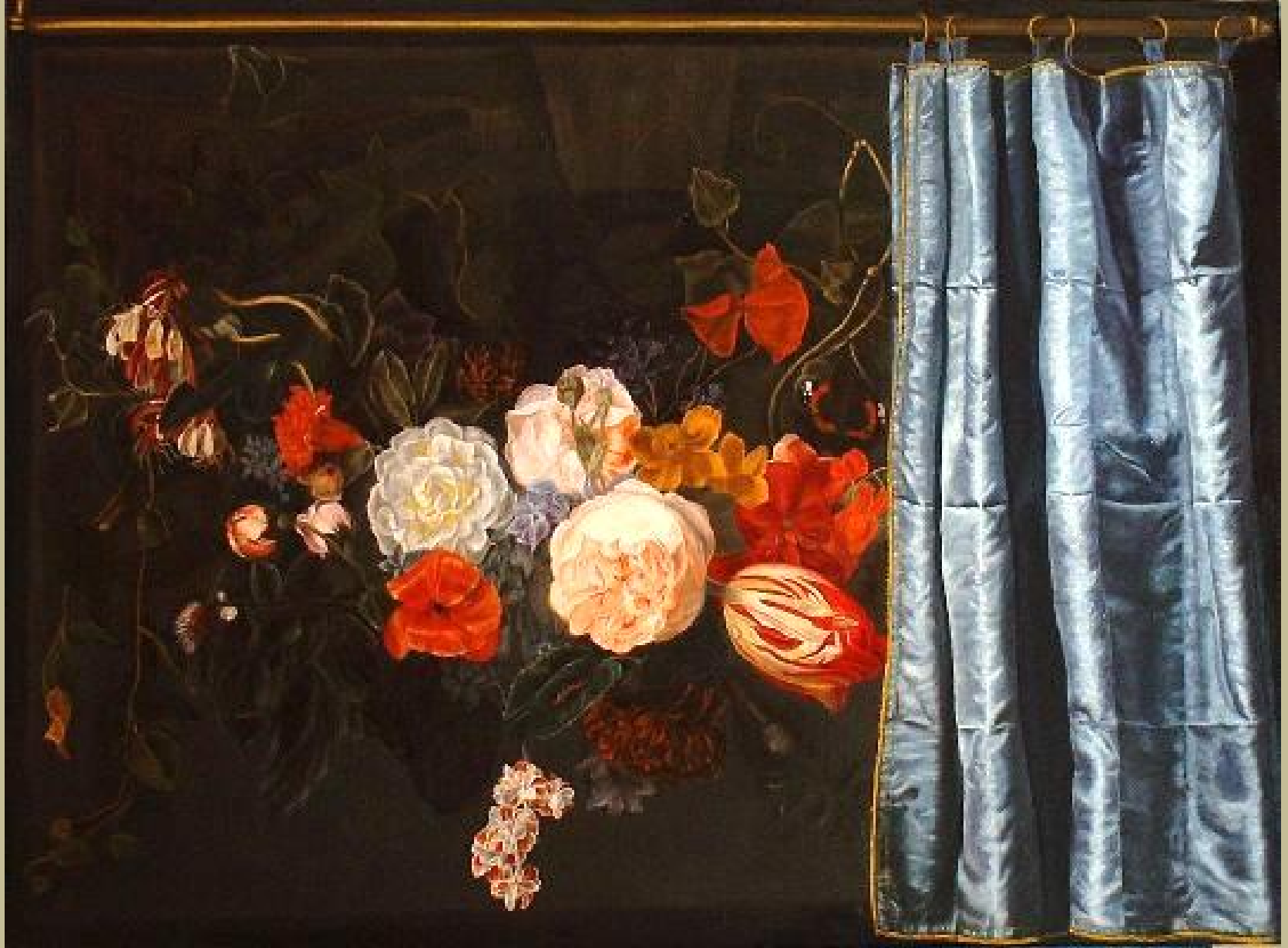
Adriaen van der Spelt (Leyde, vers 1630 – Gouda, 1673), Nature morte de fleurs avec rideau , 1658, peinture à l'huile sur bois, Chicago, The Art Institute.