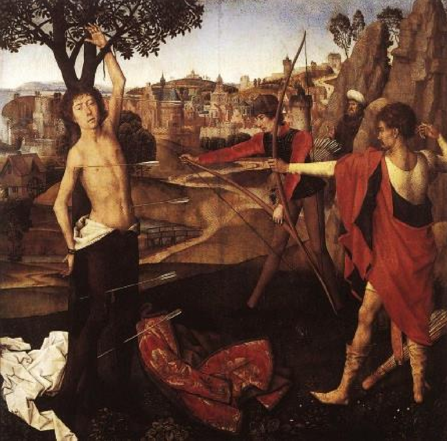
Hans Memling (Selingenstift, vers 1435/40 – Bruges, 1494), Le Martyre de saint Sébastien , 1475, peinture à l'huile sur bois, Bruxelles, Musées royaux des Beaux-Arts de Belgique.