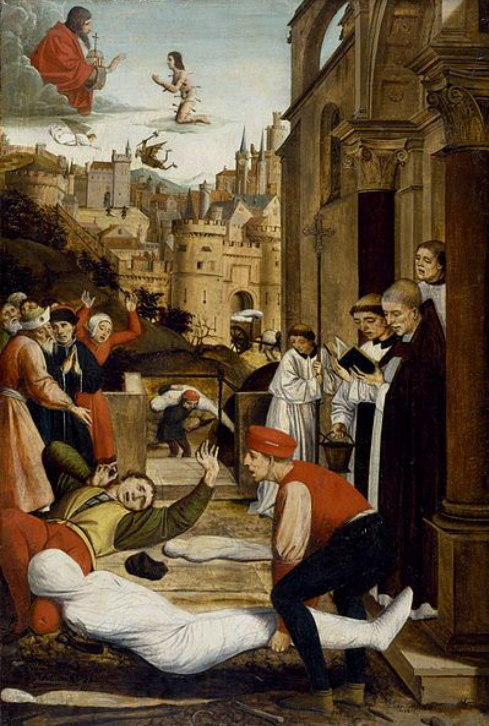
Intervention de saint Sébastien pendant la peste à Rome, Baltimore, The Walters Art Gallery.