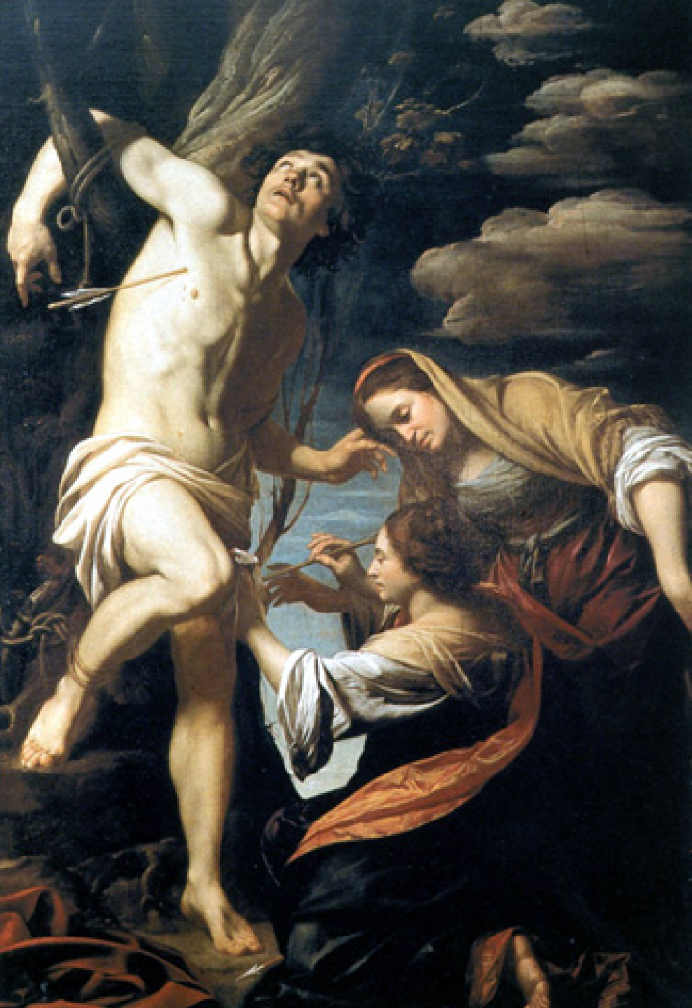
Simon Vouet (Paris, 1590 – Paris, 1649), Saint Sébastien soigné par Irène, 1622, peinture à l'huile sur toile, Naples, musée de Capodimonte.