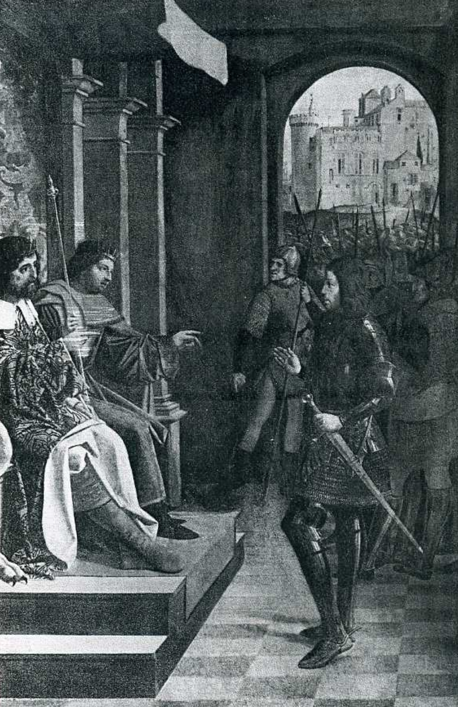
Sébastien devant les empereurs Dioclétien et Maximien, Saint-Pétersbourg, musée de l'Ermitage.