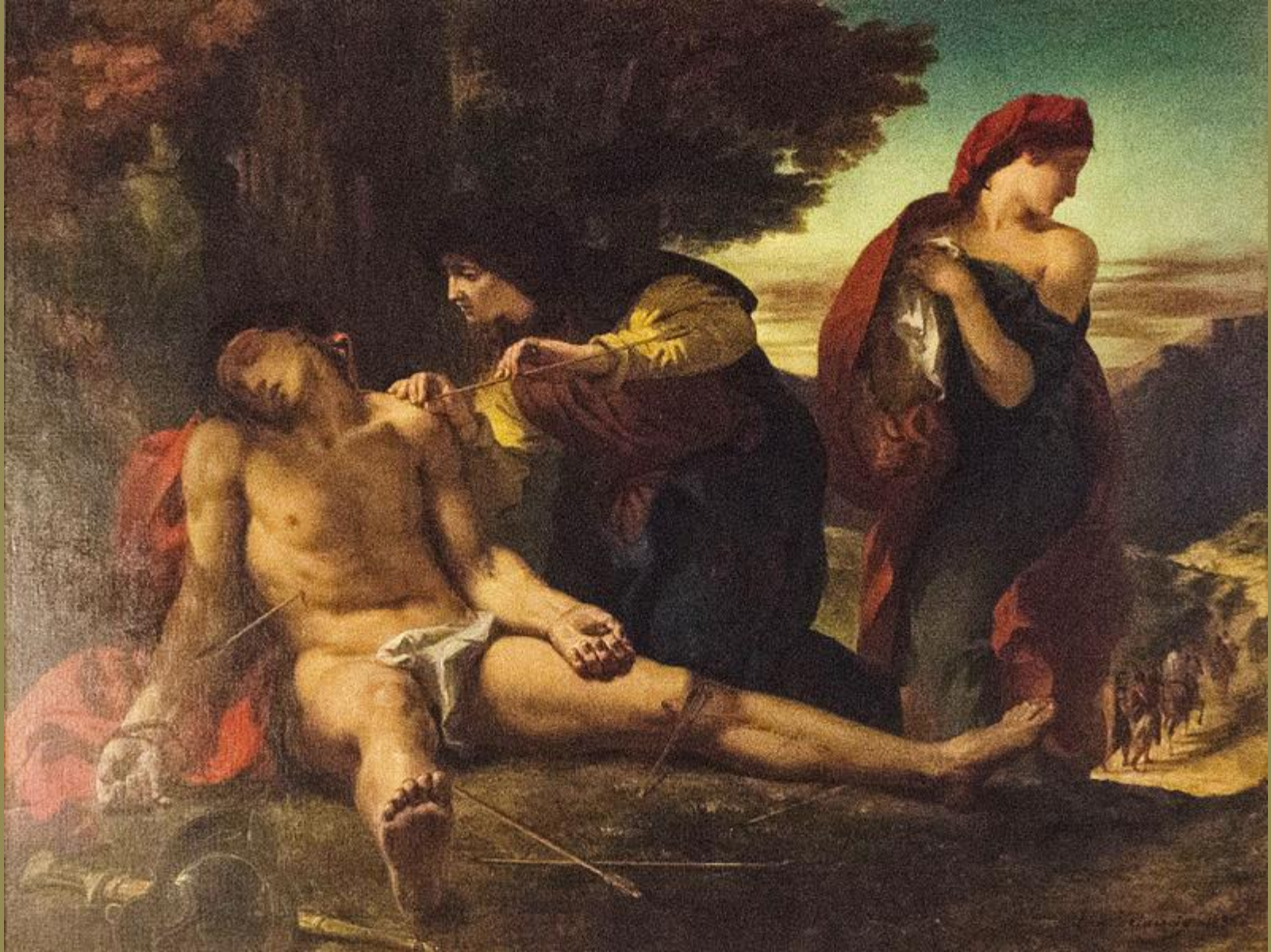
Eugène Delacroix (Charenton-Saint-Maurice, 1798 – Paris, 1863), Saint Sébastien soigné par Irène , 1836, peinture à l'huile sur toile, Nantua, église.