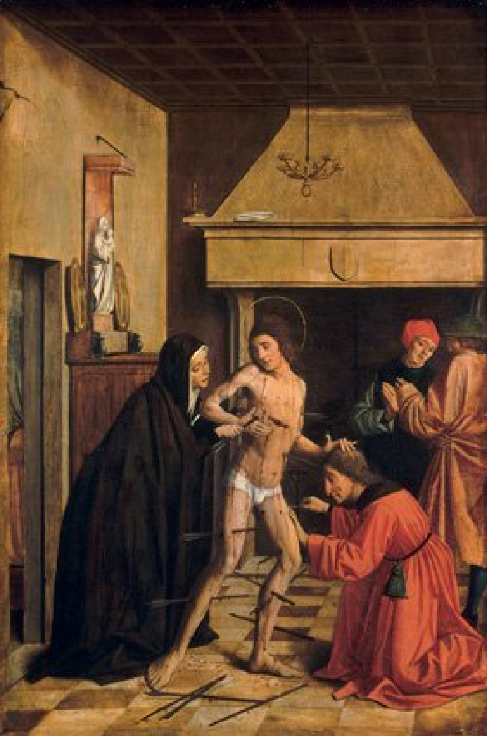
Saint Sébastien soigné par Irène, Philadelphie, Philadelphia Museum of Art.