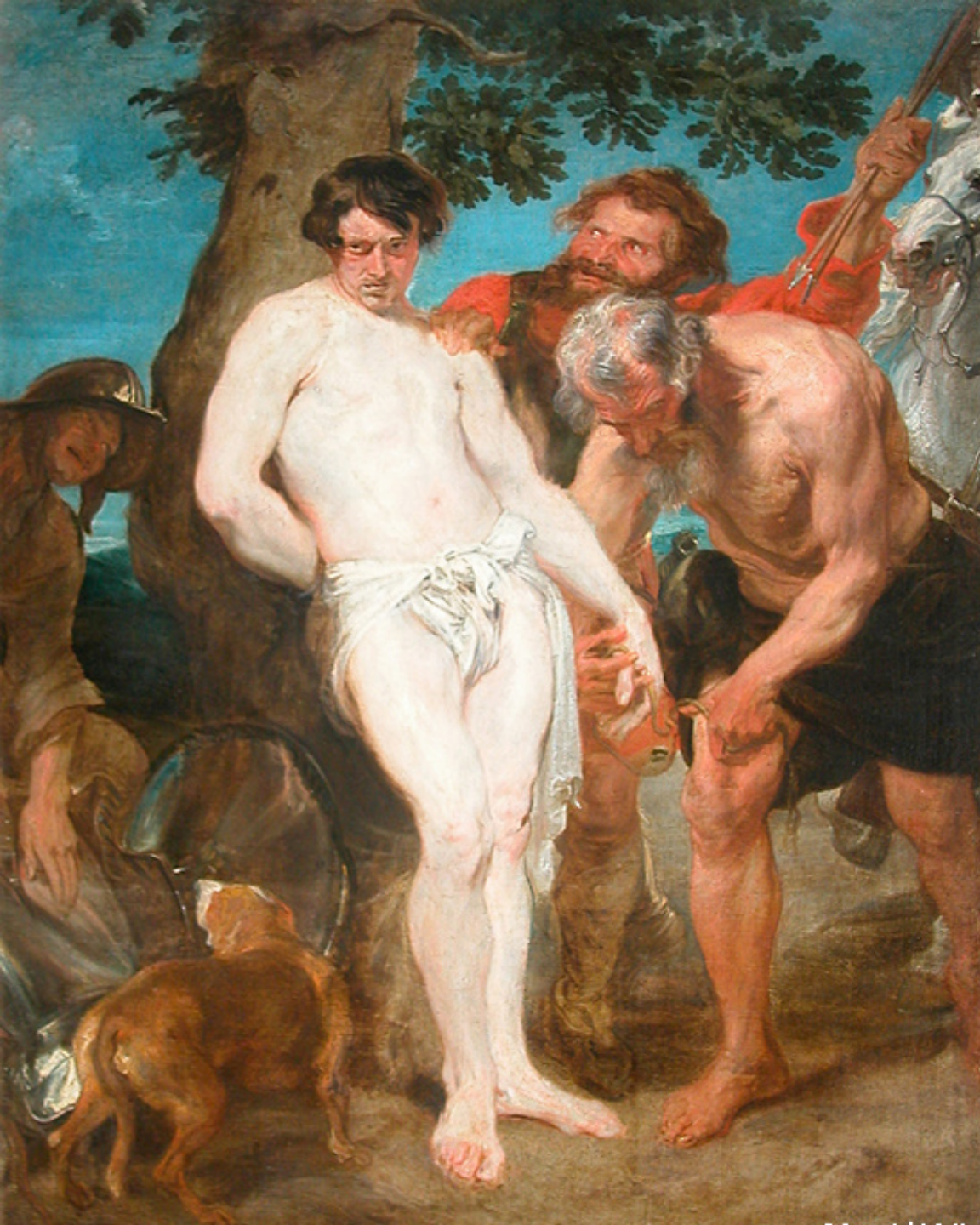
Antoon Van Dyck (Anvers, 1599 – Blackfriar's, 1641), Préparatifs du martyre de saint Sébastien , 1617/8, peinture à l'huile sur toile, Paris, musée du Louvre.