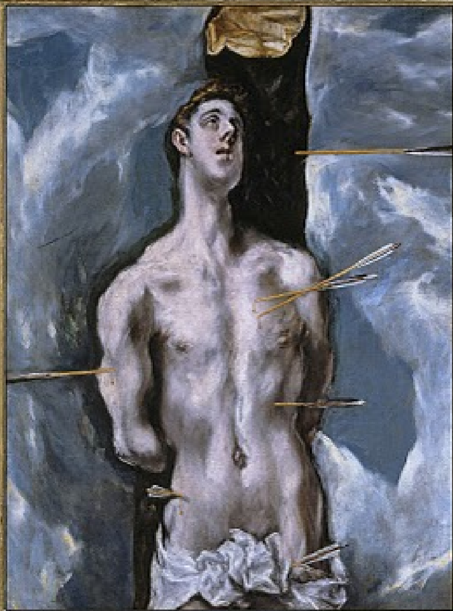
Dominikos Theotokopoulos, dit Le Greco, (Candie, vers 1541 – Tolède, 1614), Saint Sébastien , 1610/4, peinture à l'huile sur toile, Madrid, musée du Prado.