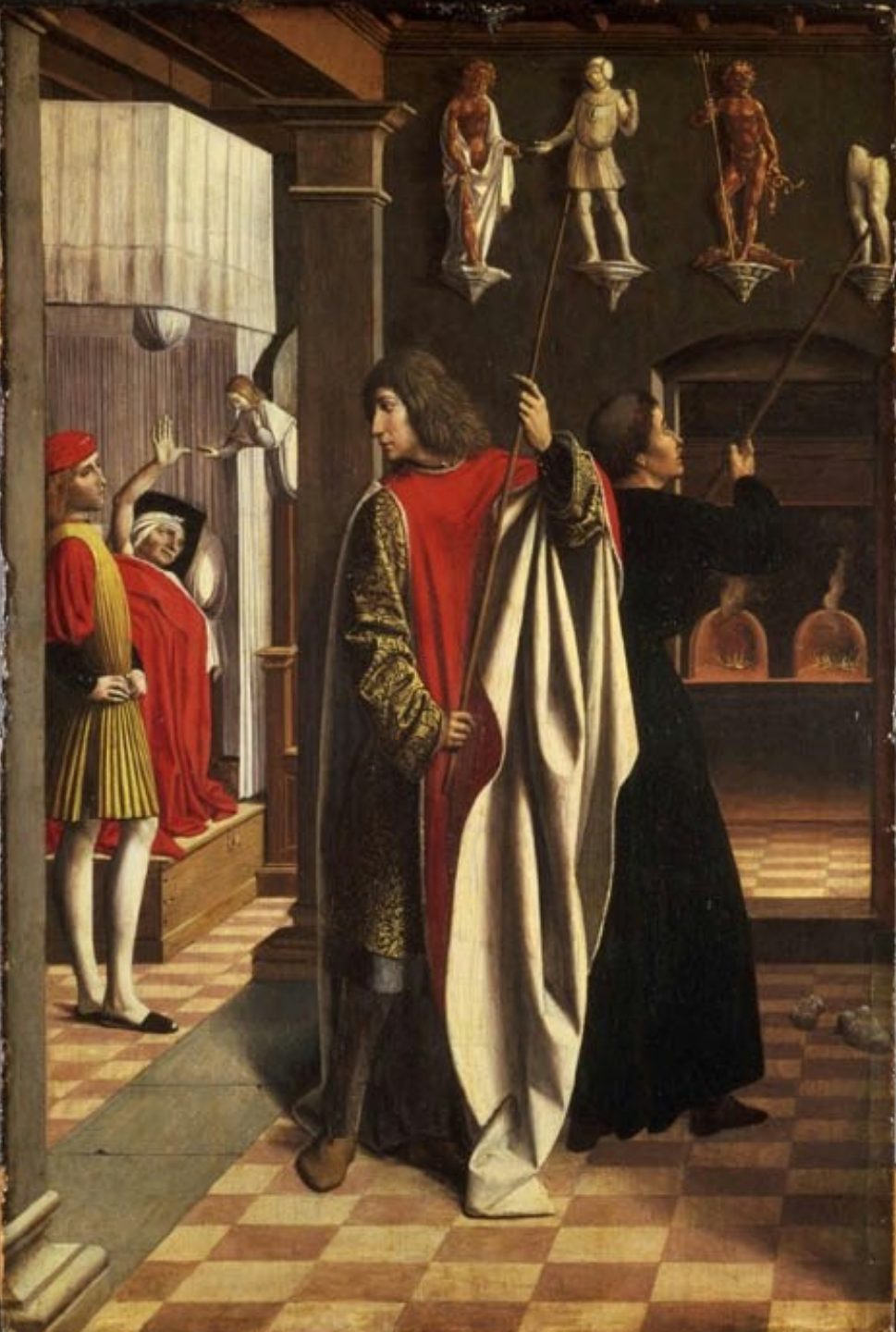
Josse Lieferinxe (Lieferinge ?, diocèse de Cambrai, vers 1460 ? – Marseille ?, vers 1505), Sébastien et Polycarpe détruisant les idoles chez le préfet Chromace, en présence de son fils Tiburce, 1497/8, peinture à l'huile sur bois, Philadelphie, Philadelphia Museum of Art.