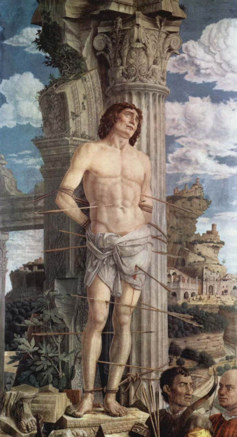
Andrea Mantegna (Isola di Carturo, vers 1431 – Mantoue, 1506), Le Martyre de saint Sébastien, vers 1480, tempera sur toile, Paris, musée du Louvre.