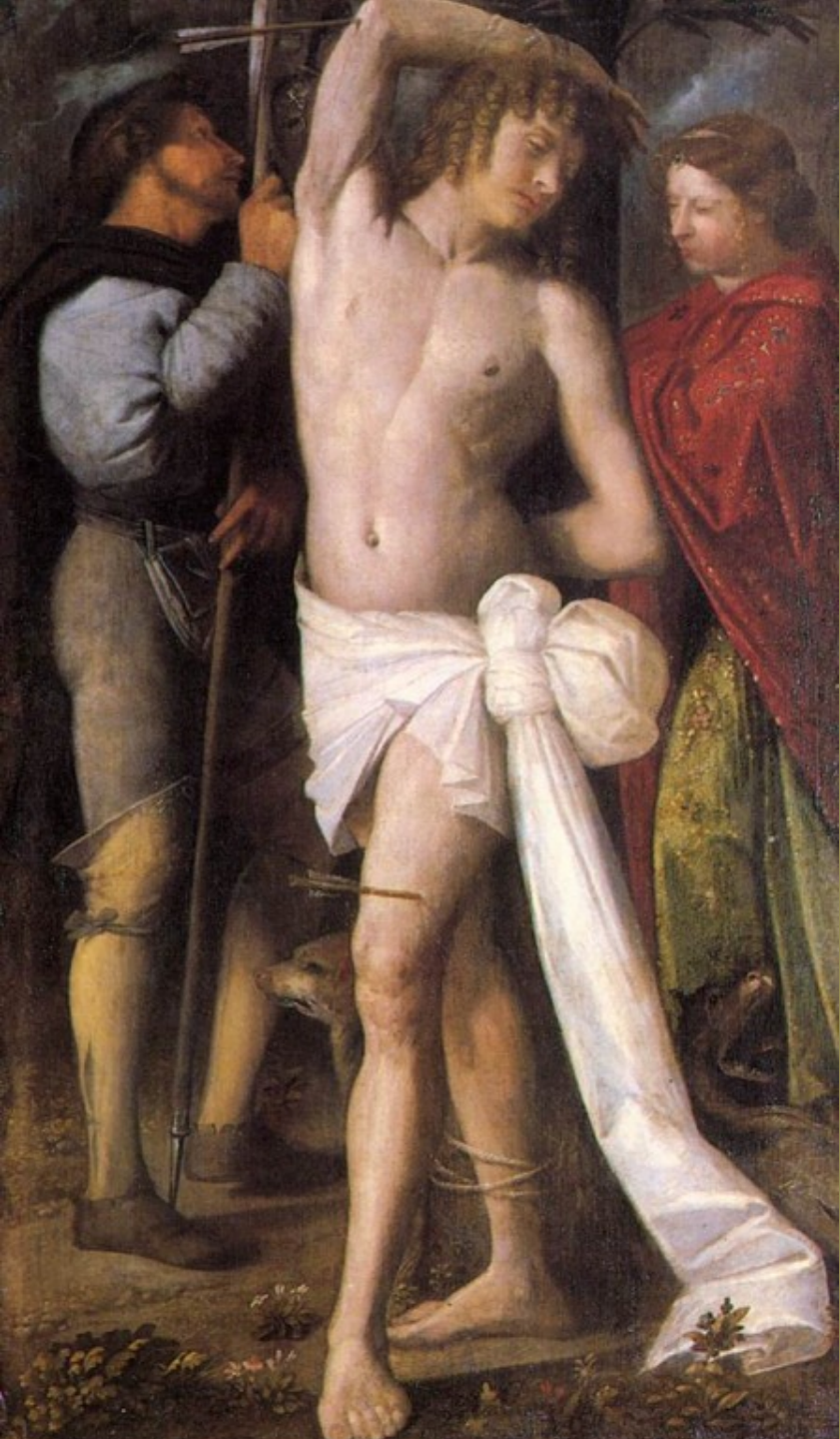
Giovanni Cariani (Fuipiano al Brembo, 1485 – Venise, 1547), Saint Roch, saint Sébastien et sainte Marguerite, vers 1510, peinture à l'huile sur toile, Marseille, musée des Beaux-Arts.