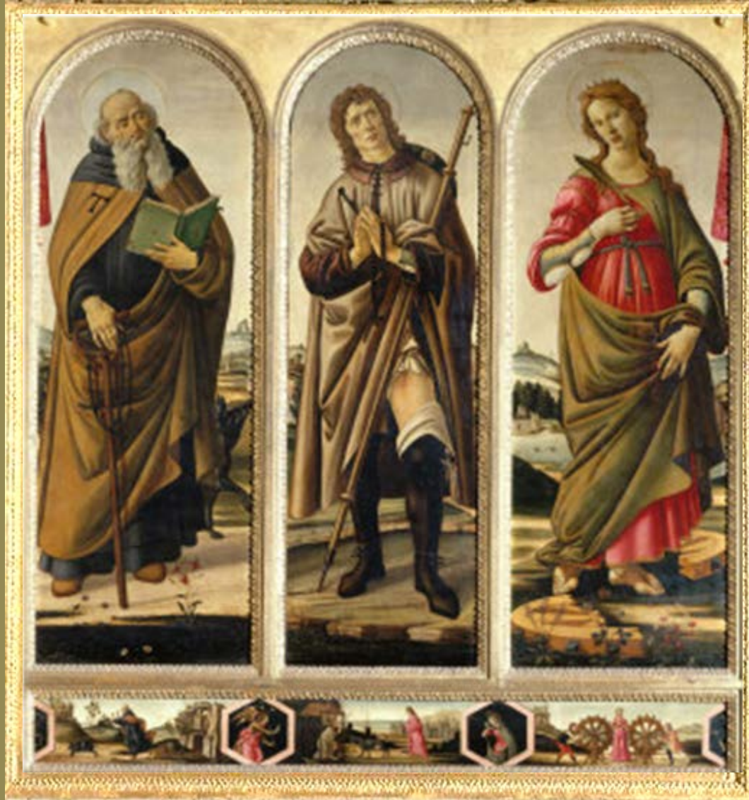
Sandro Botticelli (Florence, 1445 – Florence, 1510), Triptyque : Saint Antoine, saint Roch et sainte Catherine , peinture sur bois, vers 1500, Florence, église San Felice.