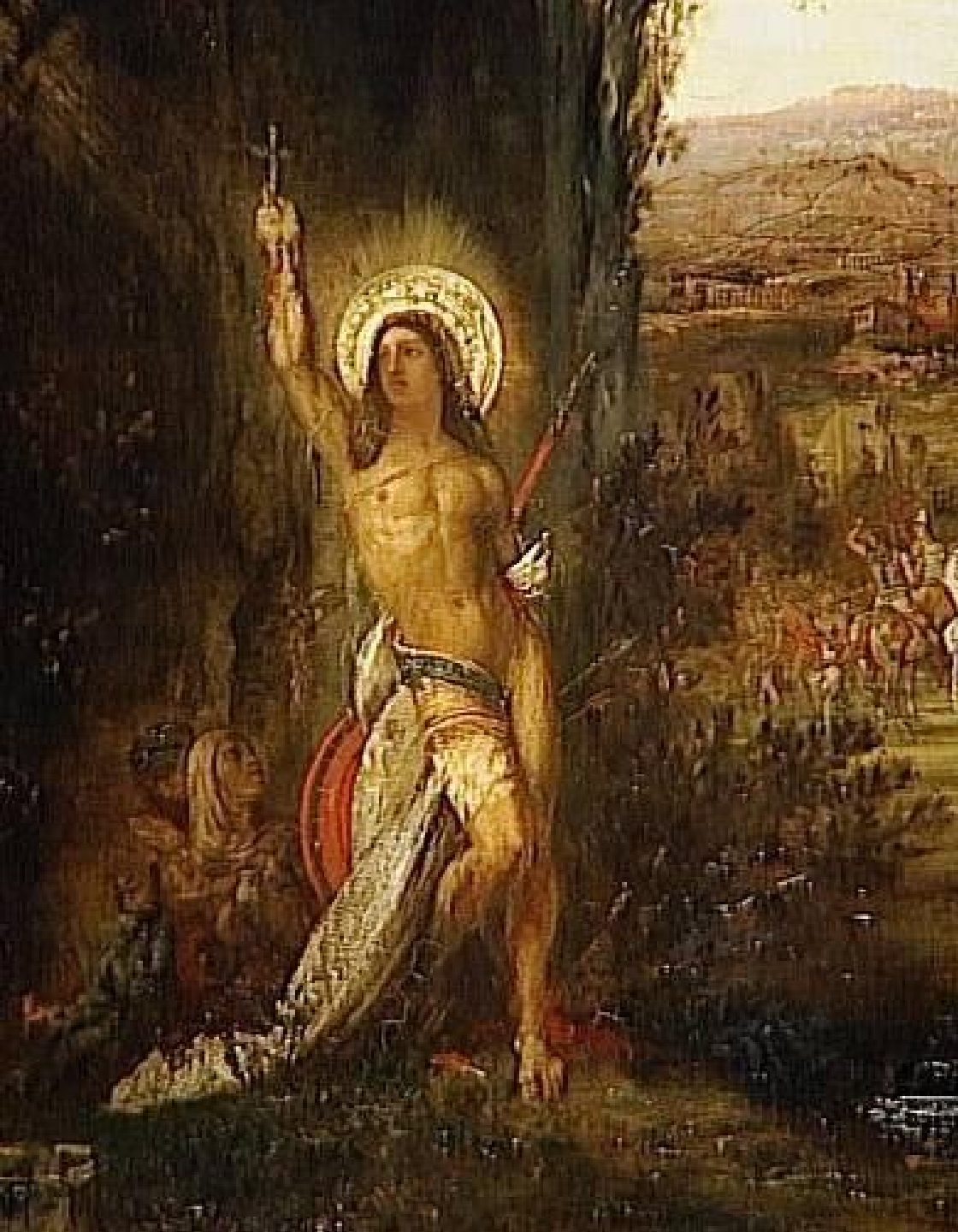
Gustave Moreau (Paris, 1826 – Paris, 1898), Saint Sébastien , vers 1875, peinture à l'huile sur toile, Paris, musée Gustave Moreau.