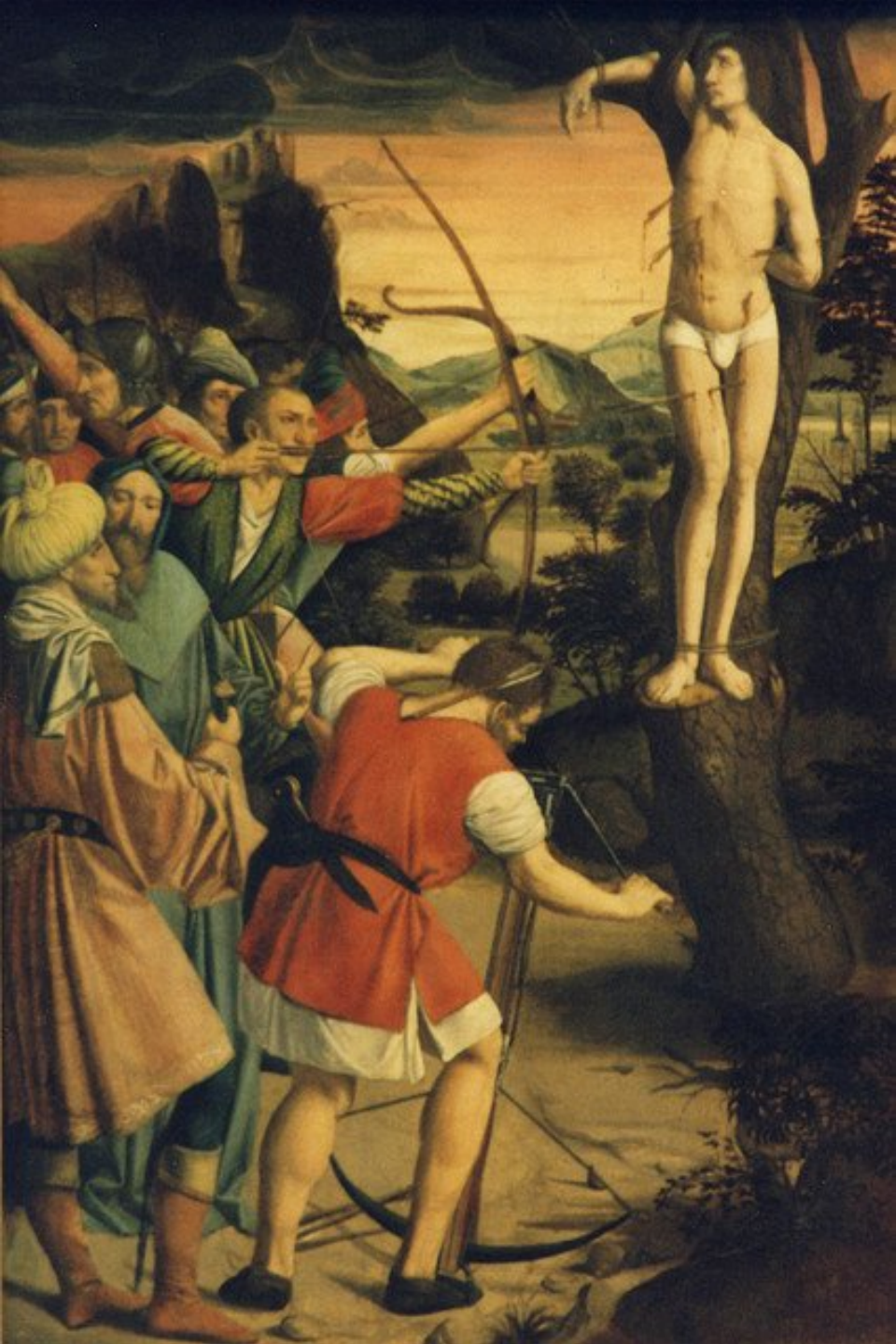
Martyre de saint Sébastien, Philadelphie, Philadelphia Museum of Art.