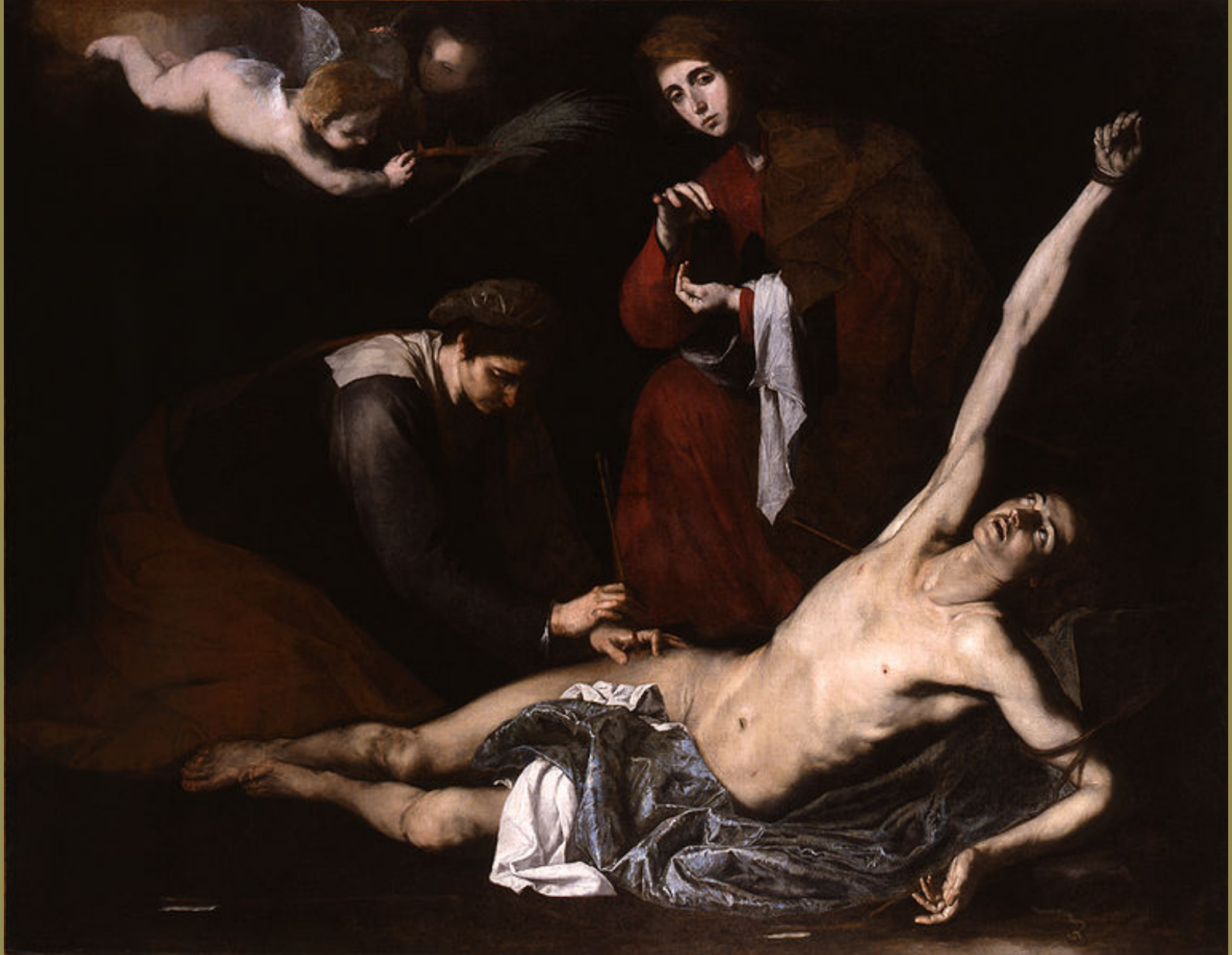
Jusepe de Ribera (Jativa, 1591 – Naples, 1652), Saint Sébastien soigné par Irène , vers 1635, peinture à l'huile sur toile, Bilbao, musée des Beaux-Arts.