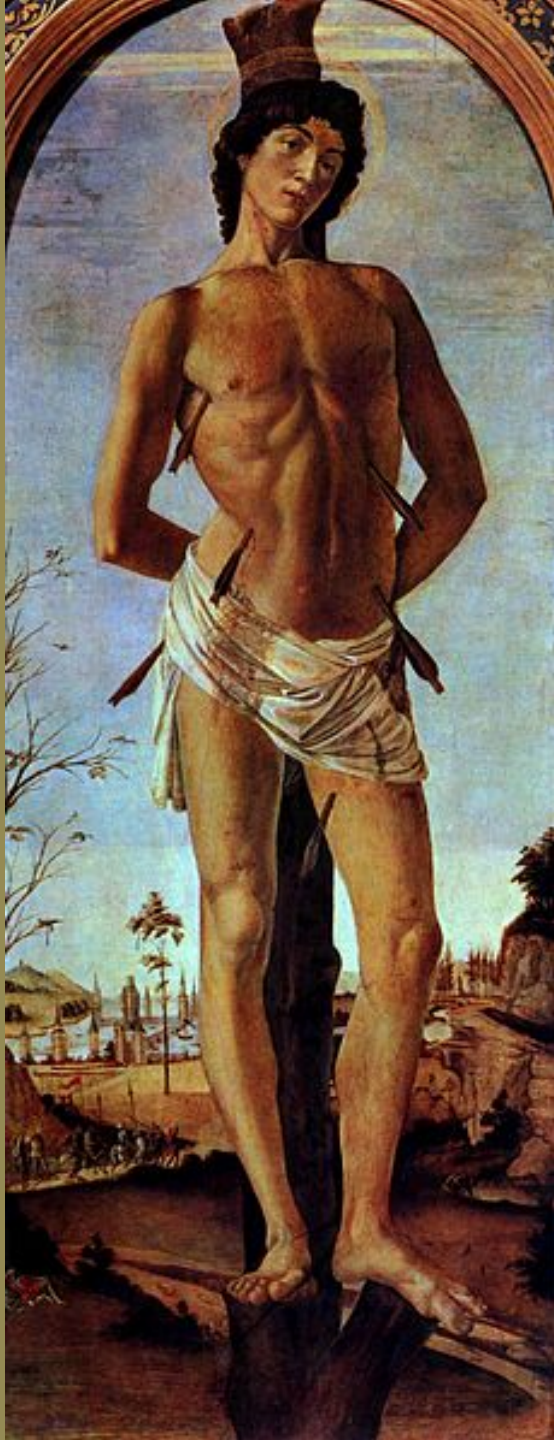
Sandro Botticelli, (Florence, 1445 – Florence, 1510), Saint Sébastien , 1473, tempera sur bois, Berlin, Gemäldegalerie.