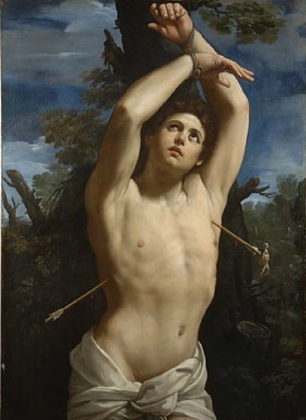
Guido Reni (Calvenzano, 1575 – Bologne, 1642), Saint Sébastien, 1615, peinture à l'huile sur toile, Rome, musée du Capitole.