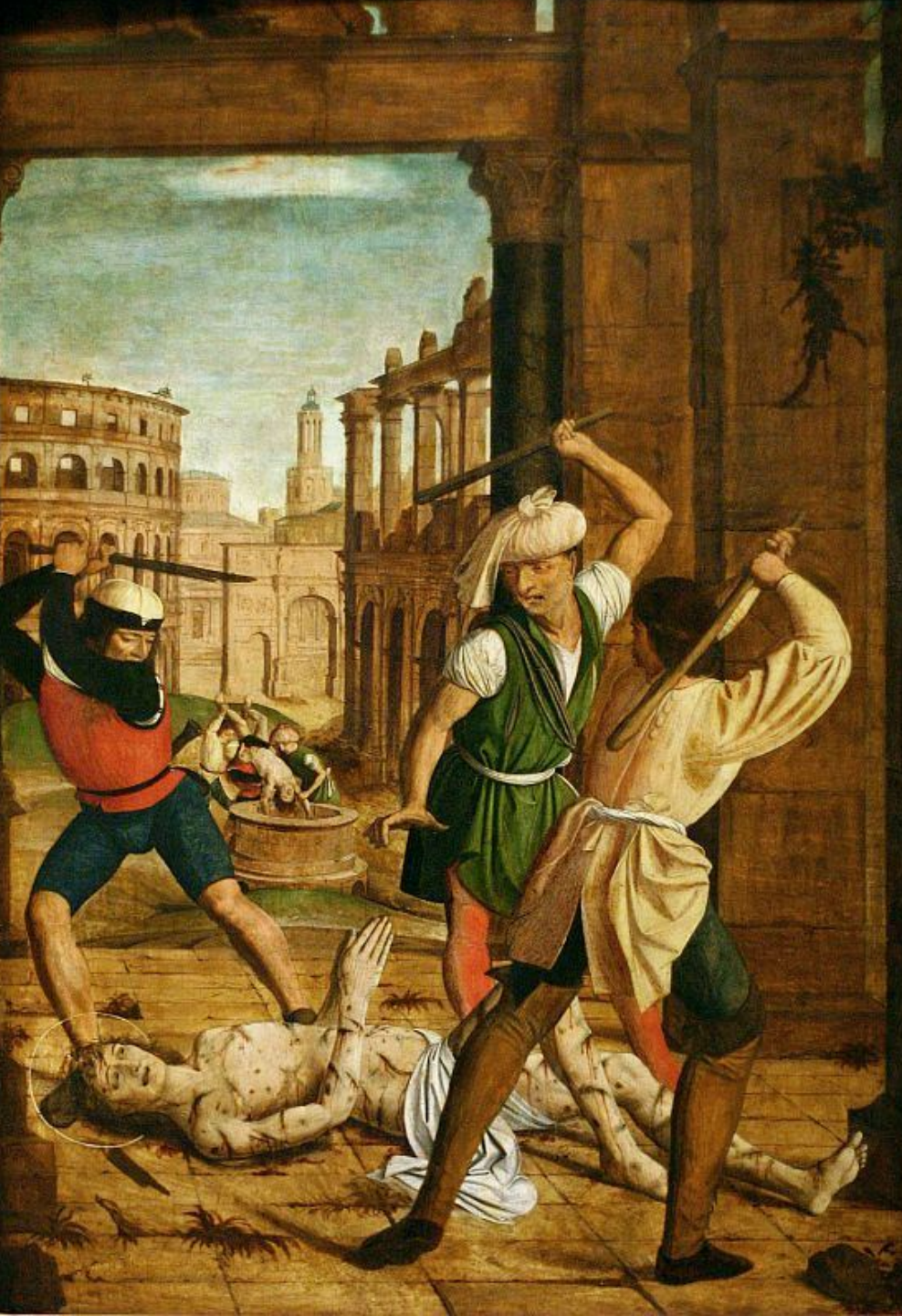
Saint Sébastien bastonné à mort et son corps jeté dans Cloaca maxima, Philadelphie, Philadelphia Museum of Art.