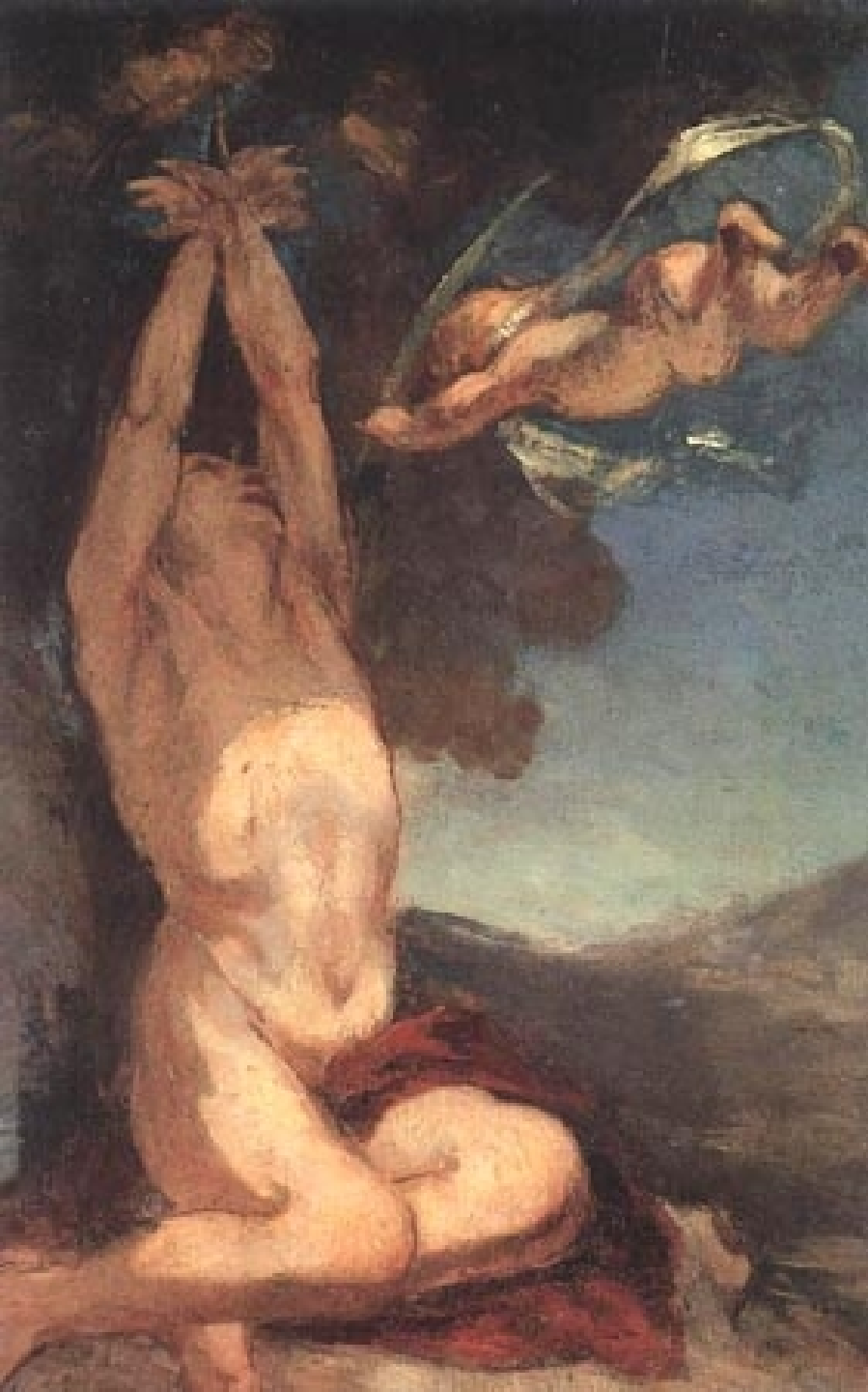
Honoré Daumier (Marseille, 1808 – Valmondois, 1879), Saint Sébastien , vers 1850, peinture à l'huile sur toile, Paris, musée d'Orsay.