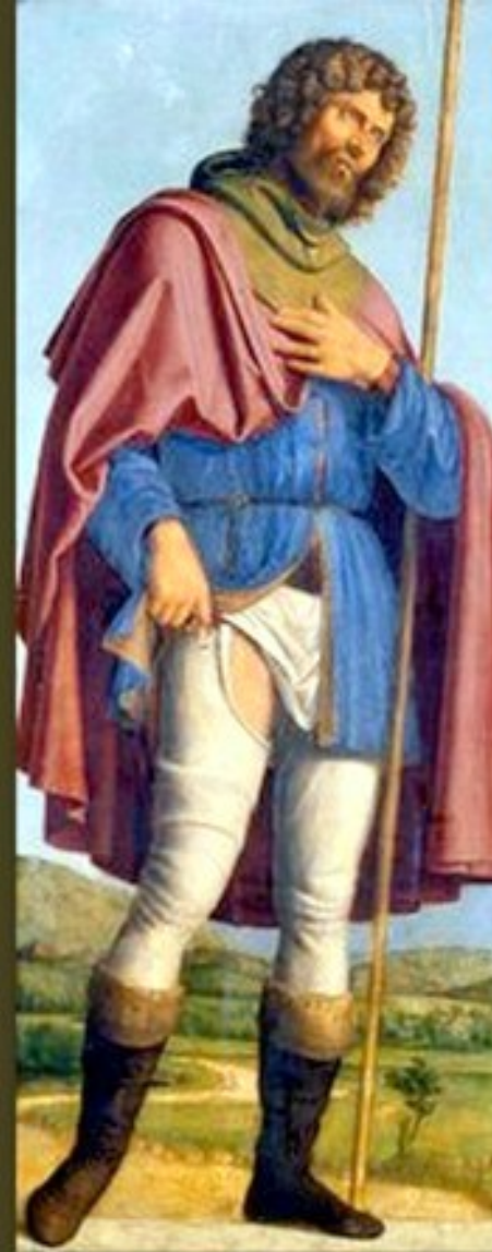
Cima da Conegliano (Conegliano, vers 1459 – Conegliano, vers 1517), Saint Sébastien et Saint Roch , peintures sur bois, 1500/2, Strasbourg, musée des Beaux-Arts.