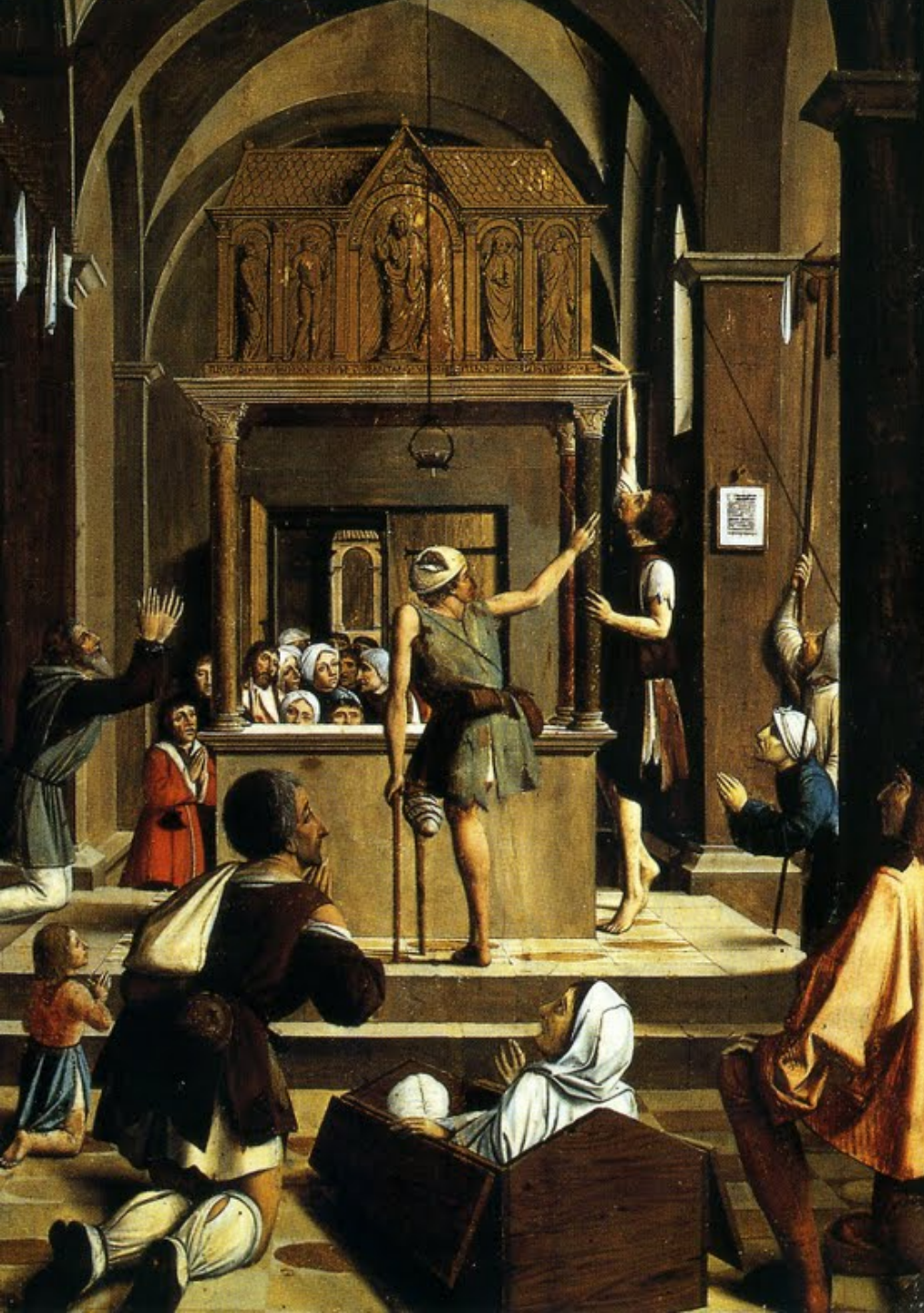
Pèlerins devant le tombeau de saint Sébastien, Rome, Galerie nationale d'Art Ancien.