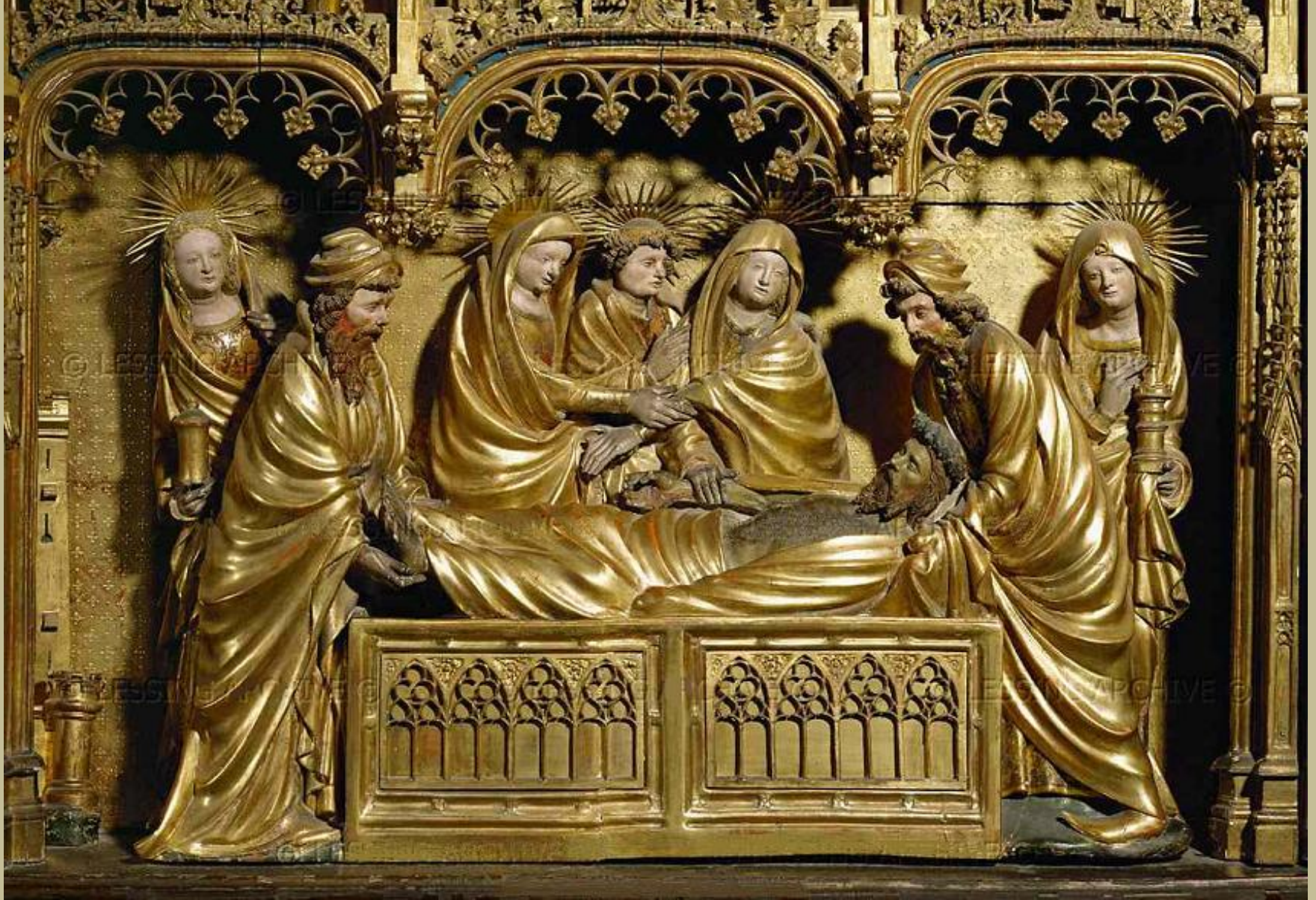
Jacques de Baerze (fin du XIV e siècle), Retable de la Crucifixion (ouvert), caisson central : La Mise au tombeau , 1390/99, bois (noyer) peint et doré, Dijon, musée des Beaux-Arts.