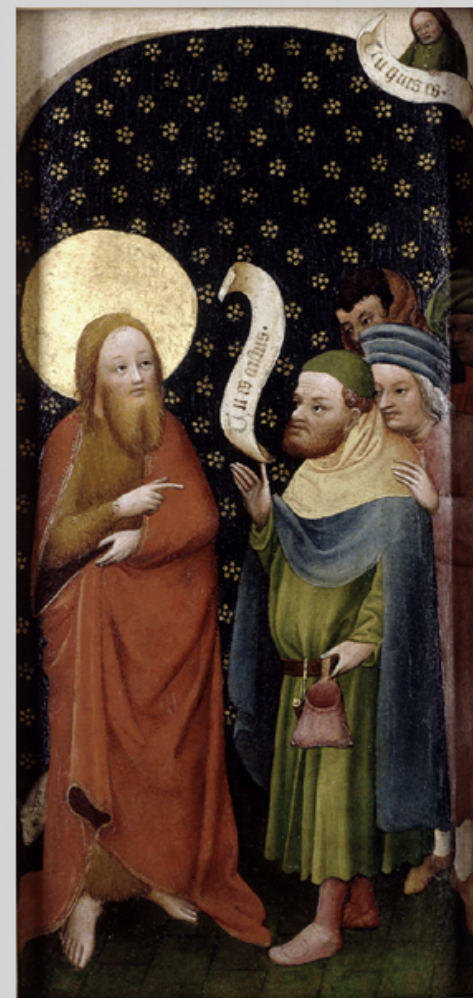
Maître du Jardin de Paradis, début du XVe siècle, Scènes de la vie de saint Jean Baptiste , vers 1410, peinture sur bois, Karlsruhe, Staatliche Kunsthalle.