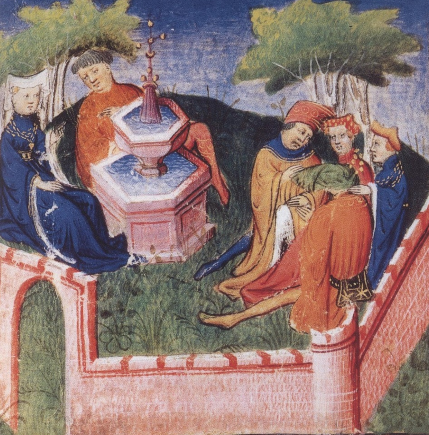
Maître D'Egerton, (actif en France au XVe siècle), Christine de Pizan, Livre du Duc des vrais amants : Scène courtoise dans un jardin, vers 1505/8, peinture sur parchemin, Paris, Bibliothèque nationale de France.