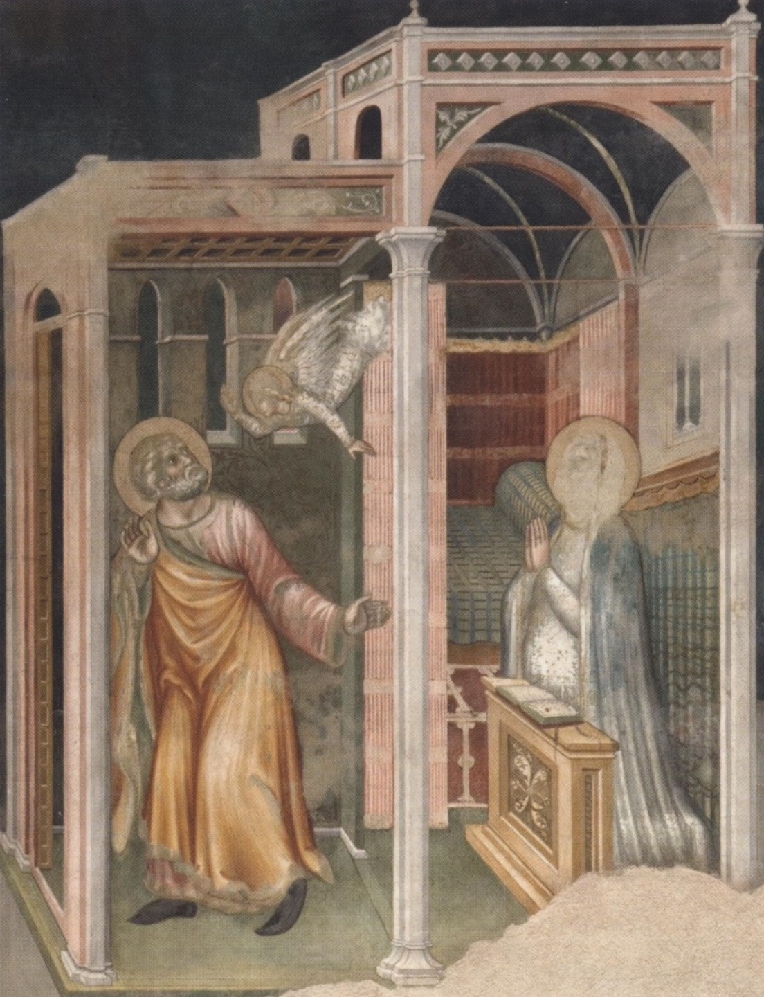
Ugolino di Petre Illario (actif à Sienne au XIVe siècle), L'Annonce à Joseph , vers 1370/80, fresque, Orvieto, cathédrale.