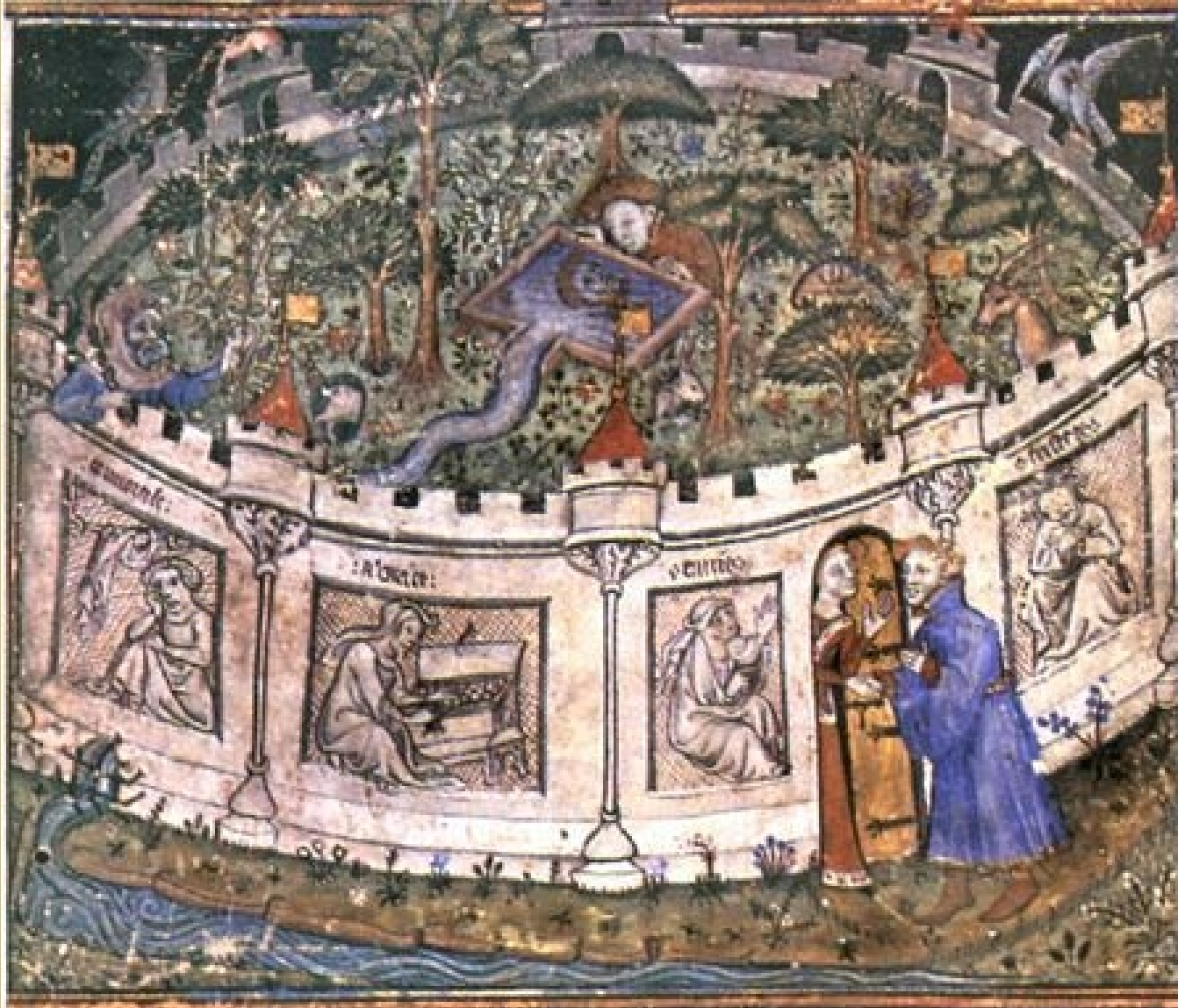
France, XVe siècle, Guillaume de Lorris et Jean de Meung, Le roman de la rose : Oiseuse accueillant Amant dans le verger , vers 1400, manuscrit enluminé, Londres, British Library.