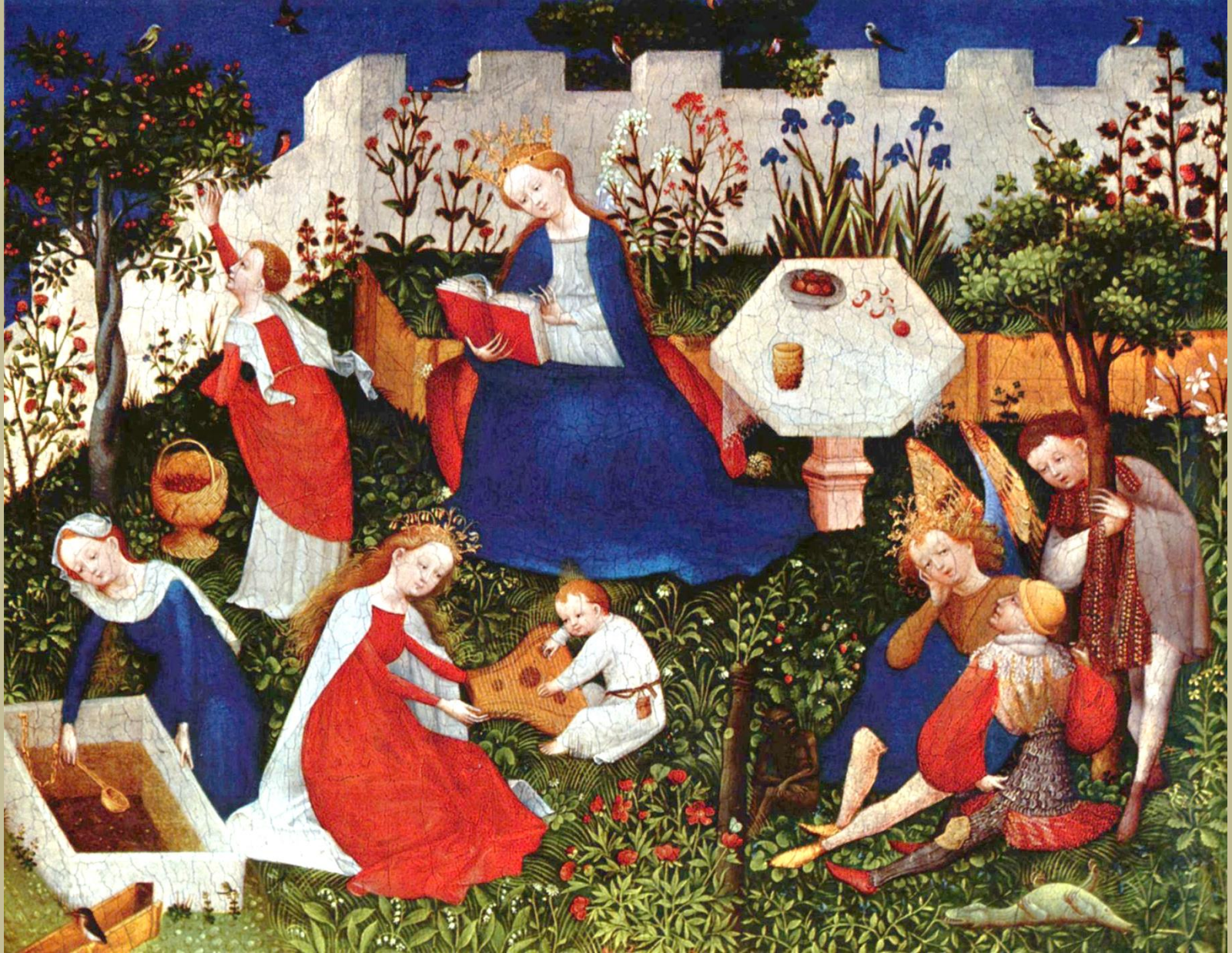
Maître du Jardin de Paradis, début du XVe siècle, Jardin de Paradis , vers 1410/20, peinture sur bois, Francfort, Städelches Kunstinstitut.