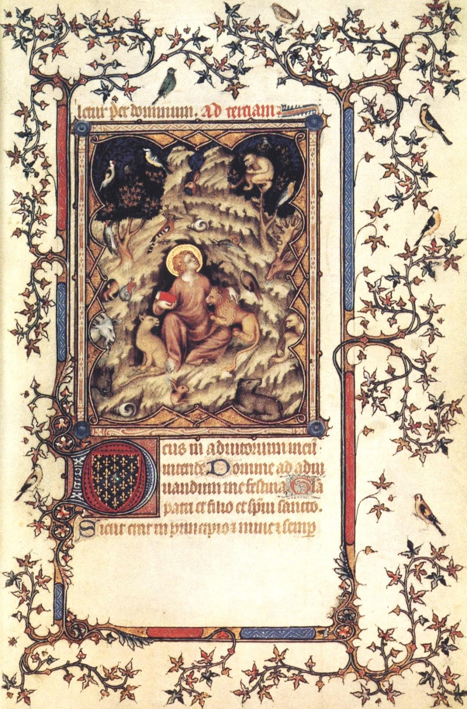
Jean Le Noir (actif à Paris à la fin du XIV e siècle, Petites Heures de Jean de Berry : Saint Jean Baptiste dans le désert , 1375/90, manuscrit enluminé, Paris, Bibliothèque nationale de France.