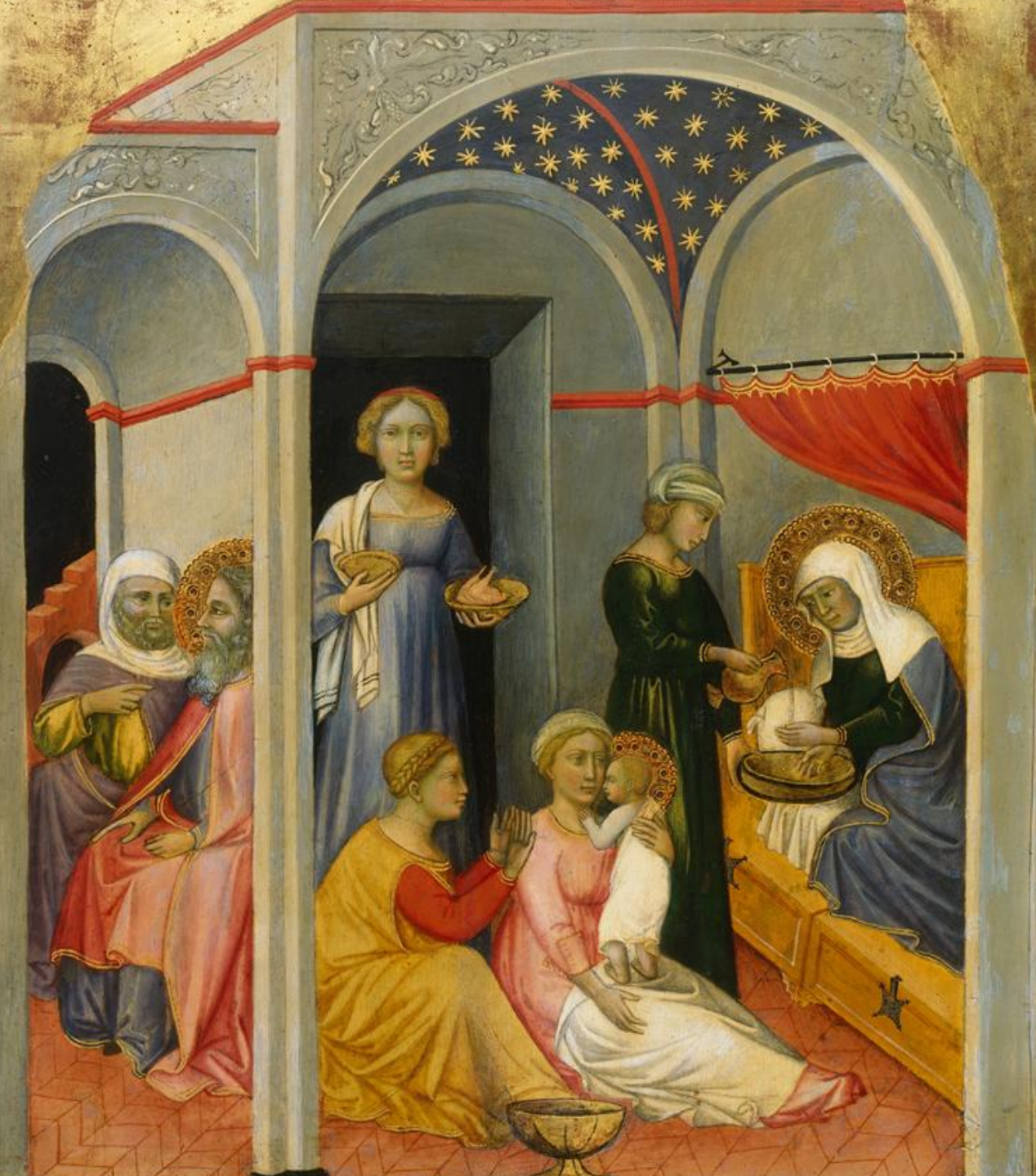
Andrea di Bartolo (Sienne, 1360/70 – Sienne, 1428), La Nativité de la Vierge , vers 1400, peinture sur bois, Washington, National Gallery of Art.