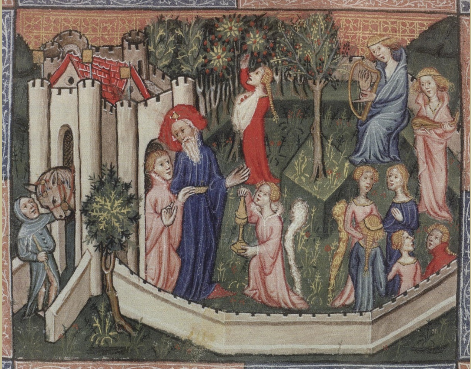
Angleterre, XVe siècle, Marco Polo, Livre des Merveilles : Jardin du Vieux de la montagne , vers 1400/10, peinture sur parchemin, Oxford, Bodleian Library.