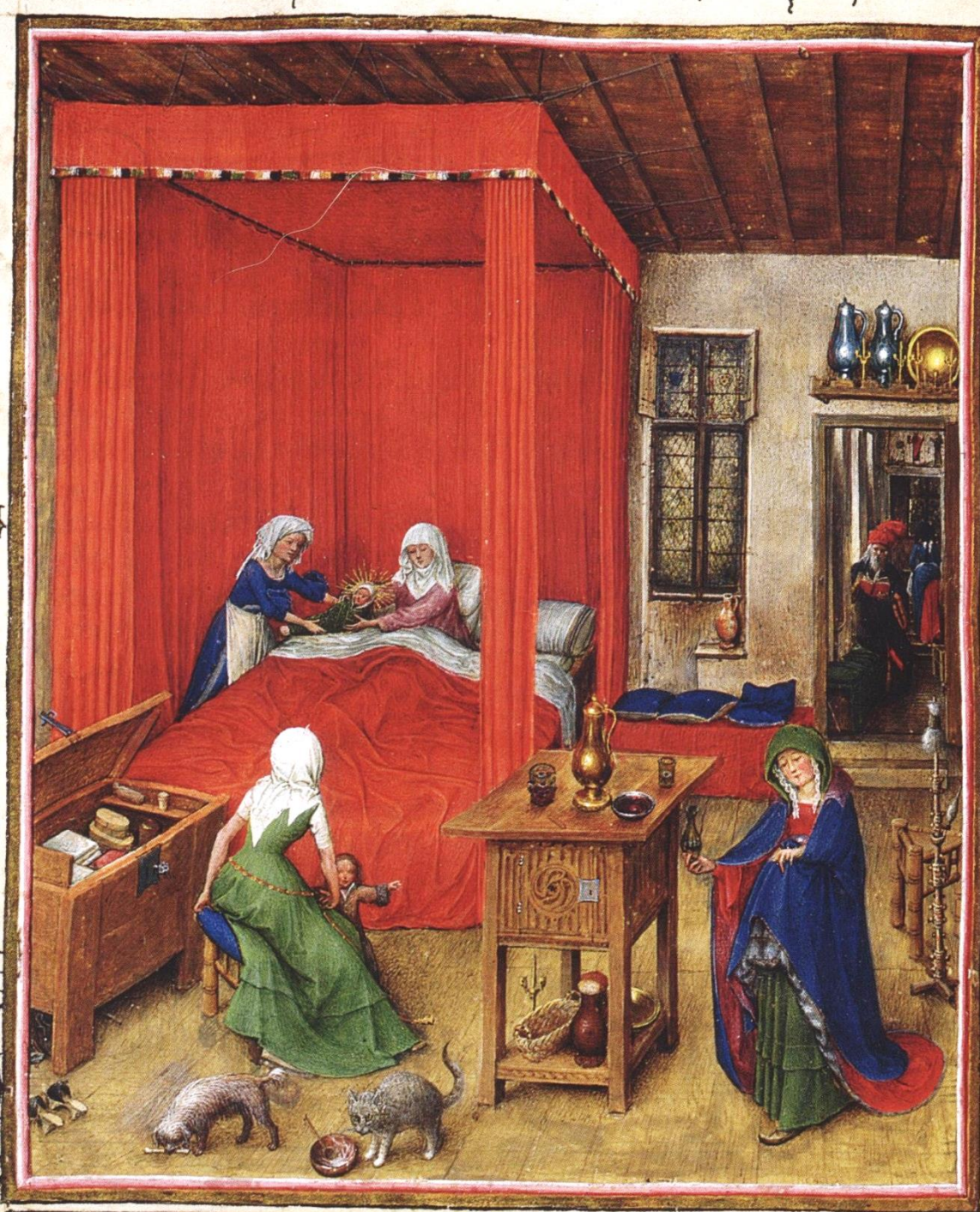
Flandre (Jan van Eyck ?), XVe siècle, Heures de Milan-Turin : Naissance de saint Jean Baptiste , vers 1420, peinture sur parchemin, Turin, Palazzo Madama.