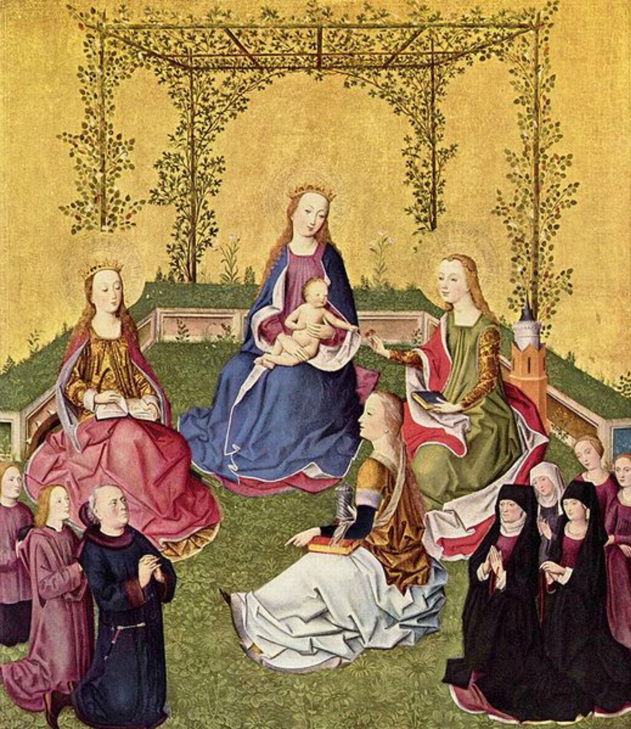
Cologne, XVe siècle, La Vierge et l'Enfant, trois saintes et des donateurs , vers 1420/30, peinture sur bois, Berlin, Gemäldegalerie.