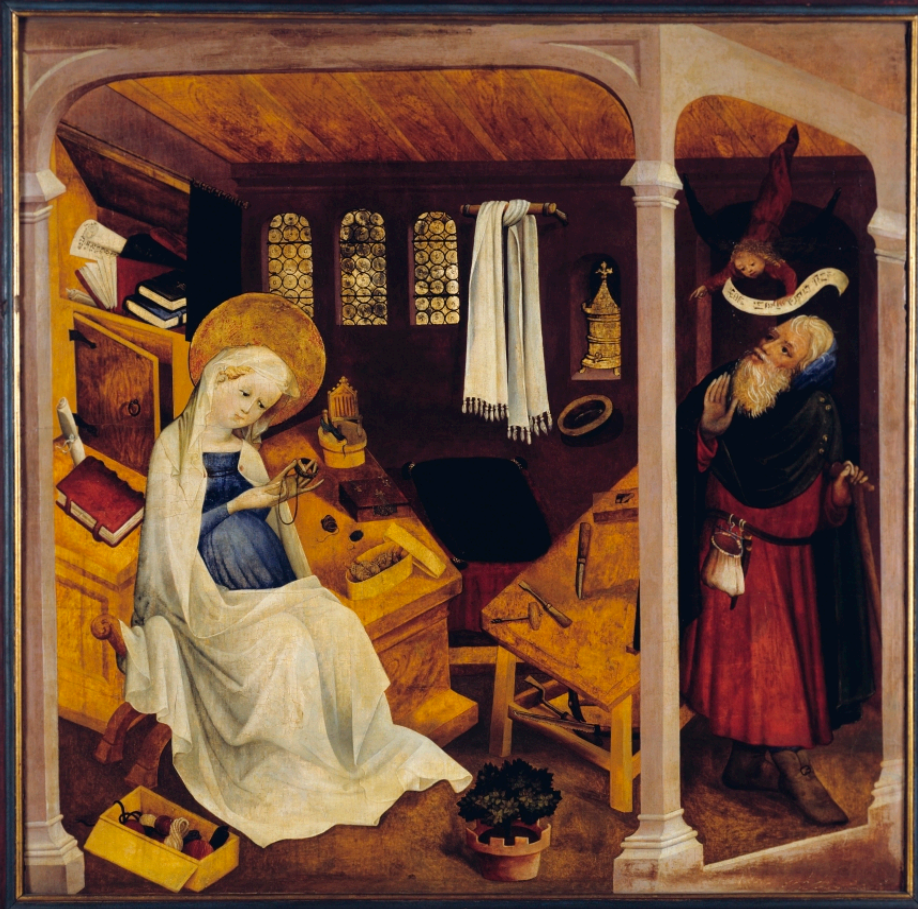
Maître du Jardin de Paradis, début du XVe siècle, Scènes de la vie de la Vierge , vers 1430, peinture sur bois, Strasbourg, musée de l'Œuvre Notre-Dame.