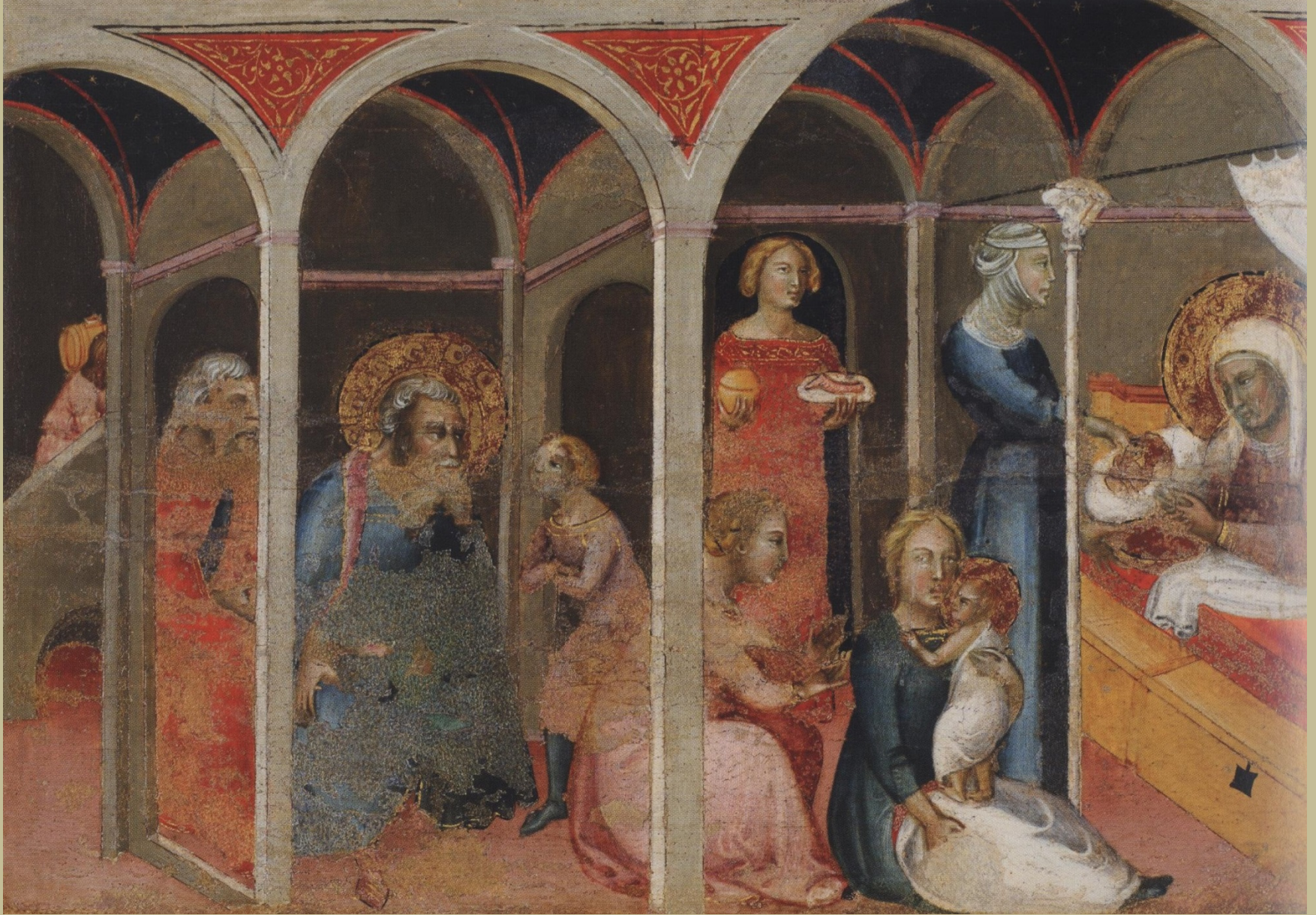
Bartolo di Fredi (Sienne, vers 1330 – Sienne, 1410), La Nativité de la Vierge , 1383/8, peinture sur bois, Montalcino, Museo Civico e Diocesiano d'Arte Sacra.