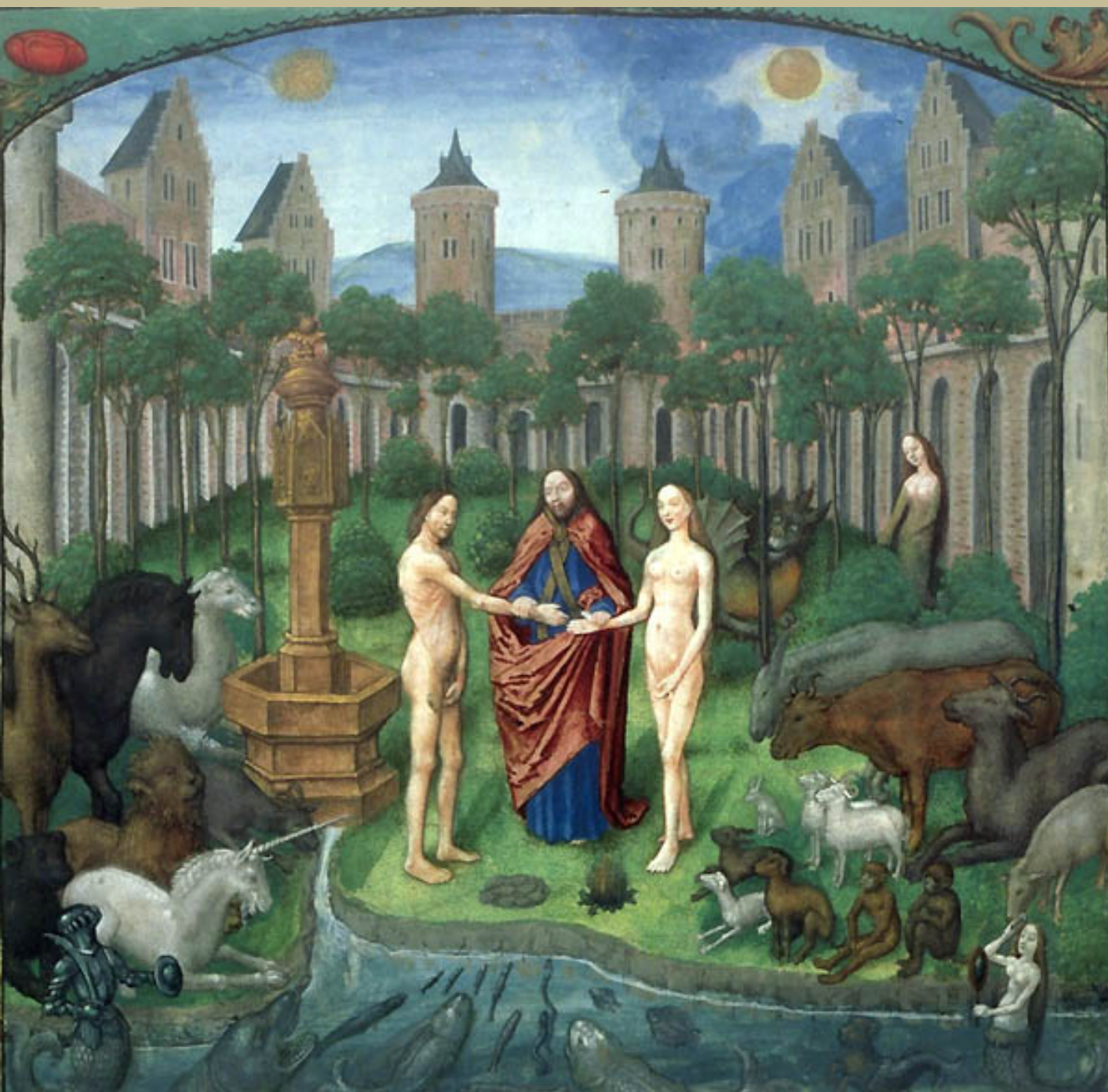
Flandre (Bruges), fin du XVe siècle, Flavius Josèphe, Antiquités Judaïques : Jardin d'Eden avec l'union d'Adam et Eve , peinture sur parchemin, vers 1475/1500, Paris, Bibliothèque nationale de France.