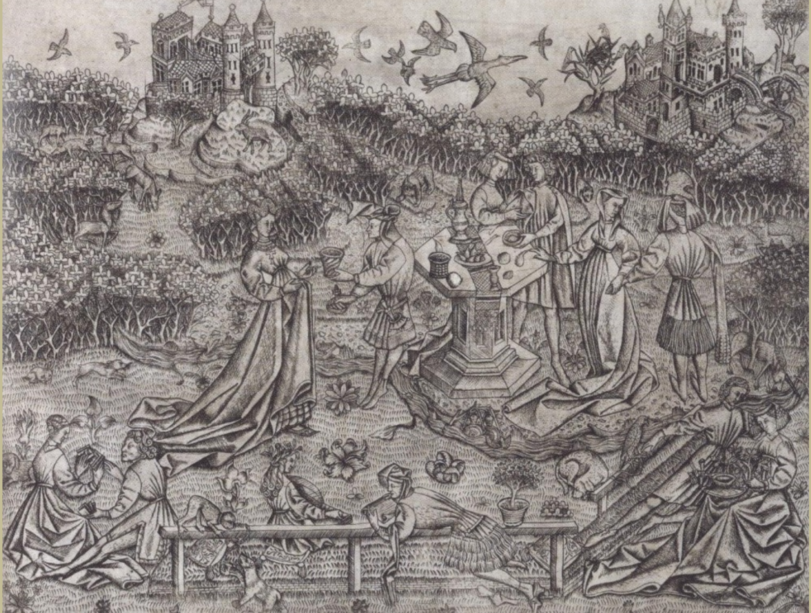
Maître des Jardins d'amour (actif en Flandre au XVe siècle), Grand jardin d'amour , vers 1430/40, gravure sur bois, Berlin, Kupferstichkabinett.