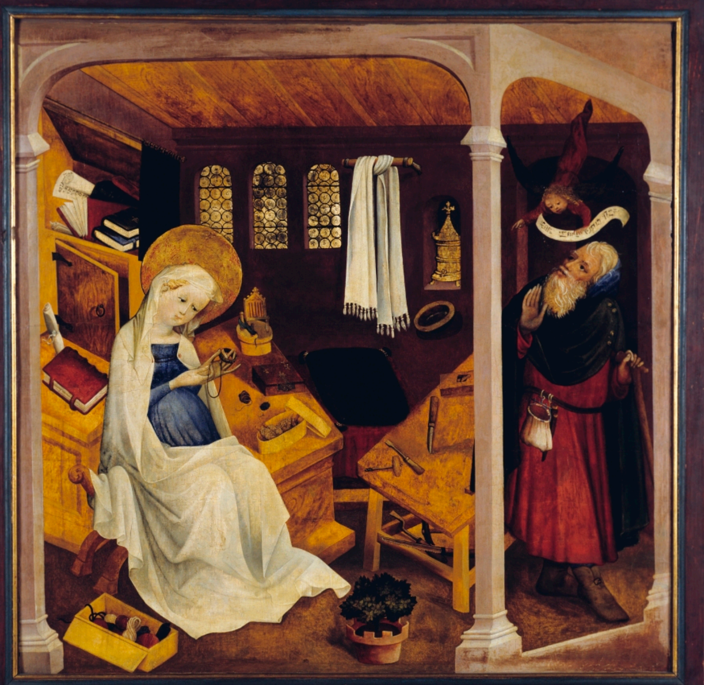
MAITRE STRASBOURGEOIS LA VIERGE ET L'ENFANT AU SOUT DE JOSEPH