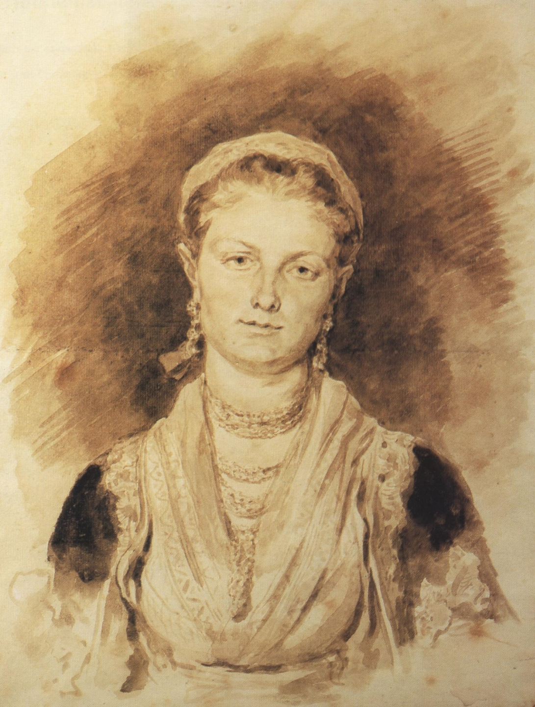
Jean Honoré Fragonard (Grasse, 1732 – Paris, 1806), Femme napolitaine, 1774, lavis de bistre sur papier, New York, collection particulière.