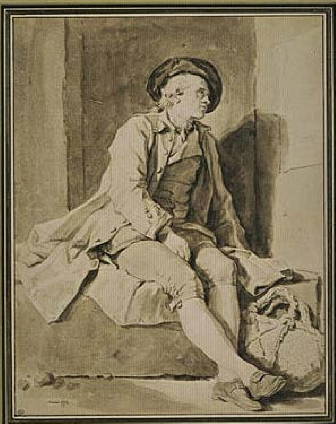
Jean Honoré Fragonard (Grasse, 1732 – Paris, 1806), Homme assis sur une pierre, 1774, lavis de bistre sur papier, Paris, musée du Louvre.