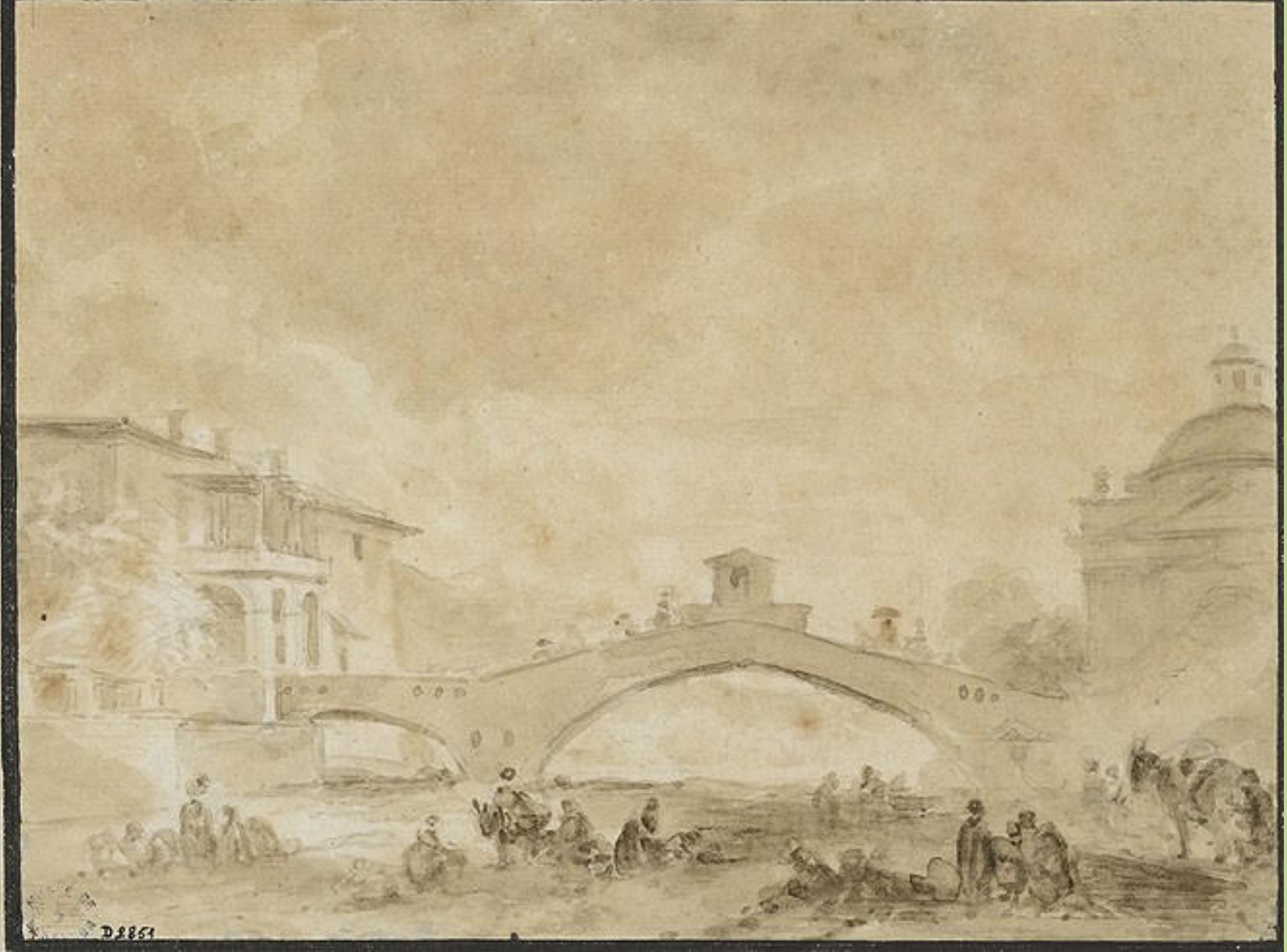
Jean Honoré Fragonard (Grasse, 1732 – Paris, 1806), Vue du pont San Stefano à Sestri , vers 1773, lavis de bistre sur papier, Besançon, musée des Beaux-Arts et d'Archéologie.