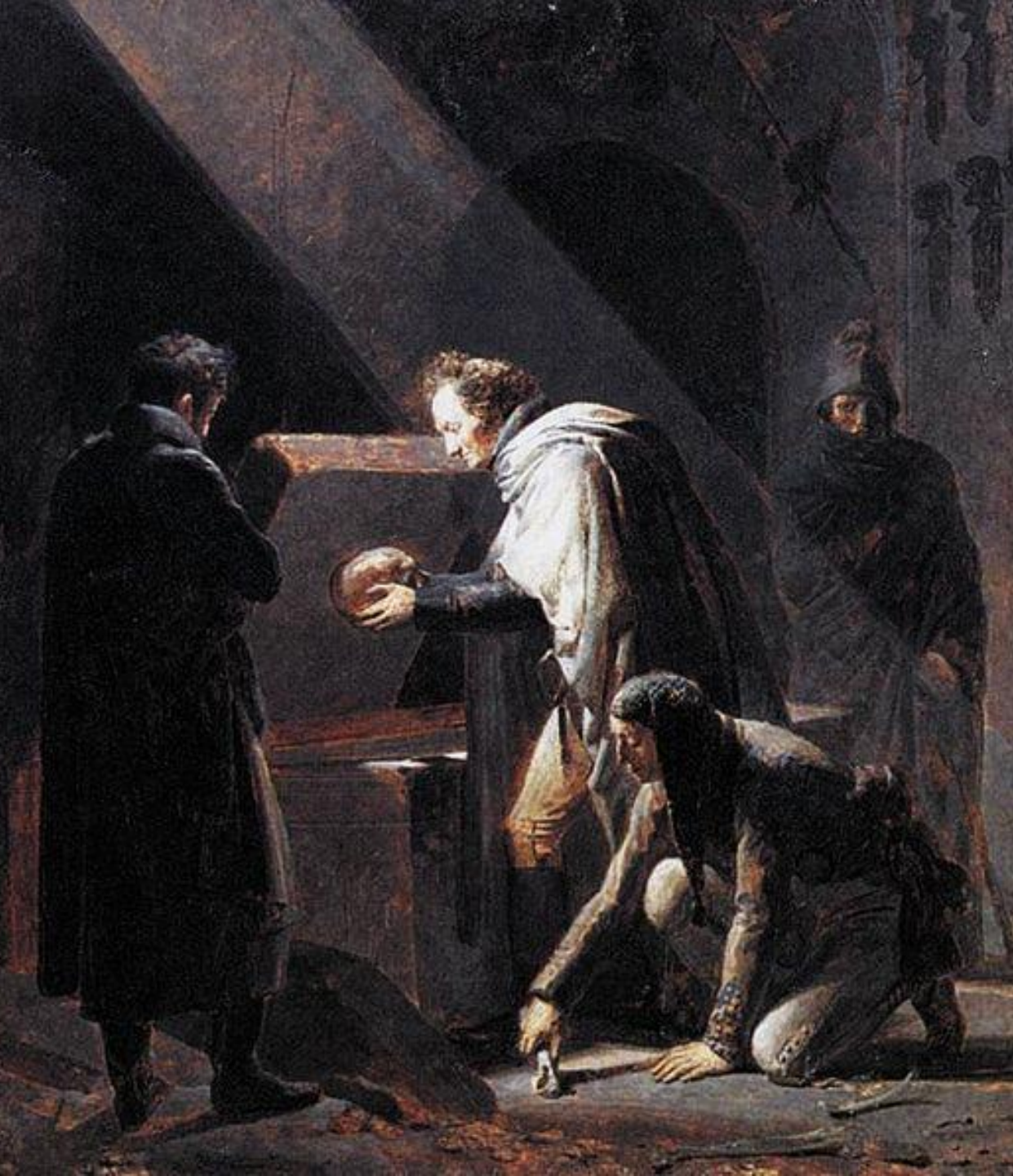
Alexandre Evariste Fragonard (Grasse, 1780 – Paris, 1850), Vivant Denon replaçant les reste du Cid dans son tombeau, vers 1811, peinture à l'huile sur toile, Saint-Quentin, musée Antoine Lécuyer.