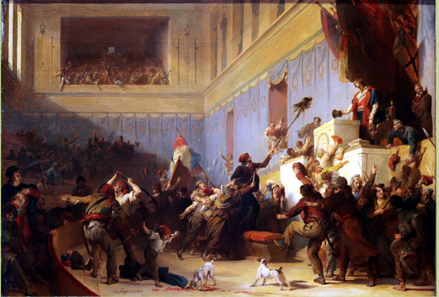
Alexandre Evariste Fragonard (Grasse, 1780 – Paris, 1850), Boissy d'Anglas sauvant la tête du député Ferraud , 1831, peinture à l'huile sur toile, Paris, musée du Louvre.