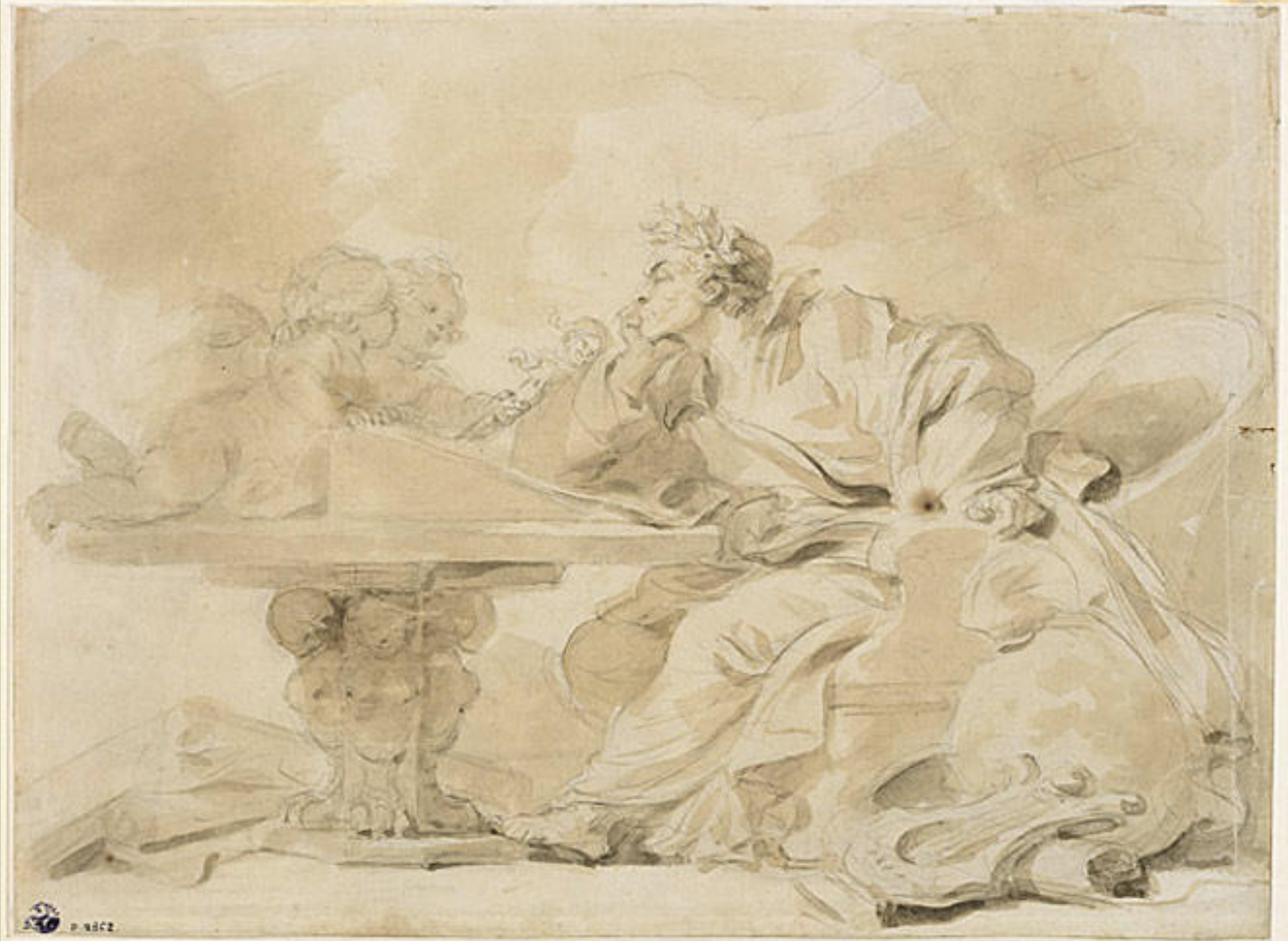
Jean Honoré Fragonard (Grasse, 1732 – Paris, 1806), L'Arioste inspiré par l'amour et le folie , vers 1778/80, lavis de bistre sur papier, Besançon, musée des Beaux-Arts et d'Archéologie.