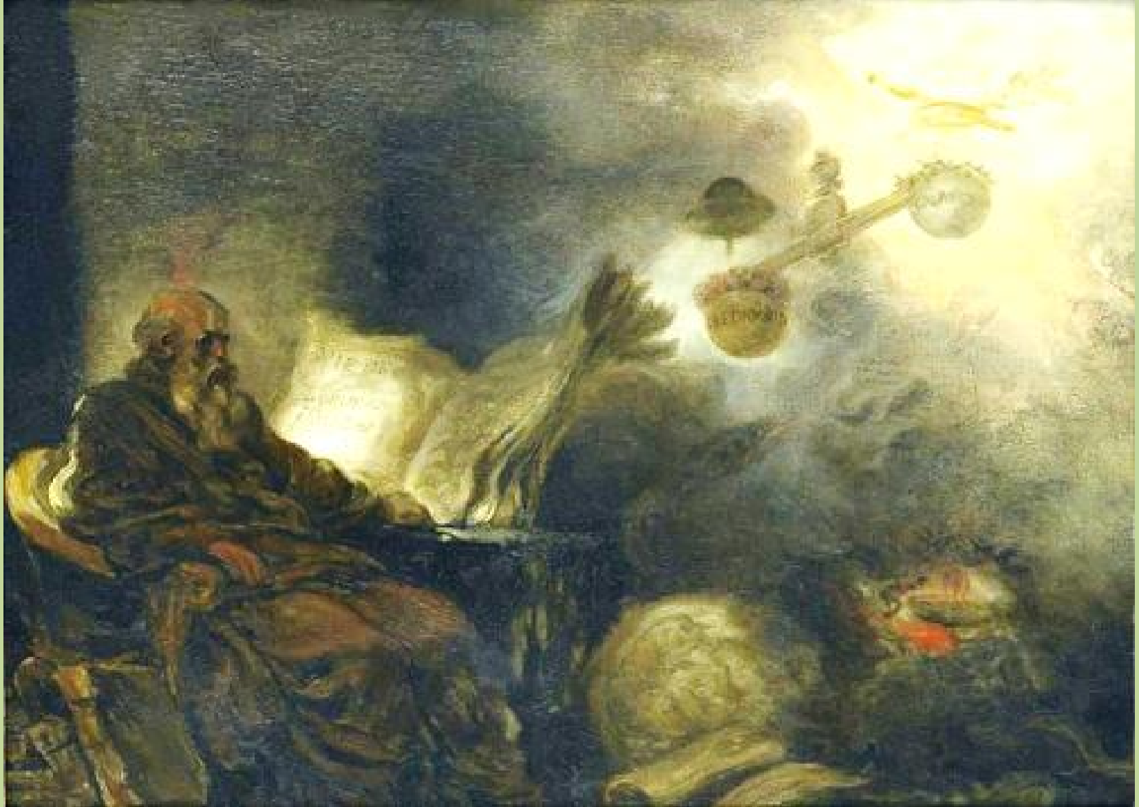
Jean Honoré Fragonard (Grasse, 1732 – Paris, 1806), Le Songe de Plutarque , vers 1778/80, peinture à l'huile sur bois, Rouen, musée des Beaux-Arts.