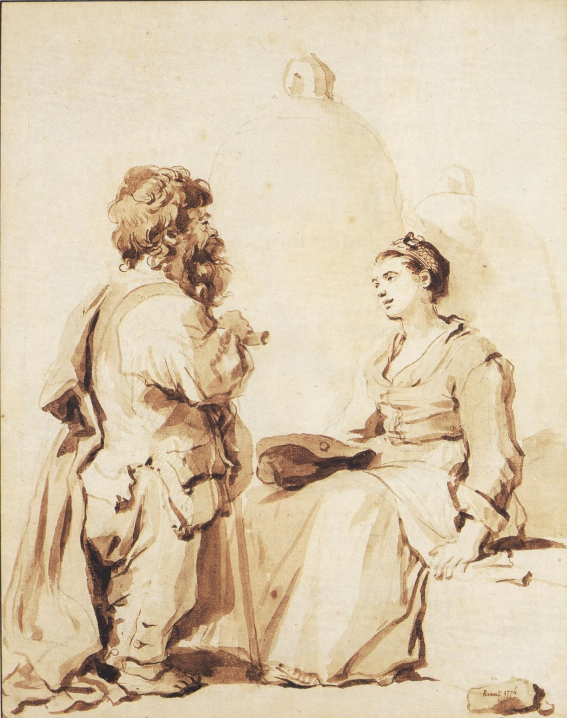
Jean Honoré Fragonard (Grasse, 1732 – Paris, 1806), Nain conversant avec une jeune femme, 1774, lavis de bistre sur papier, Francfort-sur-le-Main, Städelsches Kunstinstitut.