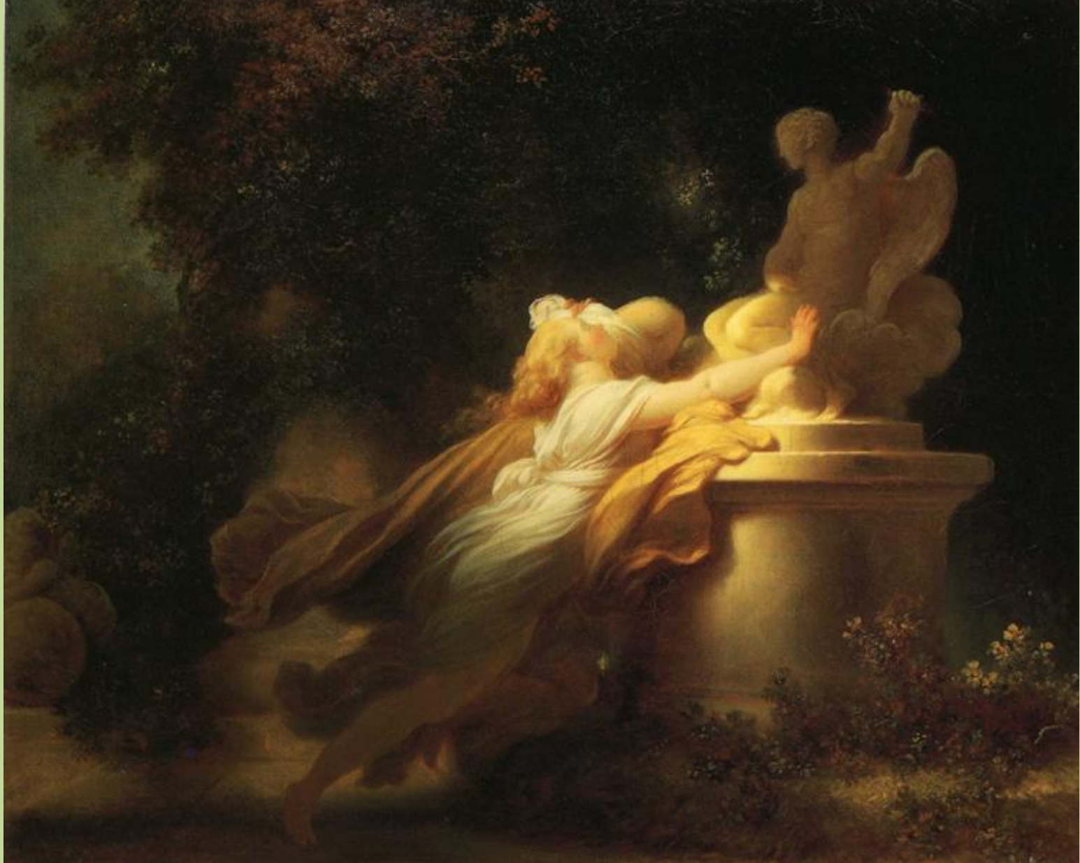
Jean Honoré Fragonard (Grasse, 1732 – Paris, 1806), Le Vœu à l'amour , vers 1776/80, peinture à l'huile sur toile, collection particulière.