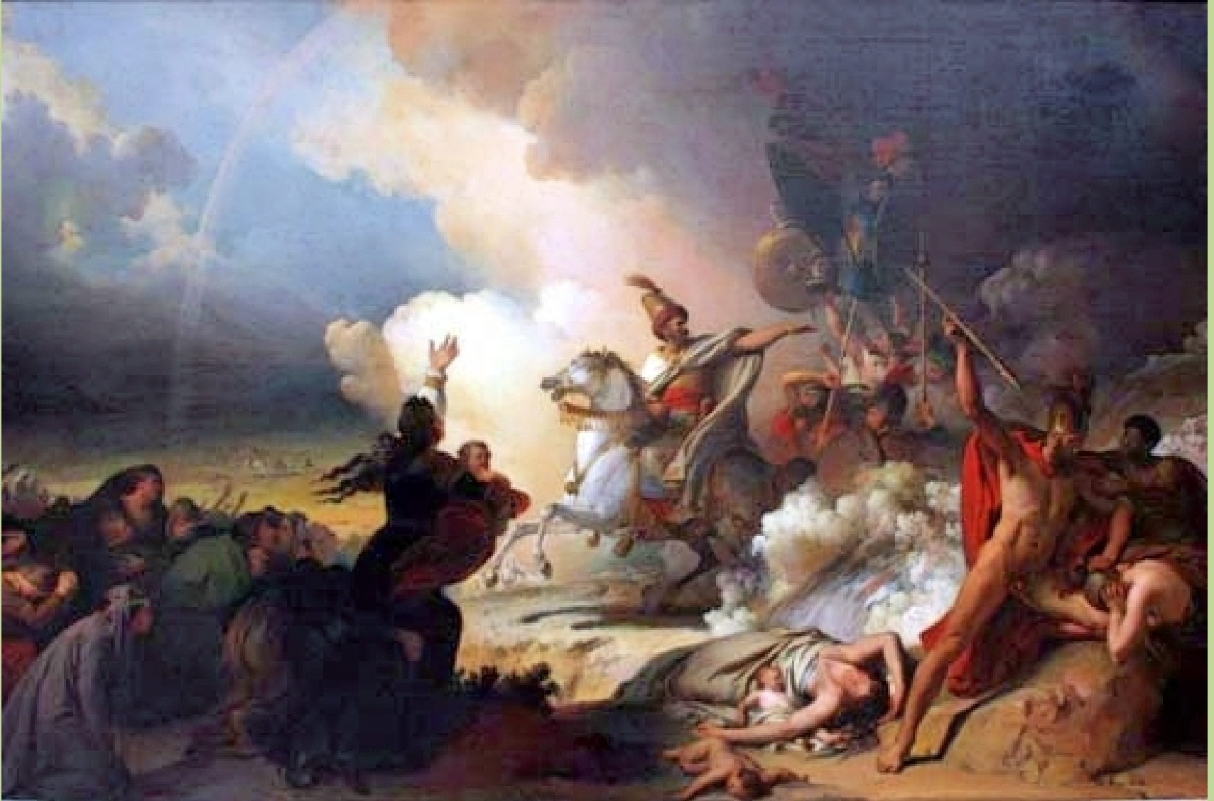
Alexandre Evariste Fragonard (Grasse, 1780 – Paris, 1850), Saladin à Jérusalem , vers 1830, peinture à l'huile sur toile, Quimper, musée des Beaux-Arts.