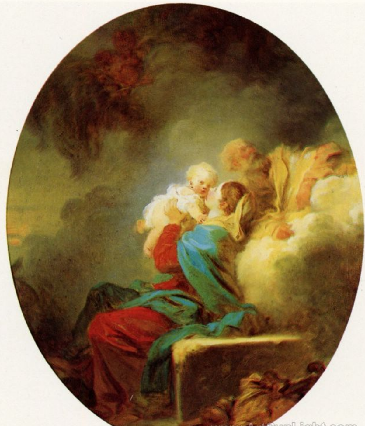
Jean Honoré Fragonard (Grasse, 1732 – Paris, 1806), Le Repos pendant la fuite en Egypte , vers 1775, peinture à l'huile sur toile, New Haven, Yale University Art Gallery.