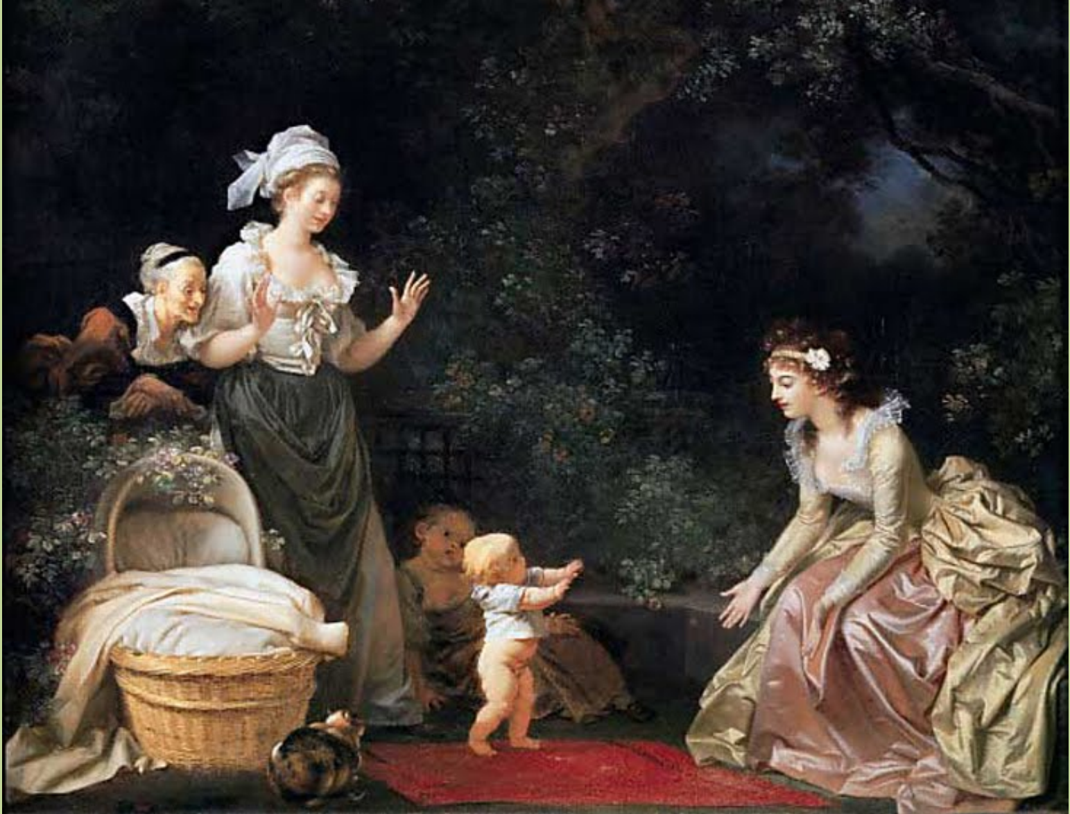
Jean Honoré Fragonard (Grasse, 1732 – Paris, 1806) et Marguerite Gérard (Grasse, 1761 – Paris, 1837), Le Premier pas de l'enfance , vers 1785/90, peinture à l'huile sur toile, Cambridge, The Fogg Art Museum.