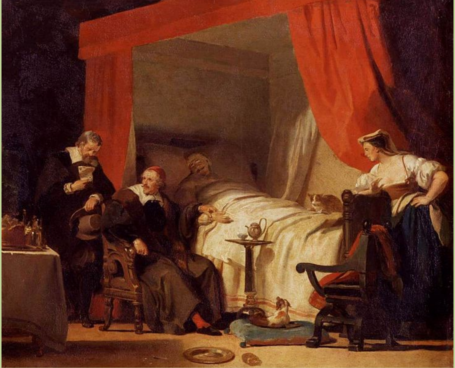
Alexandre Evariste Fragonard (Grasse, 1780 – Paris, 1850), Mazarin au chevet d'Eustache Lesueur mourant , vers 1820/30, peinture à l'huile sur toile, collection particulière.