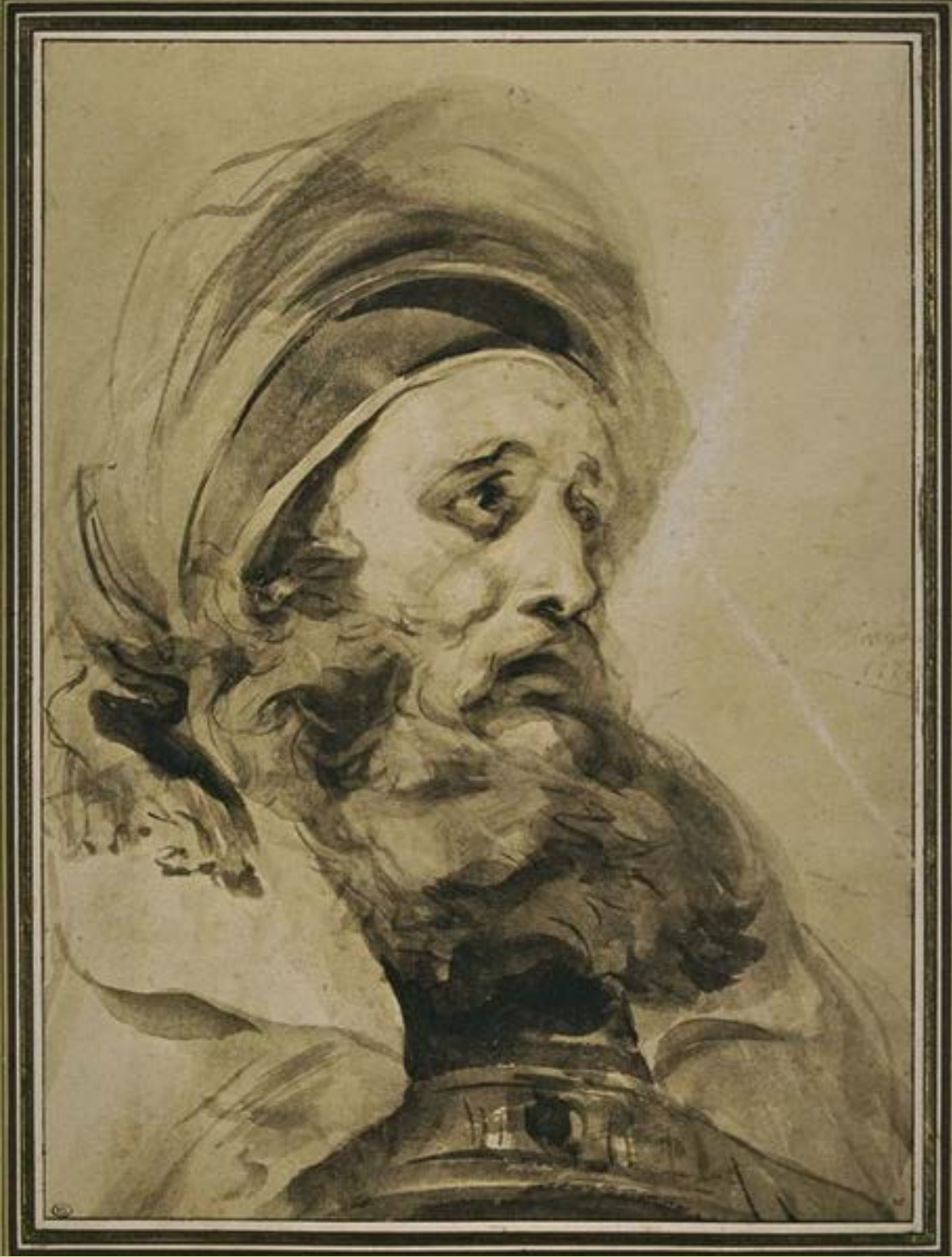
Jean Honoré Fragonard (Grasse, 1732 – Paris, 1806), Tête d'Oriental, 1774/5, lavis de bistre sur papier, Paris, musée du Louvre.