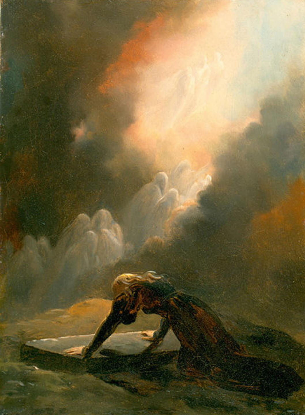
Alexandre Evariste Fragonard (Grasse, 1780 – Paris, 1850), Bradamante sur la tombe de Merlin, vers 1820, peinture à l'huile sur toile, Atlanta, High Museum of Art.