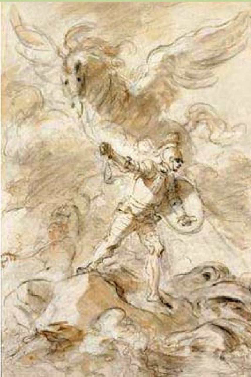
Jean Honoré Fragonard (Grasse, 1732 – Paris, 1806), Le Roland furieux : Roger défend Angélique et aveugle l'orque, vers 1780/5, lavis de bistre sur papier, collection particulière.