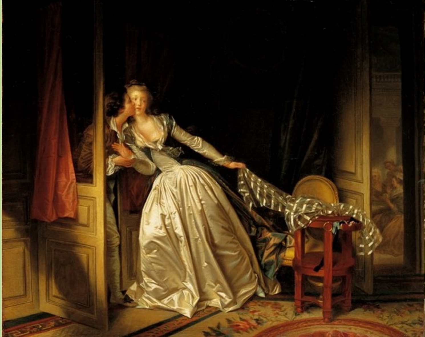
Jean Honoré Fragonard (Grasse, 1732 – Paris, 1806) et Marguerite Gérard (Grasse, 1761 – Paris, 1837), Le Baiser à la dérobée , vers 1790, peinture à l'huile sur toile, Saint-Pétersbourg, musée de l'Ermitage.