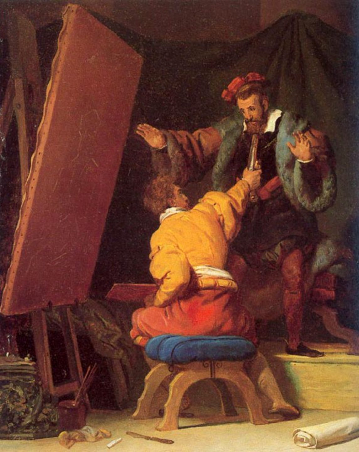
Alexandre Evariste Fragonard (Grasse, 1780 – Paris, 1850), L'Arétin dans l'atelier de Tintoret , vers 1822, peinture à l'huile sur toile, collection particulière.