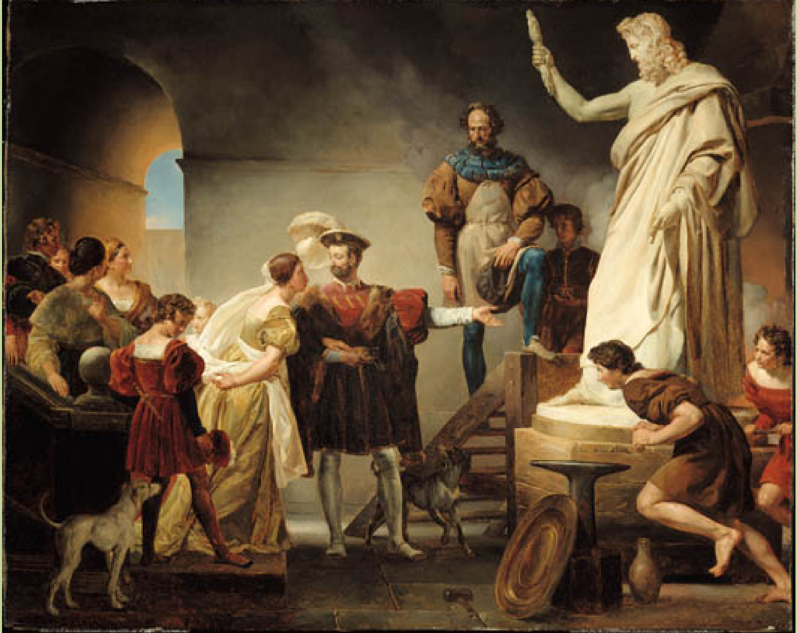
Alexandre Evariste Fragonard (Grasse, 1780 – Paris, 1850), François Ier dans l'atelier de Benvenuto Cellini , vers 1820/30, peinture à l'huile sur toile, Montréal, musée des Beaux-Arts.