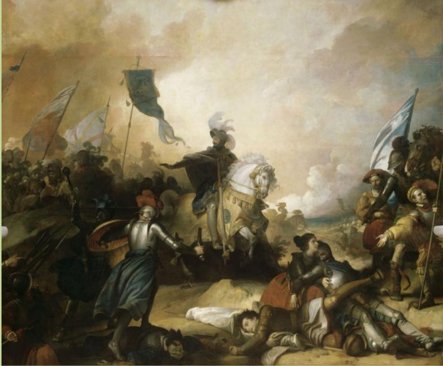
Alexandre Evariste Fragonard (Grasse, 1780 – Paris, 1850), La Bataille de Marignan , 1836, peinture à l'huile sur toile, Versailles, musée national du château.