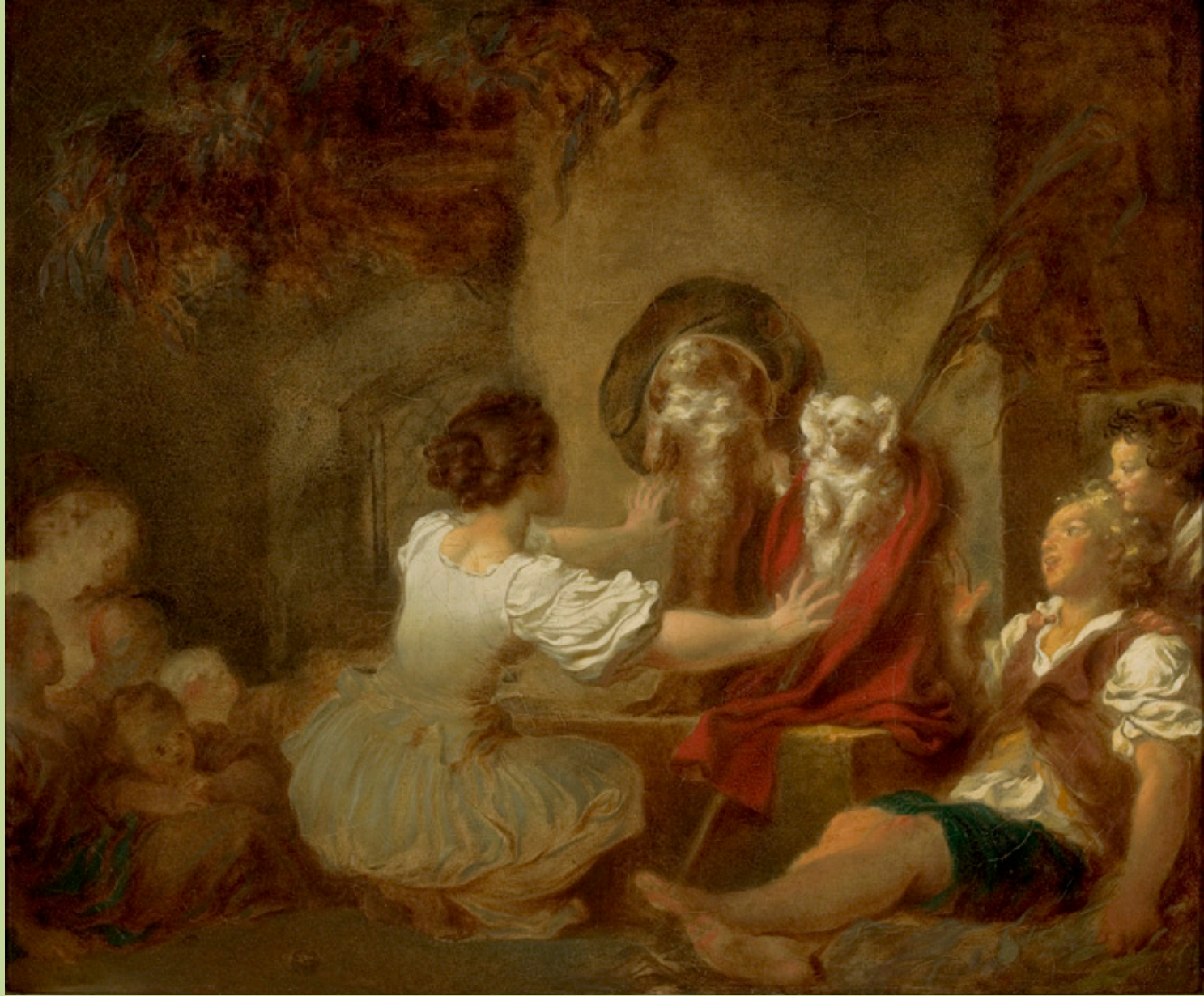
Jean Honoré Fragonard (Grasse, 1732 – Paris, 1806), L'Education fait tout , vers 1775, peinture à l'huile sur toile, São Paulo, Museu de Arte.