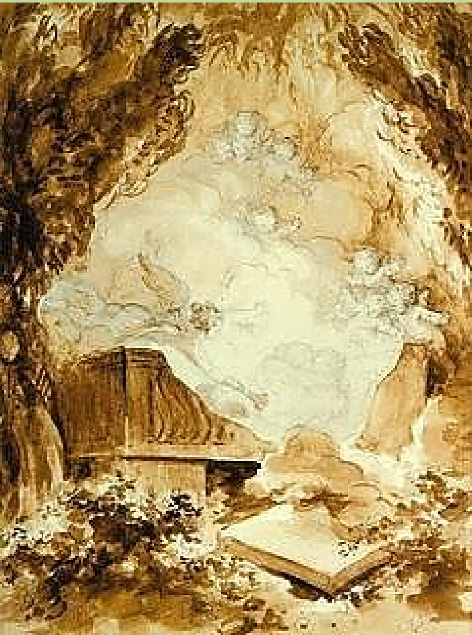
Jean Honoré Fragonard (Grasse, 1732 – Paris, 1806), Le Baiser, vers 1776, lavis de bistre sur papier, Vienne, Albertina.