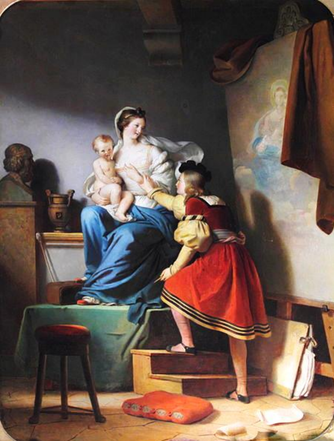
Alexandre Evariste Fragonard (Grasse, 1780 – Paris, 1850), Raphaël reprenant la pose de son modèle, vers 1820, peinture à l'huile sur toile, Grasse, musée Fragonard.