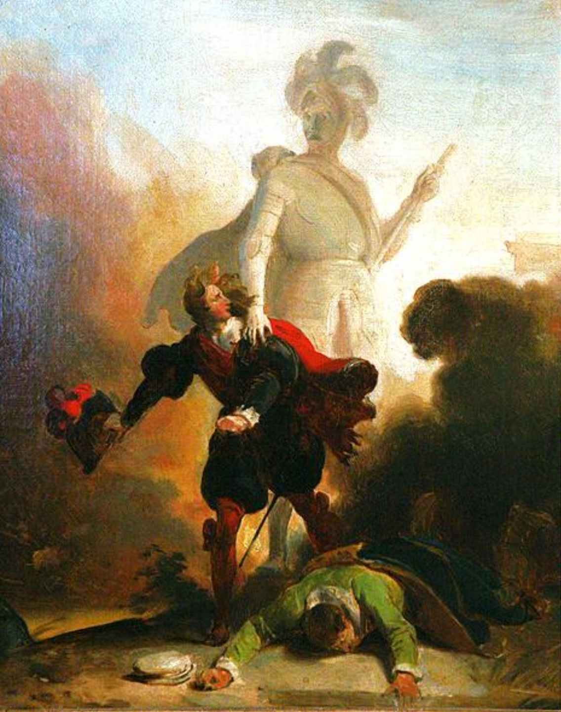
Alexandre Evariste Fragonard (Grasse, 1780 – Paris, 1850), Don Juan et la statue du Commandeur , 1830/5, peinture à l'huile sur toile, Strasbourg, musée des Beaux-Arts.