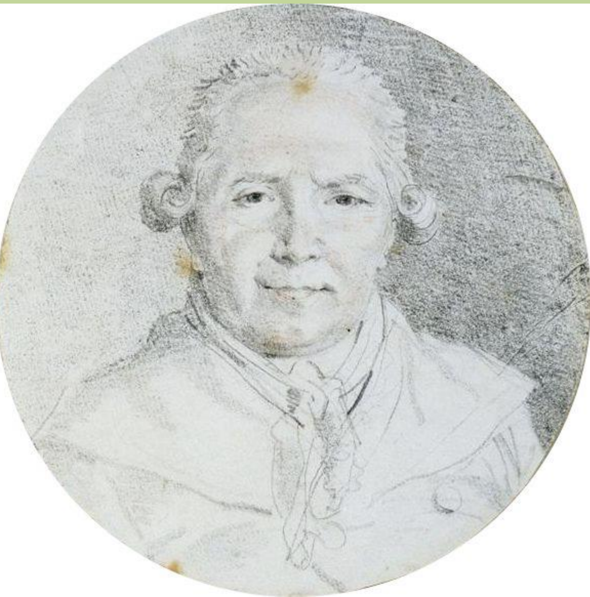
Jean Honoré Fragonard (Grasse, 1732 – Paris, 1806), Autoportrait, vers 1785, pierre noire sur papier, Paris, musée du Louvre.