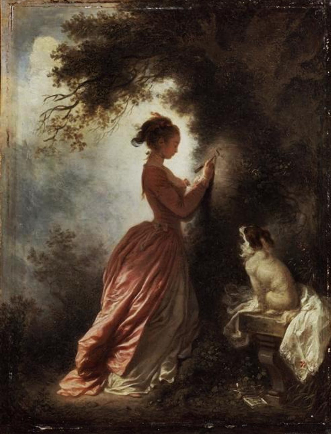
Jean Honoré Fragonard (Grasse, 1732 – Paris, 1806), Le Chiffre d'amour, vers 1776/80, peinture à l'huile sur bois, Londres, Wallace Collection.