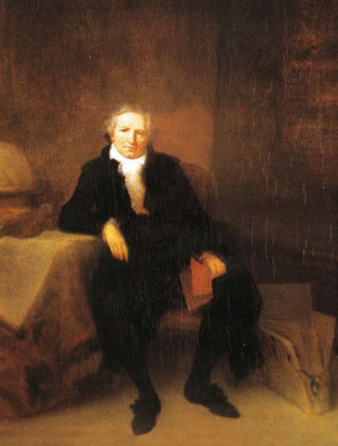
Attribué à Marguerite Gérard (Grasse, 1761 – Paris, 1837), Portrait de Jean Honoré Fragonard , vers 1800, peinture à l'huile sur toile, Grasse, musée Fragonard.