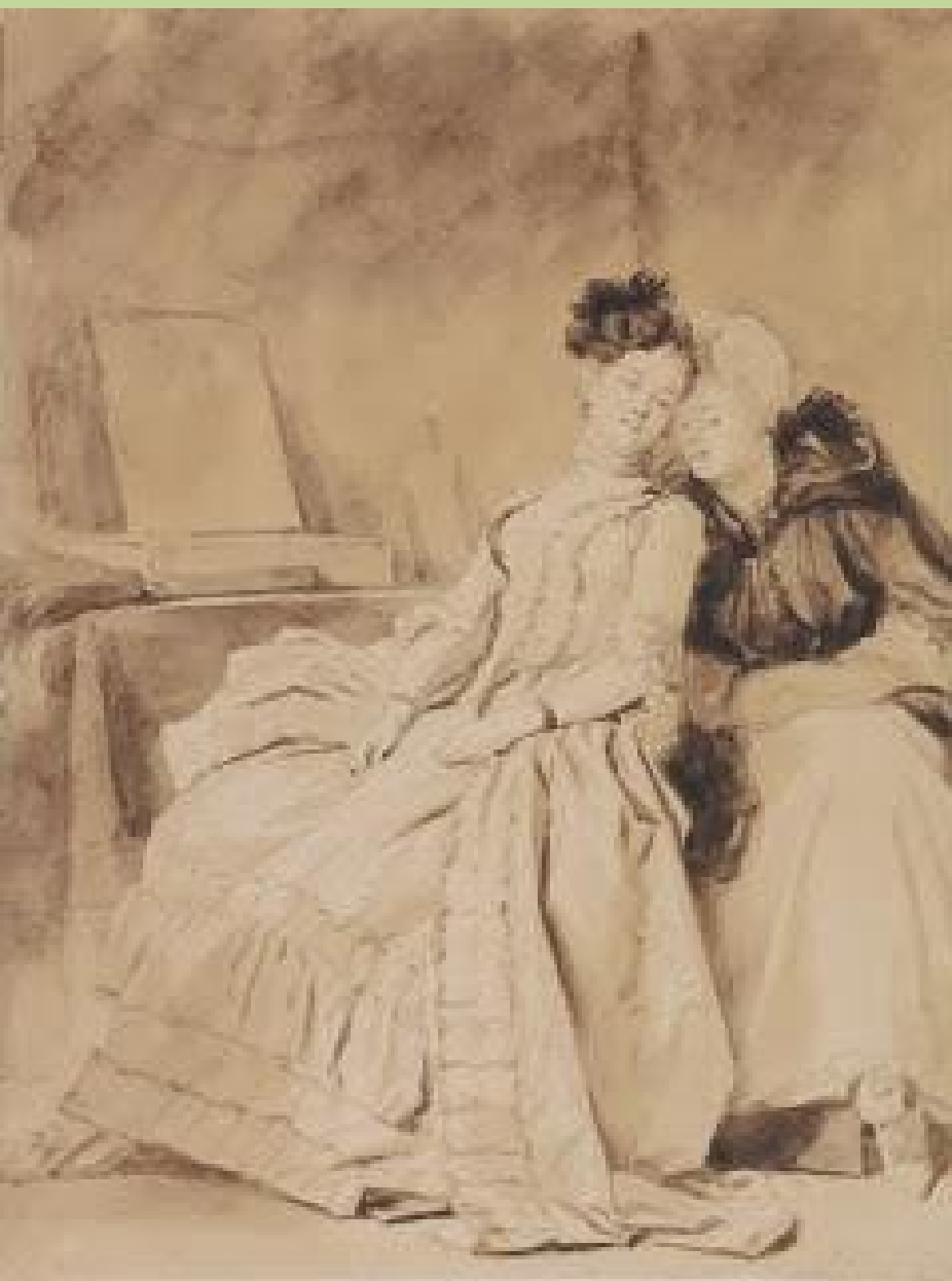
Jean Honoré Fragonard (Grasse, 1732 – Paris, 1806), Deux jeunes femmes conversant, vers 1776, lavis de bistre sur papier, Rotterdam, musée Boymans-van Beuningen.