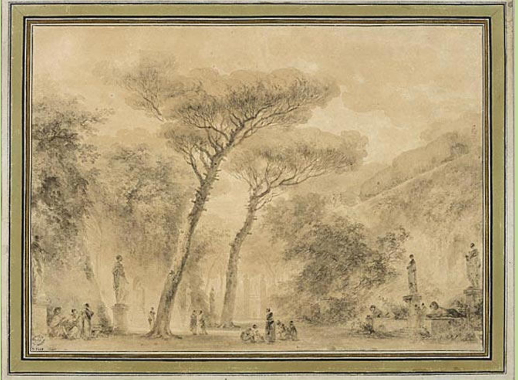
Jean Honoré Fragonard (Grasse, 1732 – Paris, 1806), Jardin aux pins parasols à Rome , 1774, lavis de bistre sur papier, Besançon, musée des Beaux-Arts et d'Archéologie.