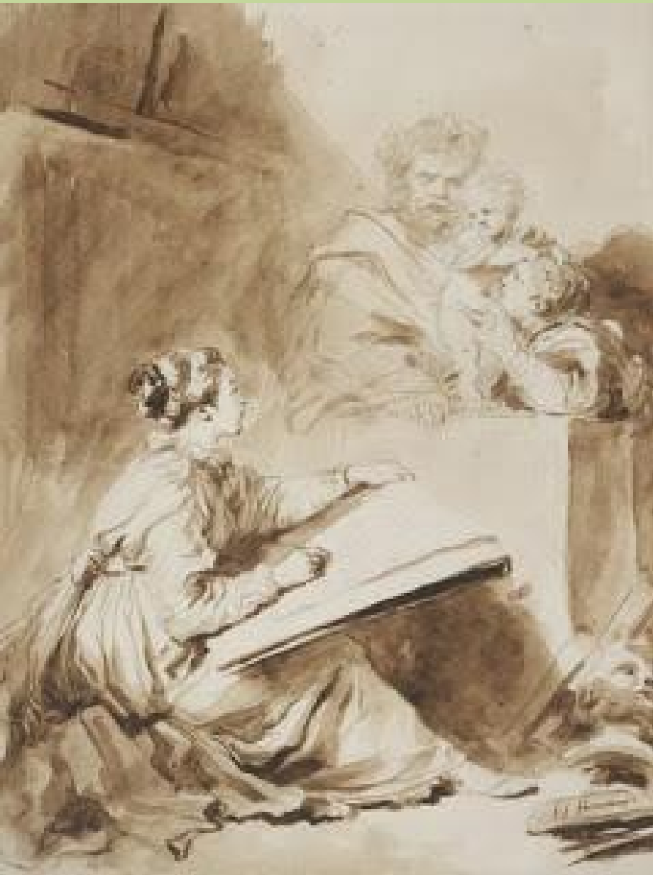
Jean Honoré Fragonard (Grasse, 1732 – Paris, 1806), Jeune fille dessinant , vers 1776, lavis de bistre sur papier, Vienne, Albertina.