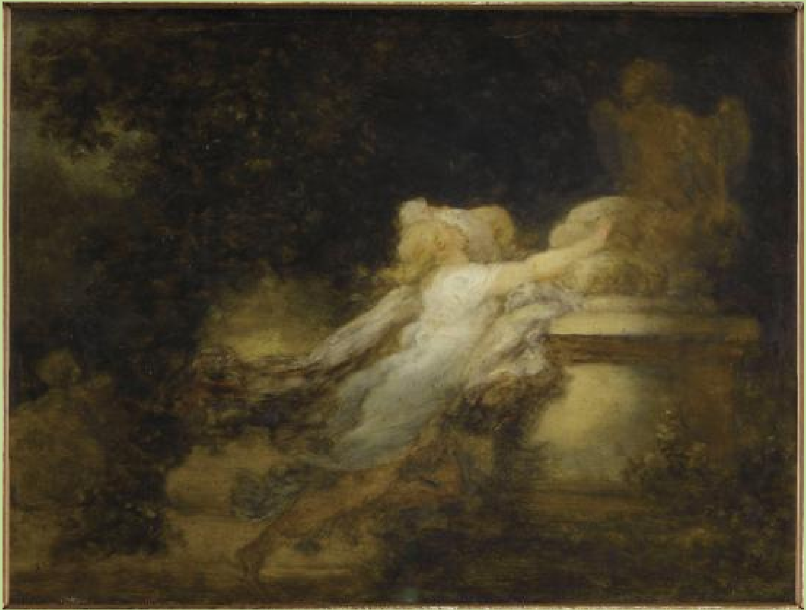
Jean Honoré Fragonard (Grasse, 1732 – Paris, 1806), Le Vœu à l'amour , vers 1776/80, peinture à l'huile sur toile, Paris, musée du Louvre.