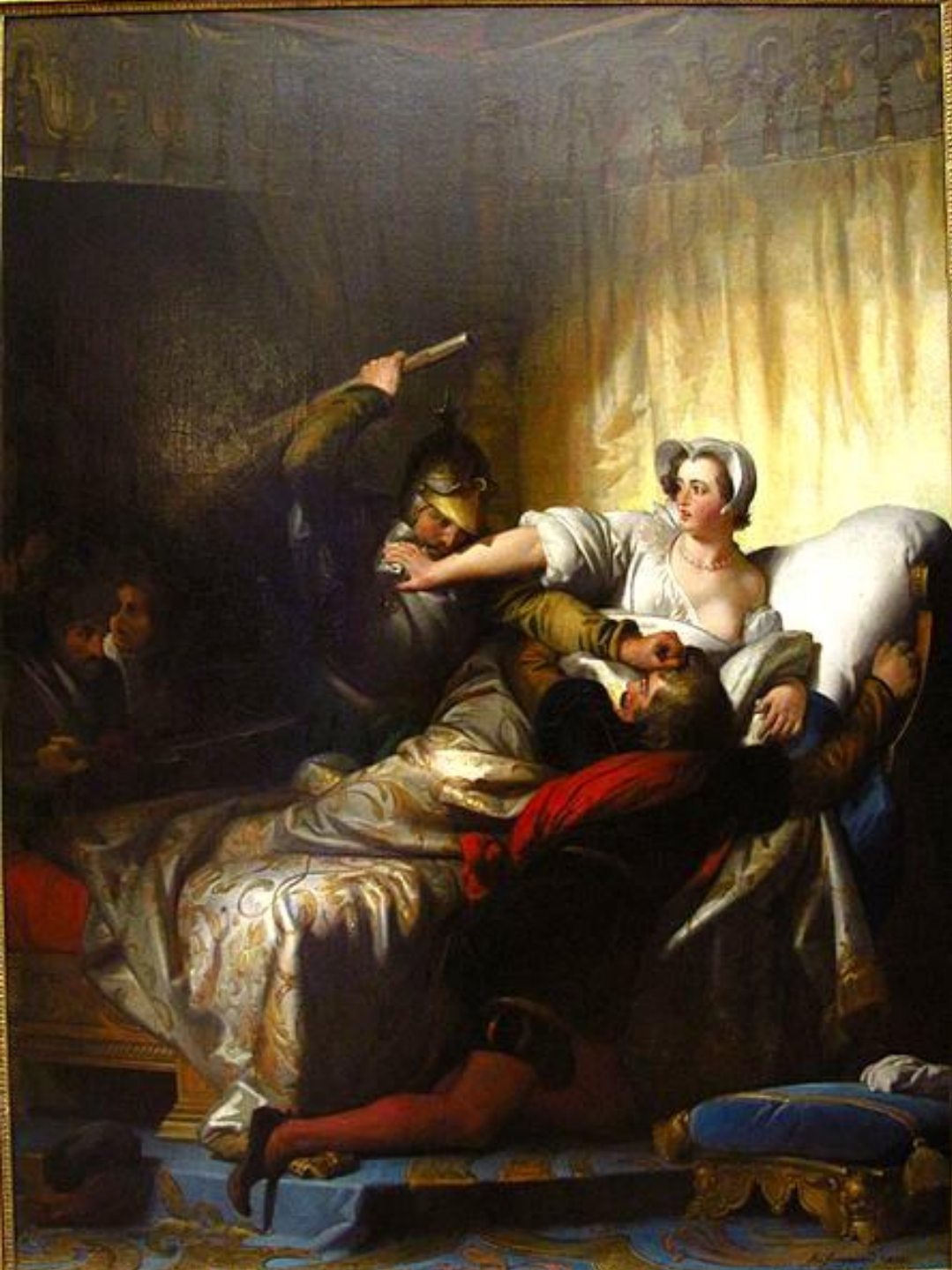
Alexandre Evariste Fragonard (Grasse, 1780 – Paris, 1850), Scène de la Saint-Barthélemy, dans l'appartement de la reine de Navarre, 1836, peinture à l'huile sur toile, Paris, musée du Louvre.