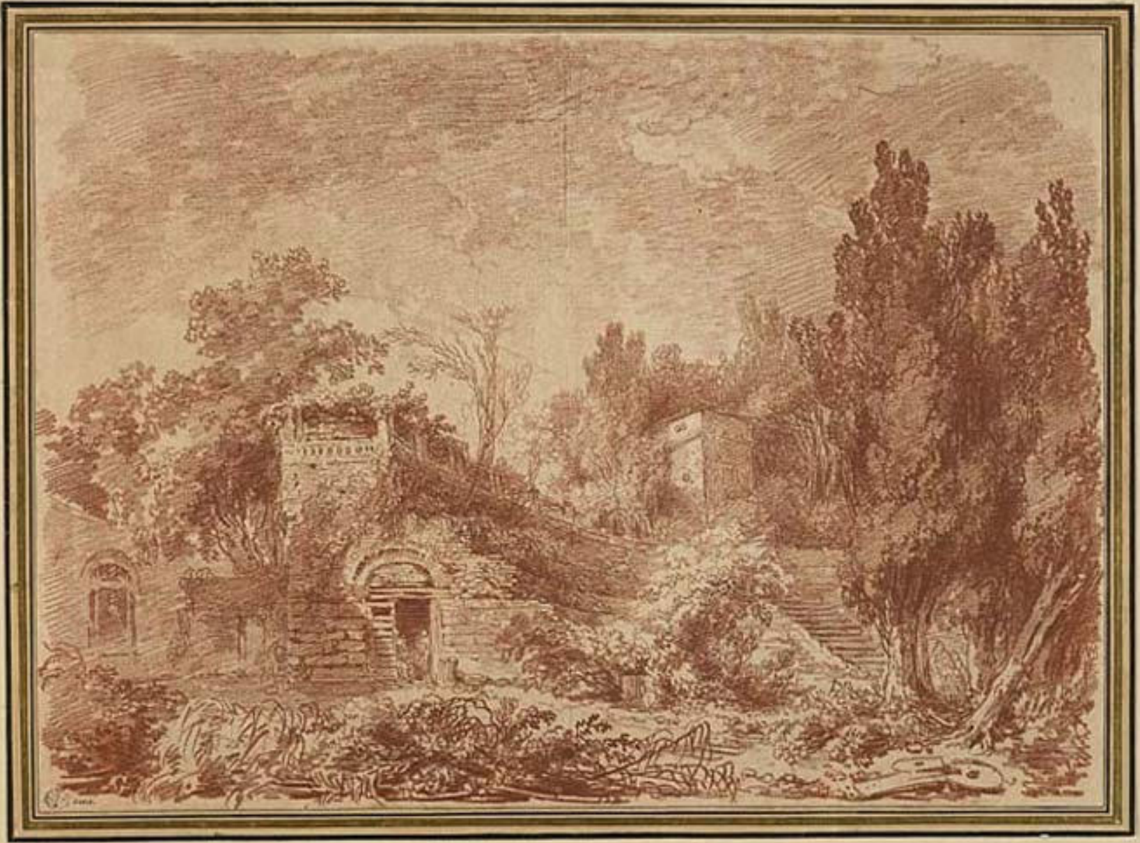
Jean Honoré Fragonard (Grasse, 1732 – Paris, 1806), Le Théâtre antique de la Villa Adriana à Tivoli , 1760, sanguine sur papier, Besançon, musée des Beaux-Arts et d'Archéologie.