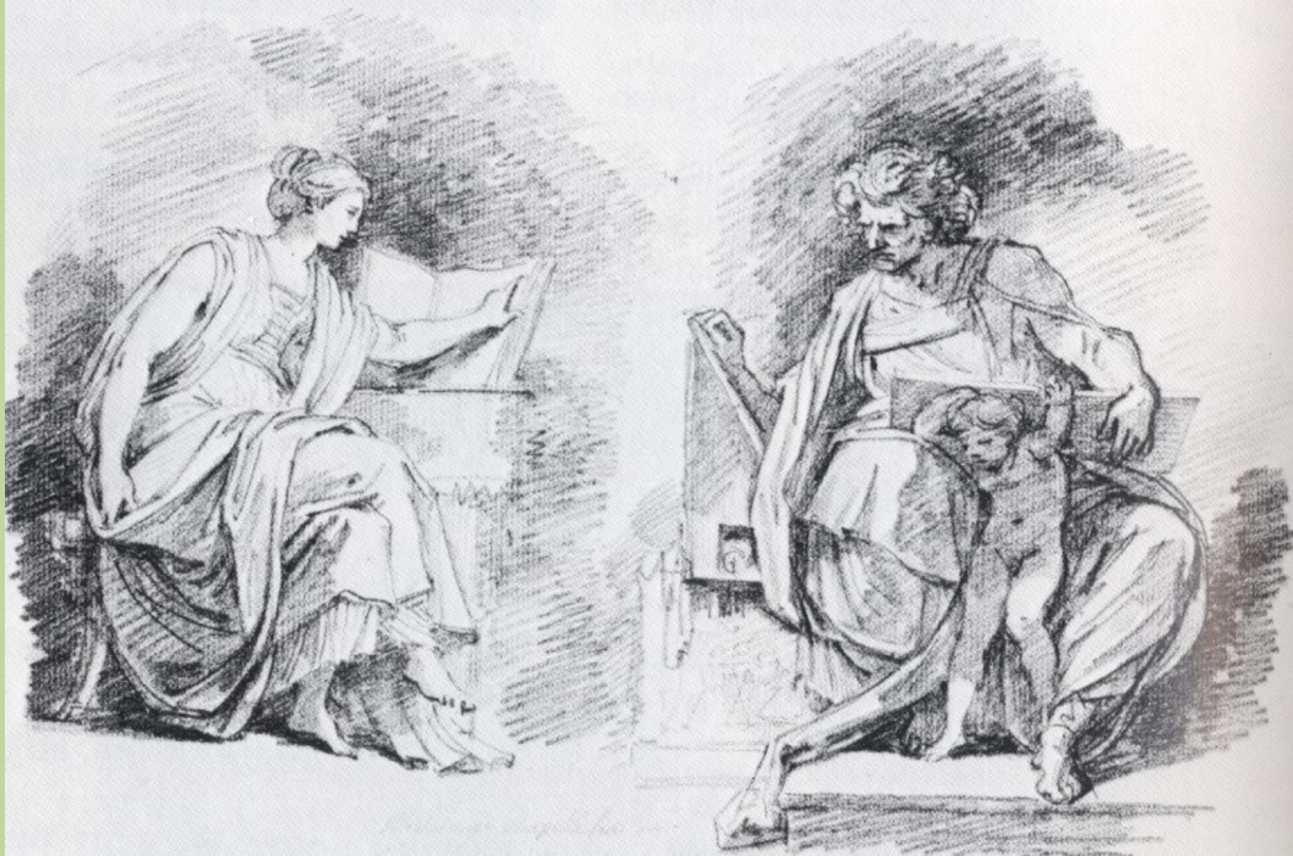
Jean Honoré Fragonard (Grasse, 1732 – Paris, 1806), La Sybille d'Erythrée et Le Prophète Daniel , d'après Michel-Ange, vers 1760, pierre noire sur papier, Amsterdam, Rijksmuseum.