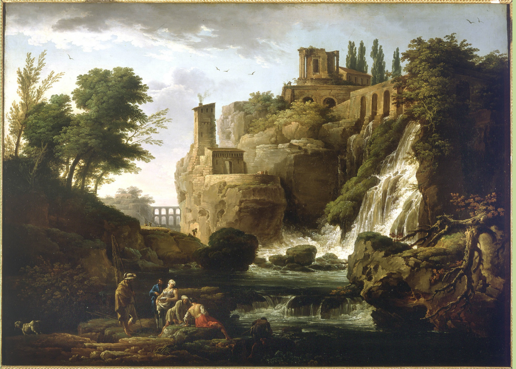
Claude Joseph Vernet (Avignon, 1714 – Paris, 1789), Les Cascatelles de Tivoli , vers 1740/8, peinture à l'huile sur toile, Paris, musée du Petit Palais.