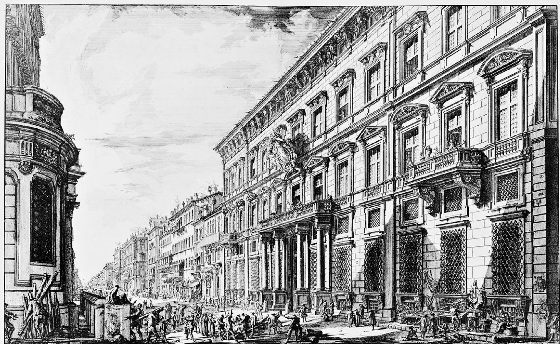
VEDUTA nella Via del Corso, DEL PALAZZO DELL'ACCADEMIA eretta da LUIGI XIV. RE DI FRANCIA per i Nationali Francesi studiosi della Pittura, Scultura e Architettura, colla liberal permissione al Pubblico di erigersi in tali arti per il comodo della esposizione quotidiana del Nudo e dei Modelli delle più rare Statue ed altri segni della Romana Magnificenza, si antichi, che moderni. 1. Stanze ove sono esposti i modelli della Colonna Trajana, Statue Equestre e Trojani, Busti, e Balzambien. 2. Stanze per l'esposizione del Nudo. 3. Appartamento Regio ornato parimenti di Modelli. 4. Appartamento del Signor Direttore. 5. Palazzo Paufly. 6. Via del Corso. 7. Porta del Popolo.

Disegnata da G. B. Piranesi. Incisa da G. G. B. Piranesi.