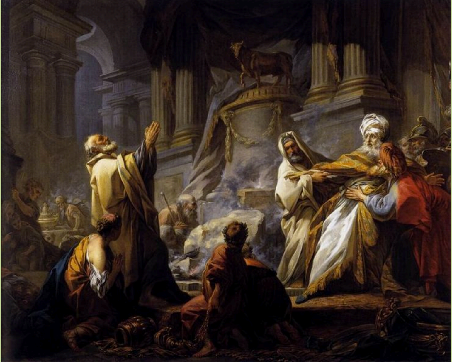
Jean Honoré Fragonard (Grasse, 1732 – Paris, 1806), Jéroboam sacrifiant aux idoles , 1752, peinture à l'huile sur toile, Paris, Ecole nationale supérieure des Beaux-Arts.