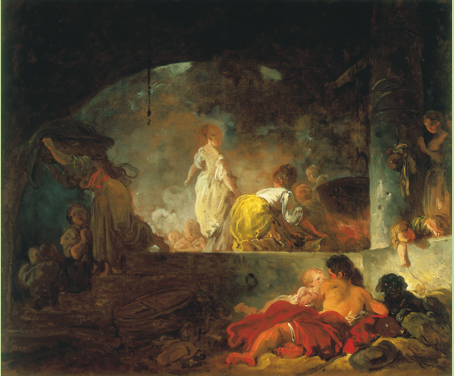
Jean Honoré Fragonard (Grasse, 1732 – Paris, 1806), Les Blanchisseuses , vers 1760, peinture à l'huile sur toile, Saint Louis, The Saint Louis Art Museum.