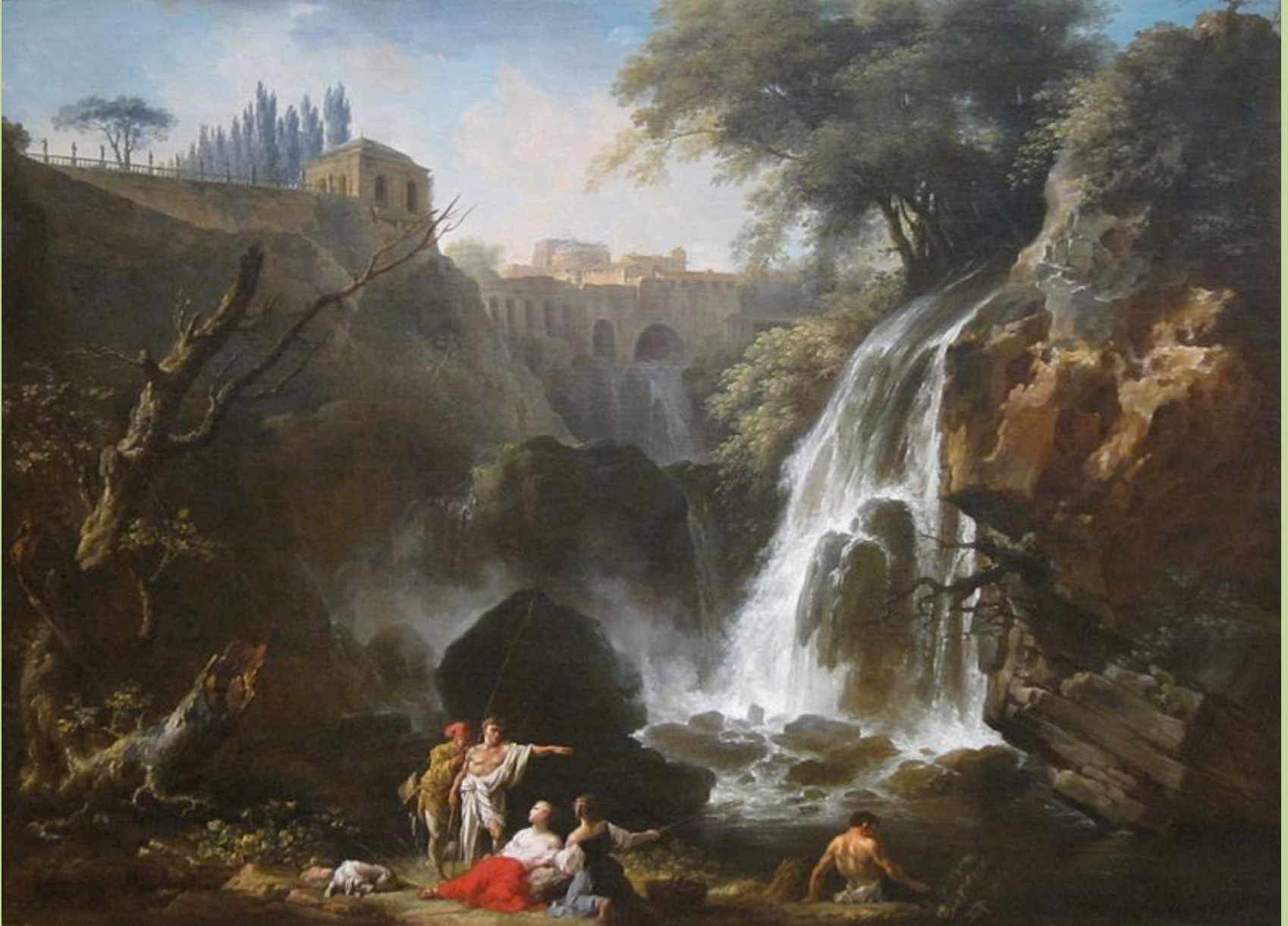
Claude Joseph Vernet (Avignon, 1714 – Paris, 1789), Paysage inspiré des Cascatelles de Tivoli , vers 1760, peinture à l'huile sur toile, Dayton, Art Institute.