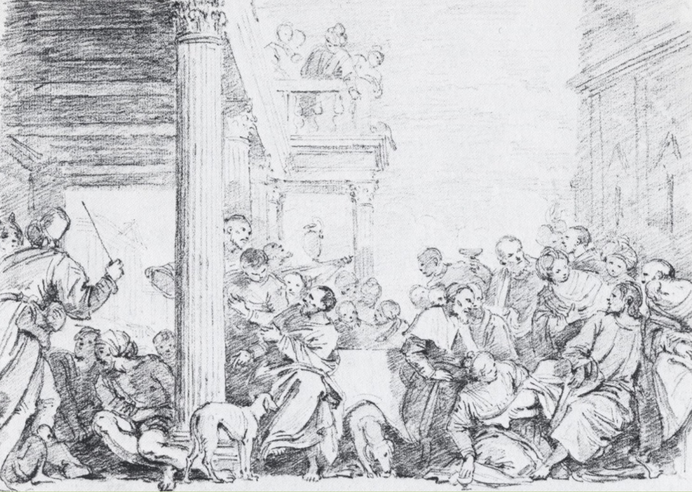
Jean Honoré Fragonard (Grasse, 1732 – Paris, 1806), Le Repas chez Simon, d'après Véronèse , vers 1761, pierre noire sur papier, Londres, British Museum.