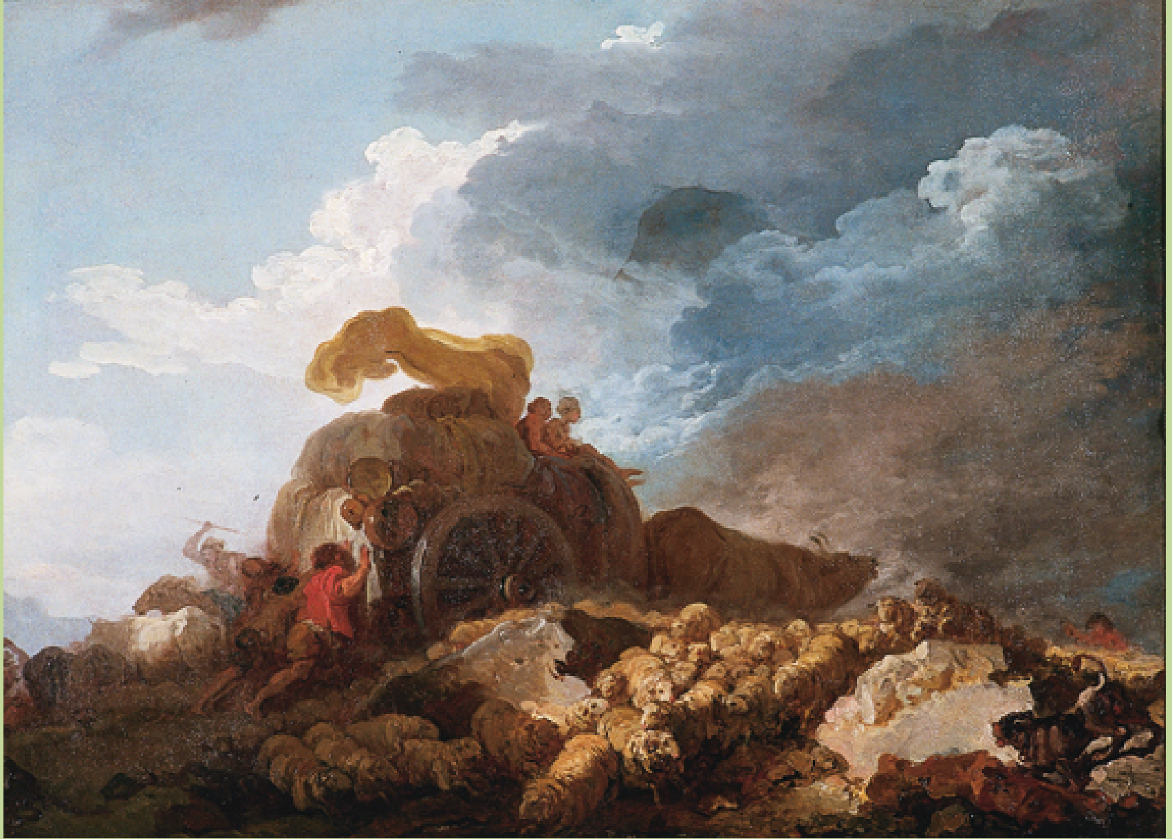
Jean Honoré Fragonard (Grasse, 1732 – Paris, 1806), La Charrette embourbée , vers 1760, peinture à l'huile sur toile, Paris, musée du Louvre.