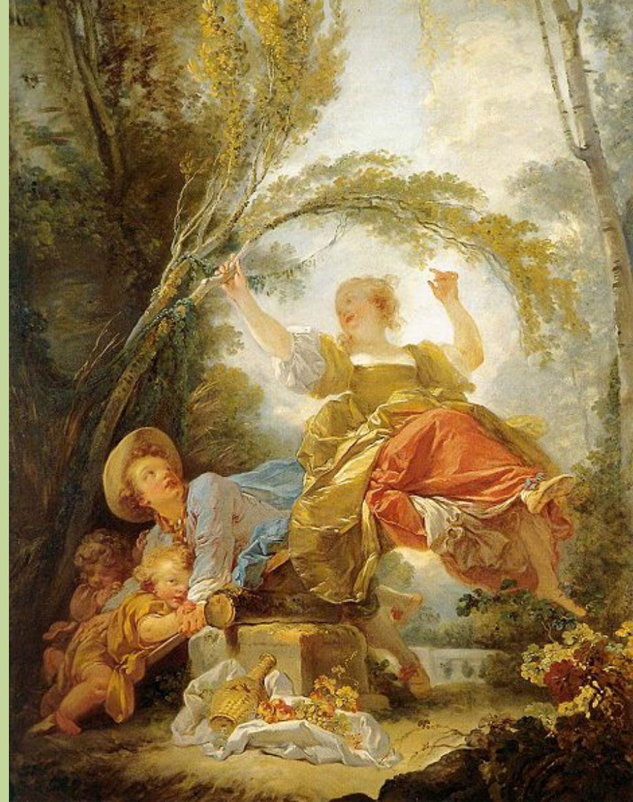
Jean Honoré Fragonard (Grasse, 1732 – Paris, 1806), Le Colin-maillard et La Bascule , vers 1750, peintures à l'huile sur toile, Toledo, Toledo Museum of Art, et Madrid, collection Thyssen-Bornemisza.