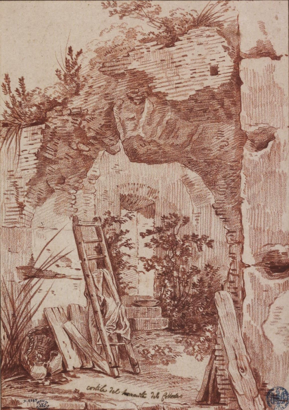
Hubert Robert (Paris, 1733 – Paris, 1808), Arcatures au Colisée, vers 1758, sanguine sur papier, Besançon, musée des Beaux-Arts et d'Archéologie.