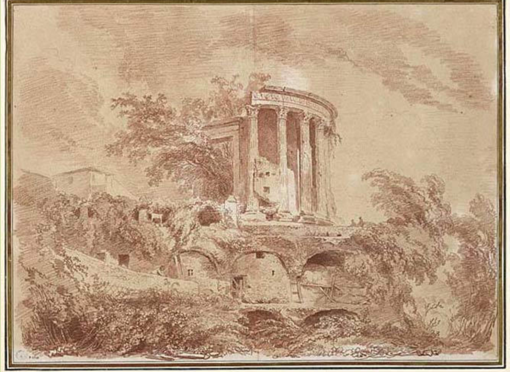
Jean Honoré Fragonard (Grasse, 1732 – Paris, 1806), Le Temple dit de la Sybille à Tivoli , 1760, sanguine sur papier, Besançon, musée des Beaux-Arts et d'Archéologie.