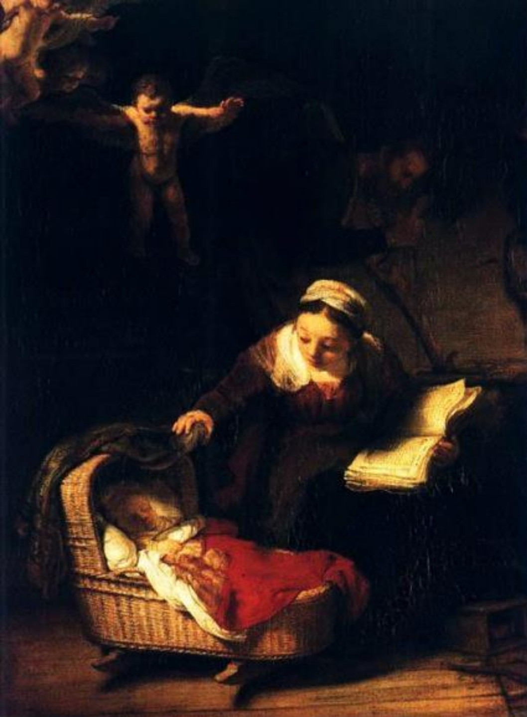
Rembrandt Harmensz. van Rijn (Leyde, 1606 – Amsterdam, 1669), La Sainte famille , 1645, peinture à l'huile sur toile, Saint-Pétersbourg, musée de l'Ermitage.