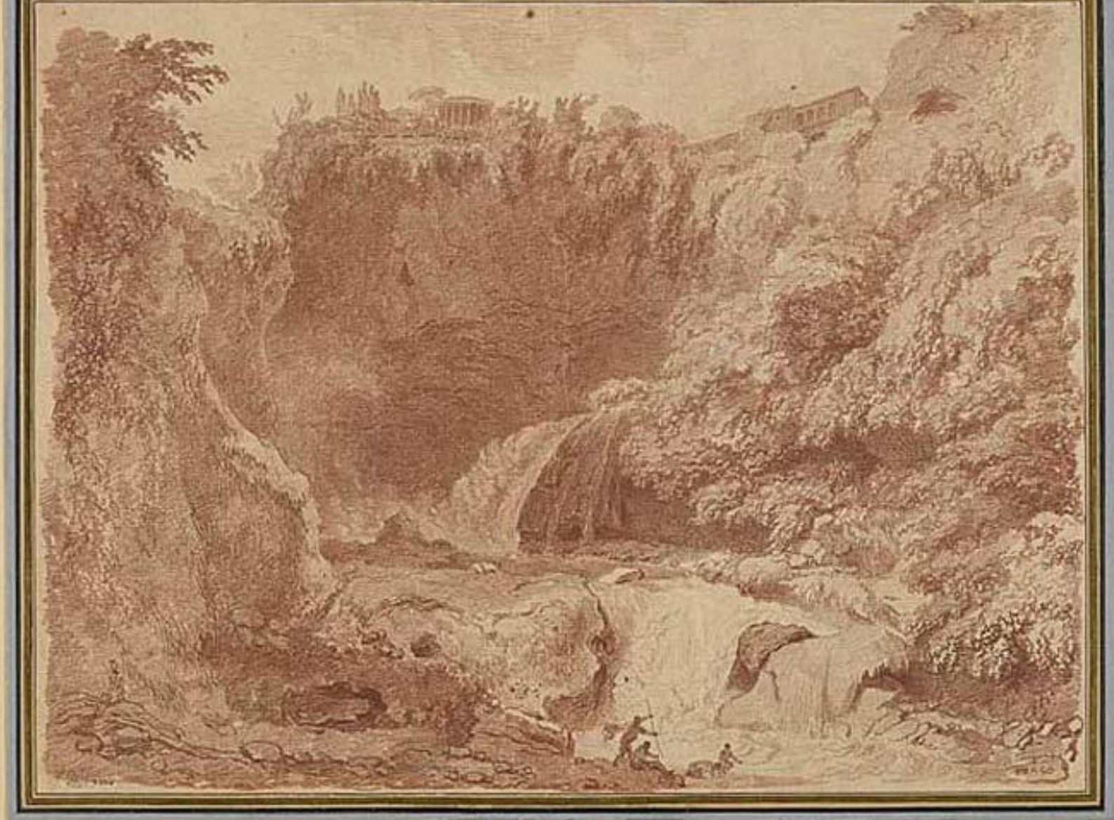
Jean Honoré Fragonard (Grasse, 1732 – Paris, 1806), Les Cascatelles de Tivoli, avec le temple dit de la Sybille, la villa de Mécène et la grotte de Neptune , 1760, sanguine sur papier, Besançon, musée des Beaux-Arts et d'Archéologie.