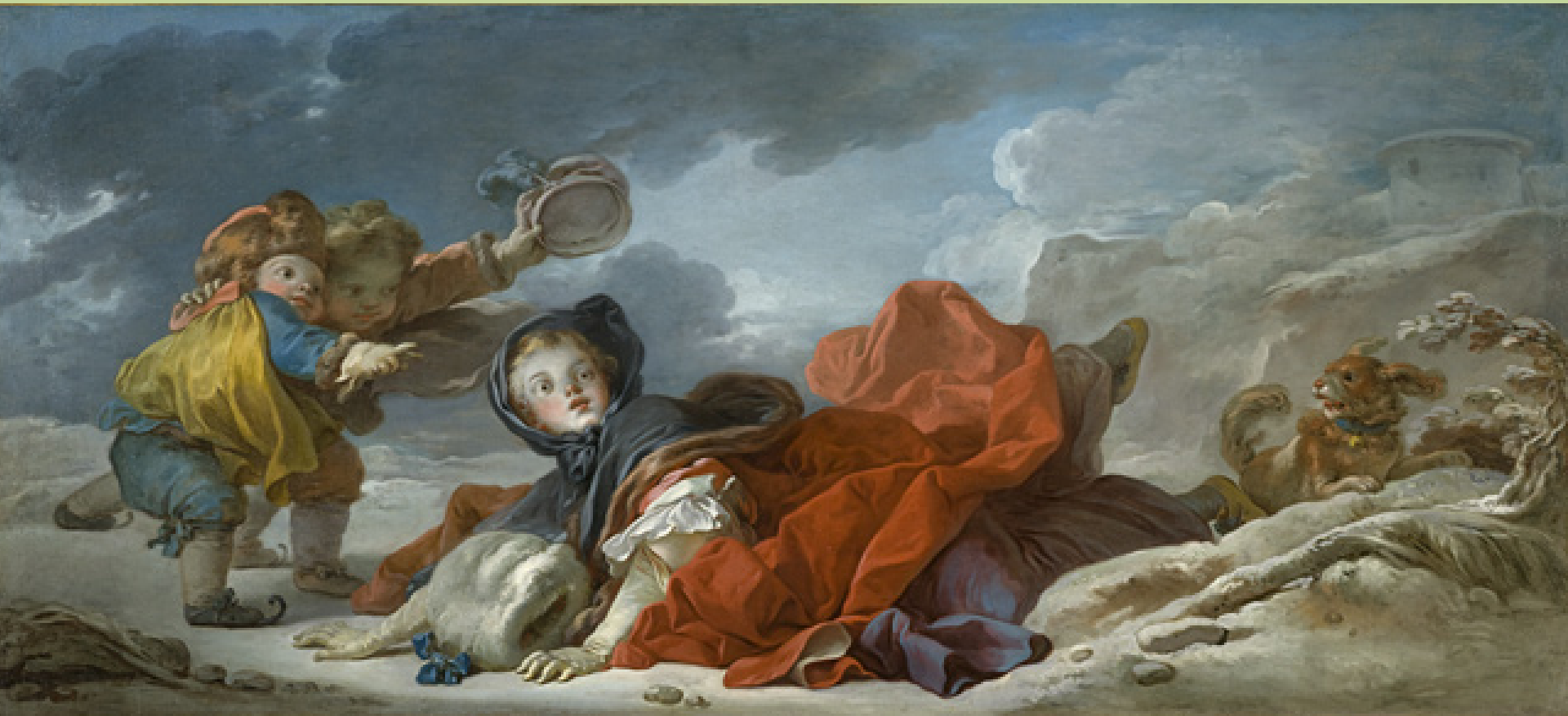
Jean Honoré Fragonard (Grasse, 1732 – Paris, 1806), L'Hiver , vers 1752/3, peinture à l'huile sur toile, Los Angeles, Los Angeles County Museum of Art.