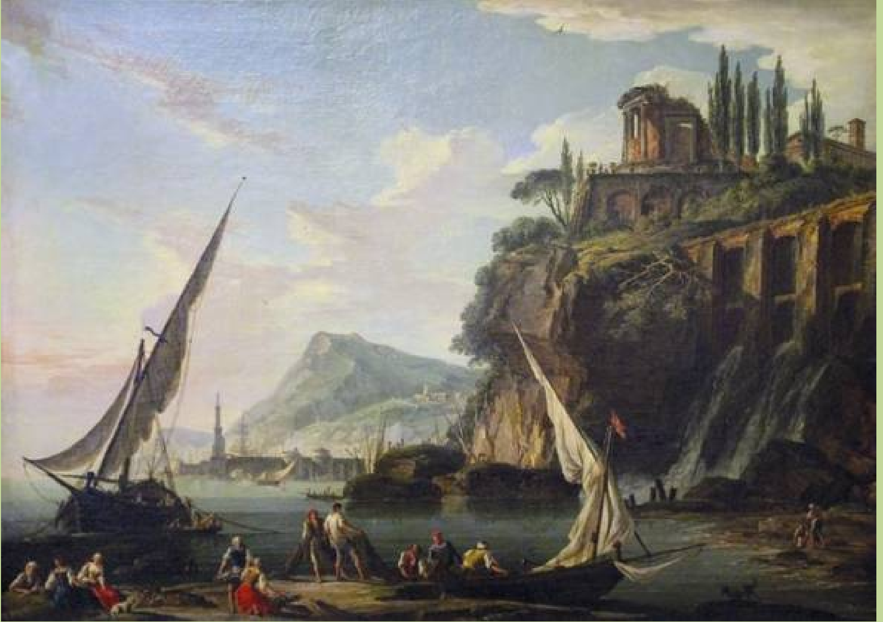
Charles-François Lacroix de Marseille (Paris, 1733 – Paris, 1808), Marine avec le temple de la Sybille de Tivoli , vers 1770, peinture à l'huile sur toile, Saint-Omer, musée de l'hôtel Sandelin.