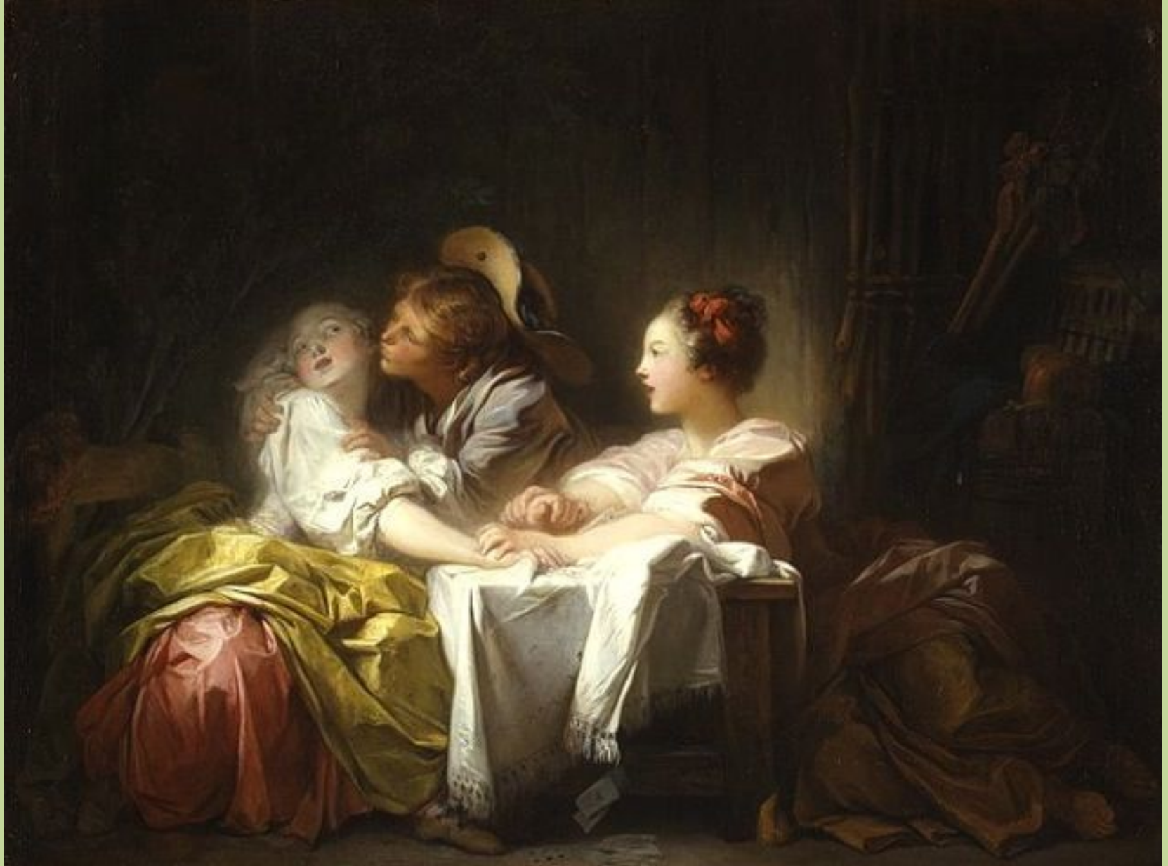
Jean Honoré Fragonard (Grasse, 1732 – Paris, 1806), L'Enjeu perdu ou Le Baiser gagné , vers 1759, peinture à l'huile sur toile, New York, The Metropolitan Museum of Art.