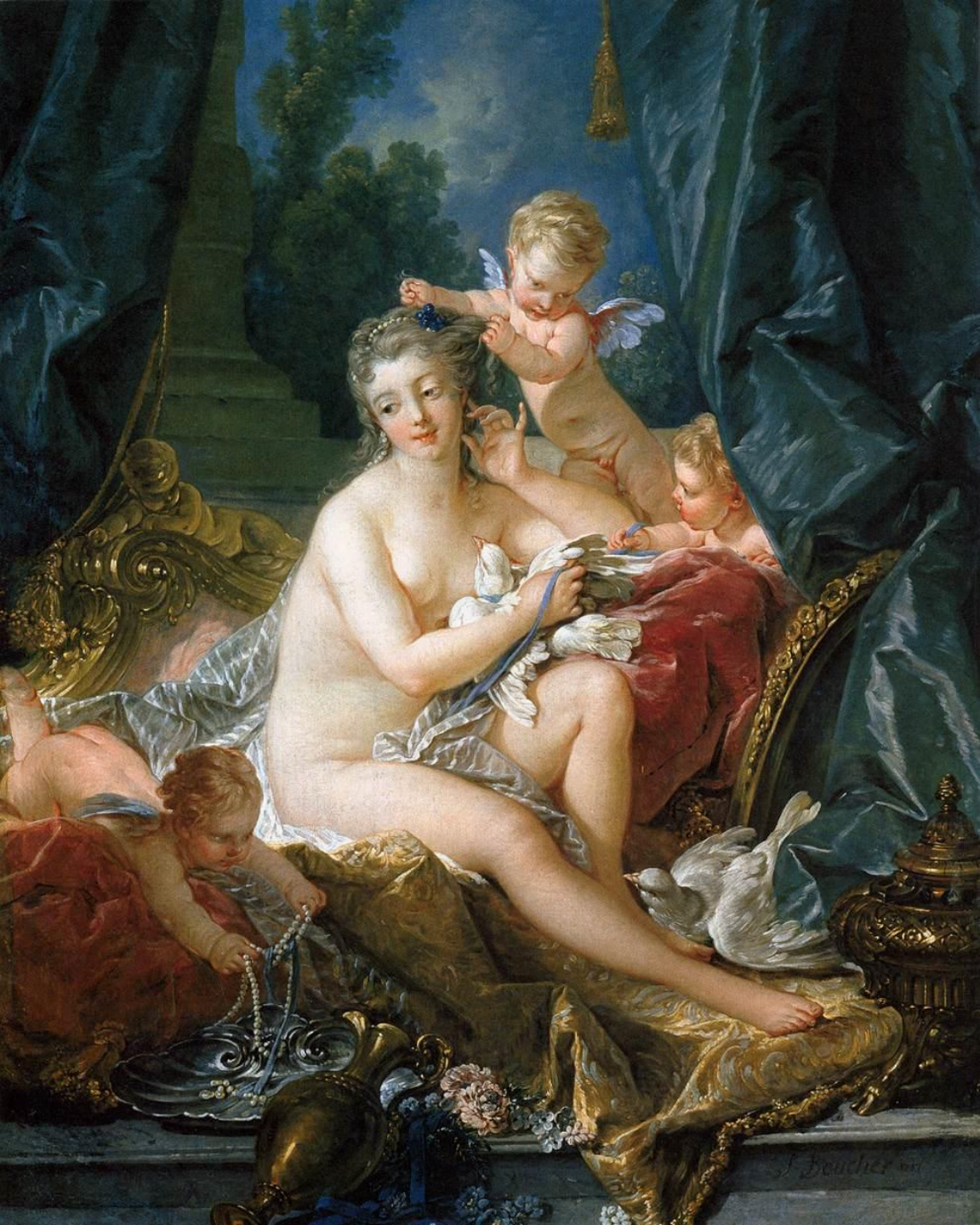
François Boucher (Paris, 1703 – Paris, 1770), Vénus à sa toilette, 1752, peinture à l'huile sur toile, New York, The Metropolitan Museum of Art.