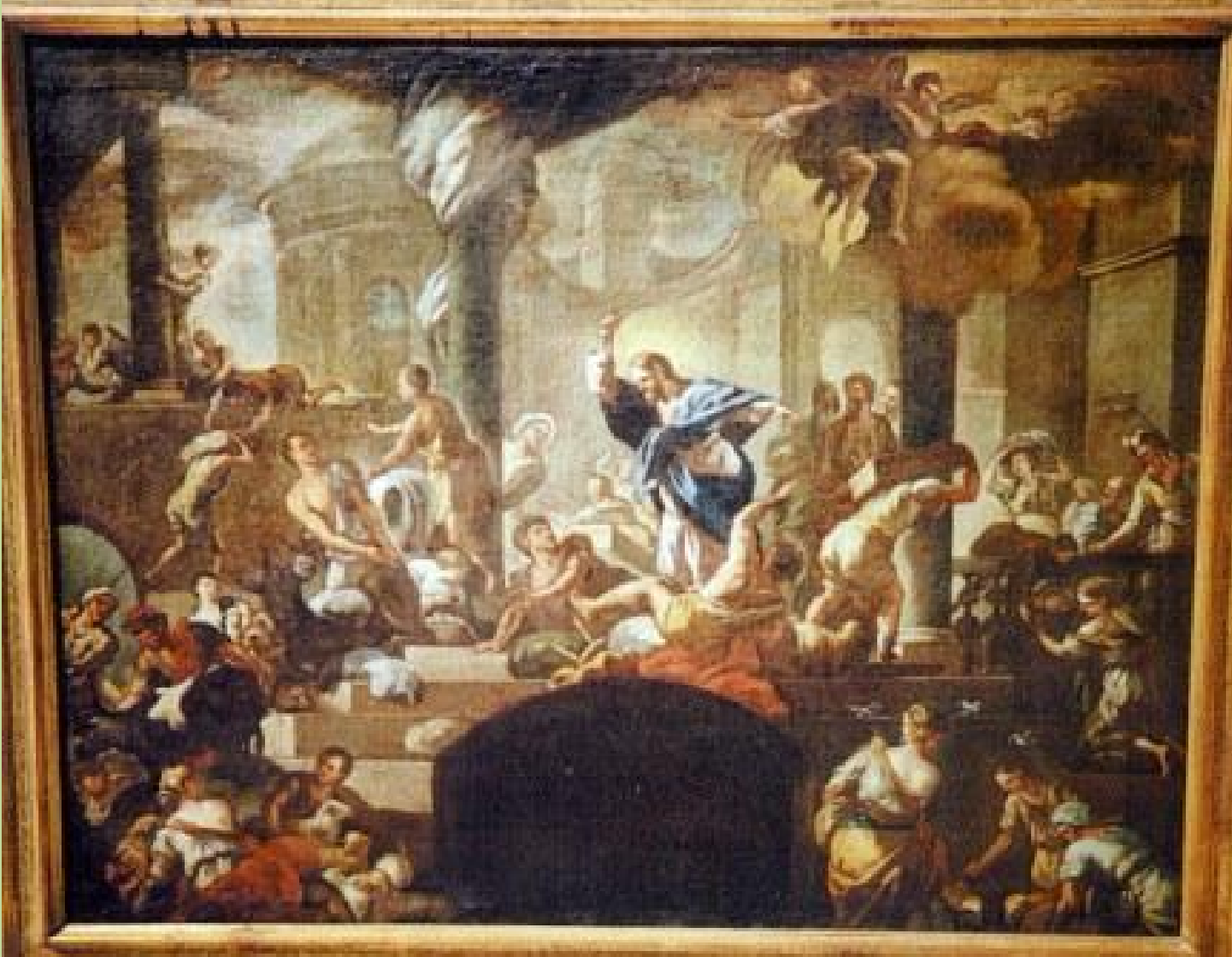
Nicola Malinconico (Naples, 1663 – Naples, 1727), Jésus chassant les marchands du temple , vers 1715, peinture à l'huile sur toile, collection particulière.