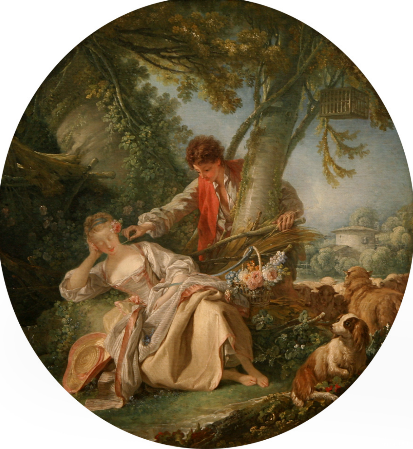
François Boucher (Paris, 1703 – Paris, 1770), La Sieste interrompue , vers 1750, peinture à l'huile sur toile, New York, The Metropolitan Museum of Art