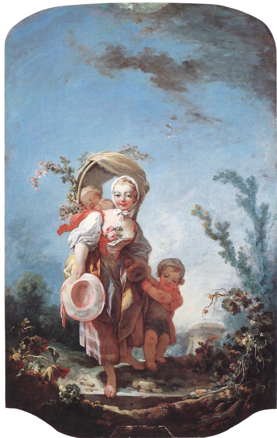
Jean Honoré Fragonard (Grasse, 1732 – Paris, 1806), La Bergère , vers 1750, peintures à l'huile sur toile, Detroit, The Detroit Institute of Arts.