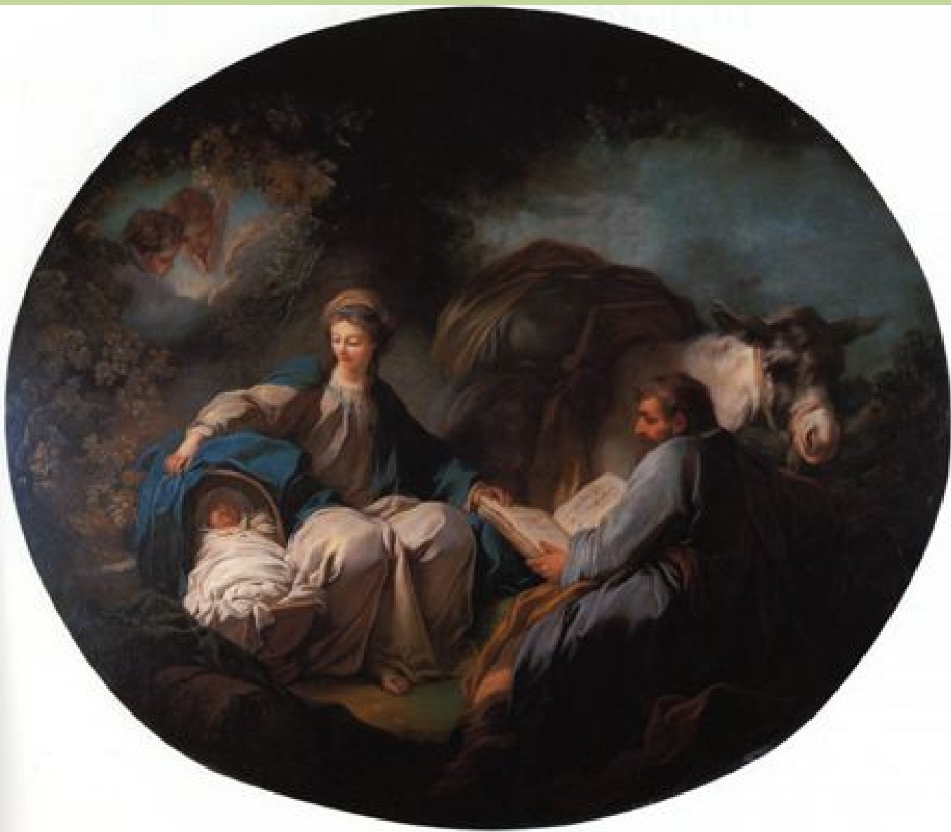
Jean Honoré Fragonard (Grasse, 1732 – Paris, 1806), Le Repos pendant la fuite en Egypte , vers 1754, peinture à l'huile sur toile, Norfolk, The Chrysler Museum.