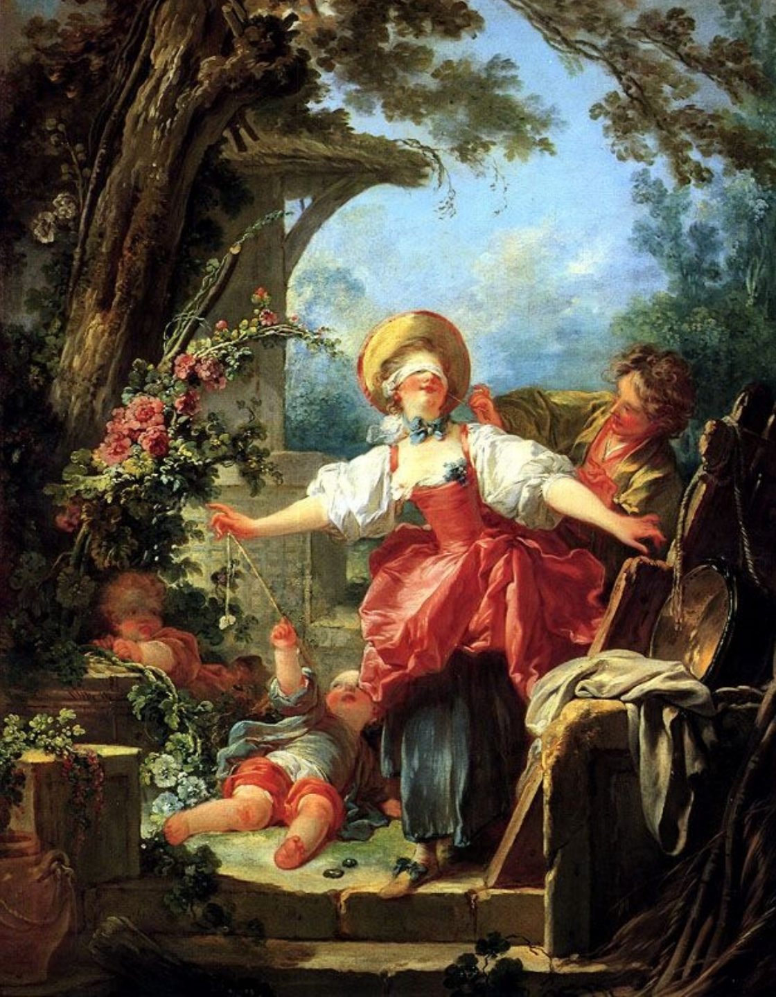
Jean Honoré Fragonard (Grasse, 1732 – Paris, 1806), Le Colin-maillard, vers 1750, peintures à l'huile sur toile, Toledo, Toledo Museum of Art.