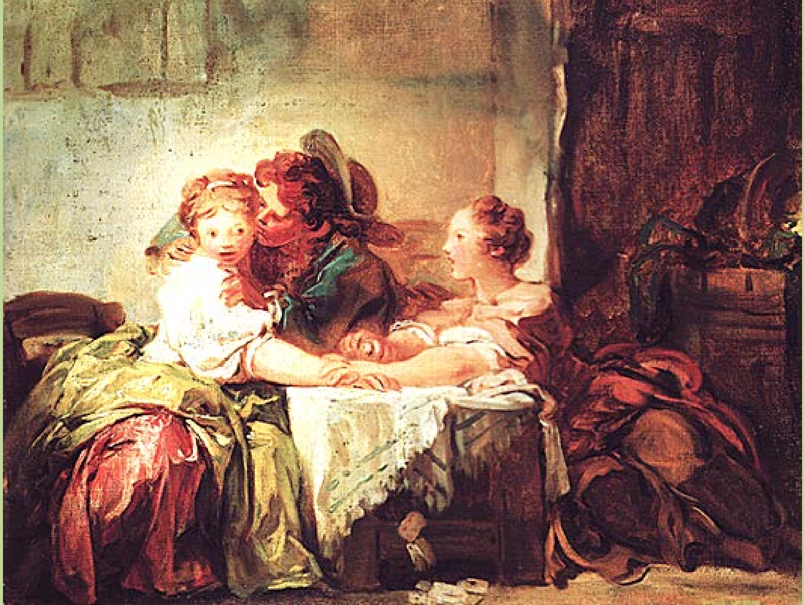
Jean Honoré Fragonard (Grasse, 1732 – Paris, 1806), L'Enjeu perdu ou Le Baiser gagné , vers 1759, peinture à l'huile sur toile, Saint-Pétersbourg, musée de l'Ermitage.