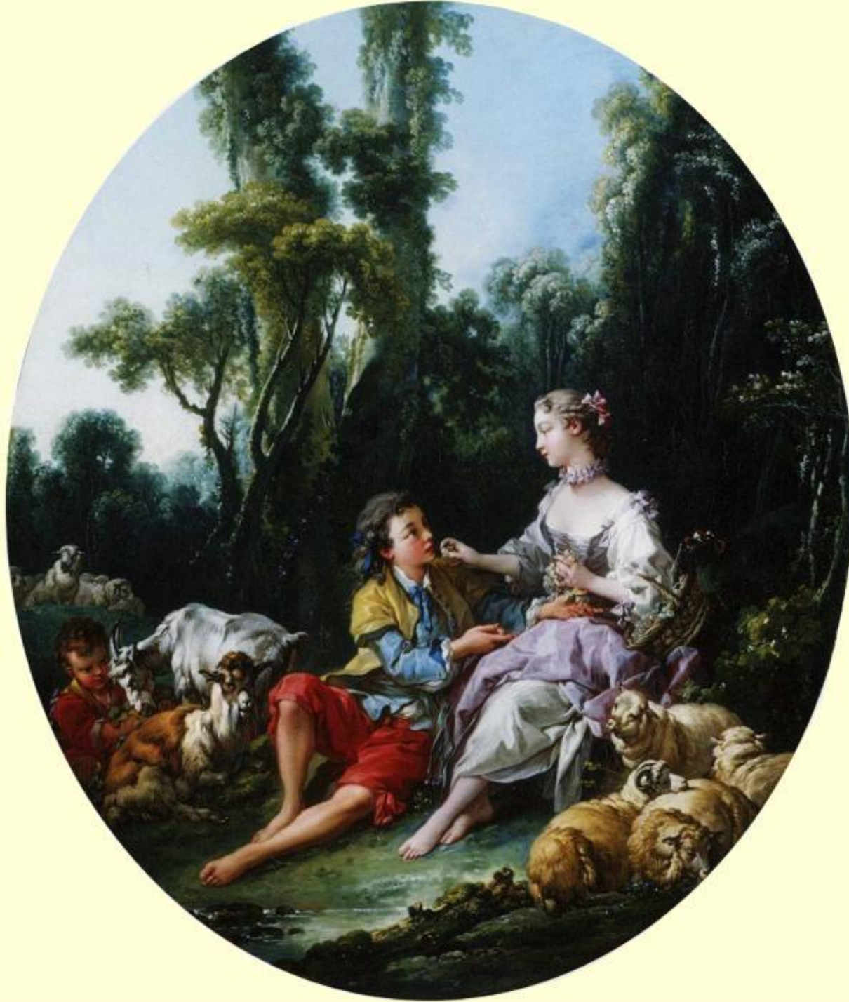
François Boucher (Paris, 1703 – Paris, 1770), Pensent-ils au raisin ? , 1747, peinture à l'huile sur toile, Chicago, The Art Institute.