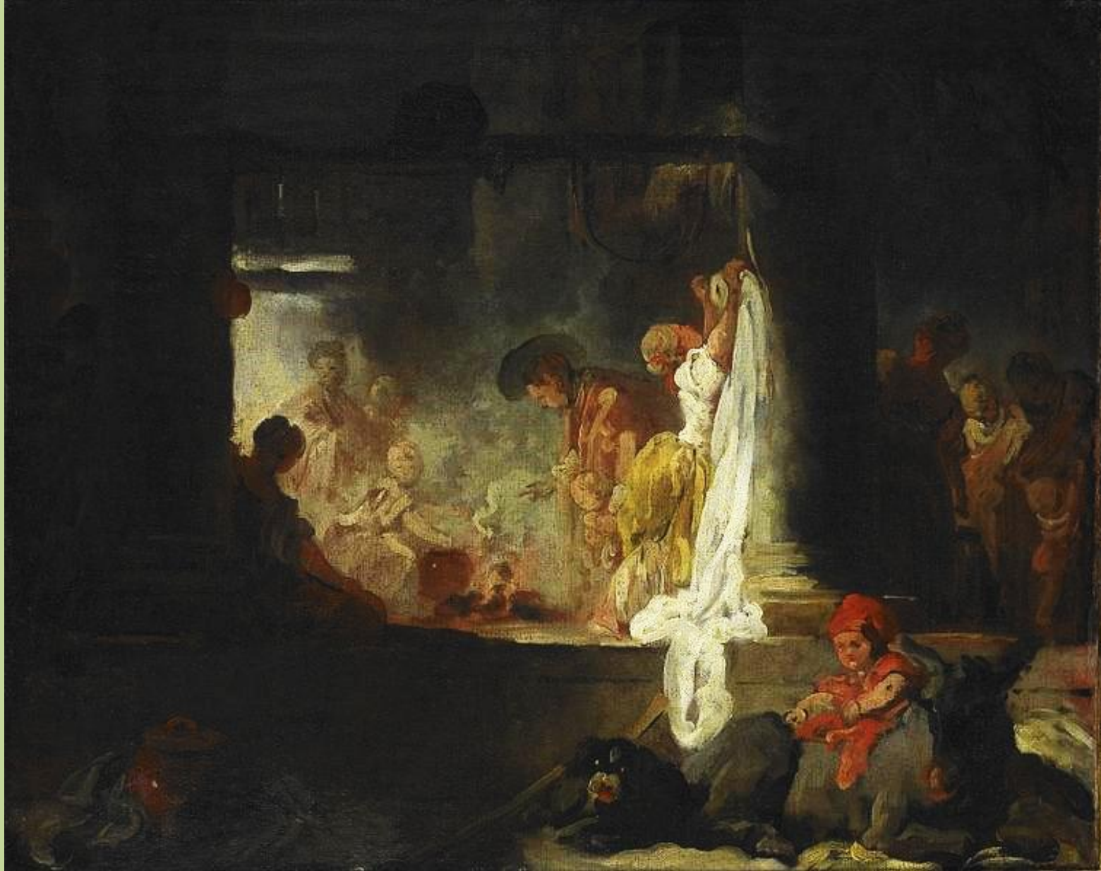
Jean Honoré Fragonard (Grasse, 1732 – Paris, 1806), Les Blanchisseuses ou L'Etendage , vers 1760, peinture à l'huile sur toile, Rouen, musée des Beaux-Arts.