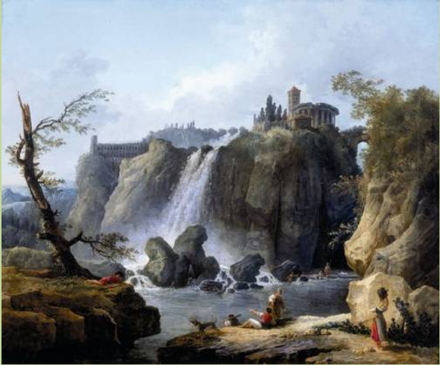
Hubert Robert (Paris, 1733 – Paris, 1808), Les Cascatelles de Tivoli , 1768, peinture à l'huile sur toile, Pau, musée des Beaux-Arts.