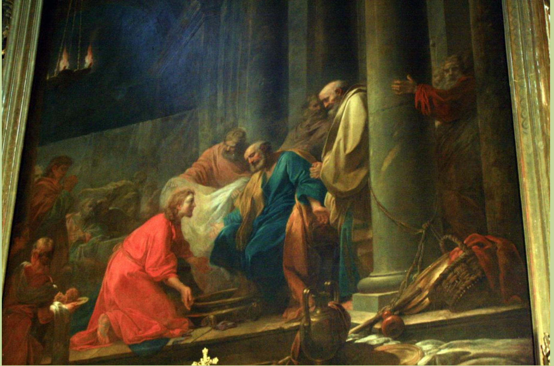
Jean Honoré Fragonard (Grasse, 1732 – Paris, 1806), Le Lavement des pieds , 1754, peinture à l'huile sur toile, Grasse, cathédrale Notre-Dame-du-Puy.