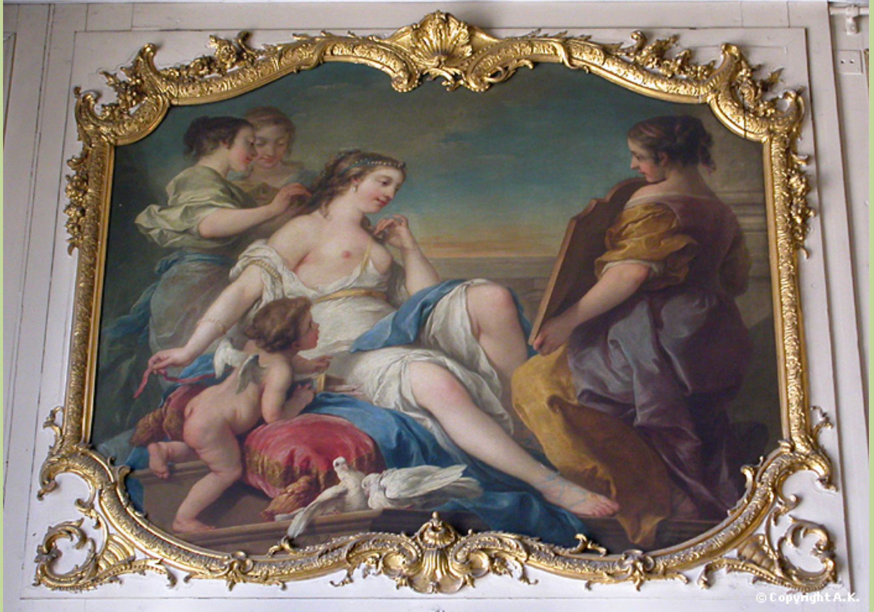
Carle Van Loo (Nice, 1705 – Paris, 1765), Vénus à sa toilette , 1738, peinture à l'huile sur toile, Paris, hôtel de Soubise.