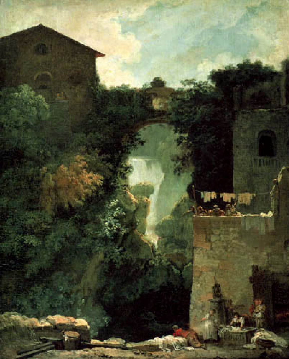
Jean Honoré Fragonard (Grasse, 1732 – Paris, 1806), La Grande cascade de Tivoli , 1760, peinture à l'huile sur toile, Paris, musée du Louvre.