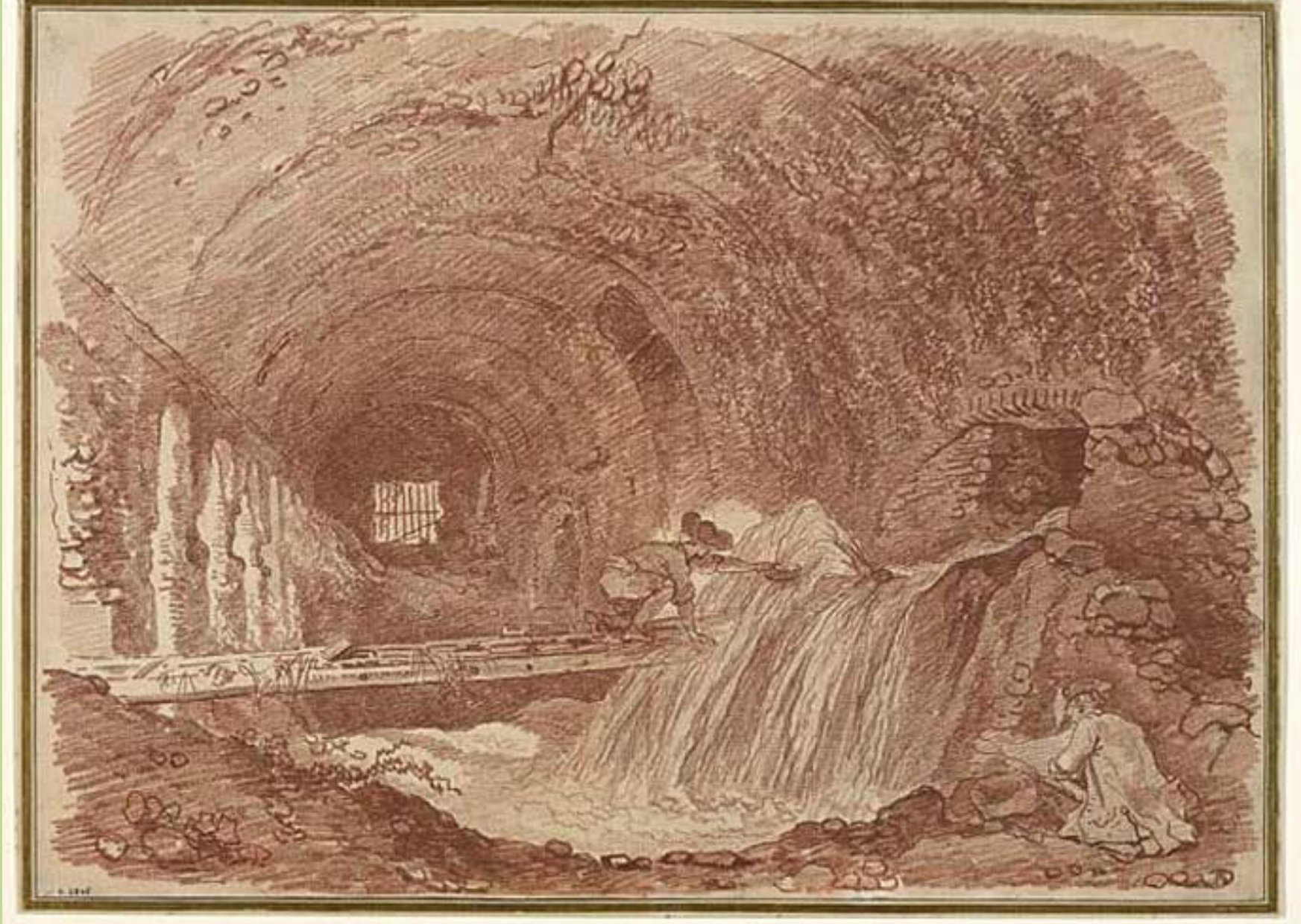
Jean Honoré Fragonard (Grasse, 1732 – Paris, 1806), Vue intérieure des écuries de Mécène à Tivoli , 1760, sanguine sur papier, Besançon, musée des Beaux-Arts et d'Archéologie.