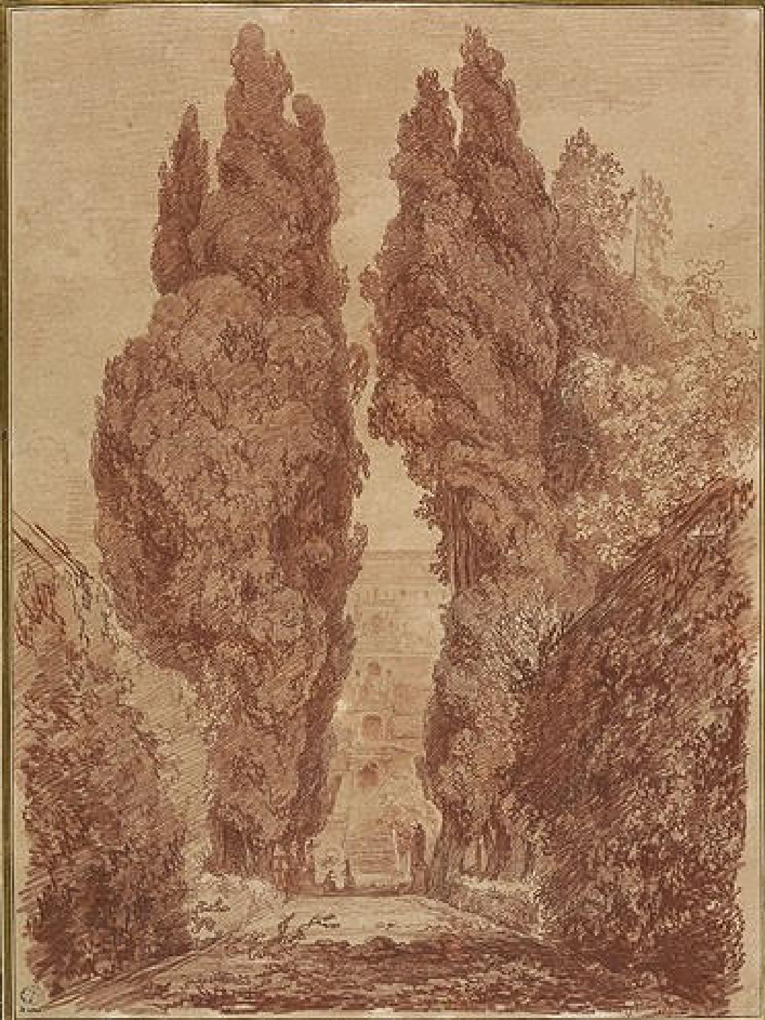
Jean Honoré Fragonard (Grasse, 1732 – Paris, 1806), Grands cyprès à la Villa d'Este, à Tivoli, 1760, sanguine sur papier, Besançon, musée des Beaux-Arts et d'Archéologie.