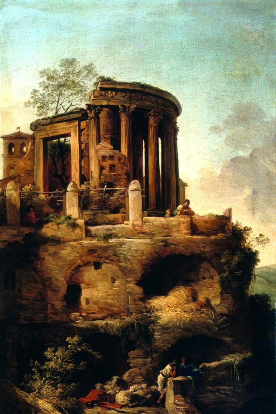
François André Vincent (Paris, 1746 – Paris, 1816), Le Temple de la Sybille à Tivoli, vers 1773, Peinture à l'huile sur toile, Marseille, musée des Beaux-Arts.