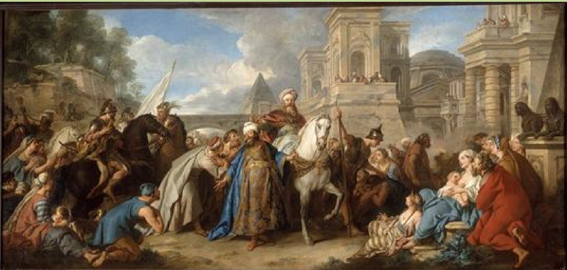
Jean-François de Troy (Paris, 1679 – Rome, 1762), Le Triomphe de Mardochée , 1739, peinture à l'huile sur toile, Paris, musée du Louvre.