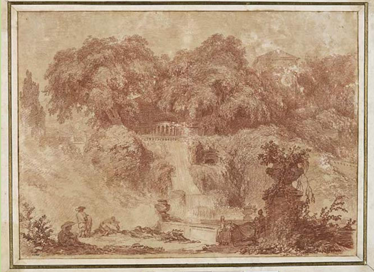
Jean Honoré Fragonard (Grasse, 1732 – Paris, 1806), Les Jardins et les terrasses de la Villa d'Este à Tivoli, au pied de la fontaine de l'orgue , 1760, sanguine sur papier, Besançon, musée des Beaux-Arts et d'Archéologie.