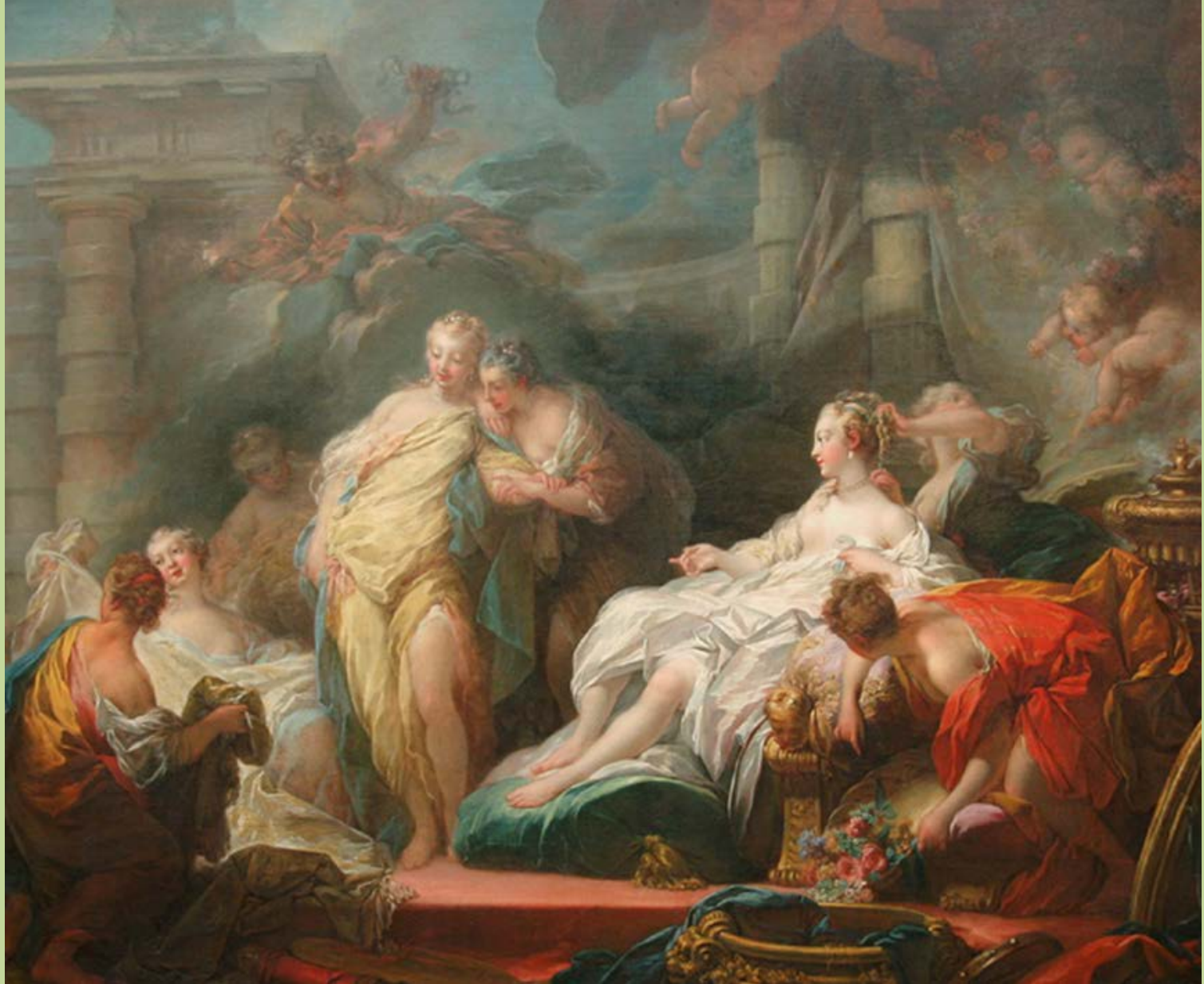
Jean Honoré Fragonard (Grasse, 1732 – Paris, 1806), Psyché montre à ses sœurs les présents qu'elle a reçu de l'Amour , 1753, peinture à l'huile sur toile, Londres, National Gallery.