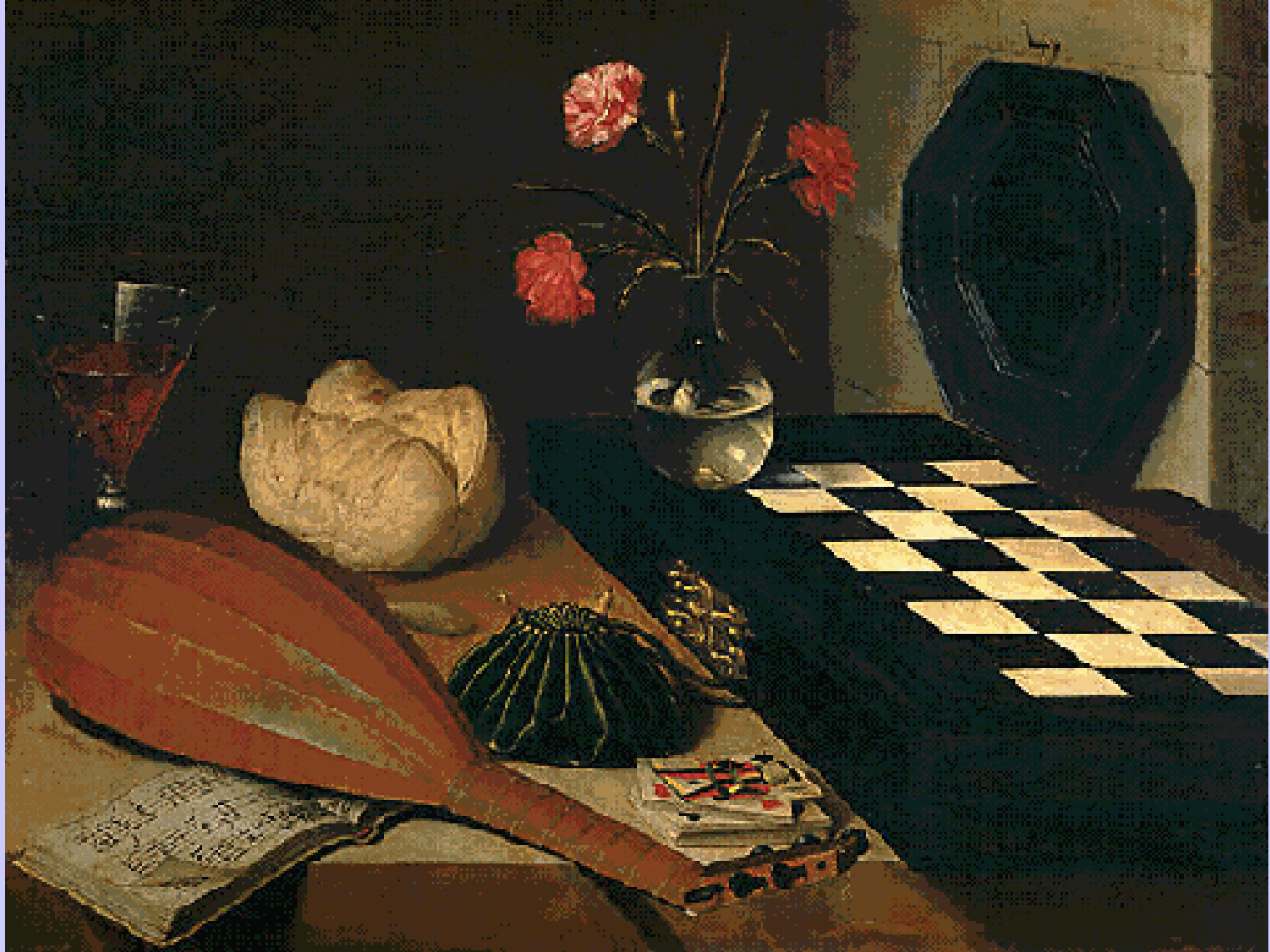
Lubin Baugin (Pithiviers, 1612 – Paris, 1663), Nature morte à l'échiquier , 1630, peinture à l'huile sur bois, Paris, musée du Louvre.