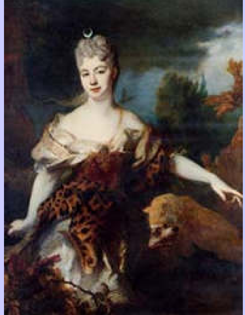
Nicolas de Largillière (Paris, 1656 – Paris, 1735), Portrait d'homme en Apollon et Portrait de femme en Diane , vers 1700/10, peinture à l'huile sur toile, Paris, musée du Louvre, et Pau, musée des Beaux-Arts.