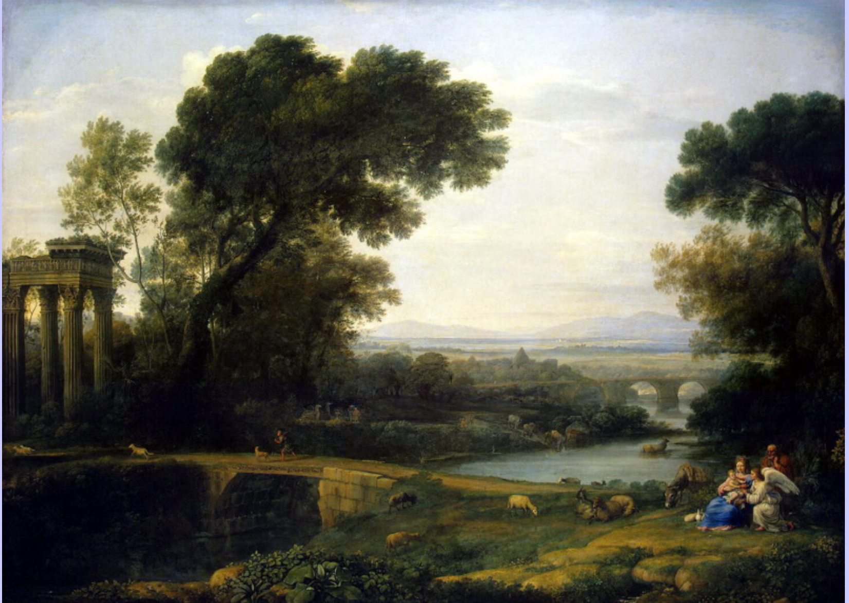
Claude Gellée, dit Le Lorrain (Chamagne, vers 1600 – Rome, 1682), Paysage avec une halte pendant la fuite en Egypte , 1661, peinture à l'huile sur toile, Saint-Pétersbourg, musée de l'Ermitage.