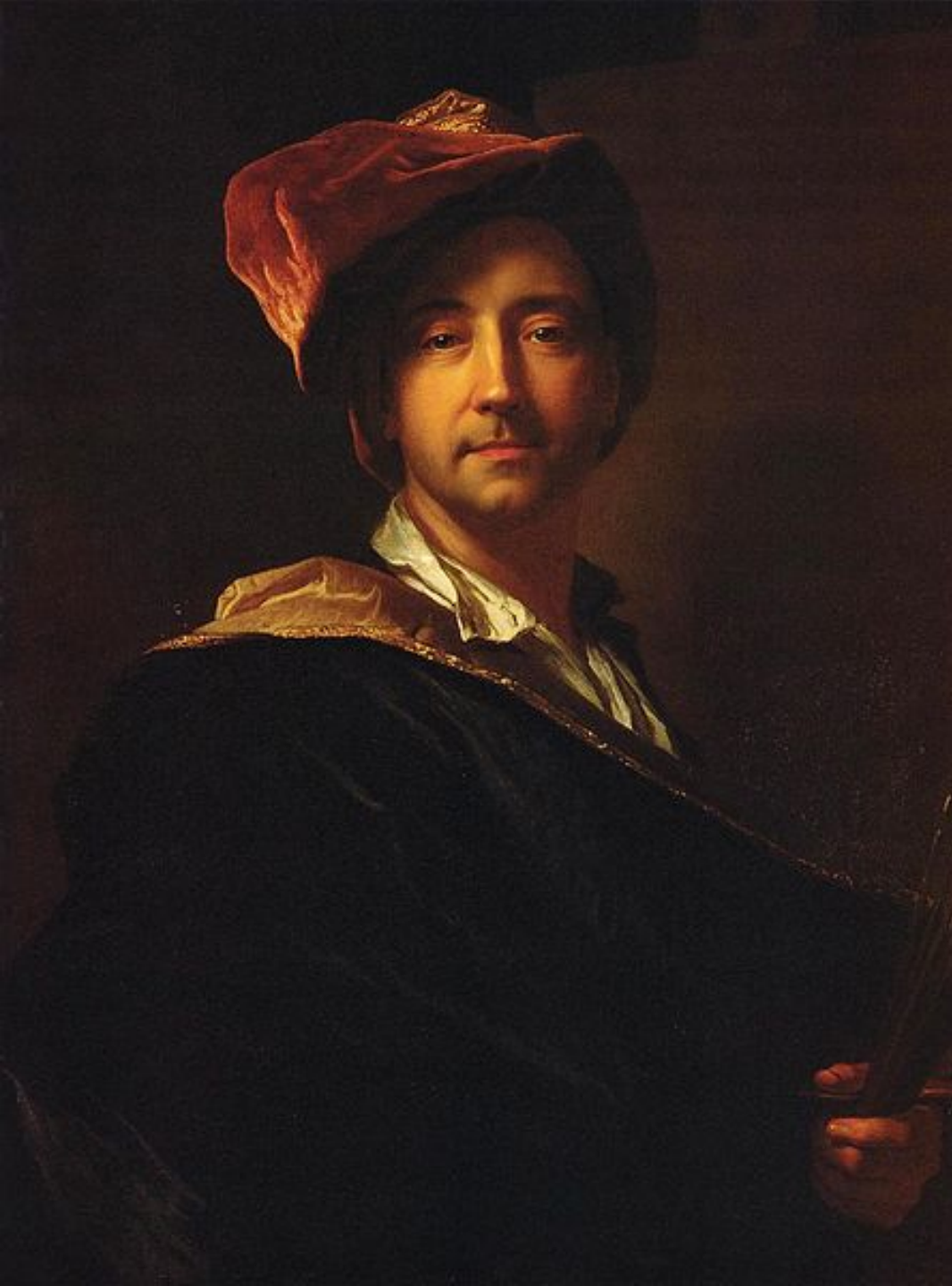
Hyacinthe Rigaud (Perpignan, 1659 – Paris, 1743), Autoportrait au turban , vers 1692, peinture à l'huile sur toile, Perpignan, musée Hyacinthe Rigaud.