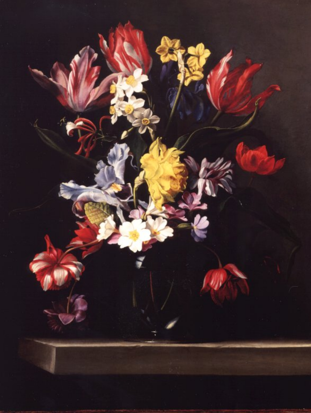
Jean-Michel Picart (Anvers, 1600 – Paris, 1682), Fleurs dans un vase de verre , vers 1660, peinture à l'huile sur cuivre, Troyes, musée des Beaux-Arts.