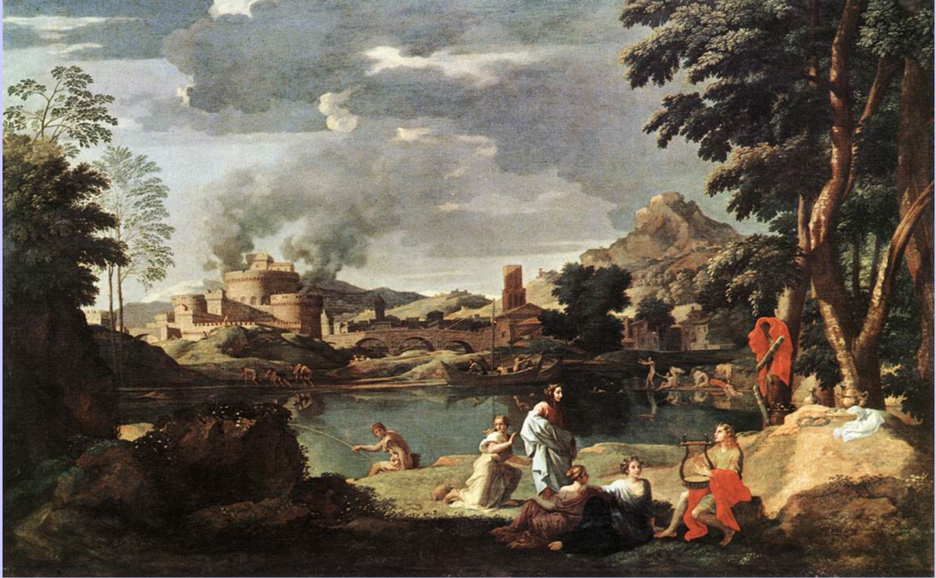
Nicolas Poussin (Les Andelys, 1594 – Rome, 1665), Paysage avec Orphée et Eurydice , 1650/3, peinture à l'huile sur toile, Paris, musée du Louvre.