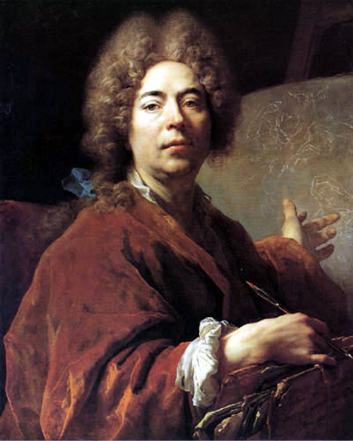
Nicolas de Largillière (Paris, 1656 – Paris, 1646), Autoportrait , 1711, peinture à l'huile sur toile, Versailles, musée national du château.