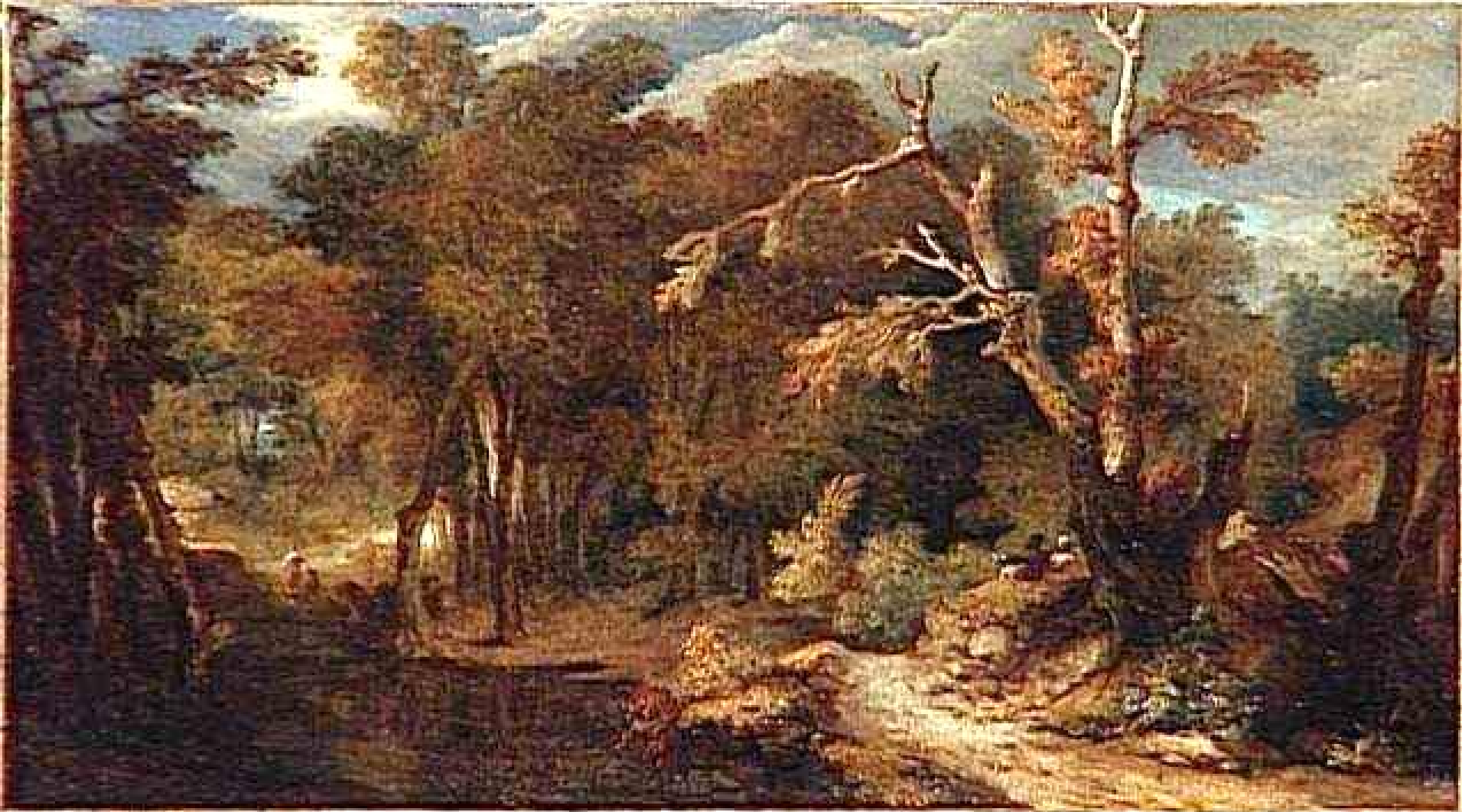
Nicolas de Largillière (Paris, 1656 – Paris, 1646), Paysage , vers 1700, peinture à l'huile sur toile, Paris, musée du Louvre.