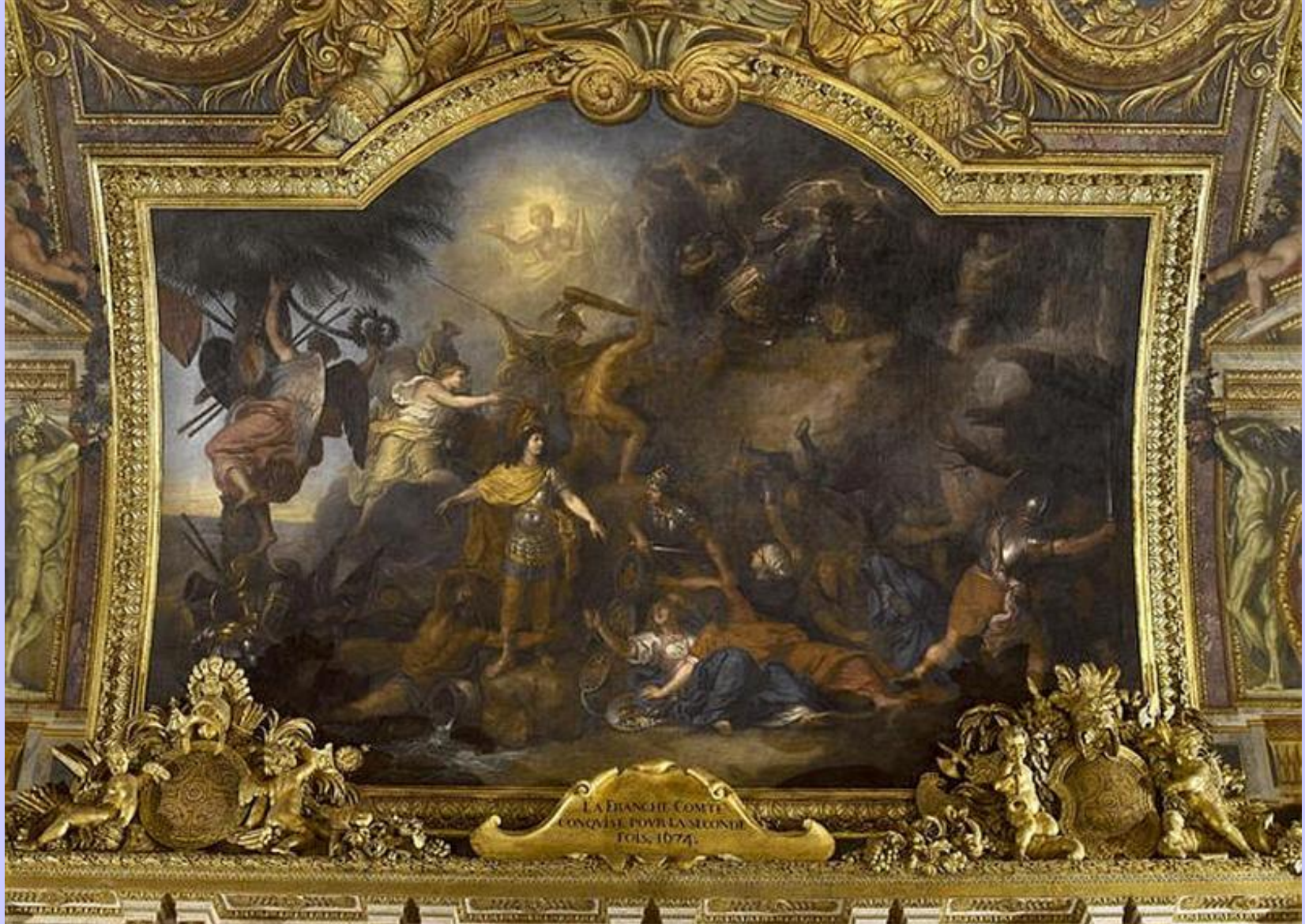
Charles Le Brun (Paris, 1619 – Paris, 1690), La Franche-Comté conquise pour la seconde fois (1674), 1678 , peinture à l'huile sur toile collée sur la voûte, Versailles, musée national du château, Galerie des glaces.