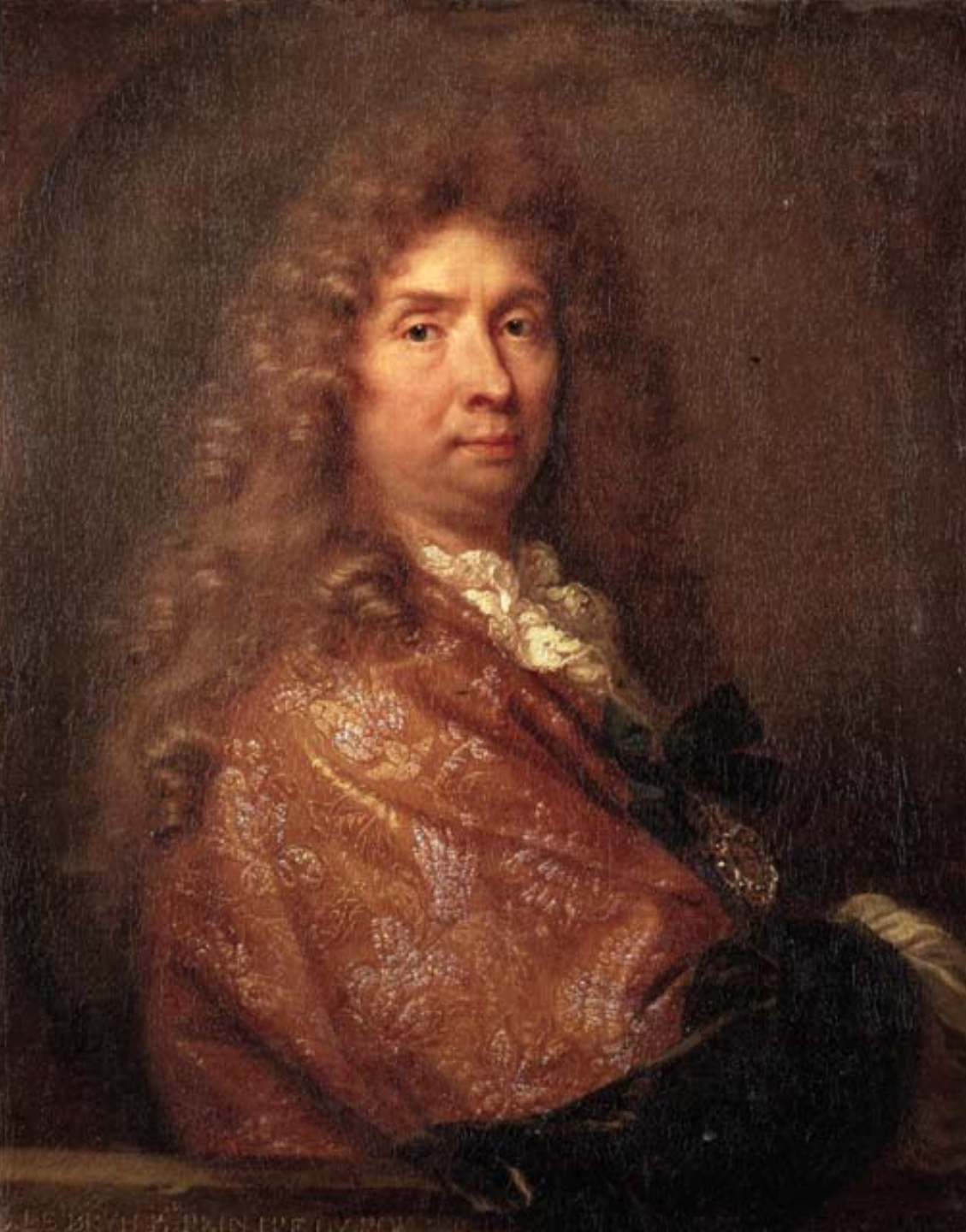
Charles Le Brun (Paris, 1619 – Paris, 1690), Autoportrait , 1684, peinture à l'huile sur toile, Florence, musée des Offices.