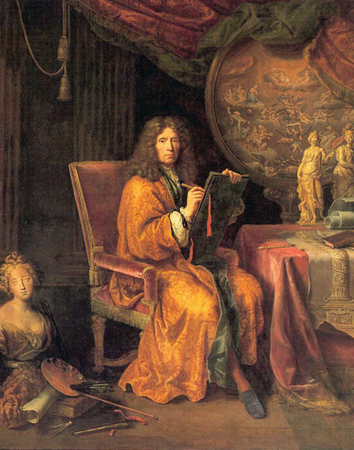
Pierre Mignard (Troyes, 1612 – Paris, 1695), Autoportrait , 1670, peinture à l'huile sur toile, Paris, musée du Louvre.