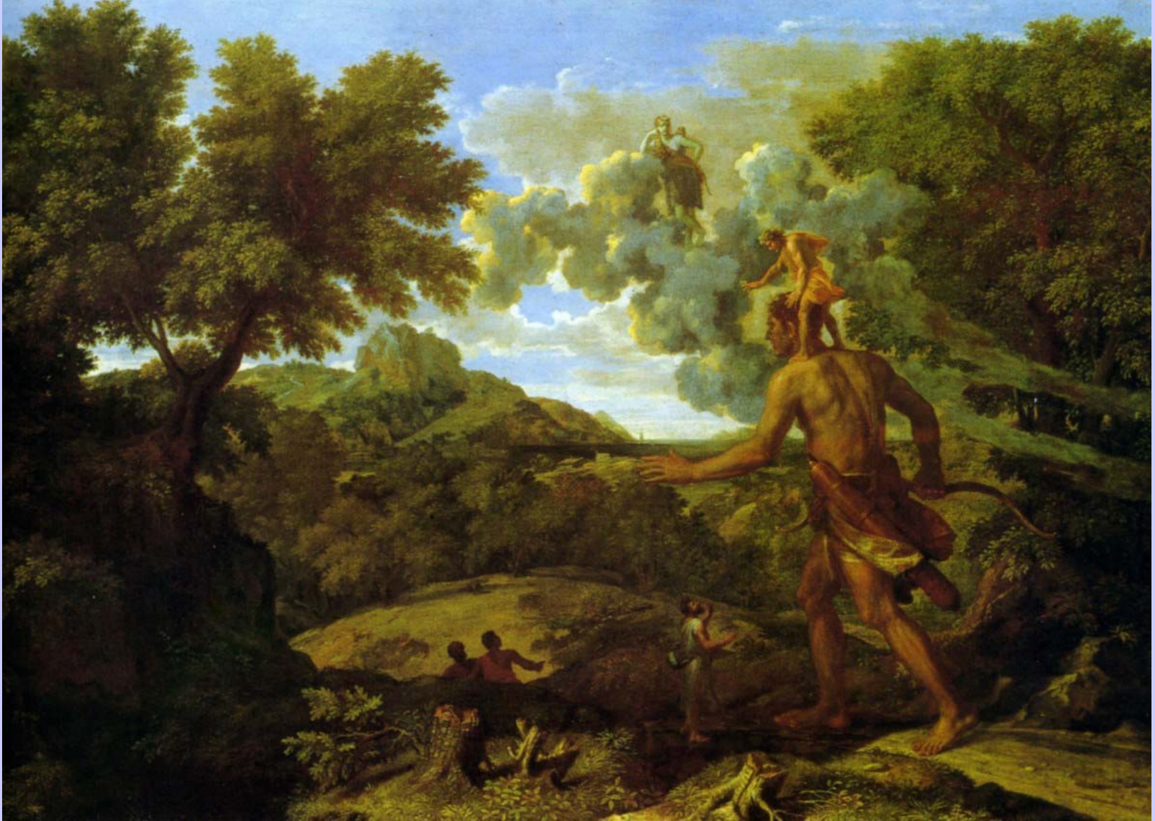
Nicolas Poussin (Les Andelys, 1594 – Rome, 1665), Paysage avec Orion et Diane , 1660/4, peinture à l'huile sur toile, New York, The Metropolitan Museum of Art.