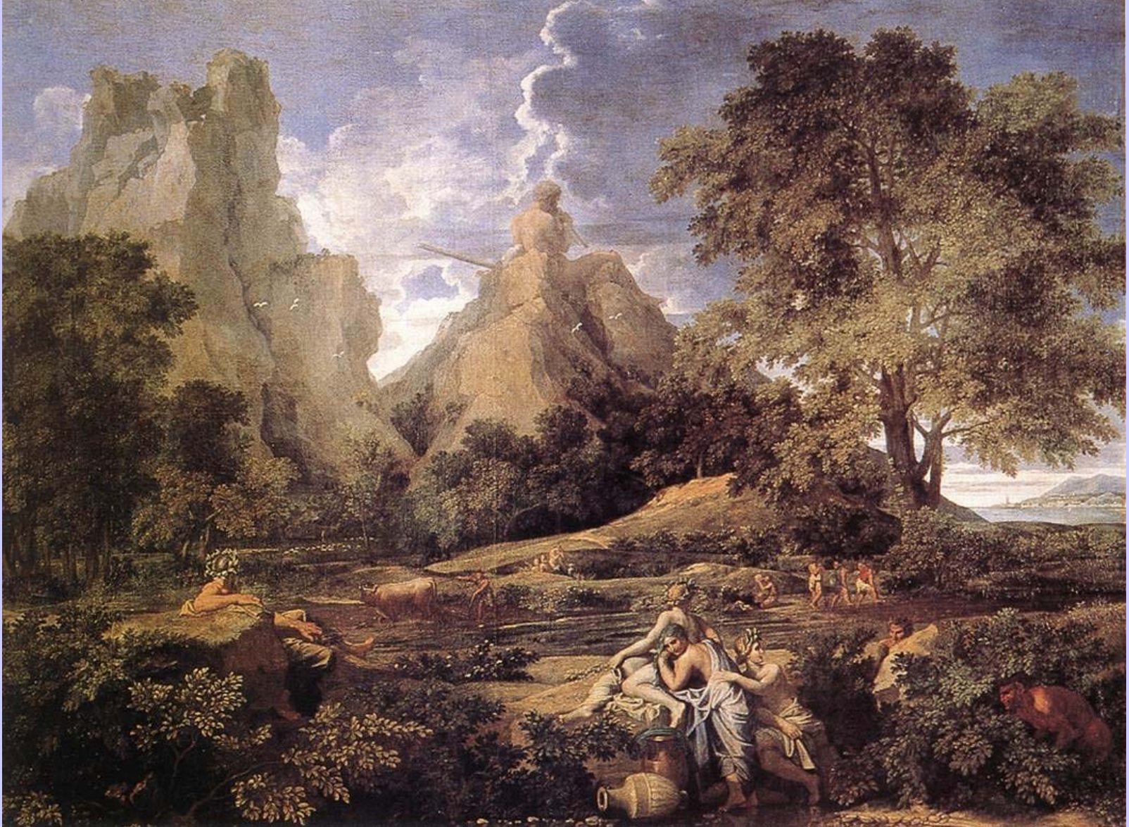
Nicolas Poussin (Les Andelys, 1594 – Rome, 1665), Paysage avec Polyphème , 1649, peinture à l'huile sur toile, Saint-Pétersbourg, musée de l'Ermitage.