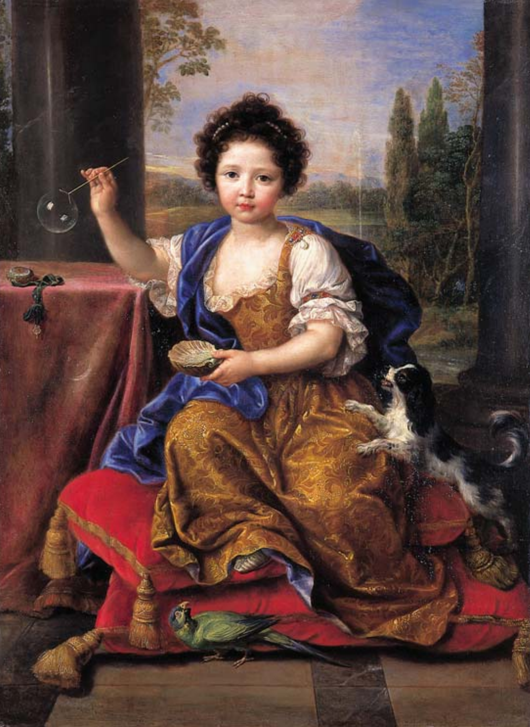
Pierre Mignard (Troyes, 1612 – Paris, 1695), Portrait de Marie-Louise de Bourbon , 1682/3, peinture à l'huile sur toile, Versailles, musée national du château