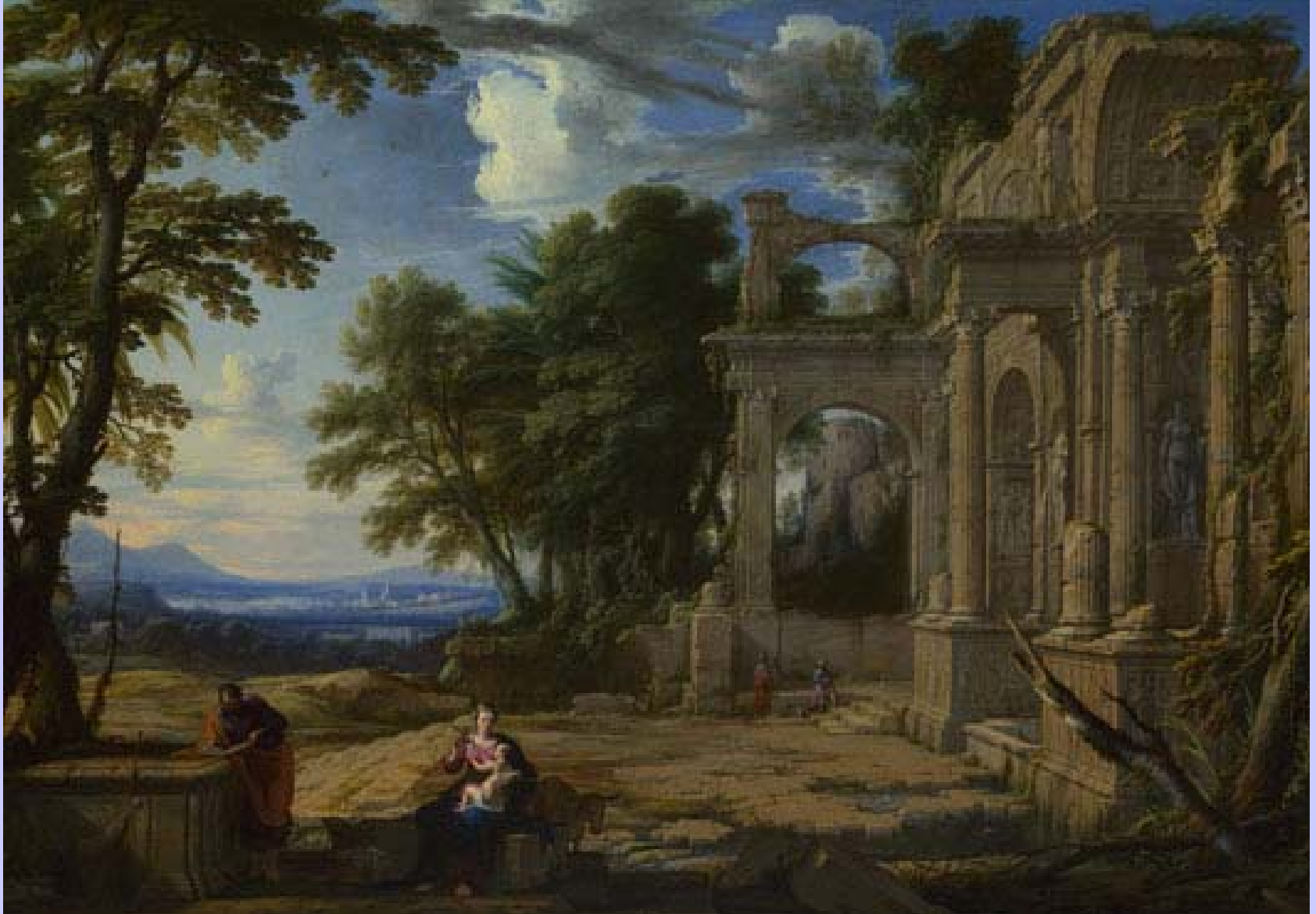
Pierre Patel (Chauny, 1604 – Paris, 1676), Paysage avec une halte pendant la fuite en Egypte , 1652, peinture à l'huile sur toile, Londres, The National Gallery.