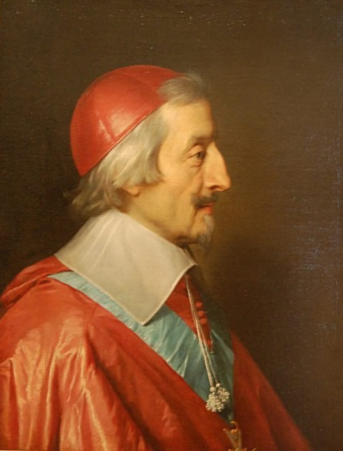
Philippe de Champaigne (Bruxelles, 1602 – Paris, 1674), Portrait du cardinal de Richelieu , vers 1642, peinture à l'huile sur toile, Strasbourg, musée des Beaux-Arts.