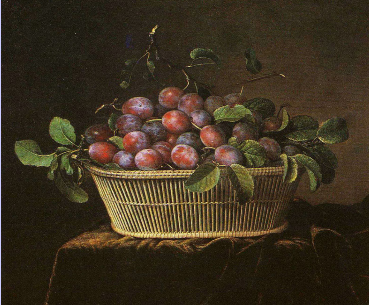
Pierre Dupuis (Montfort-l'Amaury, 1610 – Paris, 1682), Panier de prunes , vers 1640, peinture à l'huile sur toile, La Fère, musée Jeanne d'Aboville.