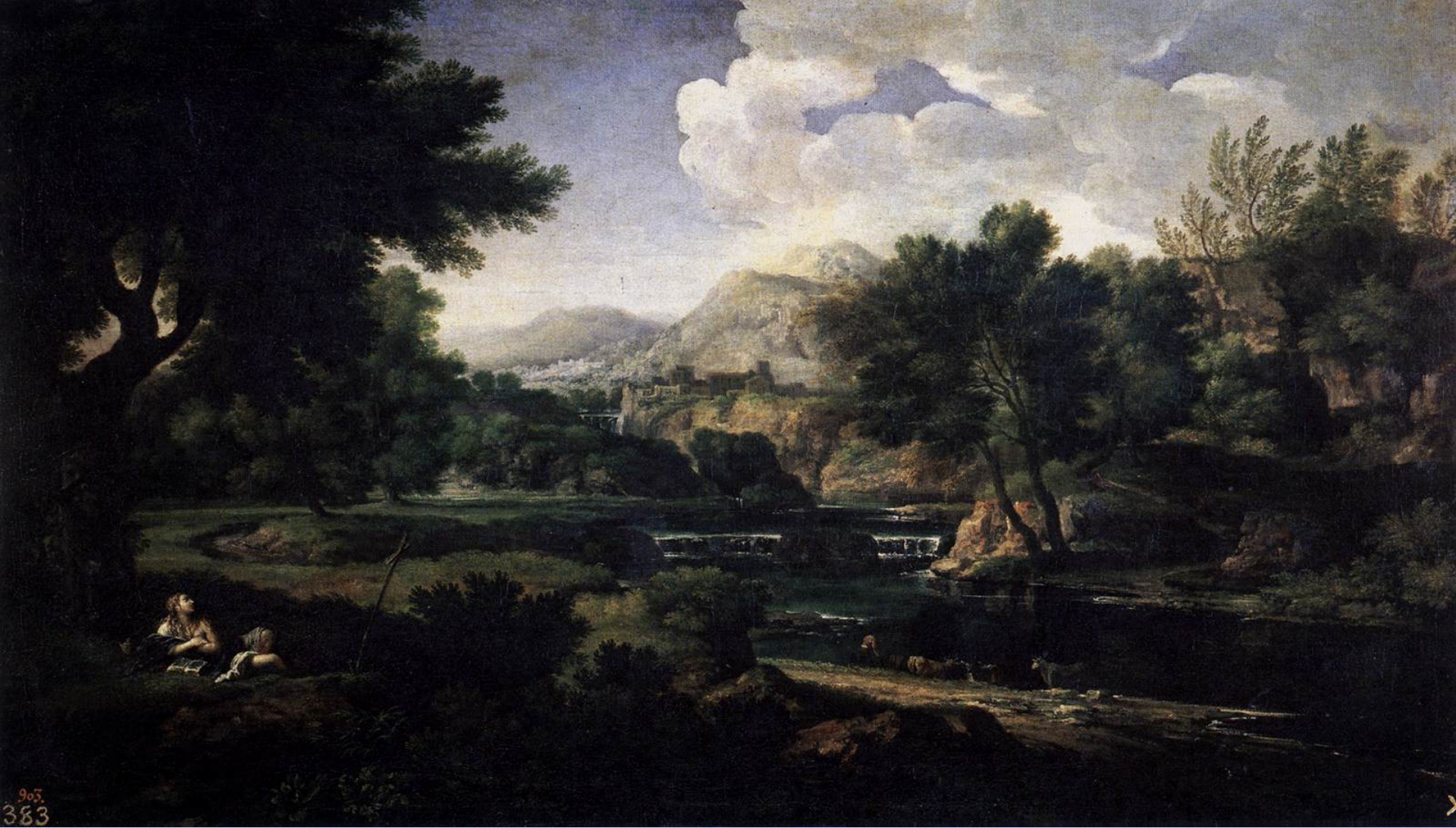
Gaspard Dughet (Rome, 1615 – Rome, 1675), Paysage avec Marie Madeleine adorant la croix , vers 1660/5, peinture à l'huile sur toile, Madrid, musée du Prado.