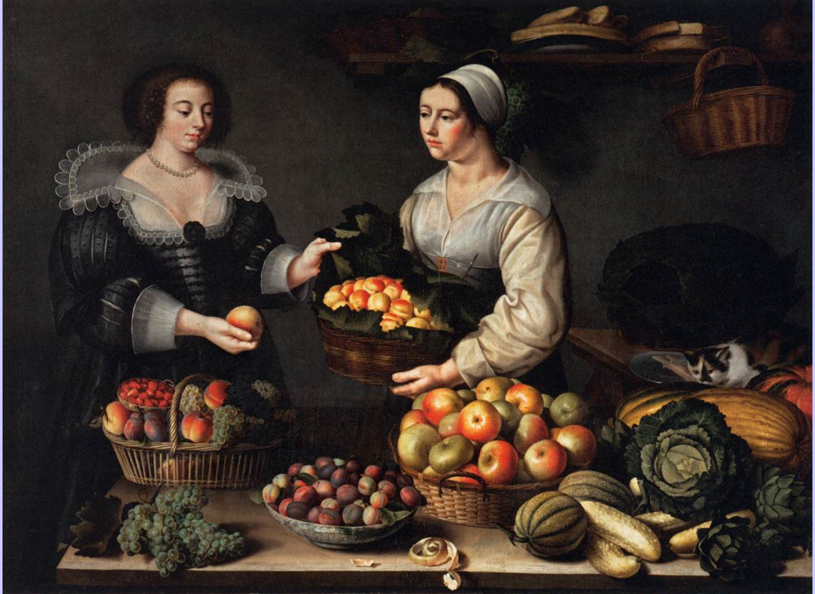
Louise Moillon (Paris, 1610 – Paris, 1696), Marchande de fruits et de légumes , 1630, peinture à l'huile sur toile, Paris, musée du Louvre.