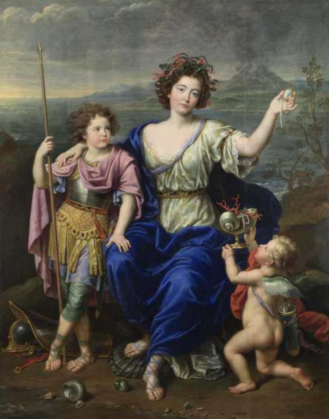
Pierre Mignard (Troyes, 1612 – Paris, 1695), Portrait de la marquise de Seignelay en Thétis, avec ses deux fils, en Achille et Cupidon , 1691, peinture à l'huile sur toile, Londres, National Gallery.