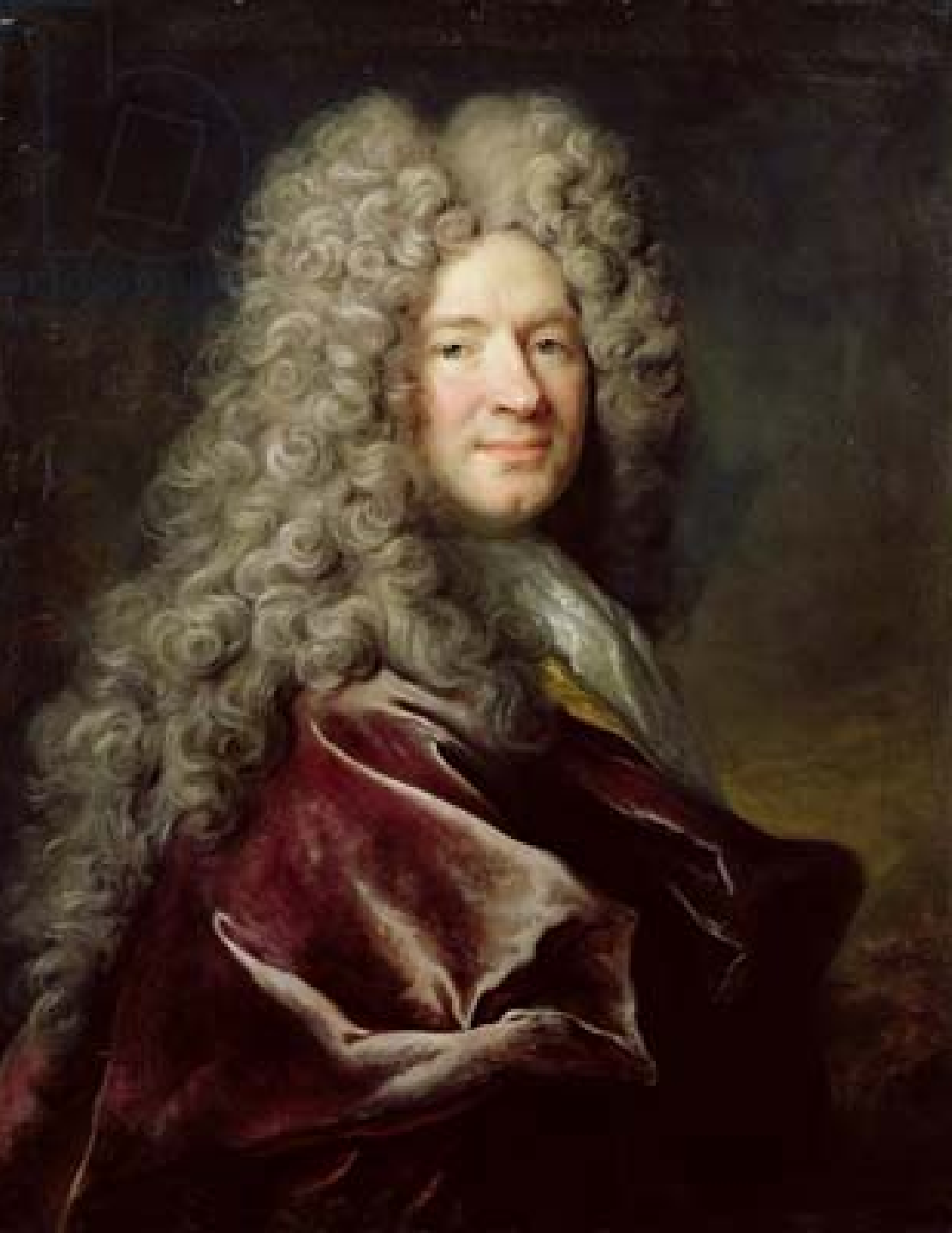
Nicolas de Largillière (Paris, 1656 – Paris, 1646), Portrait d'homme , vers 1700, peinture à l'huile sur toile, Kassel, Gemäldegalerie, Alte Meister.