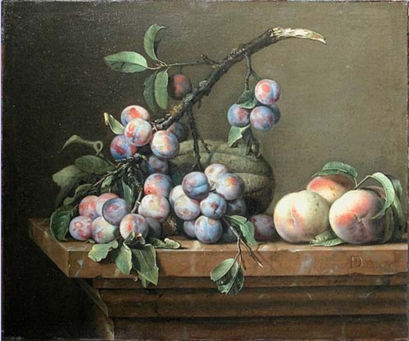
Pierre Dupuis (Montfort-l'Amaury, 1610 – Paris, 1682), Prunes, courge et pêches , 1650, peinture à l'huile sur toile, Paris, musée du Louvre.