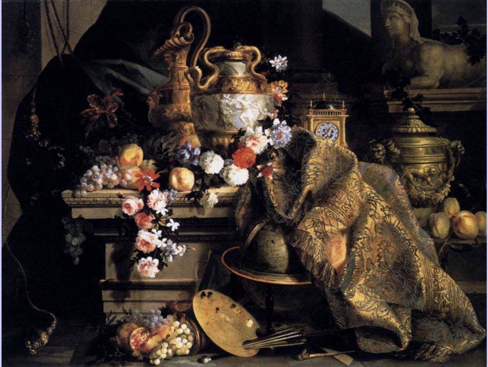
Jean-Baptiste Monnoyer (Lille, 1636 – Londres, 1699), Nature morte avec fleurs et fruits , 1665, peinture à l'huile sur toile, Montpellier, musée Fabre.