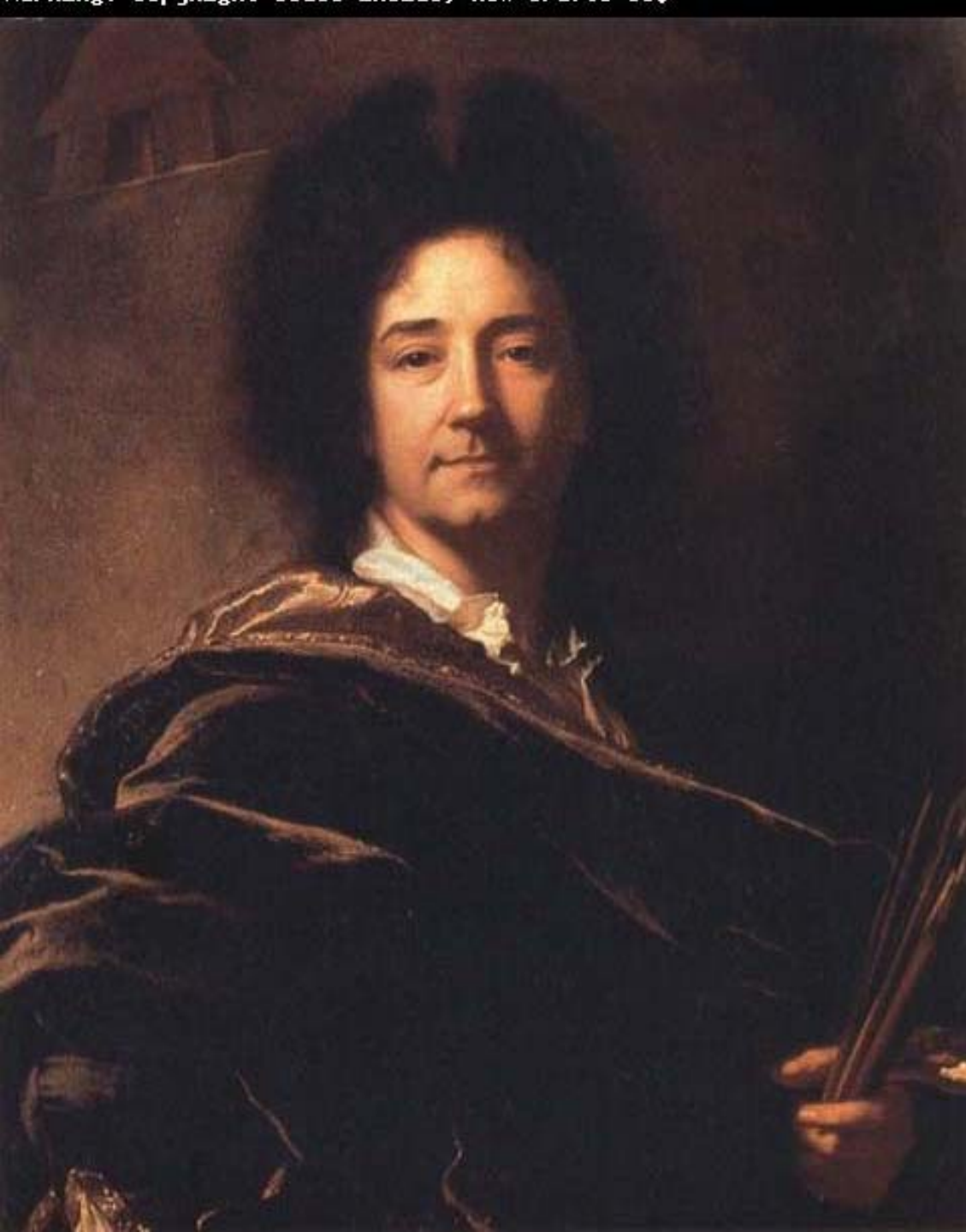
Hyacinthe Rigaud (Perpignan, 1659 – Paris, 1743), Autoportrait , 1716, peinture à l'huile sur toile, Florence, musée des Offices.