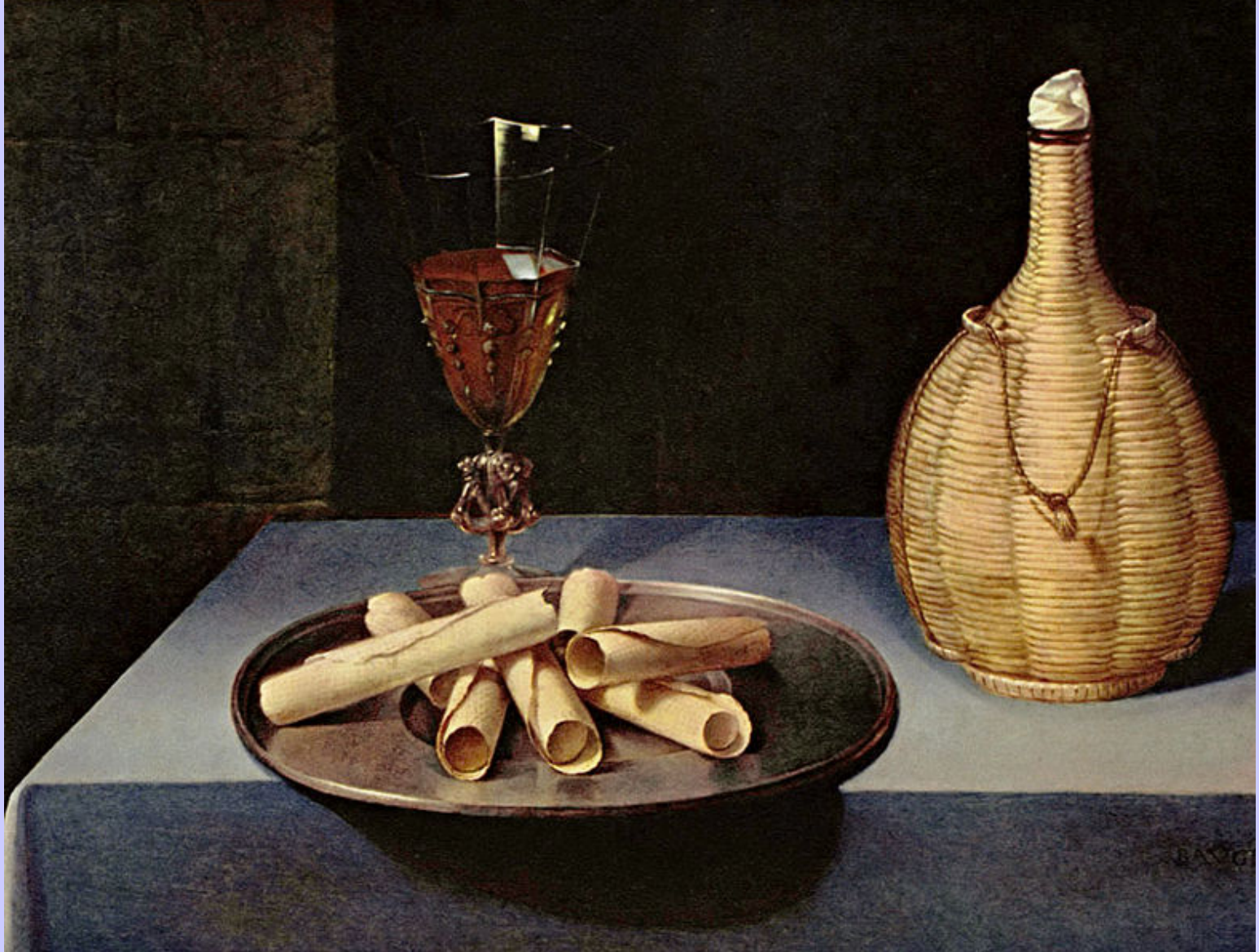
Lubin Baugin (Pithiviers, 1612 – Paris, 1663), Nature morte aux gaufrettes , vers 1630, peinture à l'huile sur bois, Paris, musée du Louvre.