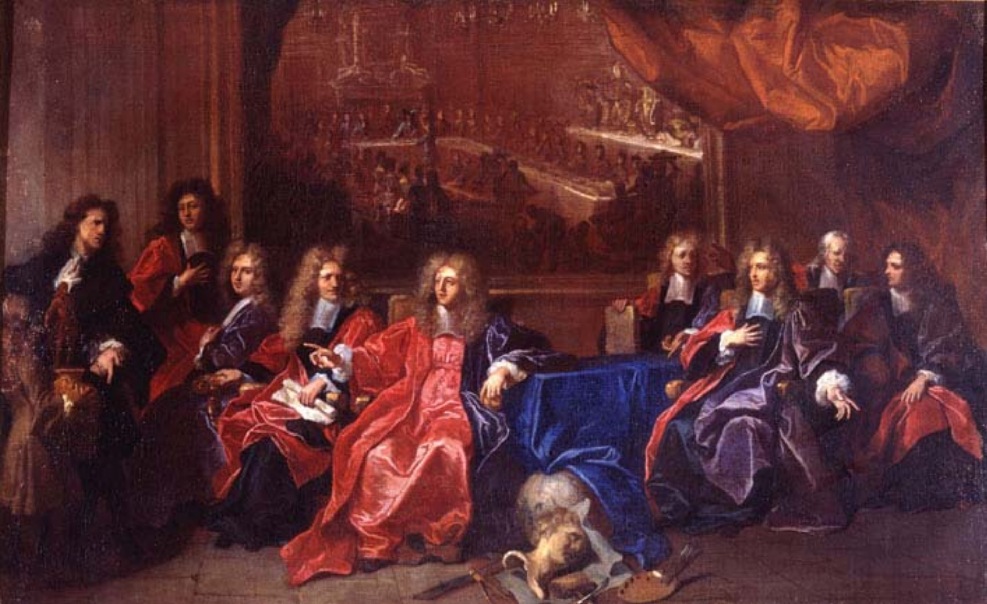
Hyacinthe Rigaud (Perpignan, 1659 – Paris, 1743), Le Prévôt et les échevins de Paris délibérant de la commémoration du dîner offert à Louis XIV à l'Hôtel-de-Ville après sa guérison de 1687, 1689, peinture à l'huile sur toile, Amiens, musée de Picardie.