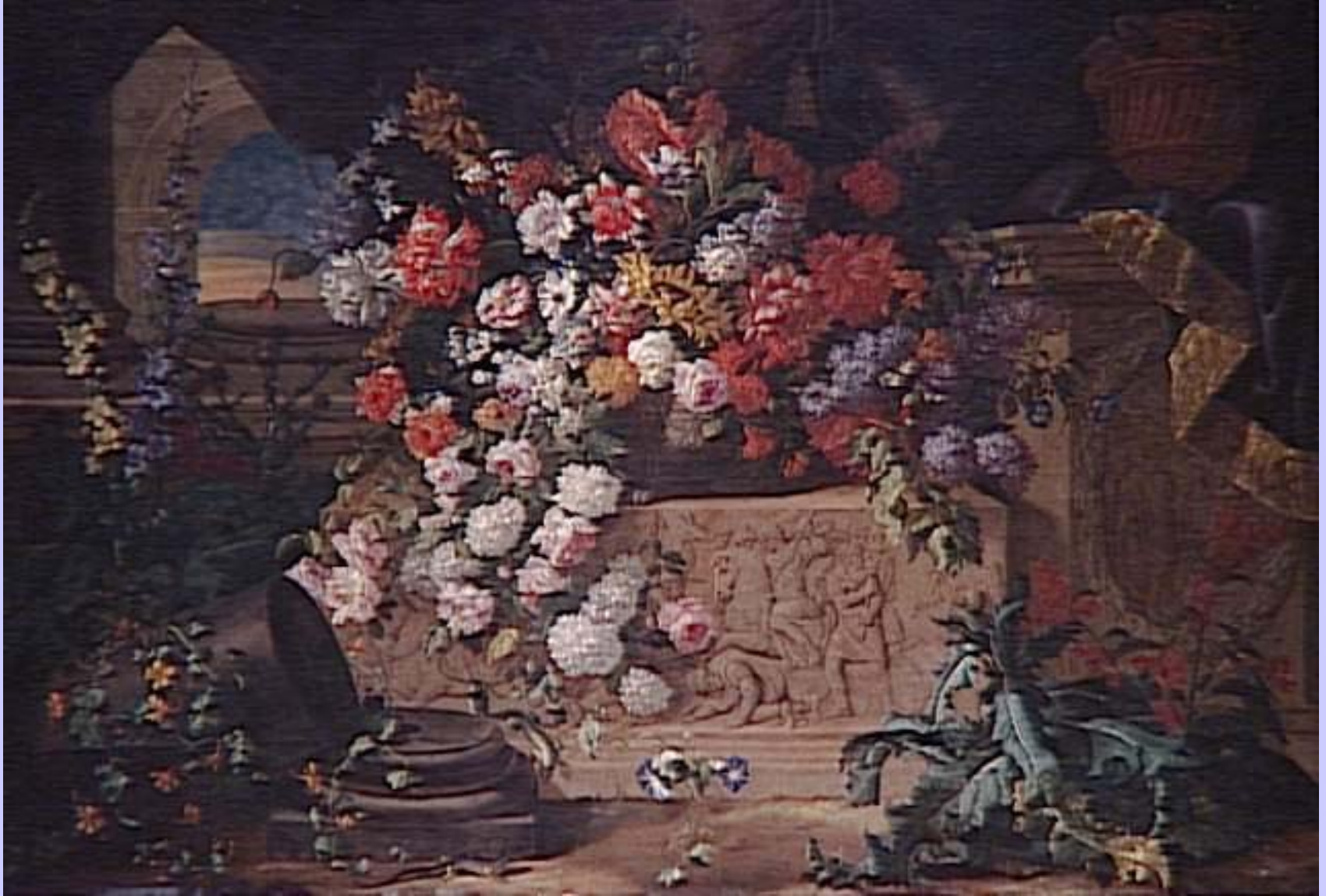
Jean-Baptiste Belin de Fontenay (Caen, 1653 – Paris, 1615), Fleurs et bas-relief antique , vers 1680, peinture à l'huile sur toile, Lille, musée des Beaux-Arts.