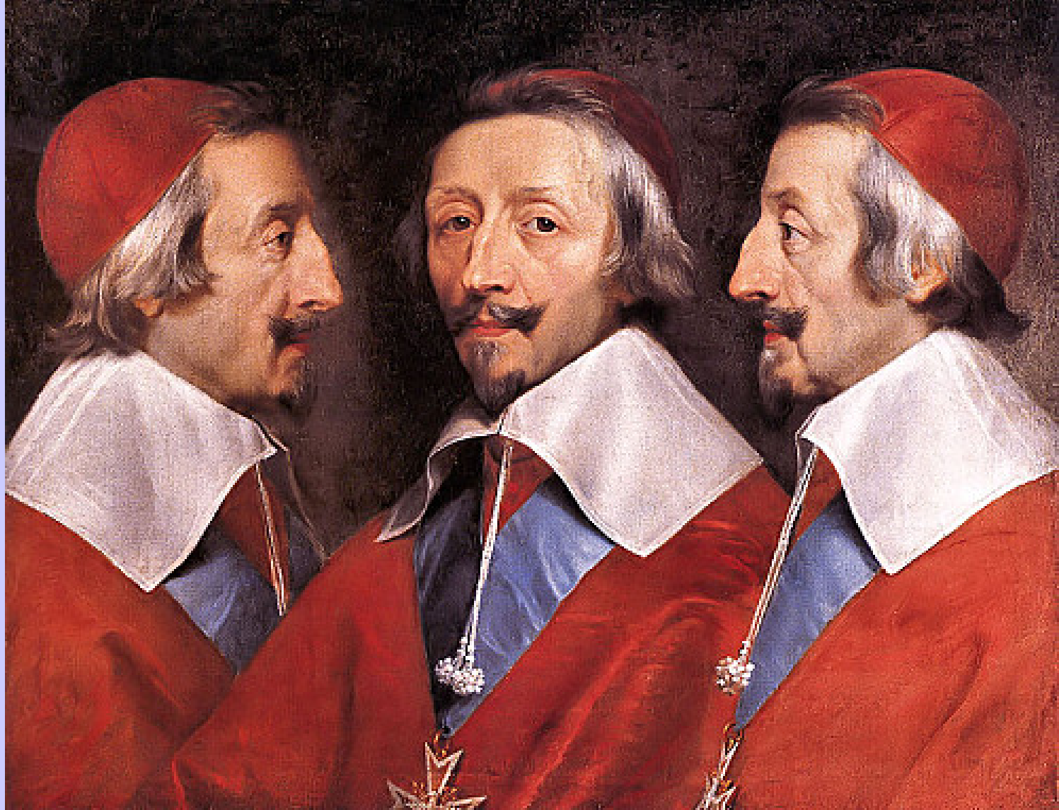
Philippe de Champaigne (Bruxelles, 1602 – Paris, 1674), Triple portrait du cardinal de Richelieu , vers 1642, peinture à l'huile sur toile, Londres, National Gallery.