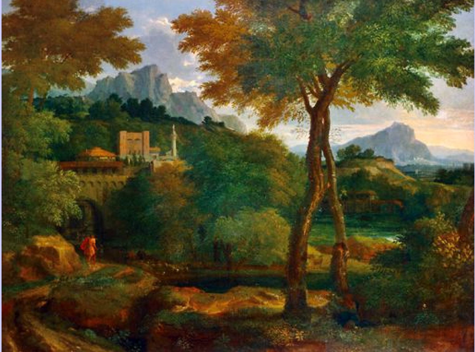
Francisque Millet (Anvers, 1642 – Paris, 1679), Paysage , vers 1670, peinture à l'huile sur toile, Oxford, The Ashmolean Museum.