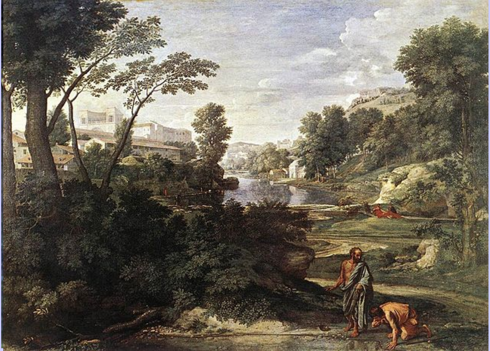
Nicolas Poussin (Les Andelys, 1594 – Rome, 1665), Paysage avec Diogène brisant son écuelle , 1648, peinture à l'huile sur toile, Paris, musée du Louvre.