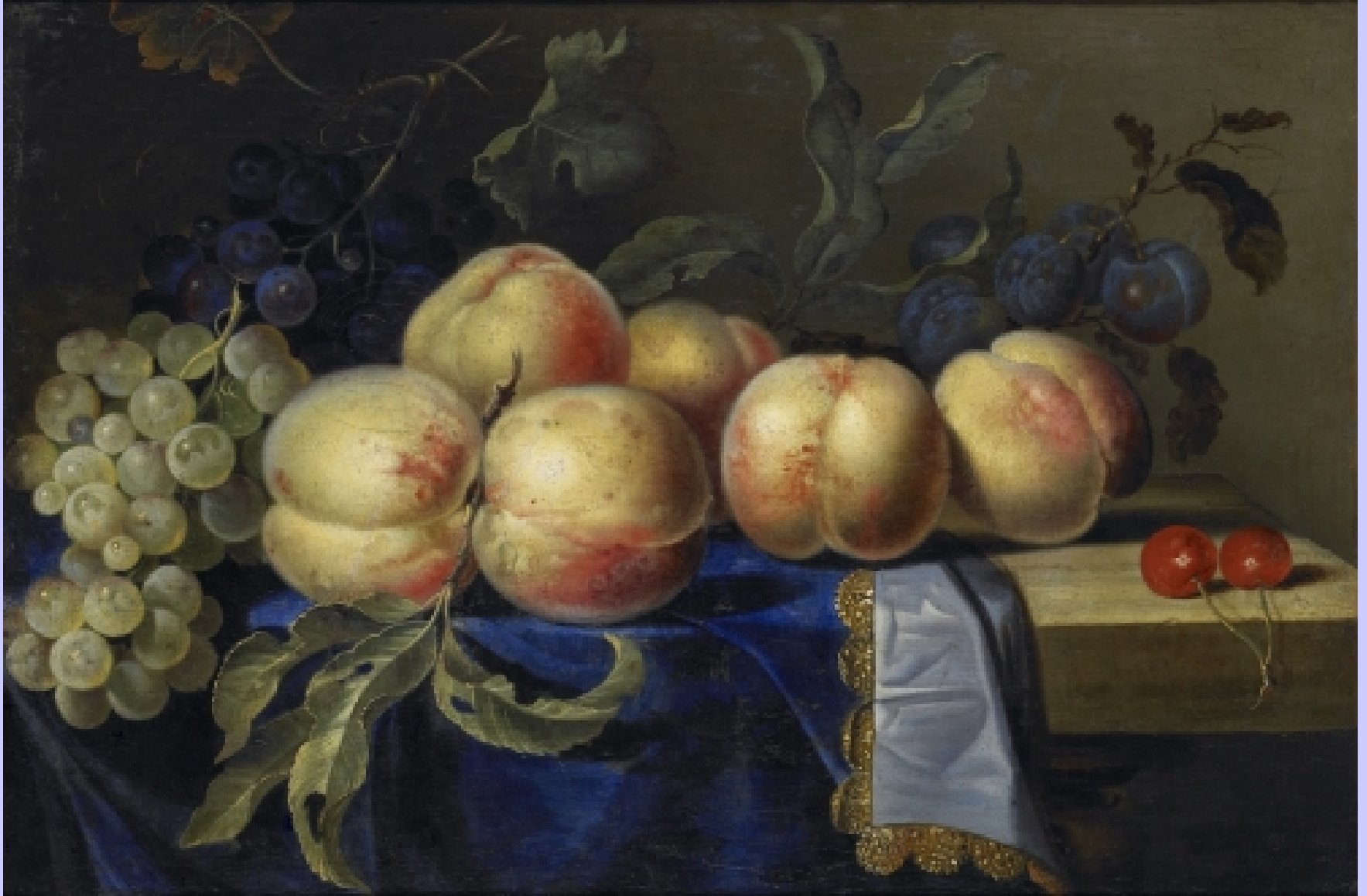
Paul Liégeois (actif à Paris au milieu du XVIIe s.), Nature morte , vers 1660, peinture à l'huile sur toile, Rouen, musée des Beaux-Arts.