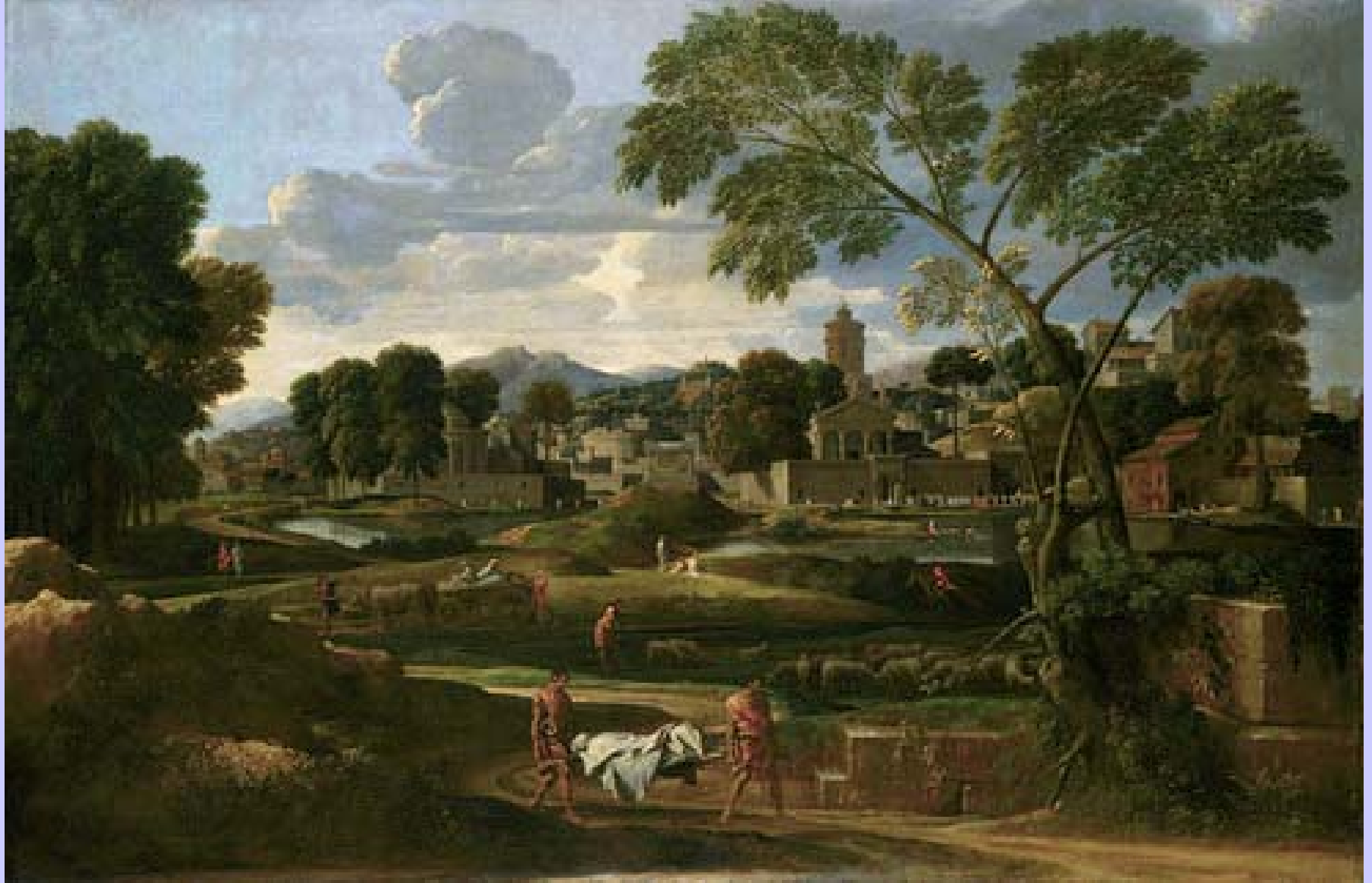
Nicolas Poussin (Les Andelys, 1594 – Rome, 1665), Paysage avec les funérailles de Phocion , 1648, peinture à l'huile sur toile, Cardiff, National Museum of Wales.