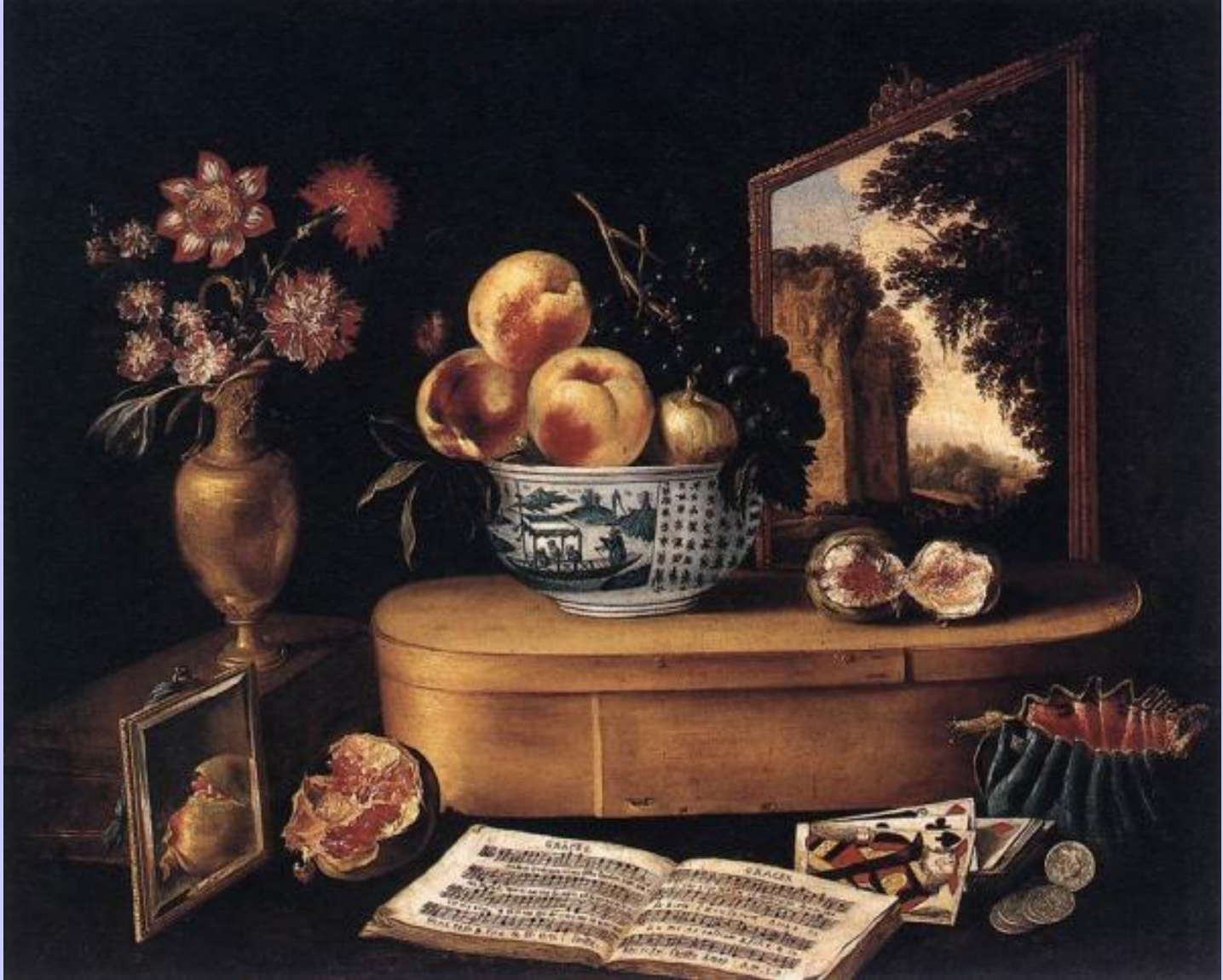
Jacques Linard (Troyes, 1597 – Paris, 1645), Nature morte , vers 1638, peinture à l'huile sur toile, Strasbourg, musée des Beaux-Arts.