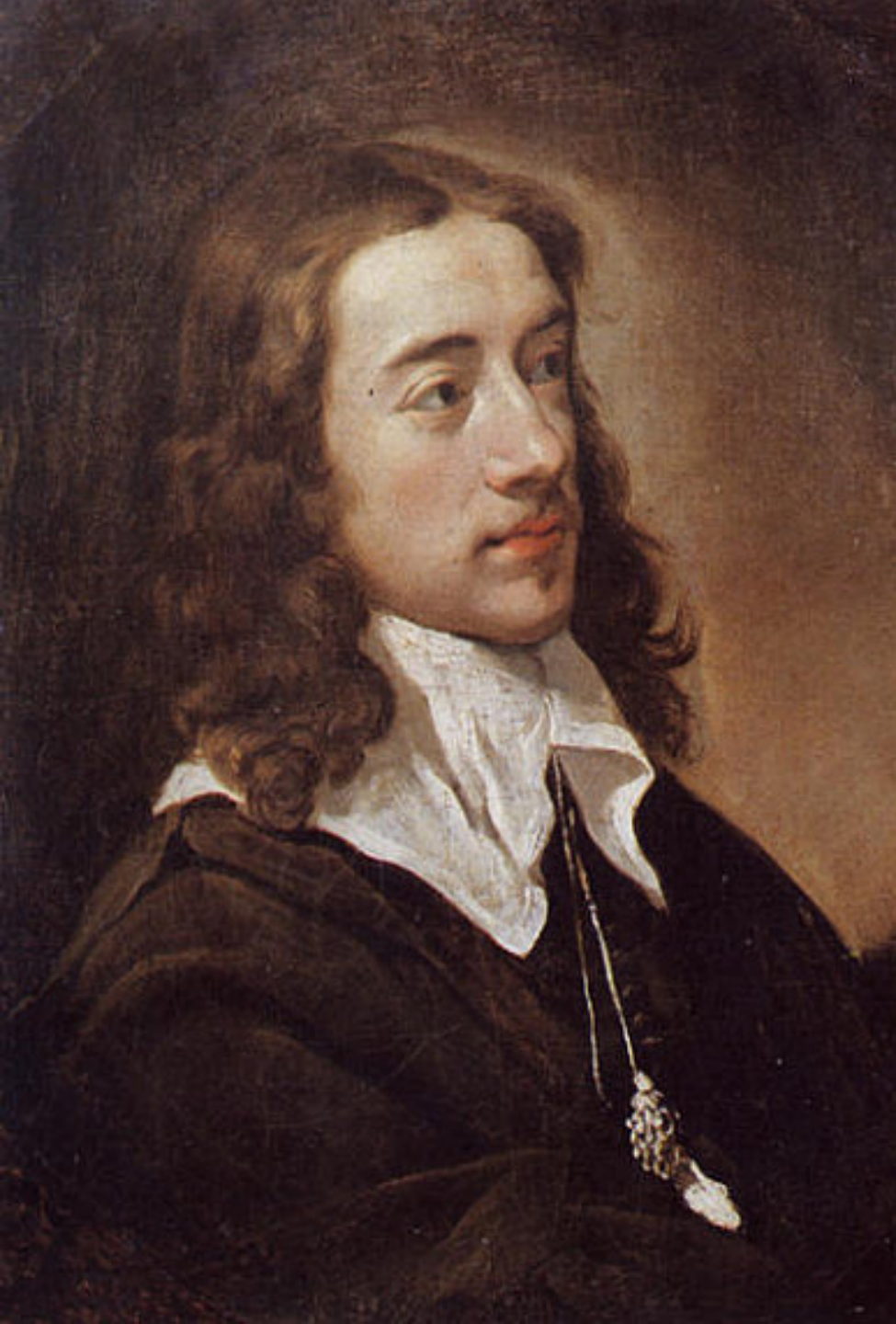
Charles Le Brun (Paris, 1619 – Paris, 1690), Portrait de Louis Testelin , vers 1650, peinture à l'huile sur toile, Paris, musée du Louvre.