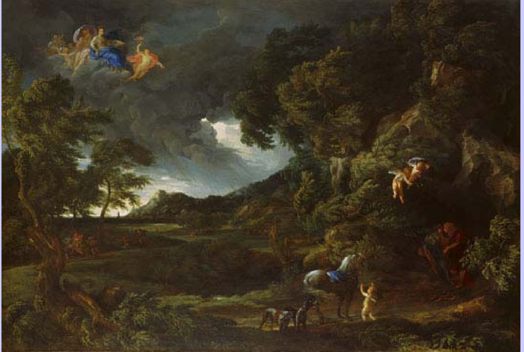
Gaspard Dughet (Rome, 1615 – Rome, 1675) et Carlo Maratta (Camerano, 1625 – Rome, 1713), Paysage avec l'union de Didon et Enée , vers 1664, peinture à l'huile sur toile, Londres, The National Gallery.