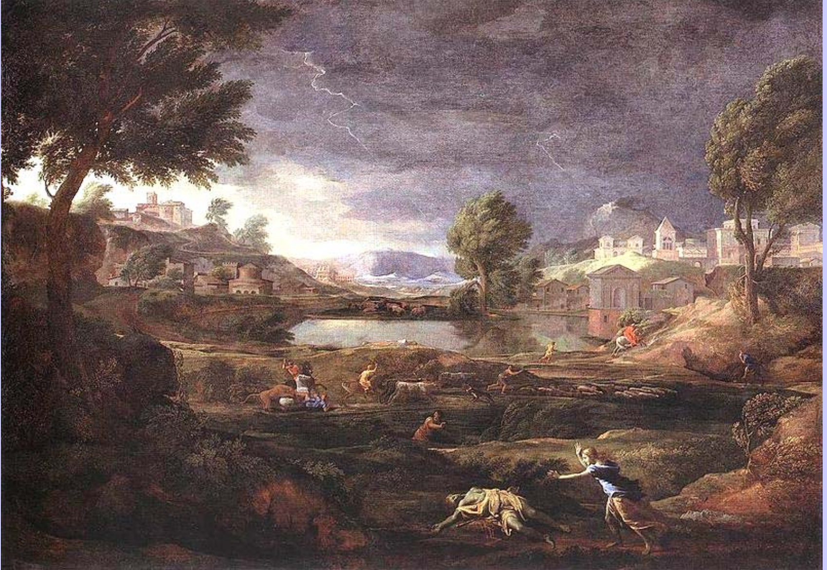
Nicolas Poussin (Les Andelys, 1594 – Rome, 1665), Paysage avec Pyrame et Thisbé , vers 1640, peinture à l'huile sur toile, Francfort, Städel Museum.