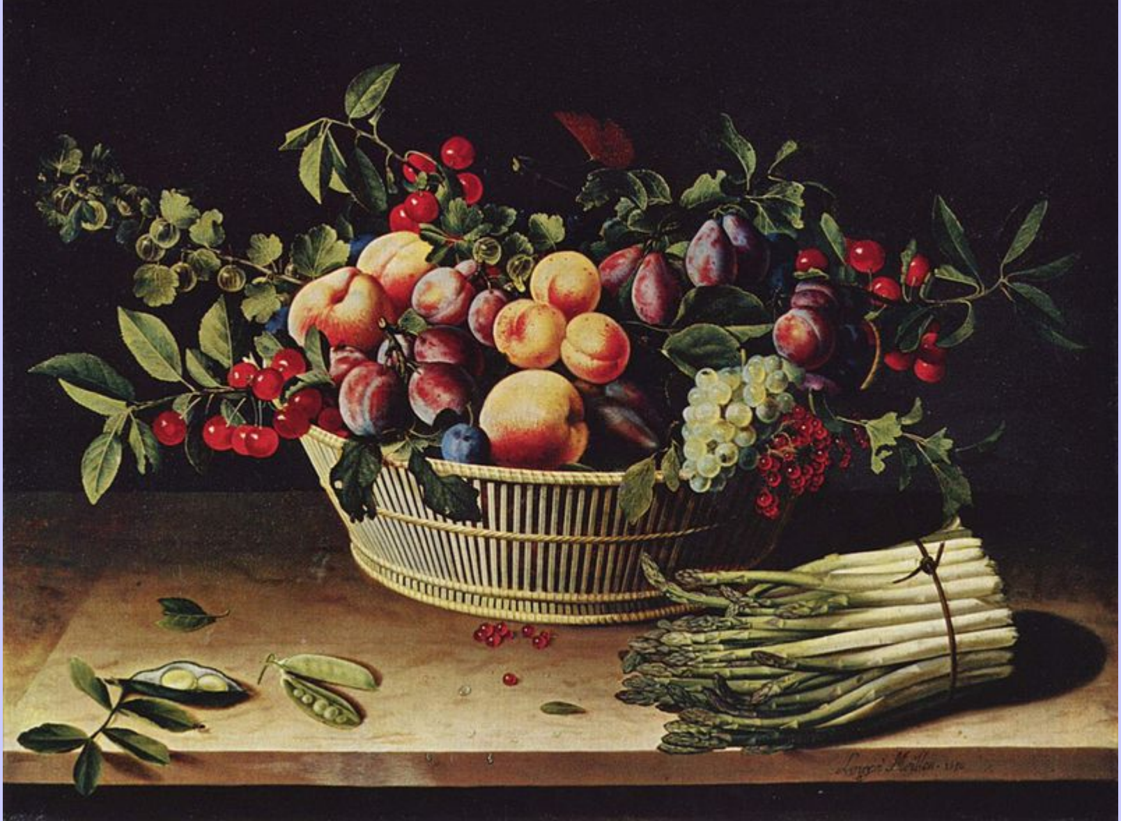
Louise Moillon (Paris, 1610 – Paris, 1696), Nature morte à la corbeille de fruits , 1630, peinture à l'huile sur toile, Chicago, The Art Institute.