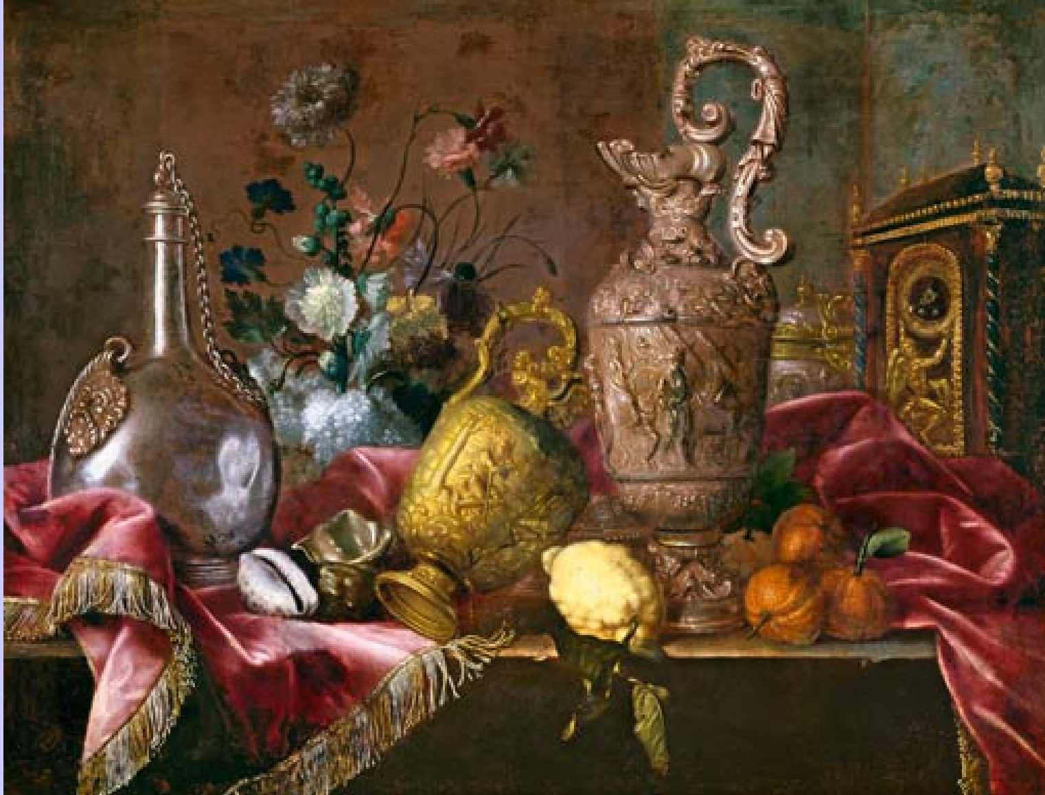
Meiffren Conte (Marseille, vers 1630 – Marseille, 1705), Nature morte , vers 1660/70, peinture à l'huile sur toile, Valenciennes, musée des Beaux-Arts.