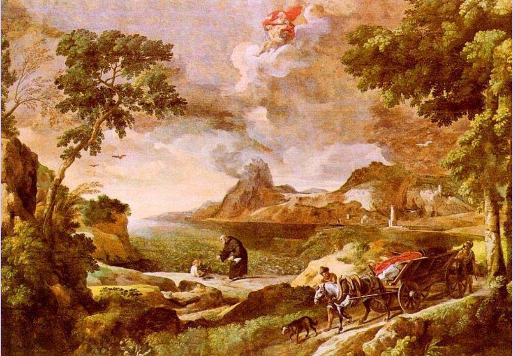
Gaspard Dughet (Rome, 1615 – Rome, 1675), Paysage avec saint Augustin découvrant le mystère de la sainte Trinité , 1651/3, peinture à l'huile sur toile, Rome, Galerie Doria Phamphilj.