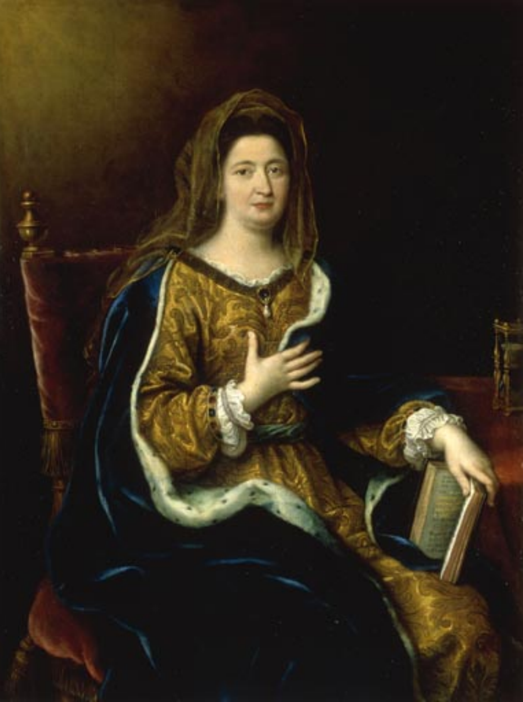
Pierre Mignard (Troyes, 1612 – Paris, 1695), Portrait de Madame de Maintenon (Françoise d'Aubigné) en sainte Françoise Romaine , 1694, peinture à l'huile sur toile, Versailles, musée national du château