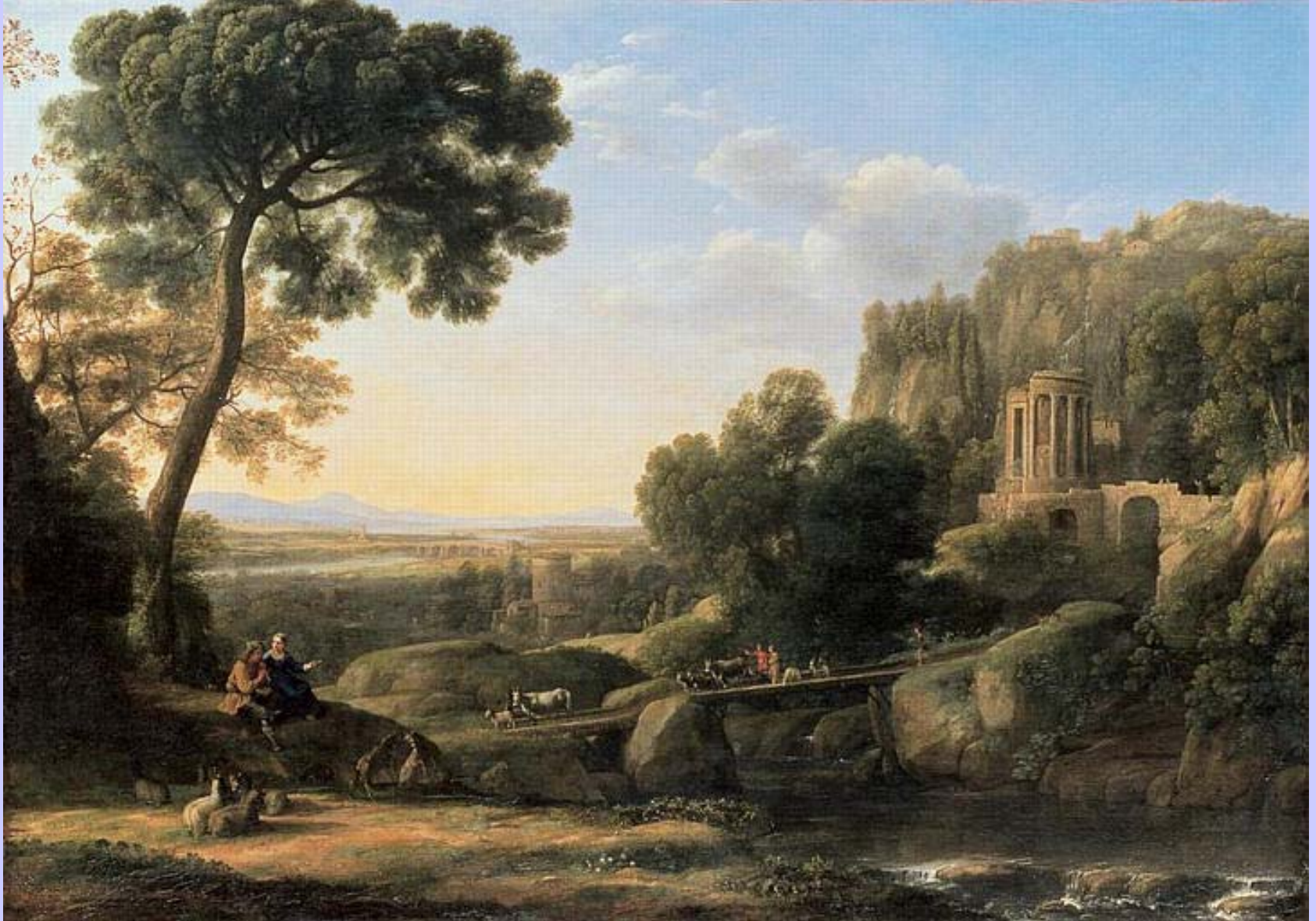
Claude Gellée, dit Le Lorrain (Chamagne, vers 1600 – Rome, 1682), Paysage pastoral avec le temple de la Sybille à Tivoli , vers 1644, peinture à l'huile sur toile, Grenoble, musée.