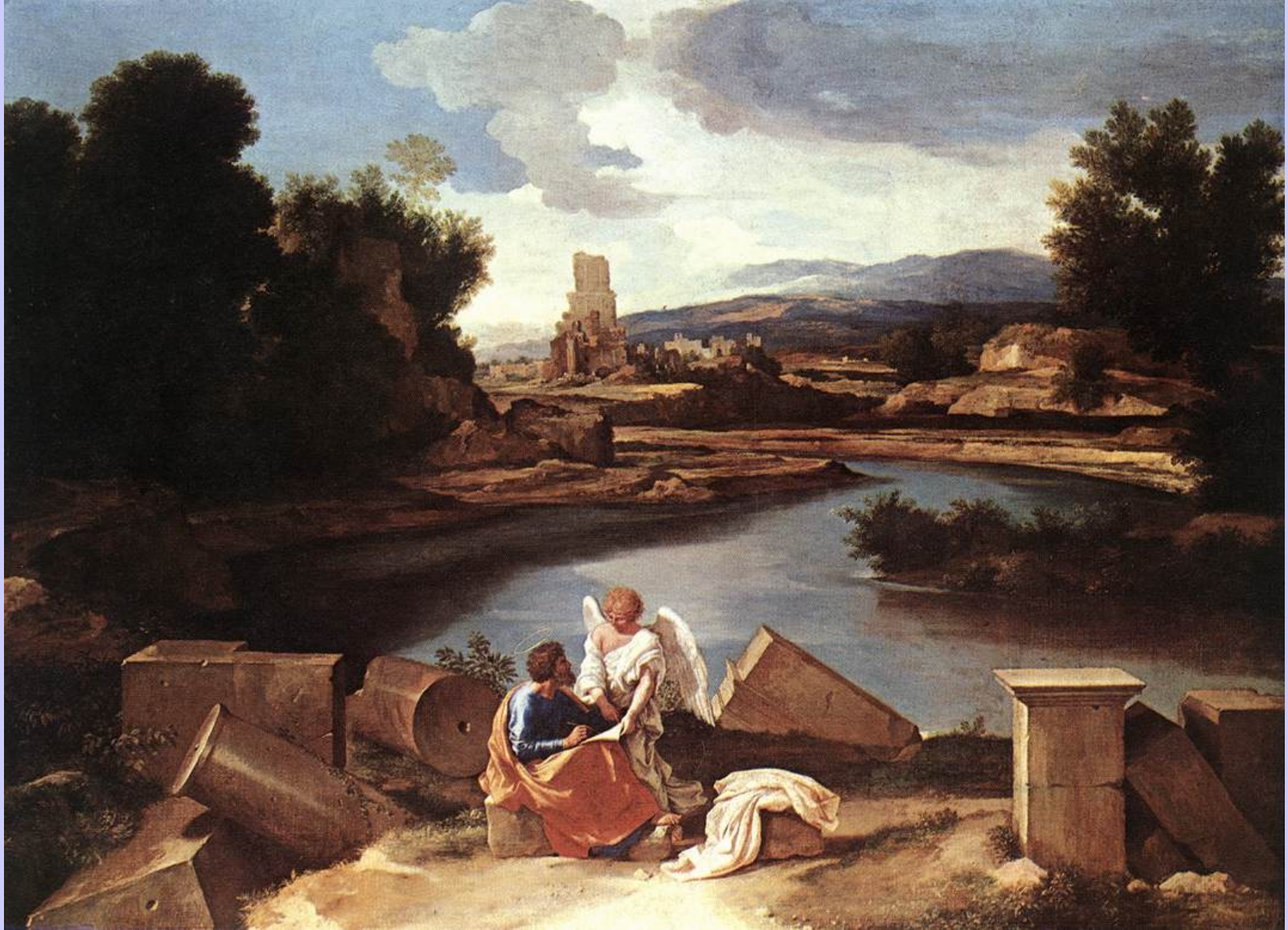
Nicolas Poussin (Les Andelys, 1594 – Rome, 1665), Paysage avec saint Matthieu et l'ange , vers 1640, peinture à l'huile sur toile, Berlin, Staatliche Museen.