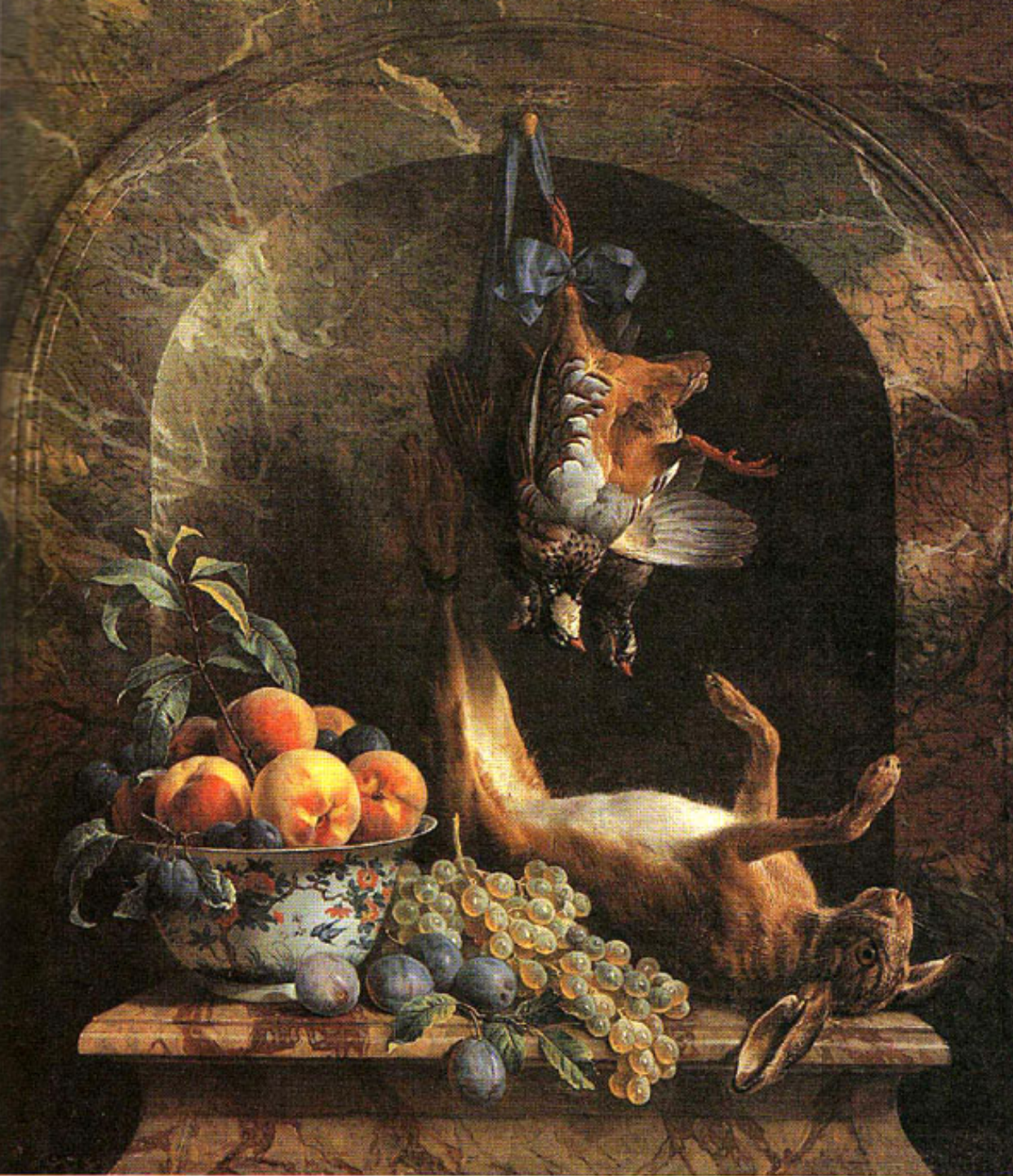
Jean-François Desportes (Champigneulle, 1661 - Paris, 1743), Nature morte aux fruits et au gibier , vers 1710, peinture à l'huile sur toile, Le Havre, musée André Malraux.