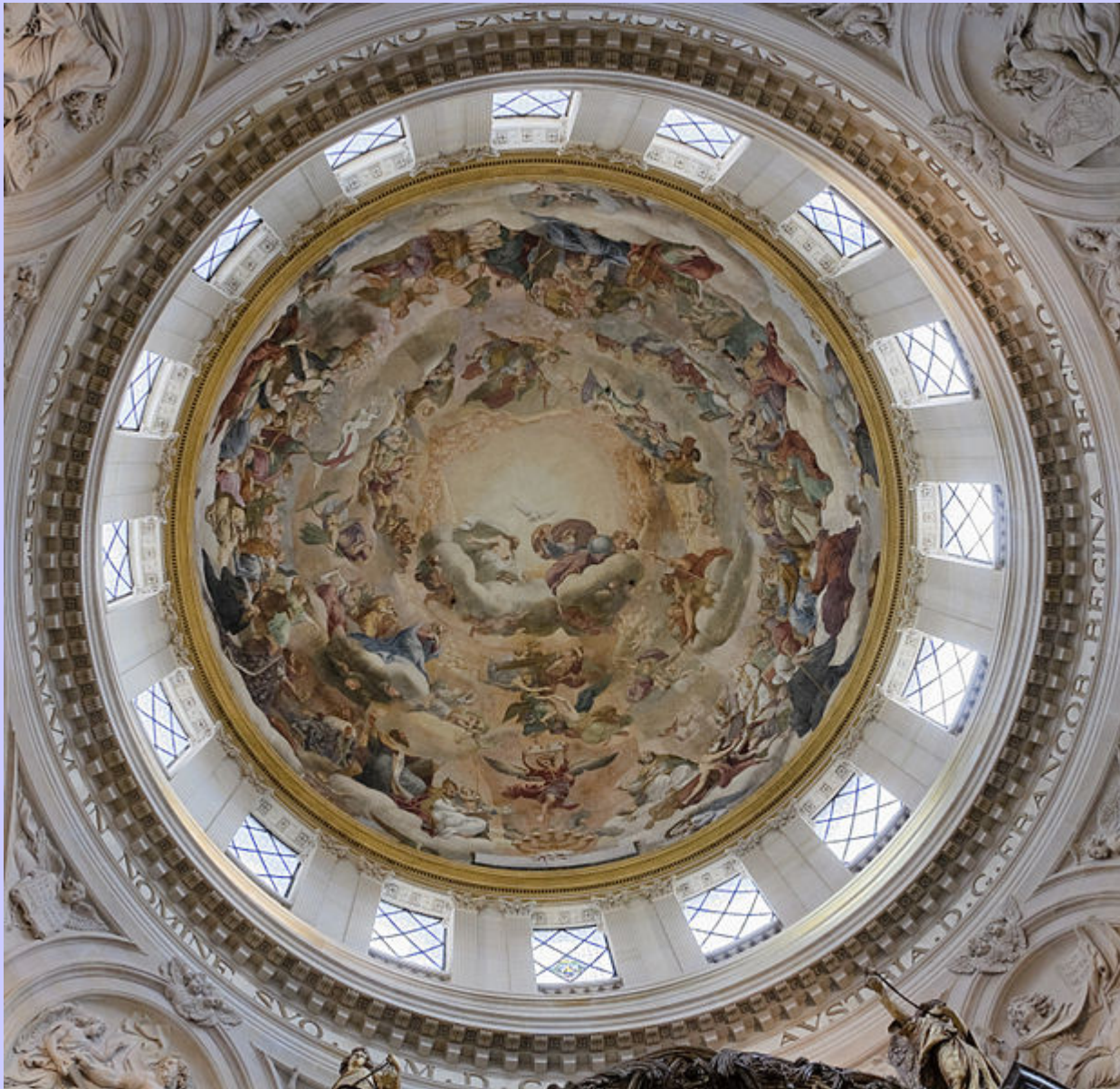
Pierre Mignard (Troyes, 1612 – Paris, 1695), Coupole : La Gloire des Bienheureux , 1663, fresque, Paris, église du Val-de-Grâce.