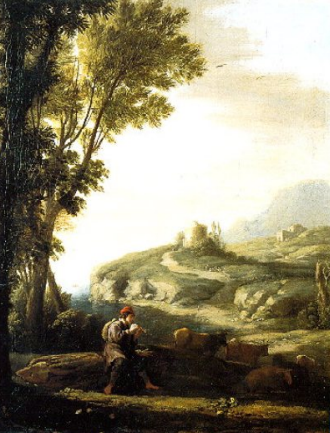
Claude Gellée, dit Le Lorrain (Chamagne, vers 1600 – Rome, 1682), Paysage au jouer de flûte , vers 1635, peinture à l'huile sur cuivre, Nancy, musée des Beaux-Arts.