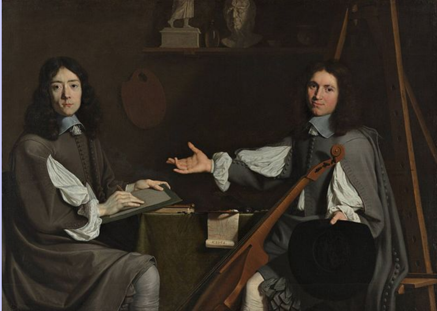
Jean-Baptiste de Champaigne (Bruxelles, 1631 – Paris, 1681), et Nicolas de Platémontagne (Paris, 1631 – Paris, 1706), Double autoportrait , 1654, peinture à l'huile sur toile, Rotterdam, musée Boymans-Van Beuningen.