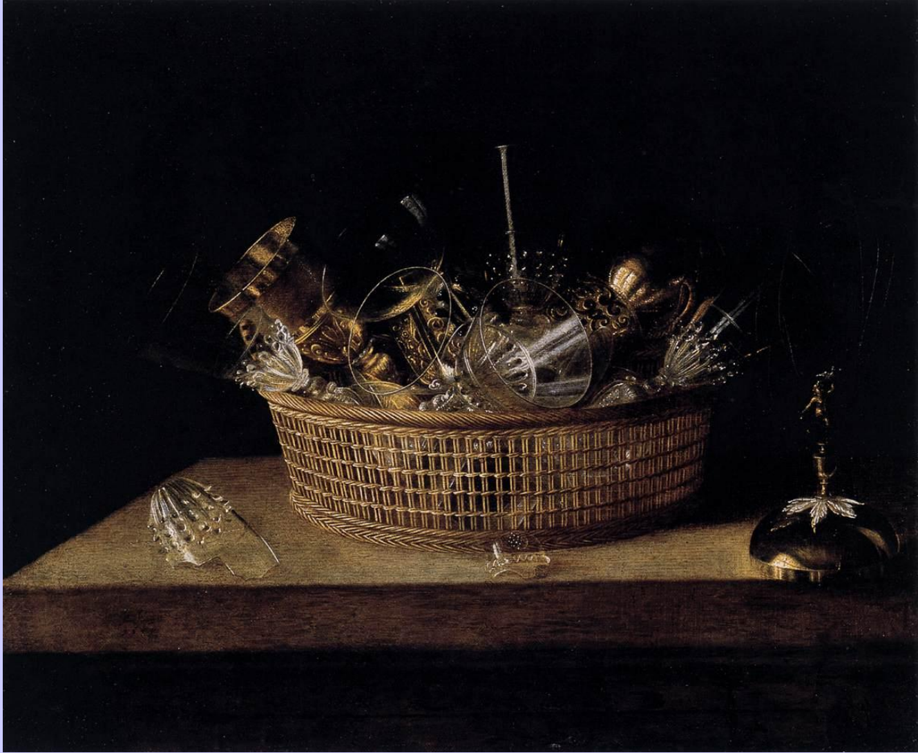
Sébastien Stoskopf (1597 – 1657), Nature morte aux verres dans un panier , 1644, peinture à l'huile sur toile, Strasbourg, musée de l'Œuvre Notre-Dame.