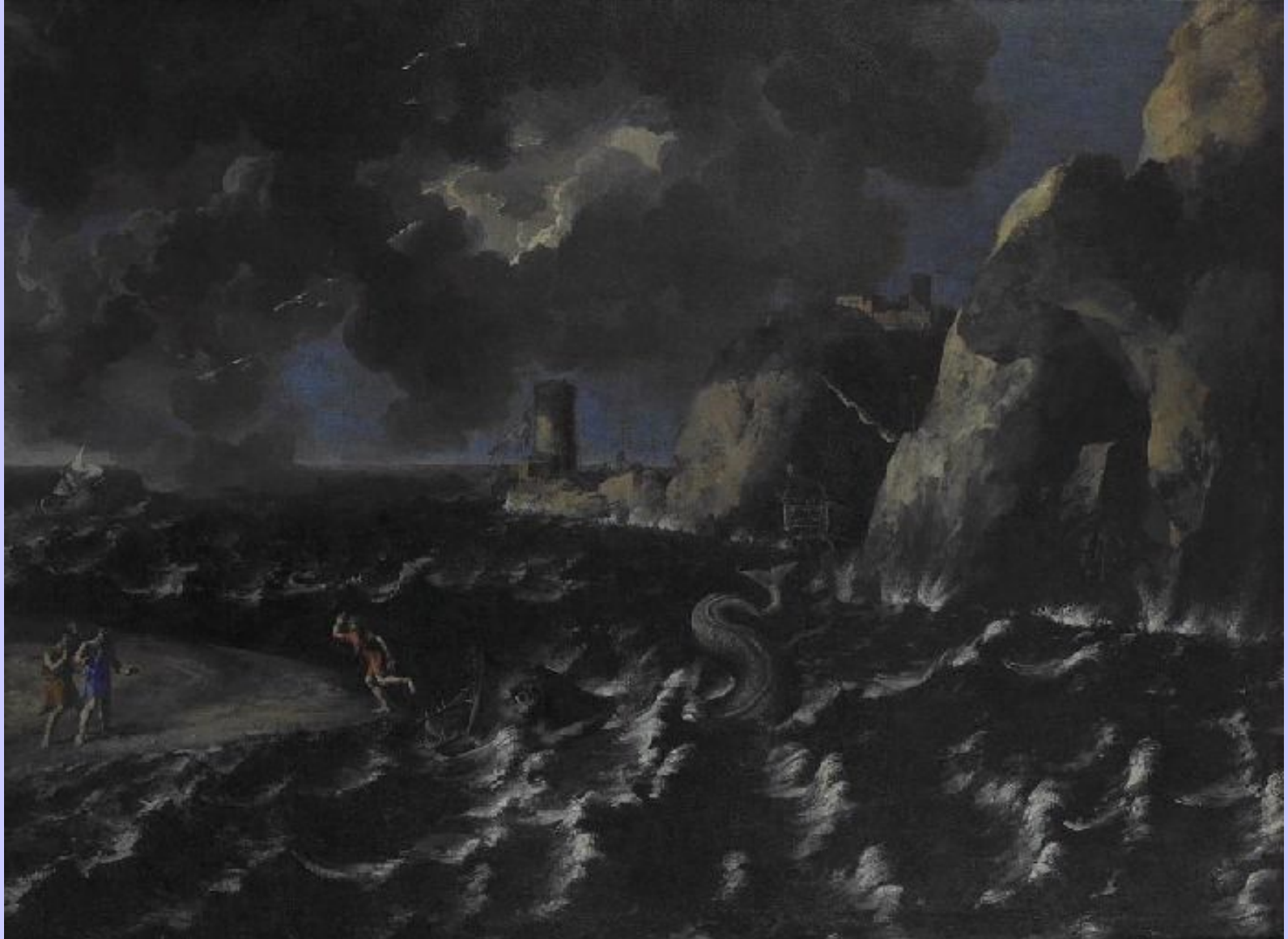
Gaspard Dughet (Rome, 1615 – Rome, 1675), Marine avec Jonas rejeté par la baleine , vers 1660/5, peinture à l'huile sur toile, Rouen, musée des Beaux-Arts.