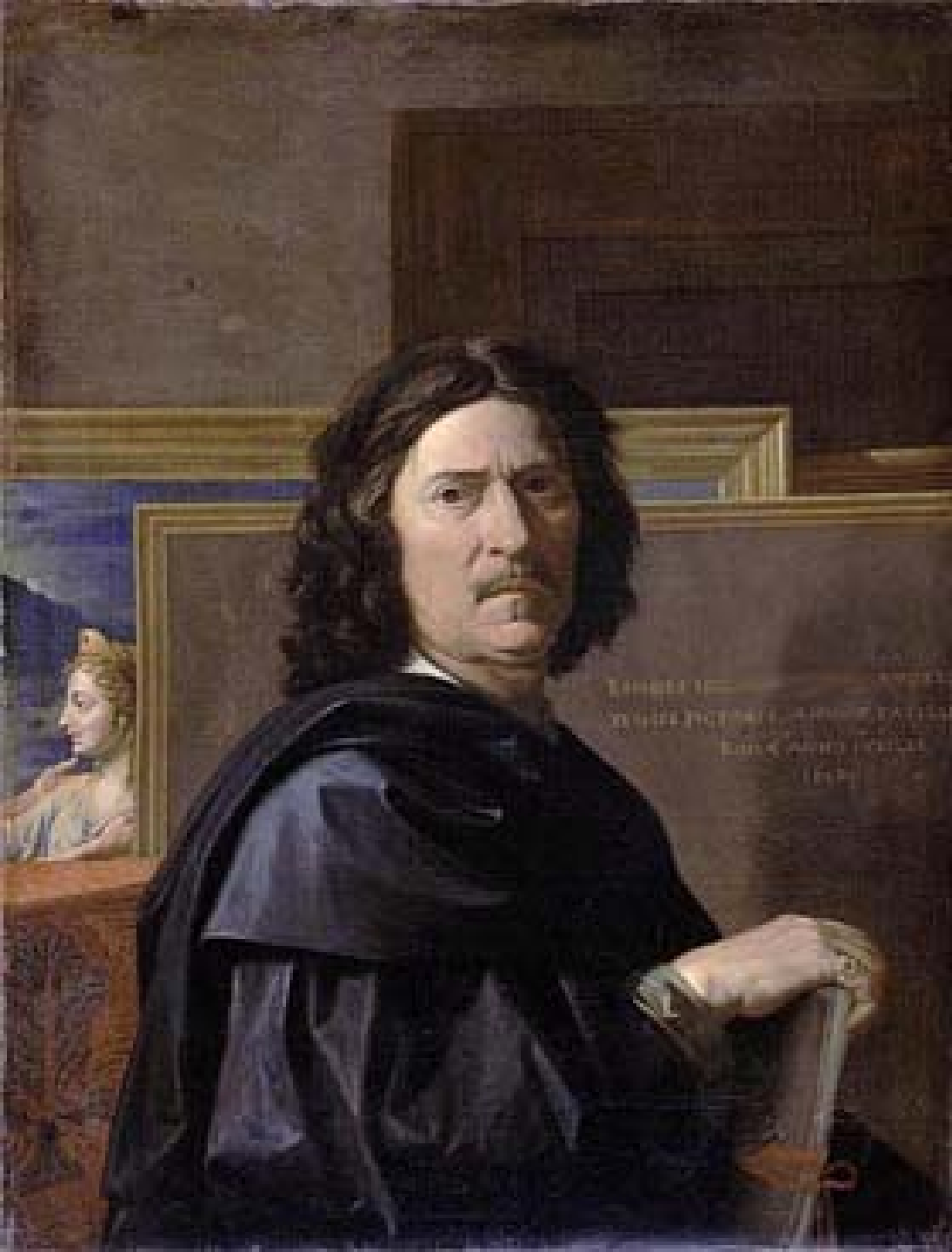
Nicolas Poussin (Les Andelys, 1594 – Rome, 1665), Autoportrait , 1650, peinture à l'huile sur toile, Paris, musée du Louvre.