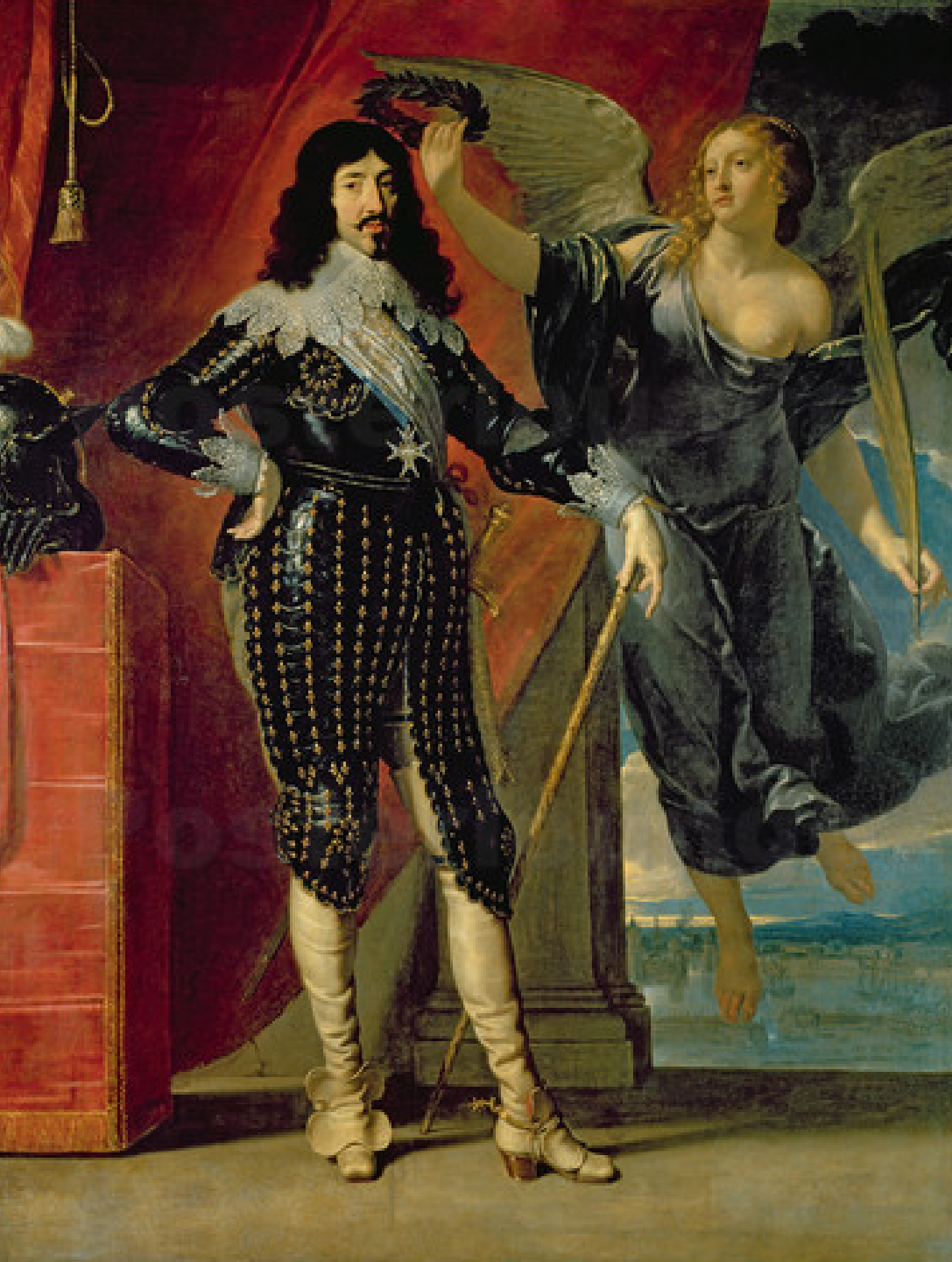
Philippe de Champaigne (Bruxelles, 1602 – Paris, 1674), Portrait de Louis XIII , 1635, peinture à l'huile sur toile, Paris, musée du Louvre.