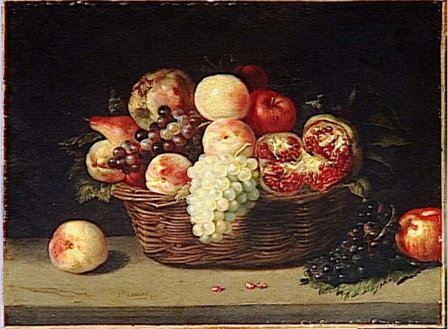
Jacques Linard (Troyes, 1597 – Paris, 1645), Nature morte au panier de fruits , vers 1644, peinture à l'huile sur toile, Paris, musée du Louvre.