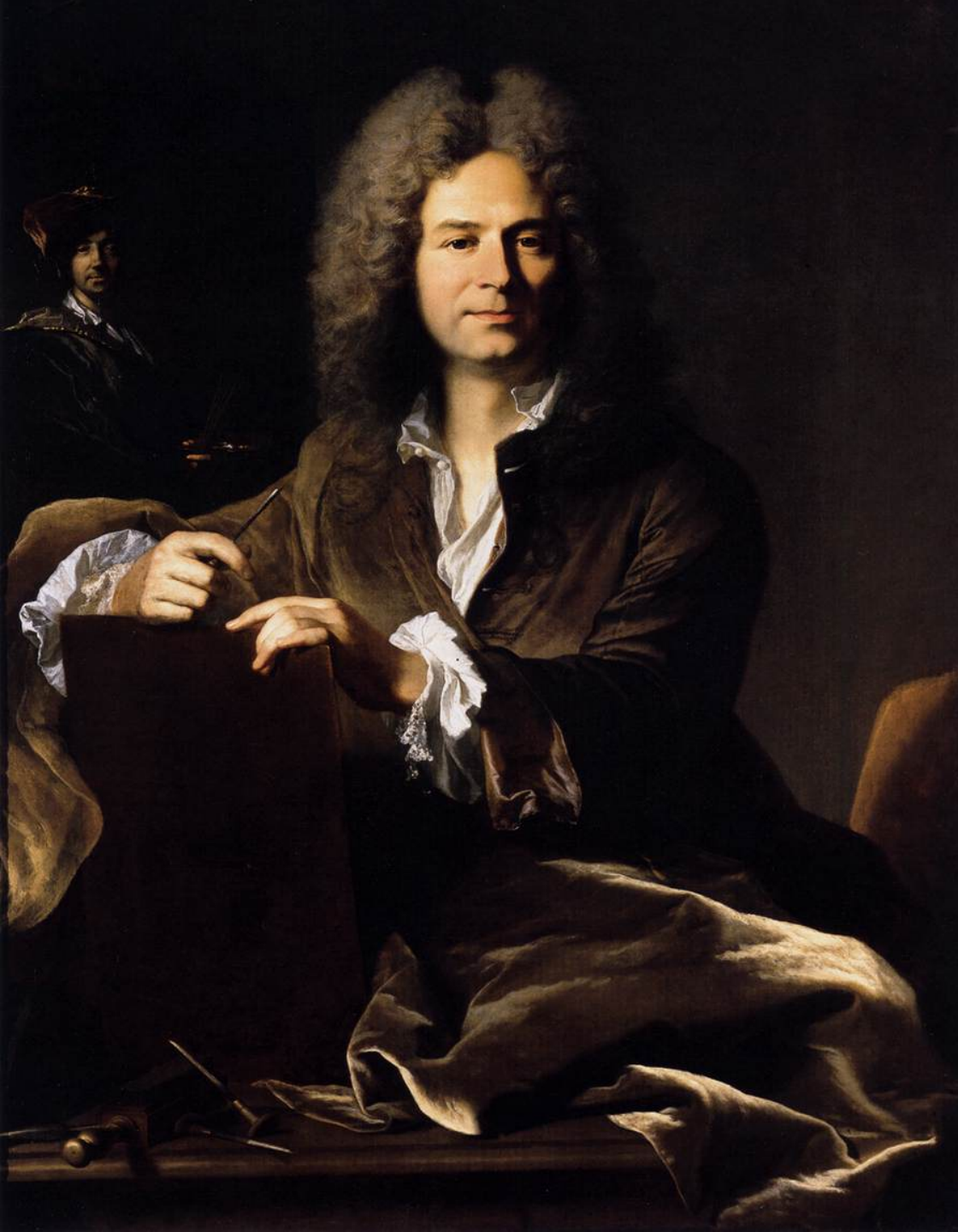
Hyacinthe Rigaud (Perpignan, 1659 – Paris, 1743), Portrait du graveur Pierre Drevet , 1700, peinture à l'huile sur toile, Lyon, musée des Beaux-Arts.