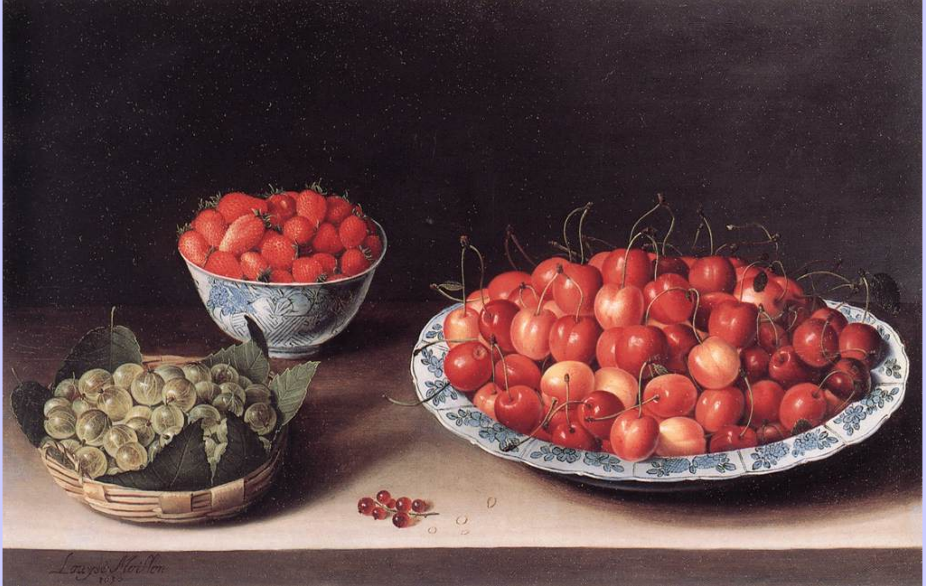
Louise Moillon (Paris, 1610 – Paris, 1696), Nature morte cerises, fraises et groseilles à maquereau , 1630, peinture à l'huile sur toile, Pasadena, The Norton Simon Museum.