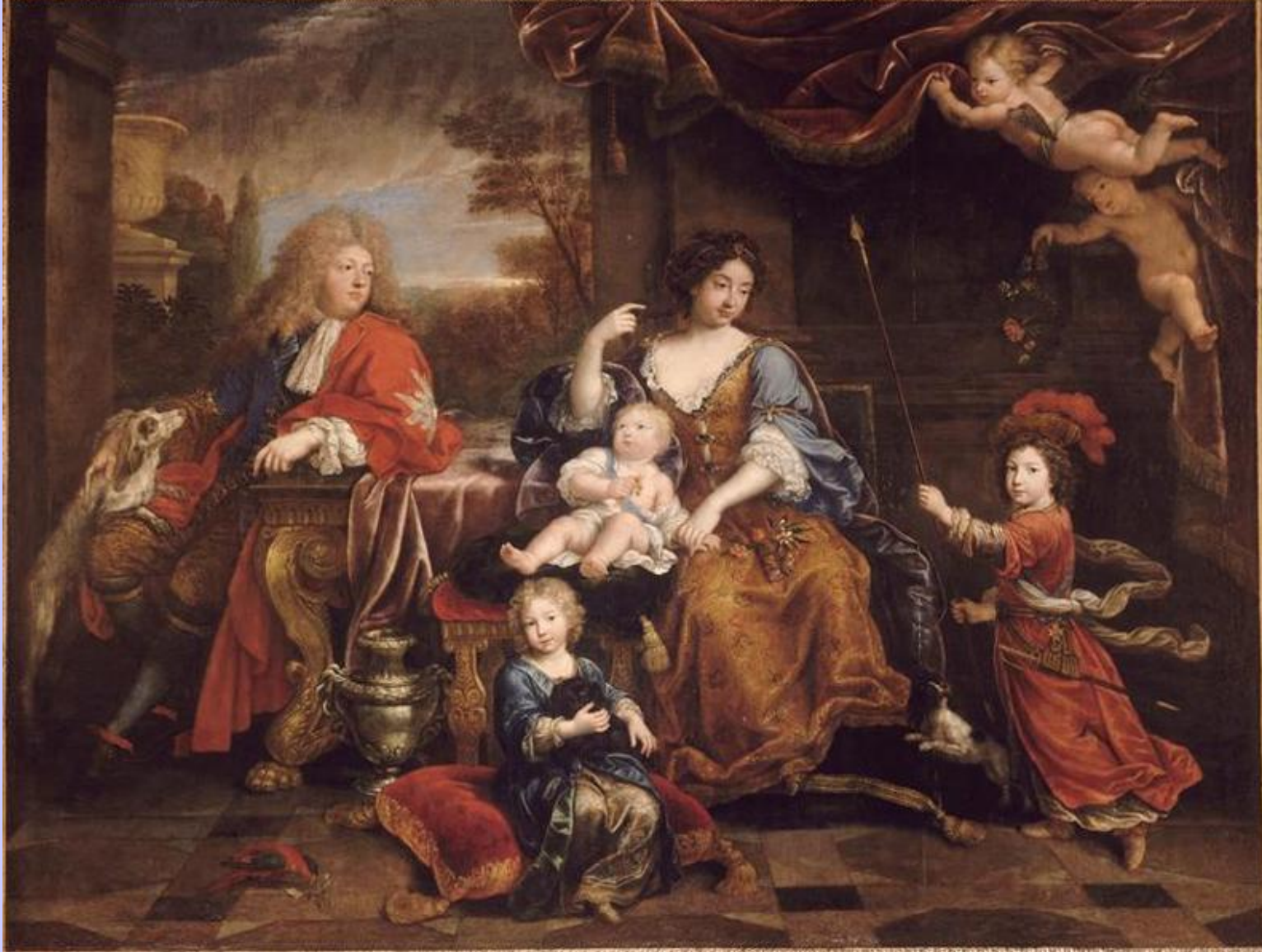
Pierre Mignard (Troyes, 1612 – Paris, 1695), Portrait du grand dauphin et de sa famille , 1687, peinture à l'huile sur toile, Versailles, musée national du château