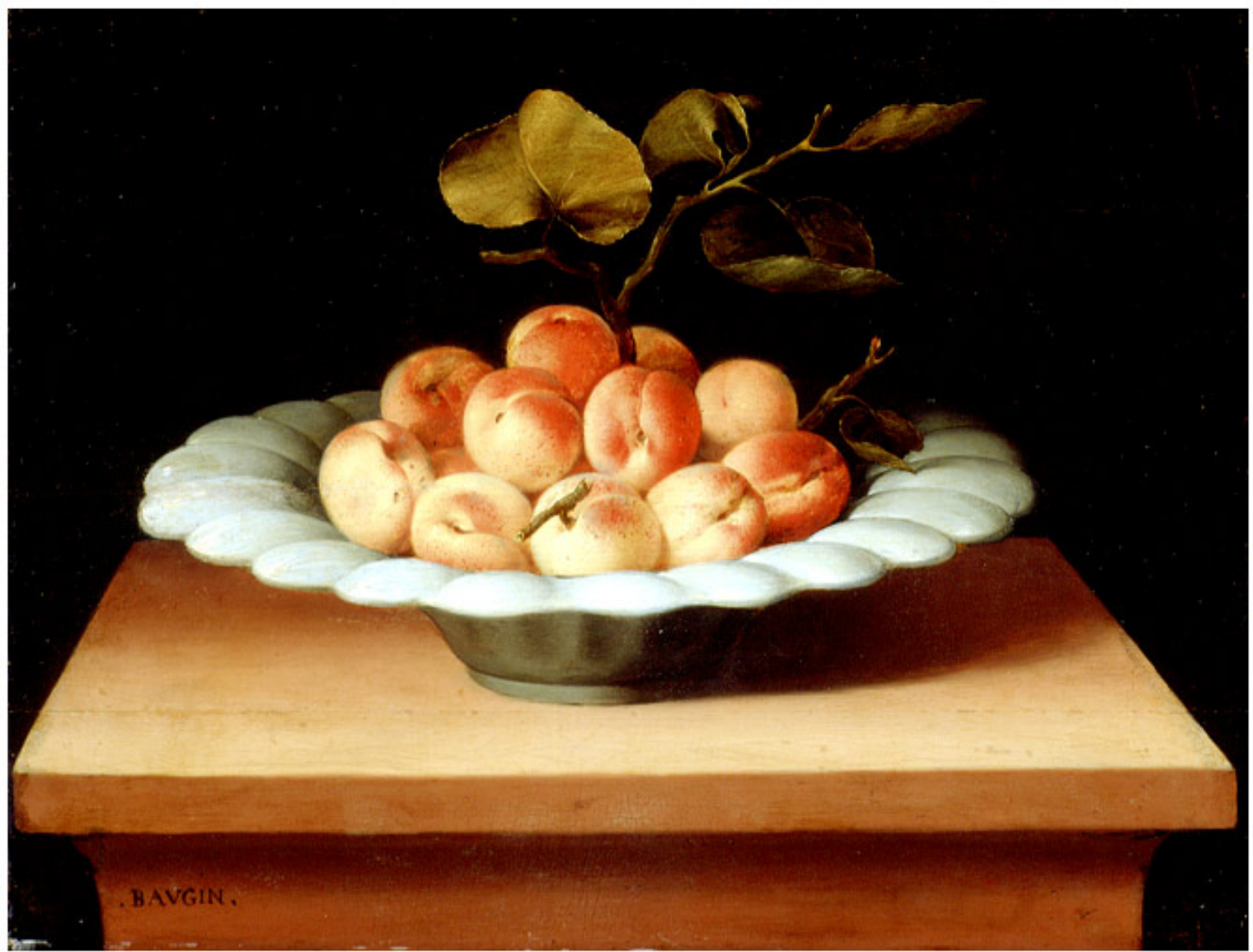
Lubin Baugin (Pithiviers, 1612 – Paris, 1663), Coupe de fruits , vers 1629, peinture à l'huile sur bois, Rennes, musée des Beaux-Arts.