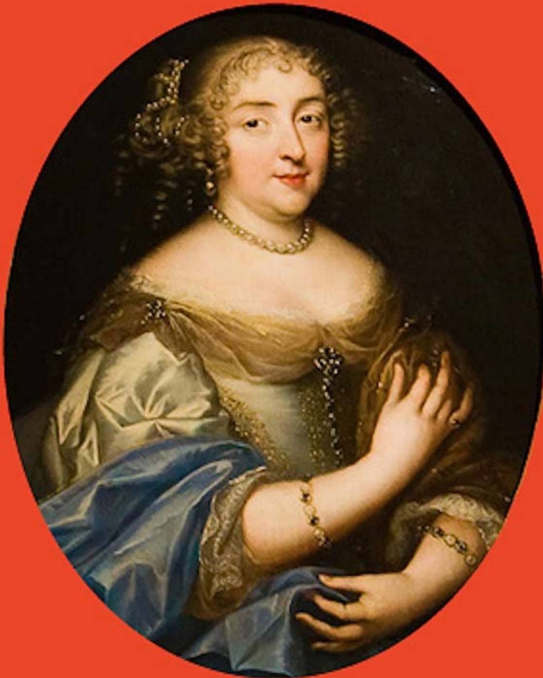
Louis-Ferdinand Elle (Paris, 1612 – Paris, 1689), Portrait présumé de Madame de Sévigné , vers 1660, peinture à l'huile sur toile, Grignan, château.